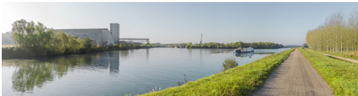
Vue d'ensemble du Technoport, rive droite, amont. L'entrée dans le port est en face et, à droite, la dérivation de Seurre.