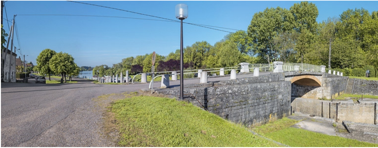
Vue d'ensemble du pont sur écluse. En arrière-plan, la halte nautique.