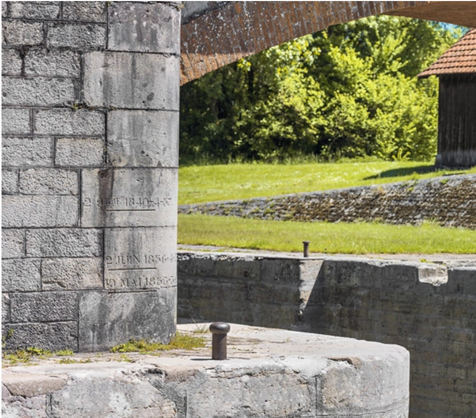
Détail de l'échelle de crue.