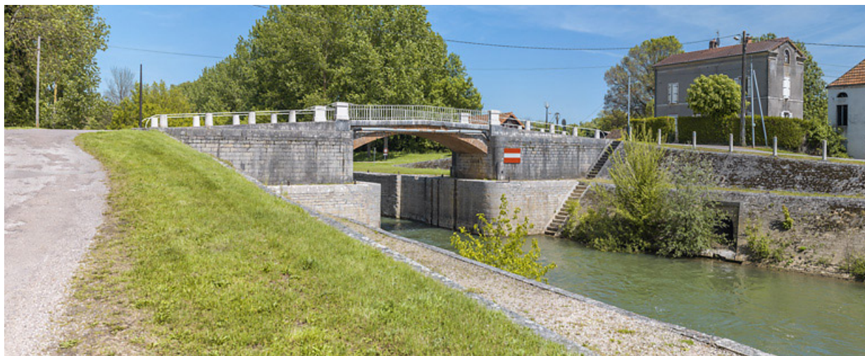
Vue d'ensemble du pont sur écluse, d'aval. A droite, la maison éclusière.