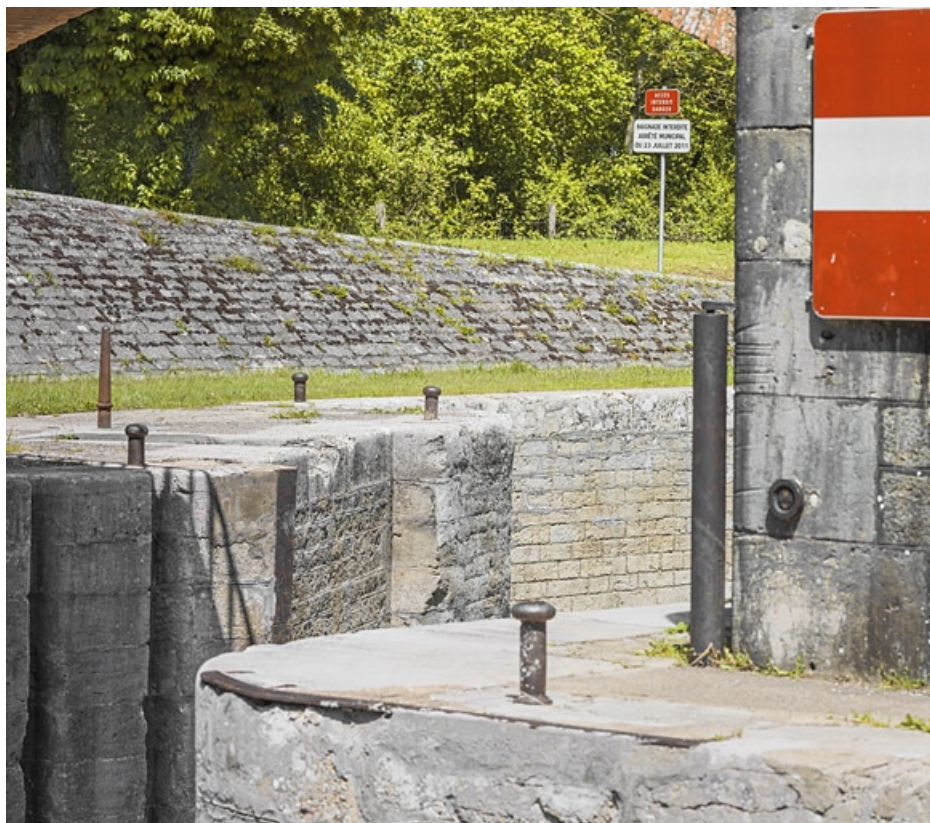
Détail des traces de halage et de la maçonnerie du sas.