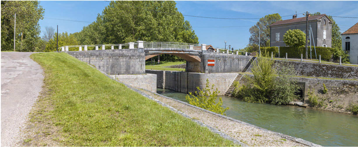
Vue d'ensemble du pont sur écluse, d'aval. A droite, la maison éclusière.