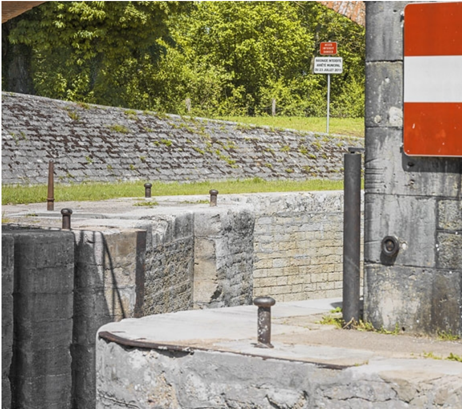
Détail des traces de halage et de la maçonnerie du sas.