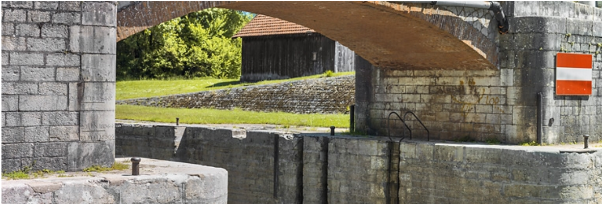
Vue du dessous et des piles : à gauche, l'échelle de crue et à droite, les traces de halage.