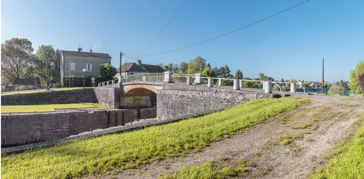
Vue d'ensemble du pont sur écluse. Au fond, la maison éclusière.