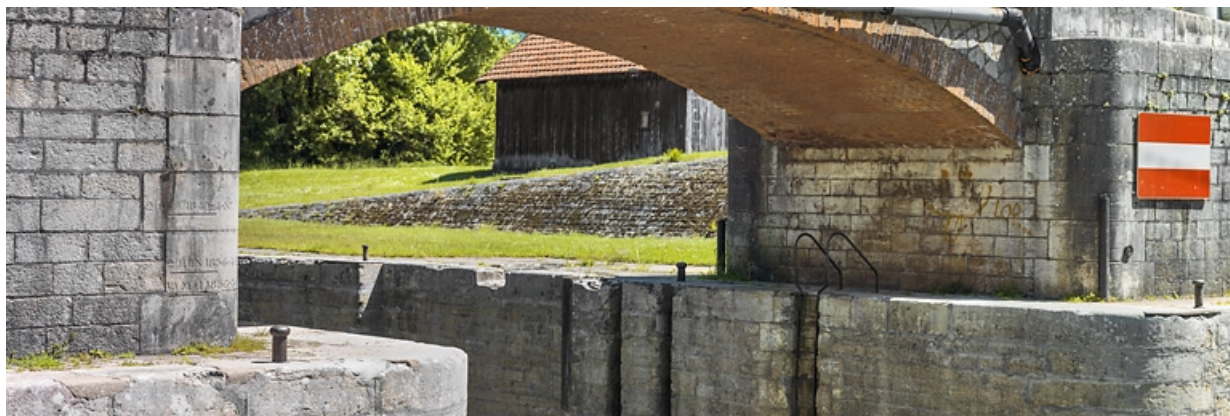
Vue du dessous et des piles : à gauche, l'échelle de crue et à droite, les traces de halage.