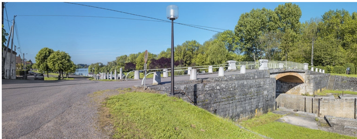
Vue d'ensemble du pont sur écluse. En arrière-plan, la halte nautique.