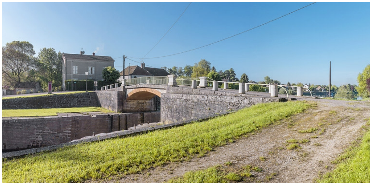
Vue d'ensemble du pont sur écluse. Au fond, la maison éclusière.