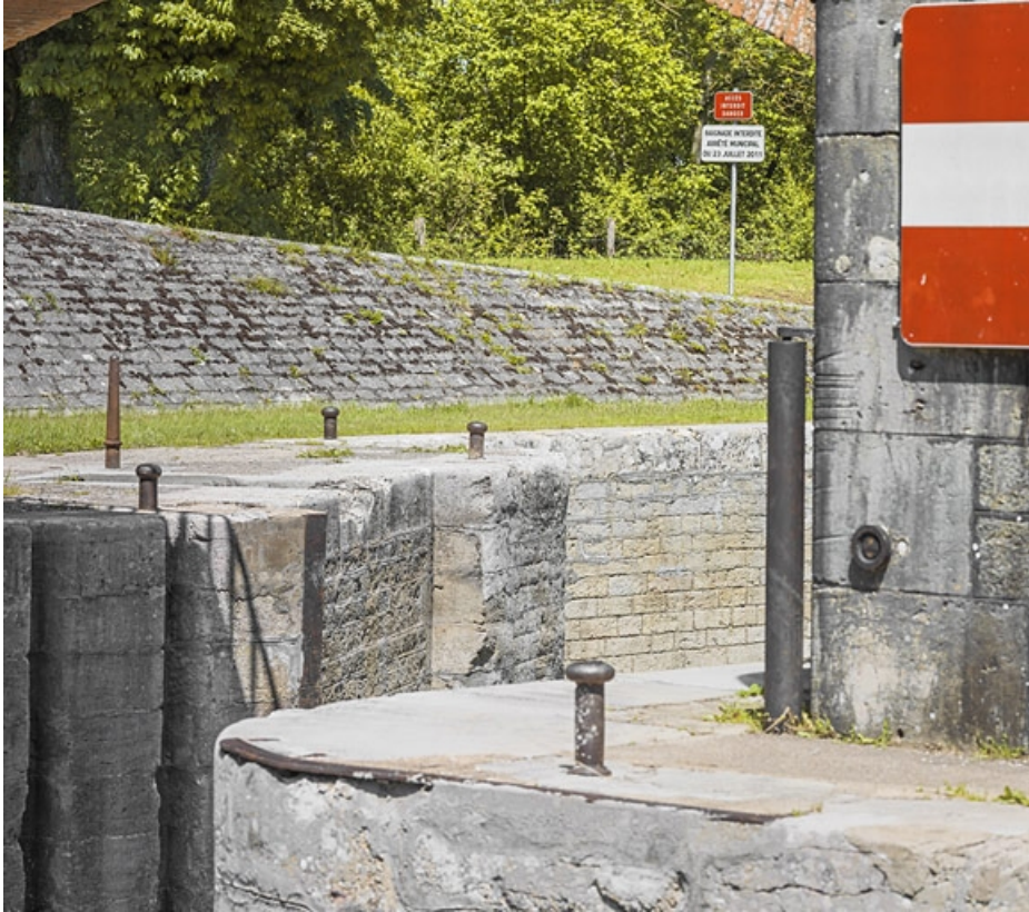
Détail des traces de halage et de la maçonnerie du sas.