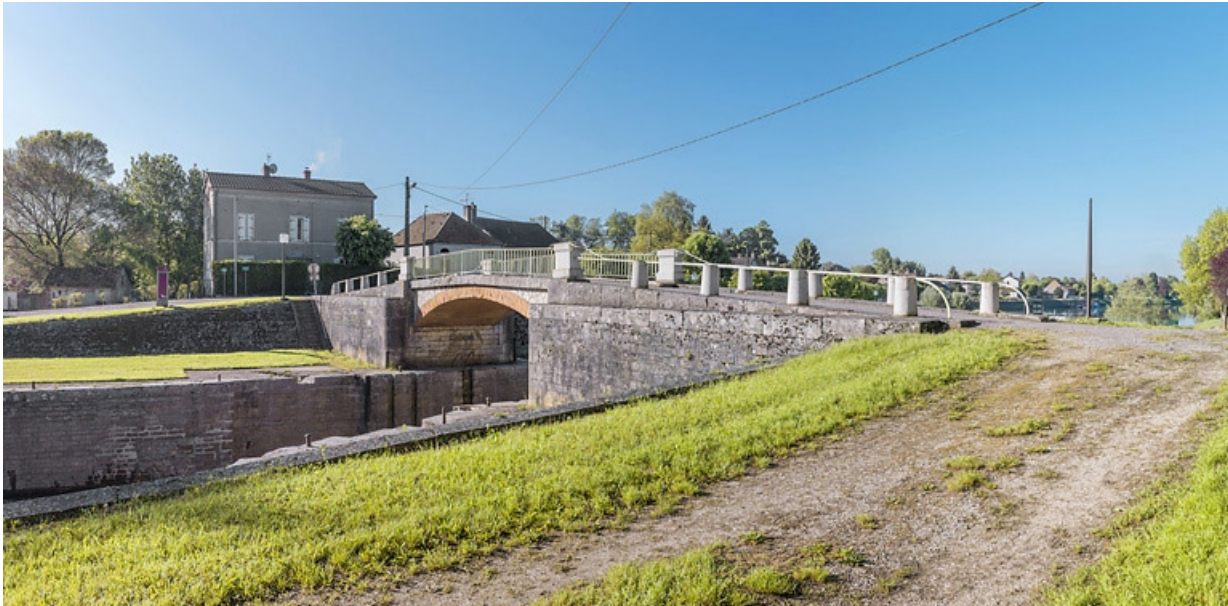
Vue d'ensemble du pont sur écluse. Au fond, la maison éclusière.