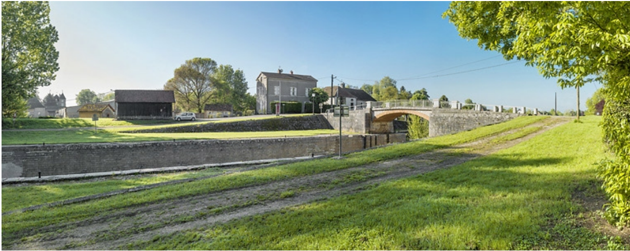
Vue d'ensemble du site. A l'extrémité gauche, on aperçoit le manoir (IA00071046). 21, Lechâtelet, lieudit : PK 199