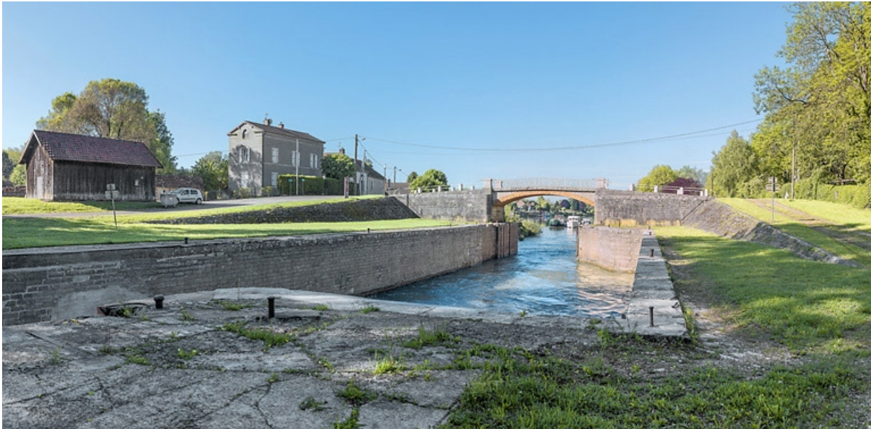
Vue d'ensemble du site : à gauche, la maison éclésièrè et au centre, le sas et le pont sur écluse.