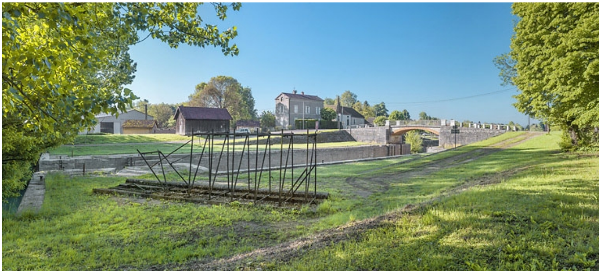
Vue d'ensemble du site. Au premier plan, vestiges des fermettes métalliques de l'ancien barrage mobile du Châtelet. 21, Lechâtelet, lieudit : PK 199