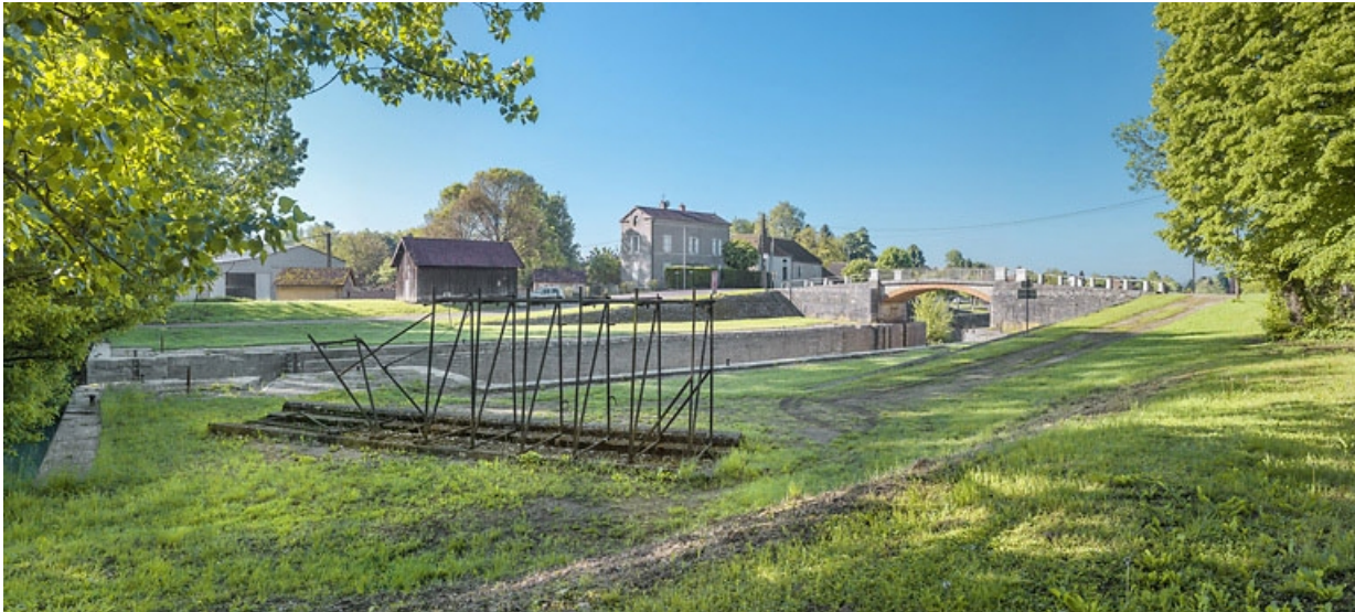
Vue d'ensemble du site. Au premier plan, vestiges des fermettes métalliques de l'ancien barrage mobile du Châtelet. 21, Lechâtelet, lieudit : PK 199