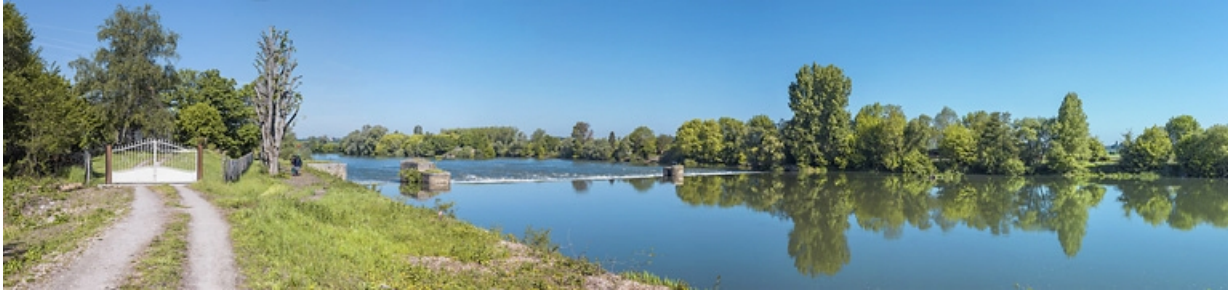
Vue d'ensemble de l'ancien barrage depuis la rive gauche. La maison du barragiste est derrière le portail, à gauche. 21, Pagny-la-Ville, lieudit : PK 200