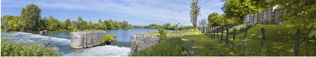
Vue d'ensemble de l'ancien barrage : au premier plan, le pertuis et à droite, la maison du barragiste.