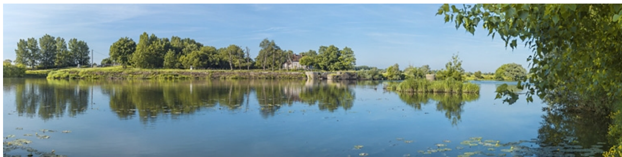
Vue d'ensemble du site de l'ancien barrage. Au fond, la maison du barragiste. 21, Pagny-la-Ville, lieudit : PK 200