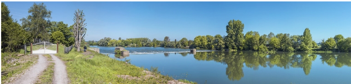
Vue d'ensemble de l'ancien barrage depuis la rive gauche. La maison du barragiste est derrière le portail, à gauche. 21, Pagny-la-Ville, lieudit : PK 200