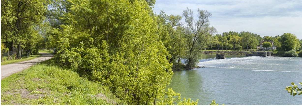
Vue d'ensemble de l'ancien barrage depuis la rive droite. A droite, la maison du barragiste. 21, Pagny-la-Ville, lieudit : PK 200