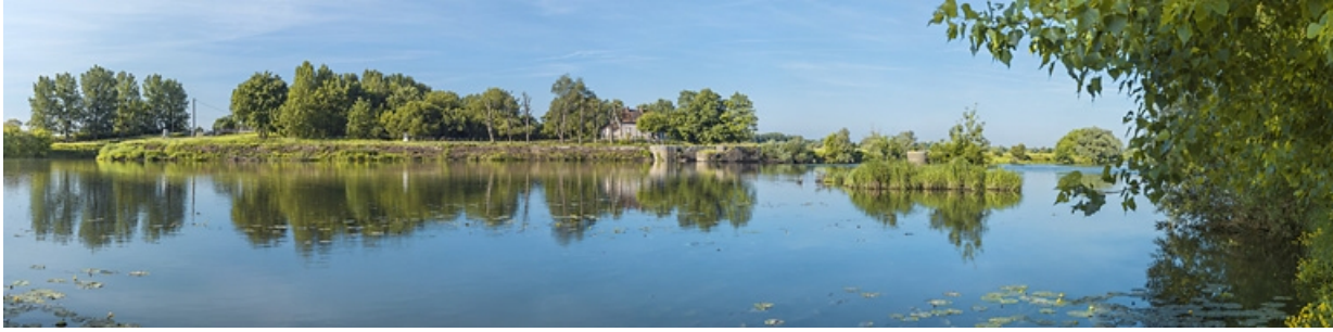
Vue d'ensemble du site de l'ancien barrage. Au fond, la maison du barragiste. 21, Pagny-la-Ville, lieudit : PK 200