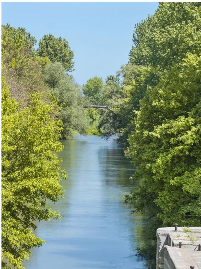
La dérivation, vue depuis le site d'écluse.