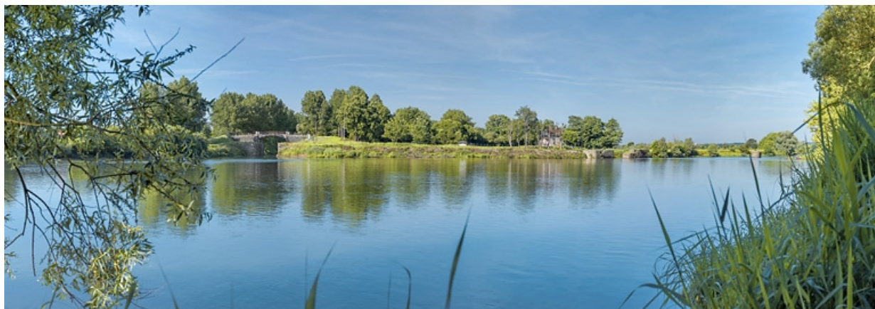
Vue d'ensemble de l'entrée de la dérivation, à hauteur du barrage. A gauche, la porte de garde et le pont l'enjambant. 21, Pagny-la-Ville, lieudit : PK 199