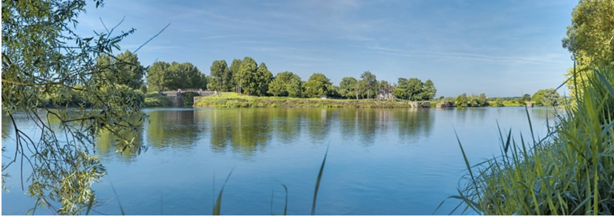
Vue d'ensemble de l'entrée de la dérivation, à hauteur du barrage. A gauche, la porte de garde et le pont l'enjambant. 21, Pagny-la-Ville, lieudit : PK 199