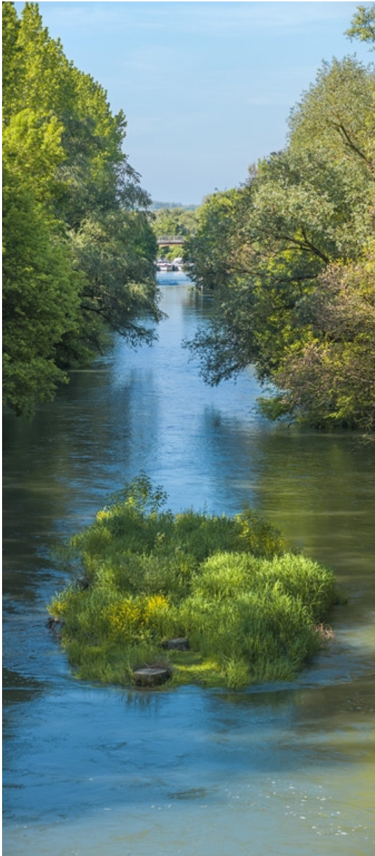
La dérivation, vue depuis la porte de garde. Au fond, on aperçoit la halte nautique de Lechâtelet. 21, Pagny-la-Ville, lieudit : PK 199