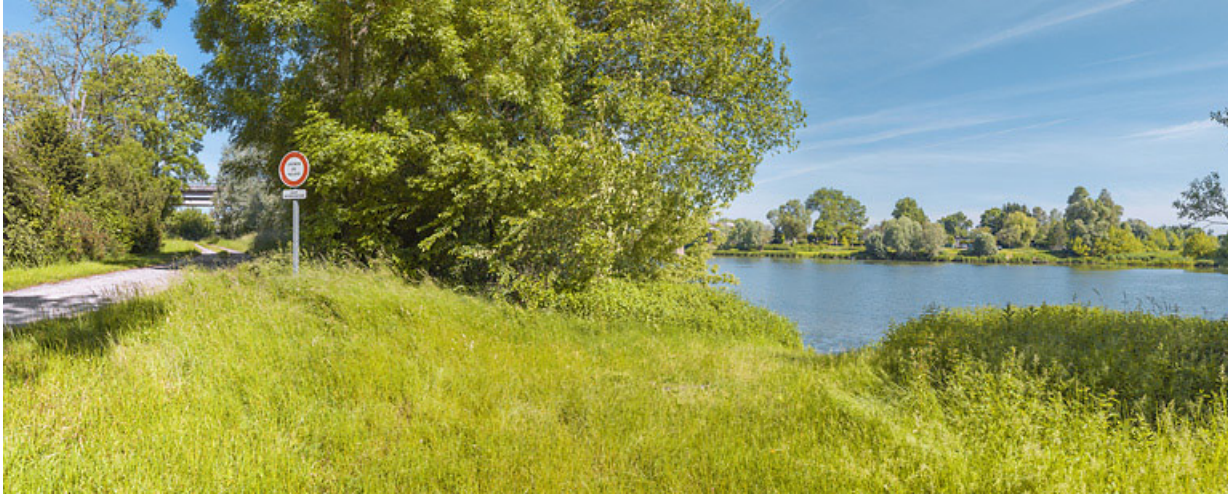
Vue du site depuis la rive gauche. A gauche, le pont.

21, Bonnencontre, lieudit : PK 201,5 le Port de Charrey