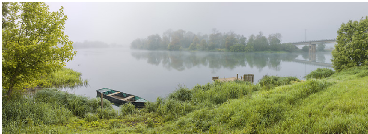
Rive droite : l'ancien bac et port de Charrey. A droite, le pont. Paysage de brume.

21, Bonnencontre, lieudit : PK 201,5 le Port de Charrey