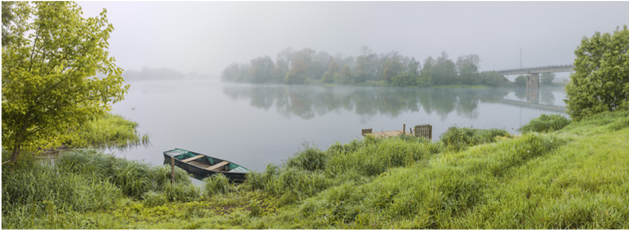
Rive droite : l'ancien bac et port de Charrey. A droite, le pont. Paysage de brume.

21, Bonnencontre, lieudit : PK 201,5 le Port de Charrey