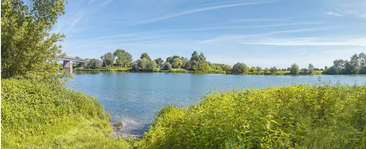
Vue du site depuis la rive gauche. A gauche, le pont.

21, Bonnencontre, lieudit : PK 201,5 le Port de Charrey