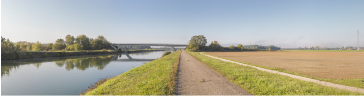
Vue d'ensemble de la dérivation au niveau du pont d'accès au Technoport. 21, Seurre