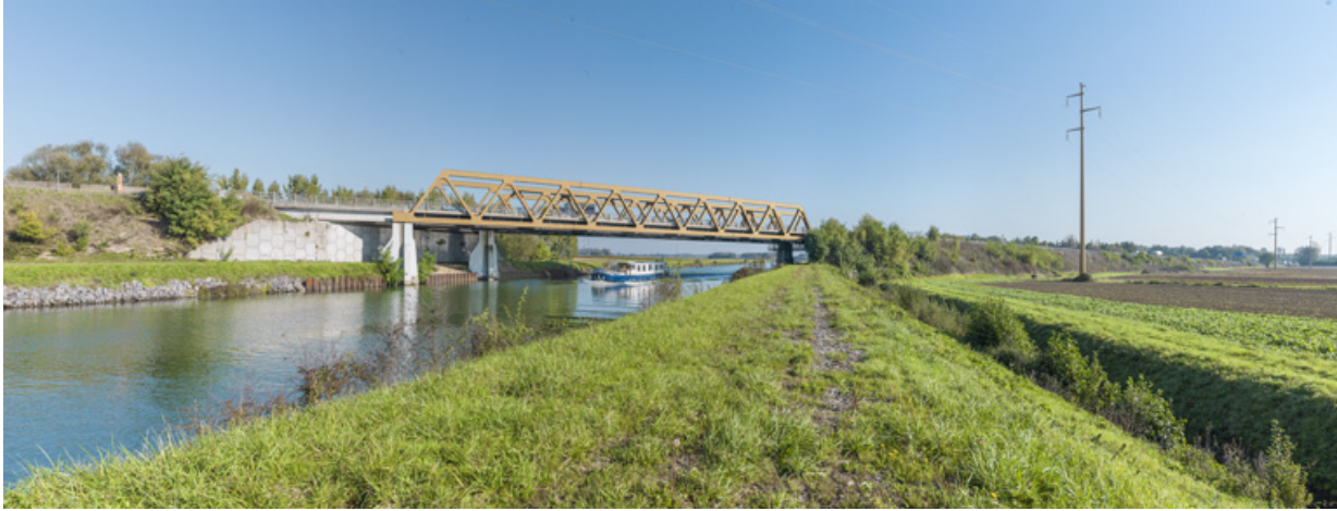
La Saône et le pont autoroutier de l'A36 franchissant la dérivation de Pagny-Seurre à Labruyère. 21, Seurre