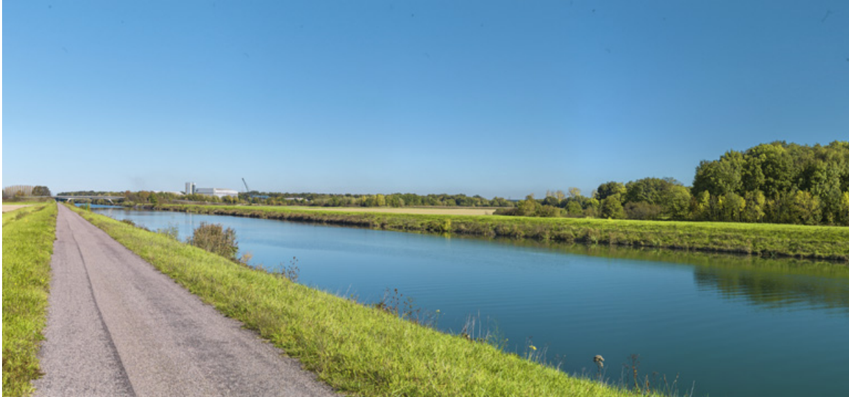
Vue d'ensemble de la dérivation au niveau du Technoport.