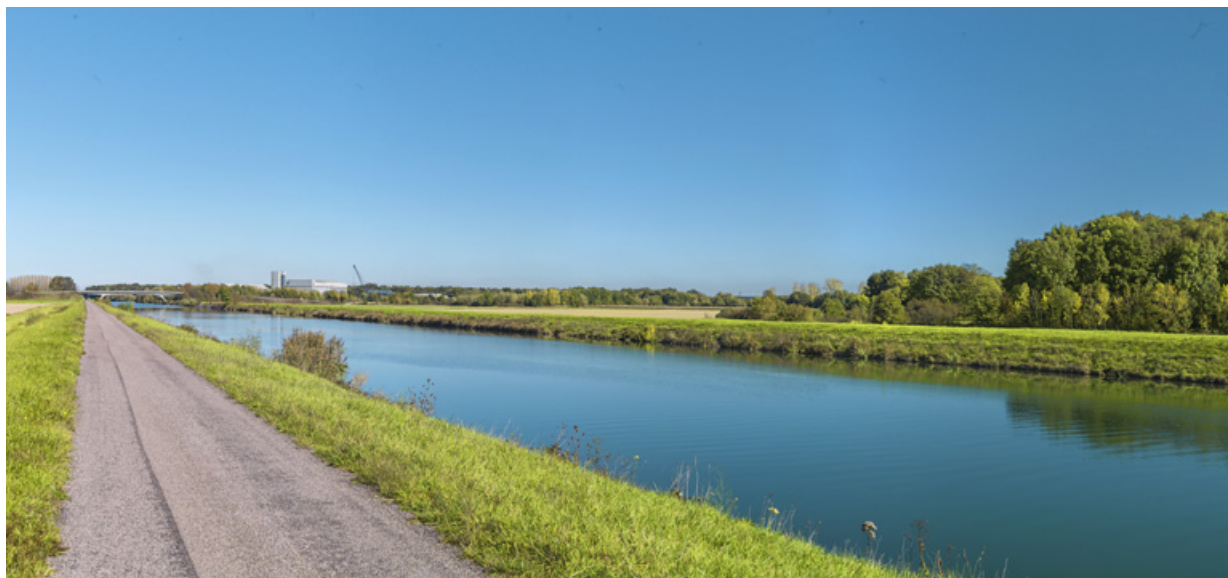
Vue d'ensemble de la dérivation au niveau du Technoport.