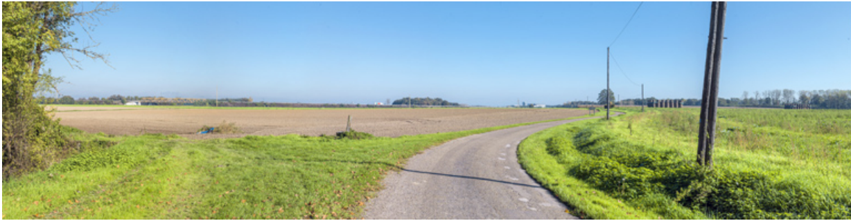
Vue d'ensemble de la dérivation depuis Chamblanc.