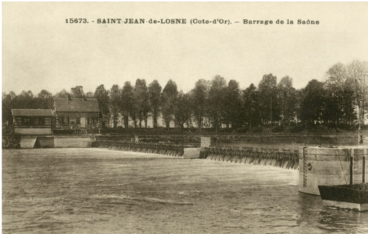
L'ancien barrage de Saint-Jean-de-Losne, aujourd'hui détruit. Il ne reste plus que le pertuis à droite. 21, Losne, lieudit : Chaugéy