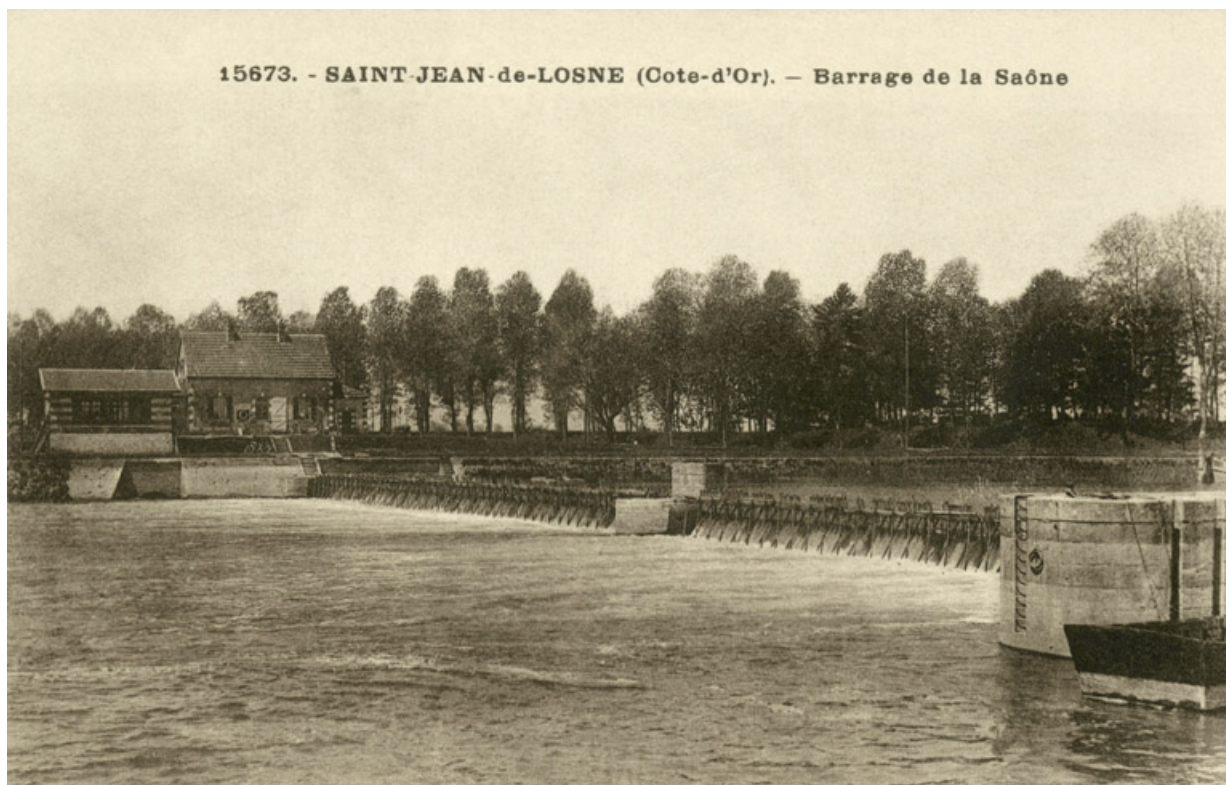
L'ancien barrage de Saint-Jean-de-Losne, aujourd'hui détruit. Il ne reste plus que le pertuis à droite.