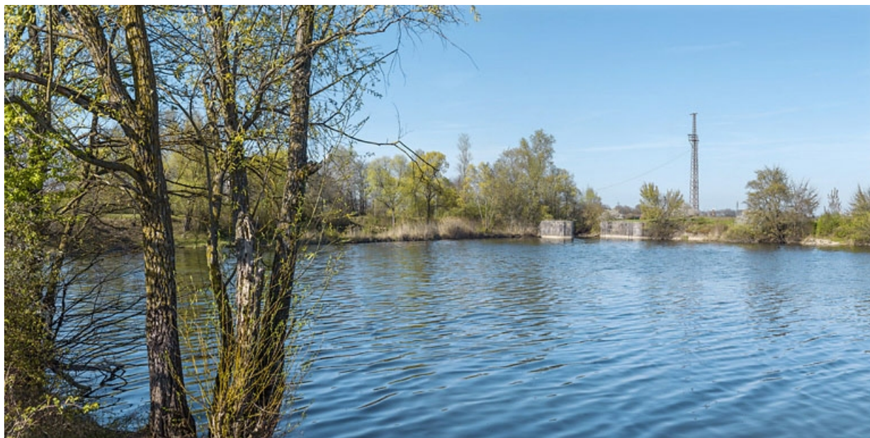
Les vestiges de l'ancien barrage de Saint-Jean-de-Losne au niveau de la digue. 21, Losne, lieudit : Chaugey