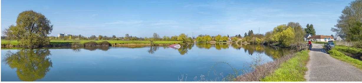
Le port de Chaugey, sur la rive gauche. En arrière-plan on voit les silos de Saint-Usage. A droite, le pont sur l'Ausson. 21, Losne, lieudit : Chaugey