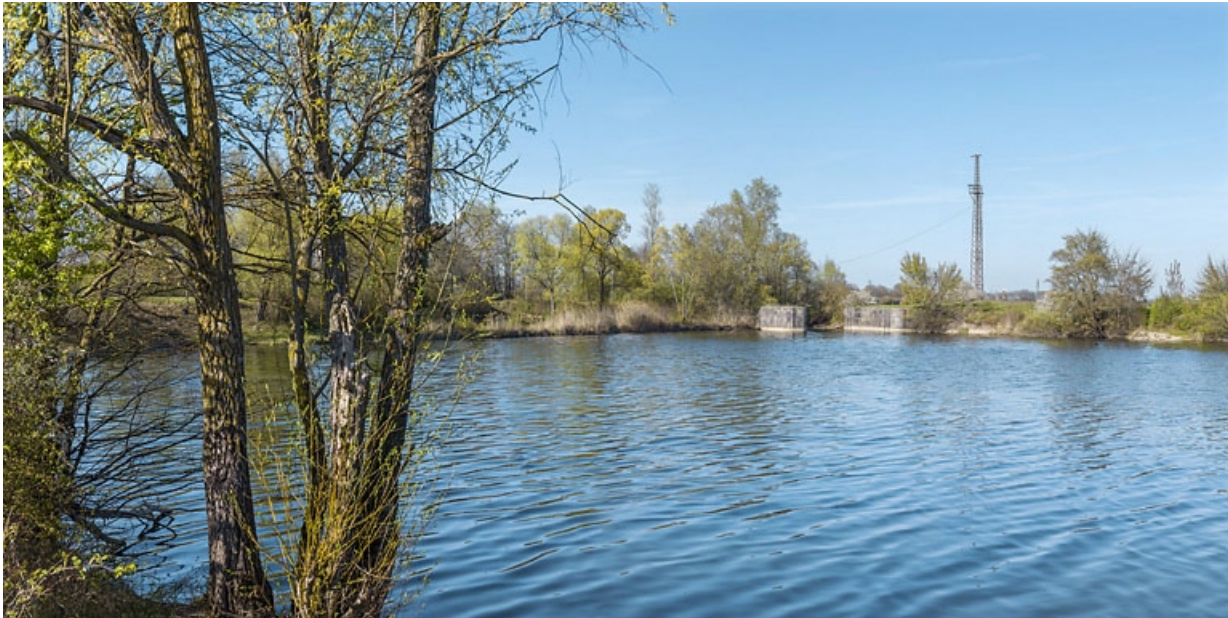
Les vestiges de l'ancien barrage de Saint-Jean-de-Losne au niveau de la digue. 21, Losne, lieudit : Chaugey