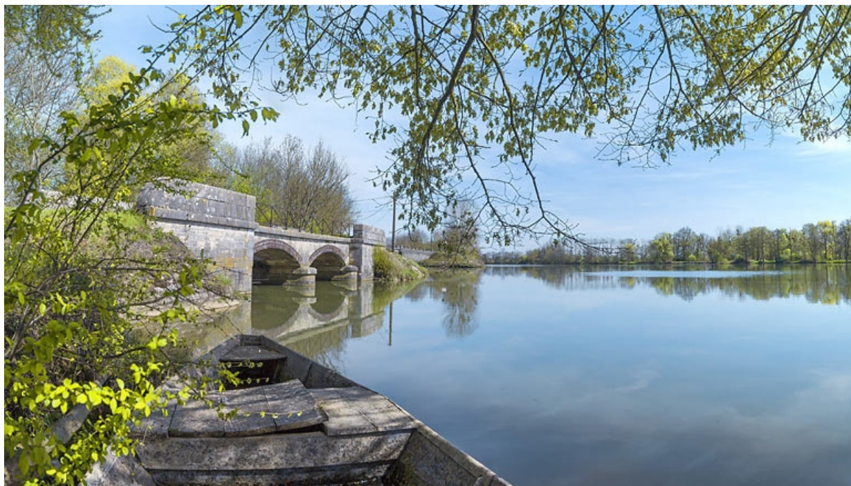
Vue d'ensemble, rive droite de la Saône.