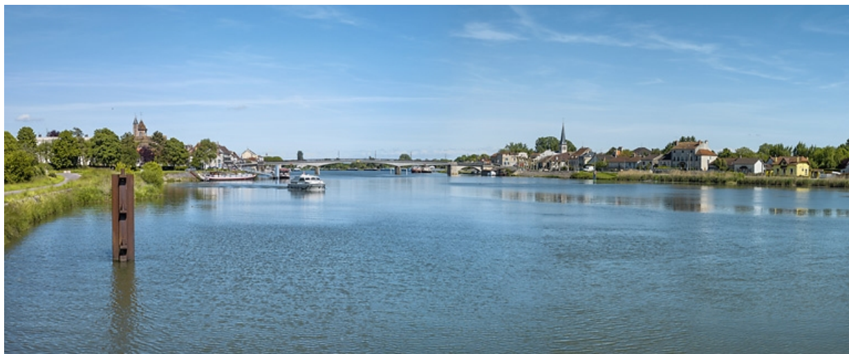
Vue d'ensemble de Losne, sur la rive gauche de la Saône.