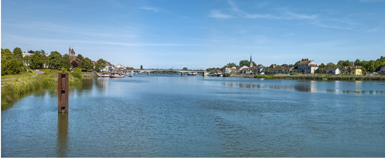
Vue d'ensemble de Losne, sur la rive gauche de la Saône.