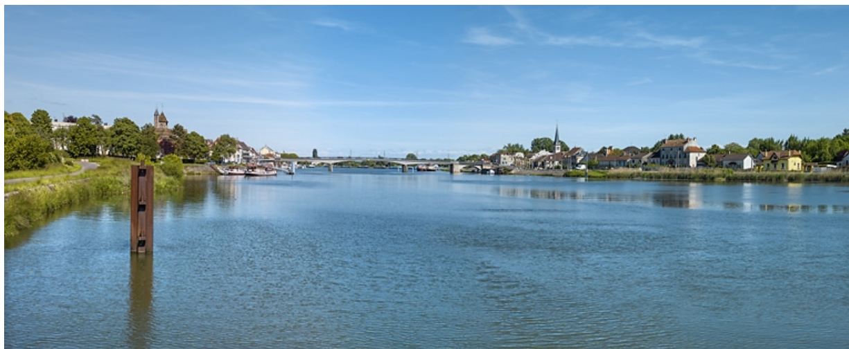
Vue d'ensemble de Losne, sur la rive gauche de la Saône.