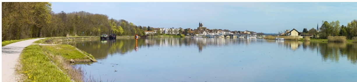
Vue d'ensemble de Saint-Jean-de-Losne, sur la rive droite de la Saône.