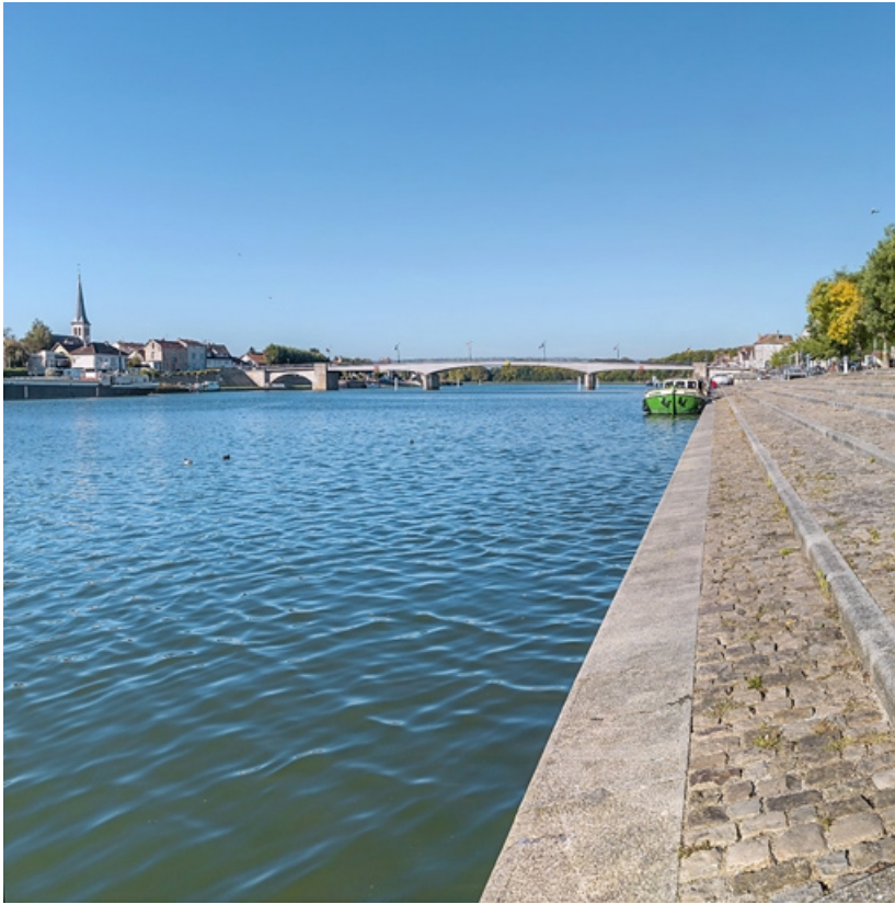
La Saône depuis les quais à gradins de Saint-Jean-de-Losne.