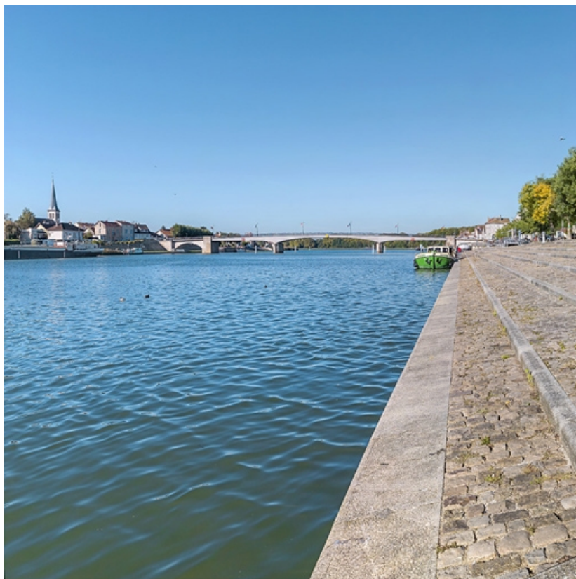
La Saône depuis les quais à gradins de Saint-Jean-de-Losne.