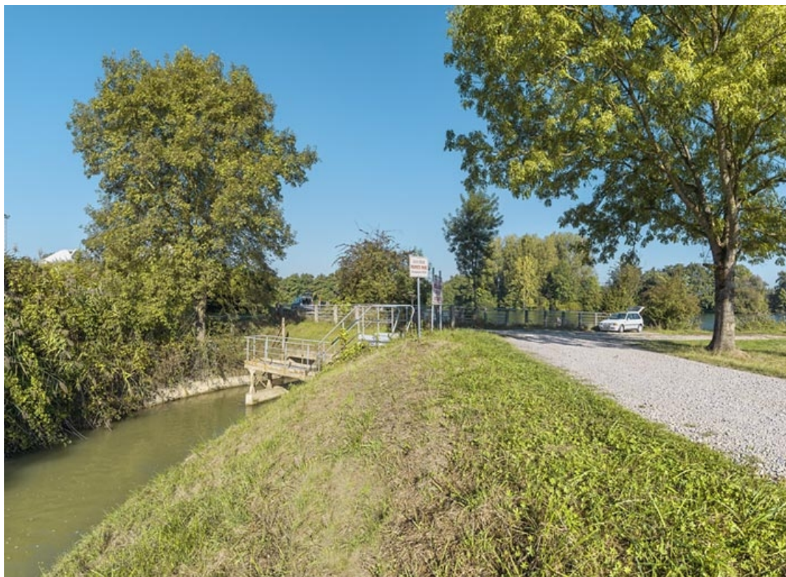
En amont du site d'écluse 75 du canal du Rhône au Rhin, débouché dans la Saône du cours d'eau provenant de l'étang de l'Aillon et longeant la rive droite du canal.

21, Saint-Symphorien-sur-Saône, lieudit : PK 219