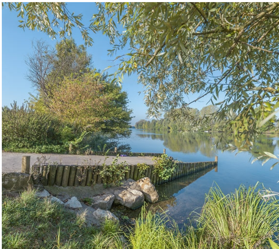
Vue depuis la rampe de mise à l'eau, légèrement en amont du pont.

21, Les Maillys route départementale 31, lieudit : PK 223,6