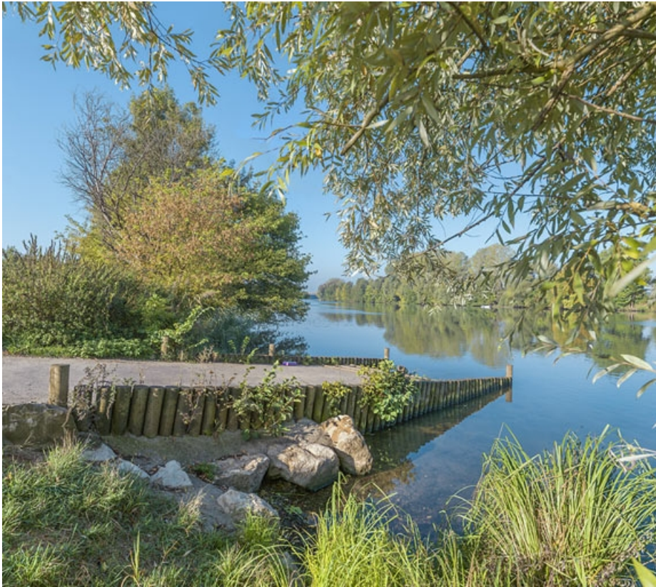
Vue depuis la rampe de mise à l'eau, légèrement en amont du pont.

21, Les Maillys route départementale 31, lieudit : PK 223,6