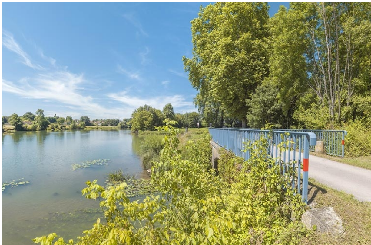
Vue d'ensemble du pont biais. A gauche, la Saône.