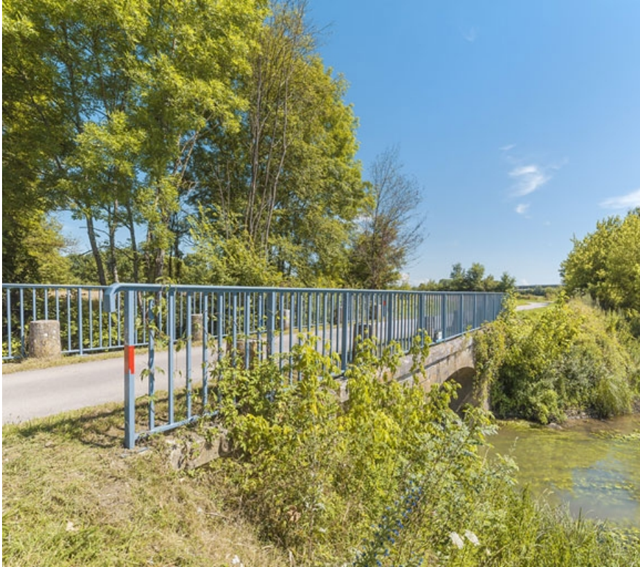
Vue d'ensemble du pont biais. A droite, la Saône.