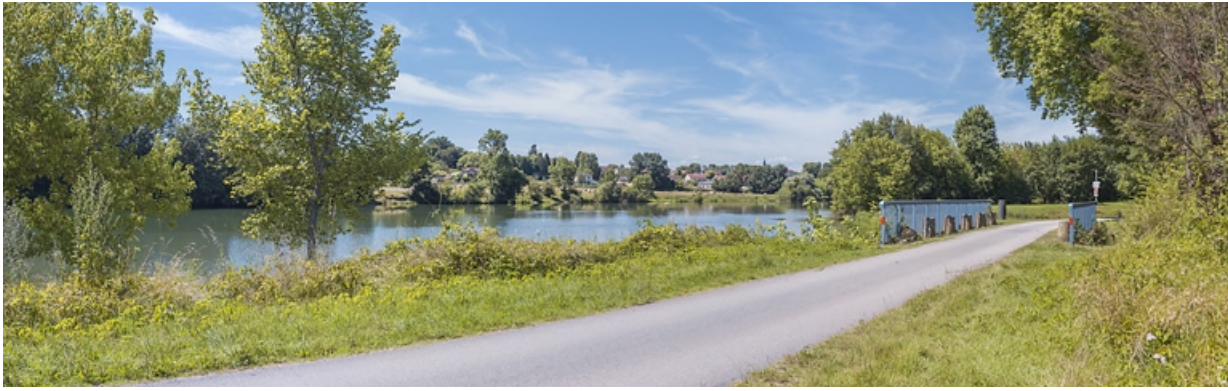
Vue d'ensemble du pont biais. A gauche, la Saône.