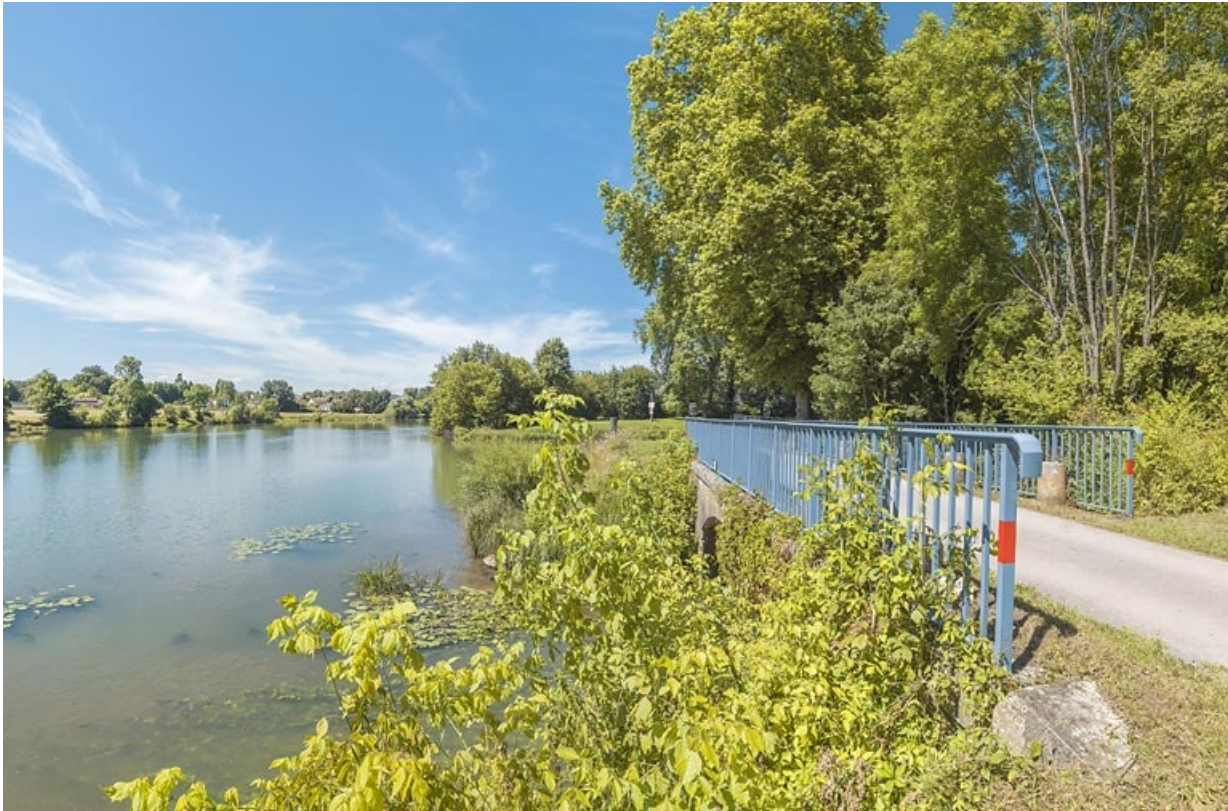
Vue d'ensemble du pont biais. A gauche, la Saône.