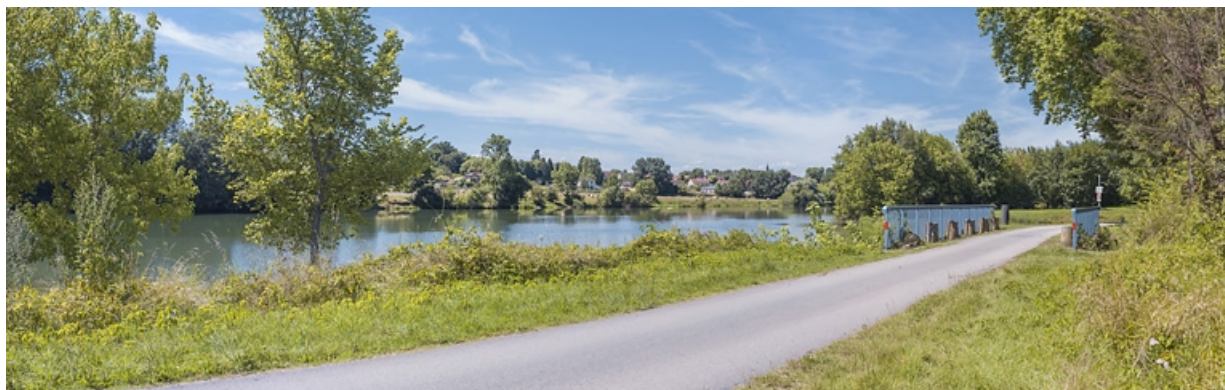
Vue d'ensemble du pont biais. A gauche, la Saône.