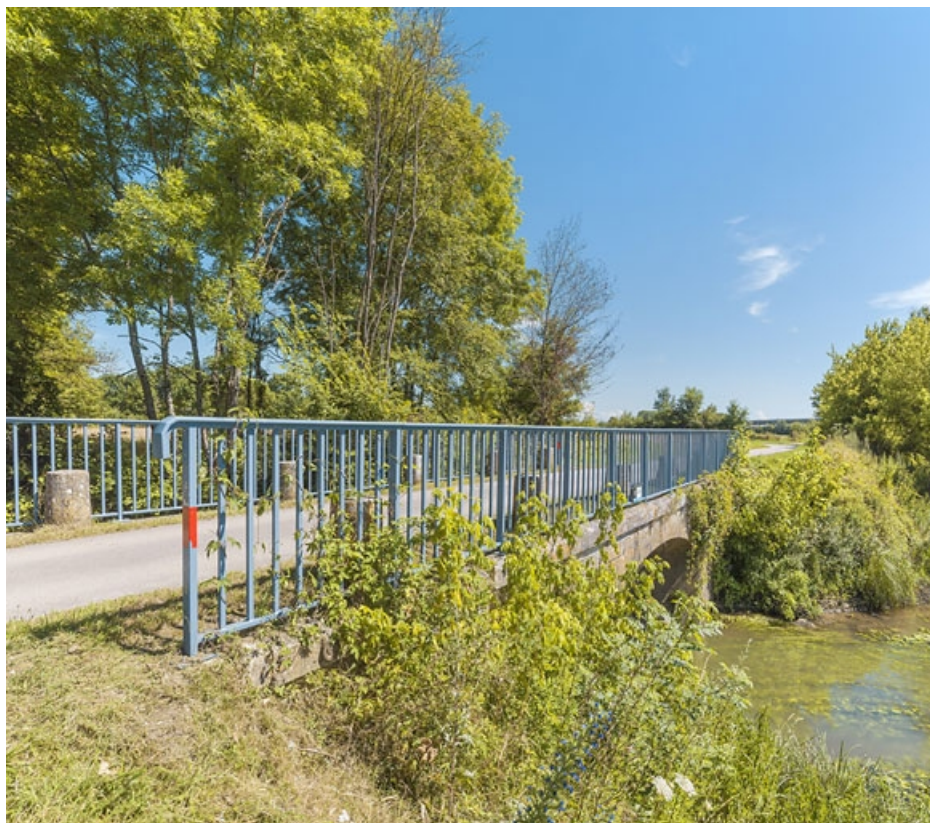
Vue d'ensemble du pont biais. A droite, la Saône.