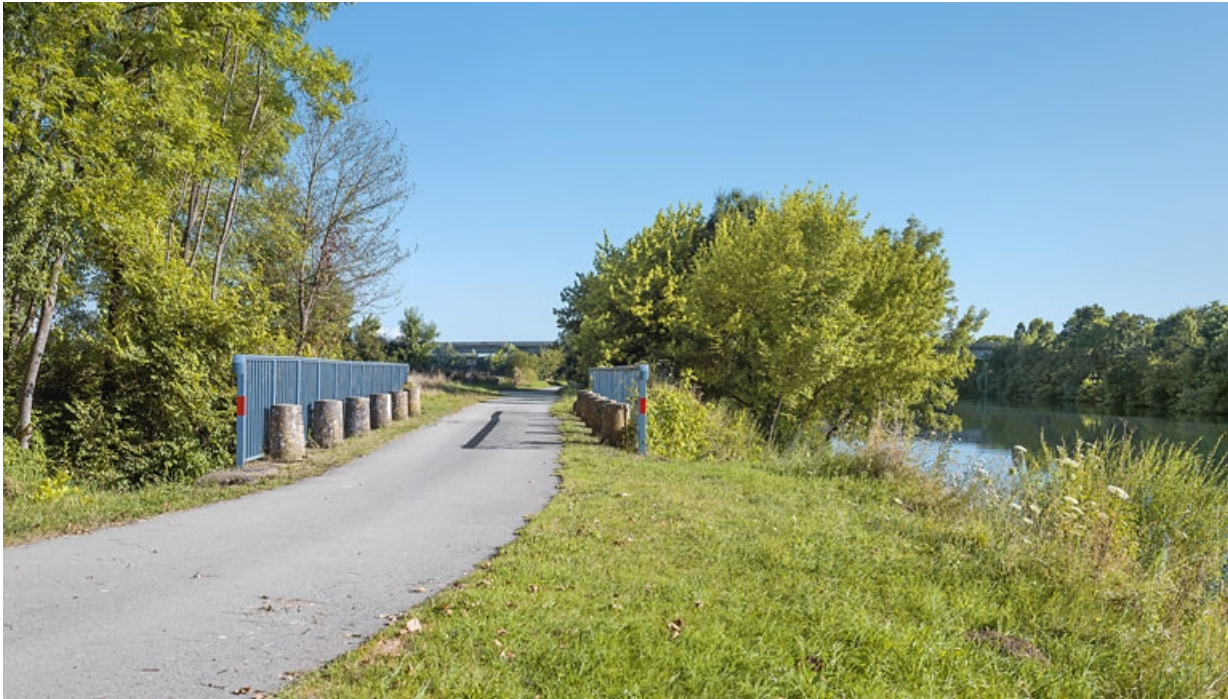
Vue du dessus. En arrière plan, le viaduc autoroutier.