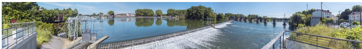
La ville vue depuis la rive droite de la Saône, au belvédère du barrage. 21, Auxonne