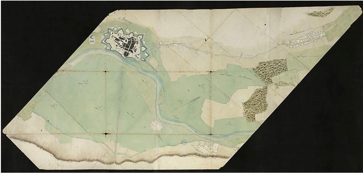
Plan n° 8 du cours de la rivière sur les territoires d'Auxonne et de Labergement. 1785.