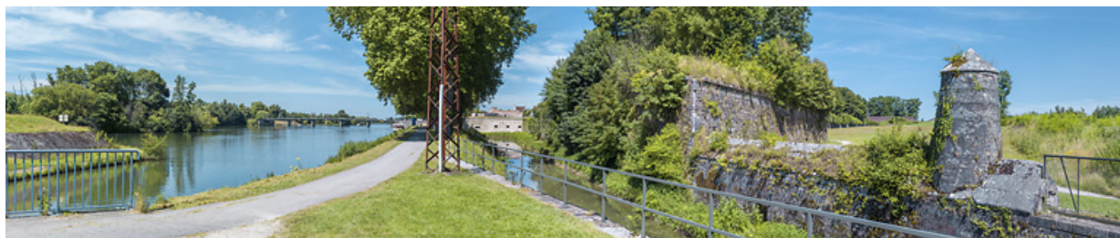
Le pont et les fortifications de la ville, depuis le chemin de halage. A droite, le contre-fossé longeant la dérivation d'Auxonne. 21, Auxonne