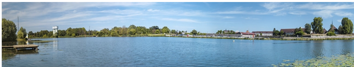
La ville vue depuis la rive droite de la Saône. Au centre, le Port Royal. 21, Auxonne