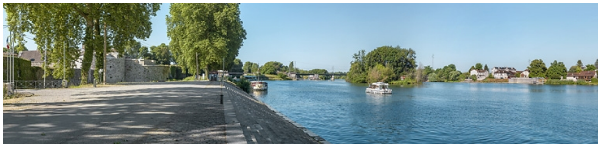
Le château, l'entrée de la dérivation, le pont ferroviaire et la gare d'Auxonne vus depuis les quais.