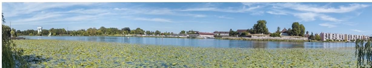
La ville vue depuis la rive droite de la Saône. Au centre, le Port Royal.