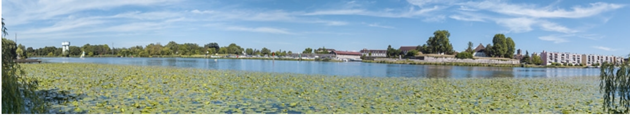
La ville vue depuis la rive droite de la Saône. Au centre, le Port Royal.