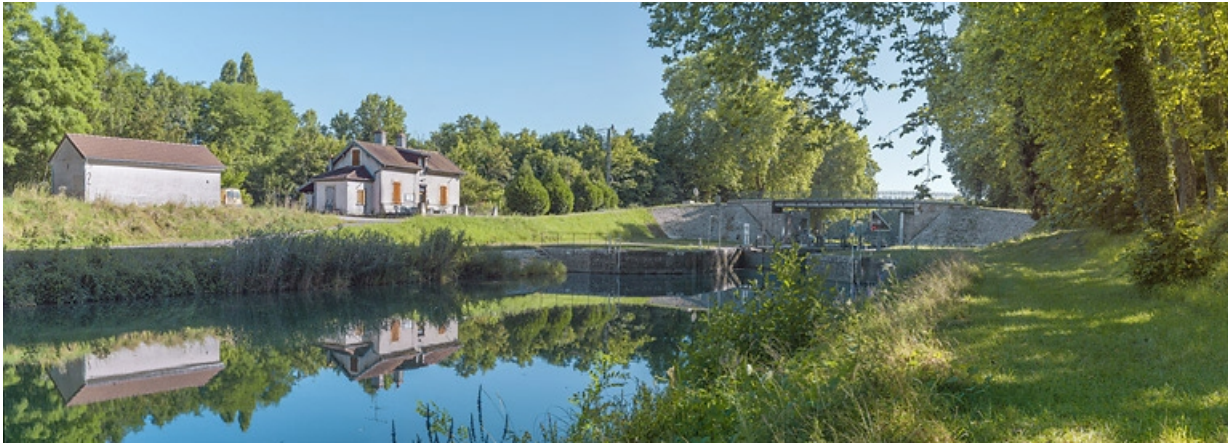
Vue d'ensemble : à gauche, la maison éclésièr et au centre, le sas et le pont sur écluse. 21, Auxonne, lieudit : PK 229,8