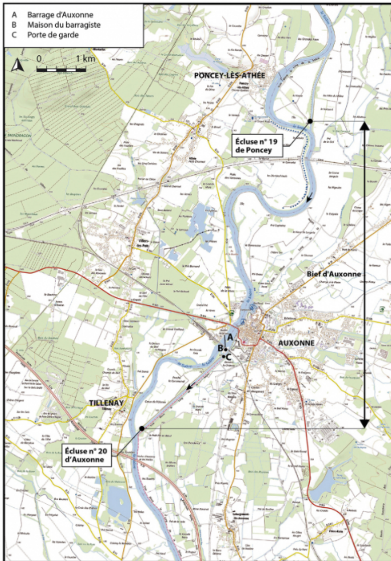
Plan de localisation (1/50 000). Extrait du ScanExpress standard © IGN 2018. 21, Auxonne, lieudit : le Petit Pré au Boeuf