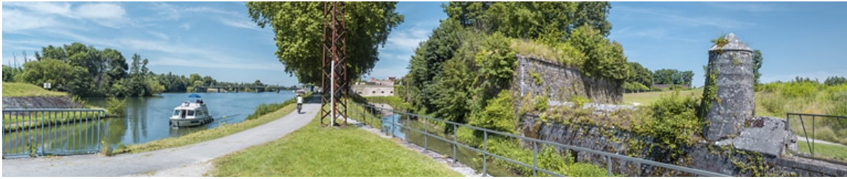
Vue d'ensemble avec de gauche à droite : l'entrée de la dérivation, le pont, les fortifications et le fossé qui longe la dérivation. 21, Auxonne route de Dijon, lieudit : PK 233,2