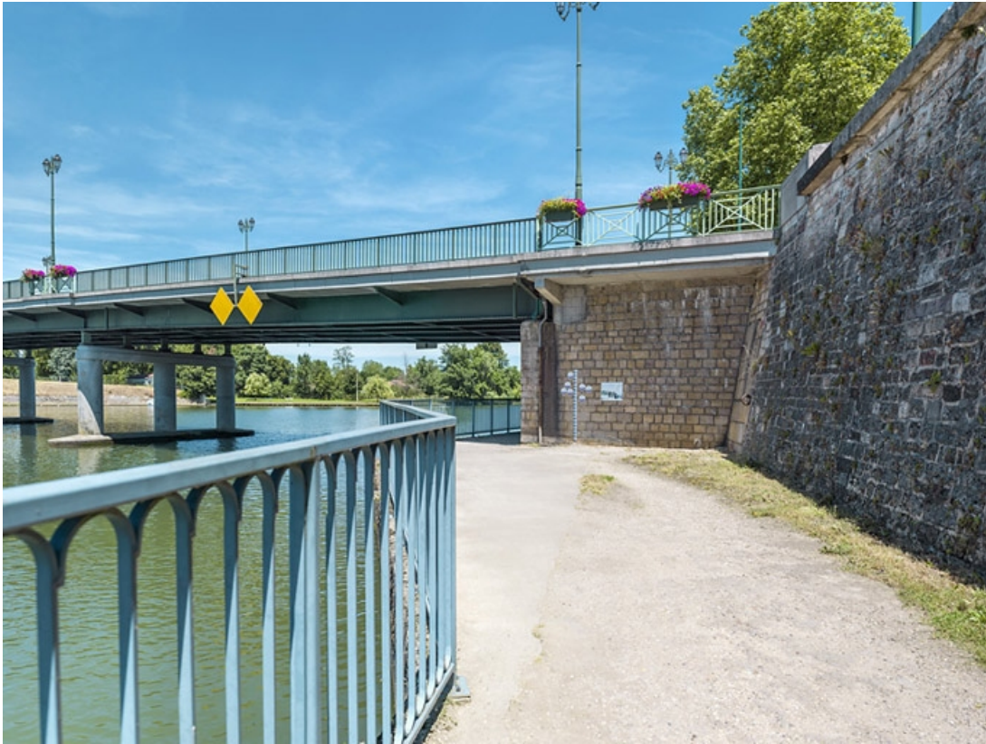
Pile, arche marinière et culée du pont avec repères de crues.

21, Auxonne route de Dijon, lieudit : PK 233,2