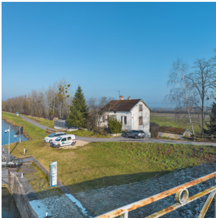
Maison éclusière de Poncey, vue depuis le pont sur écluse.