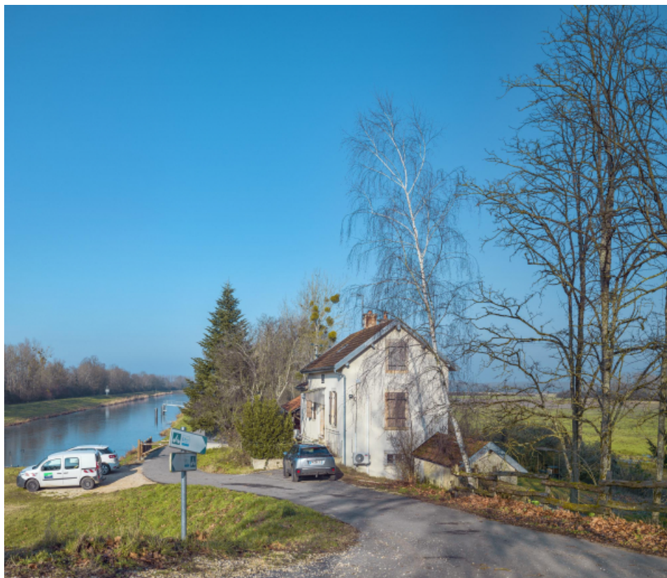
Pignon de la maison éclusière de Poncey.