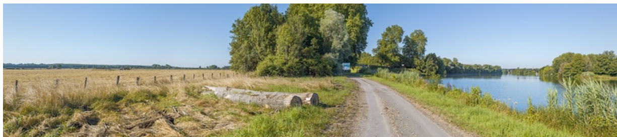
L'entrée de la dérivation, rive gauche de la Saône.