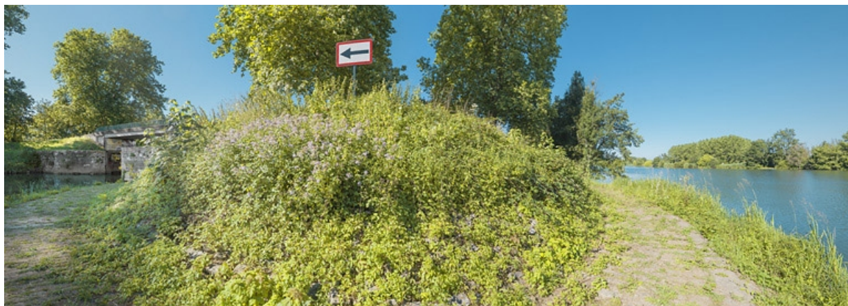
A gauche, l'entrée de la dérivation et à droite, la Saône. 21, Flammerans