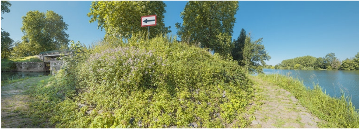
A gauche, l'entrée de la dérivation et à droite, la Saône. 21, Flammerans