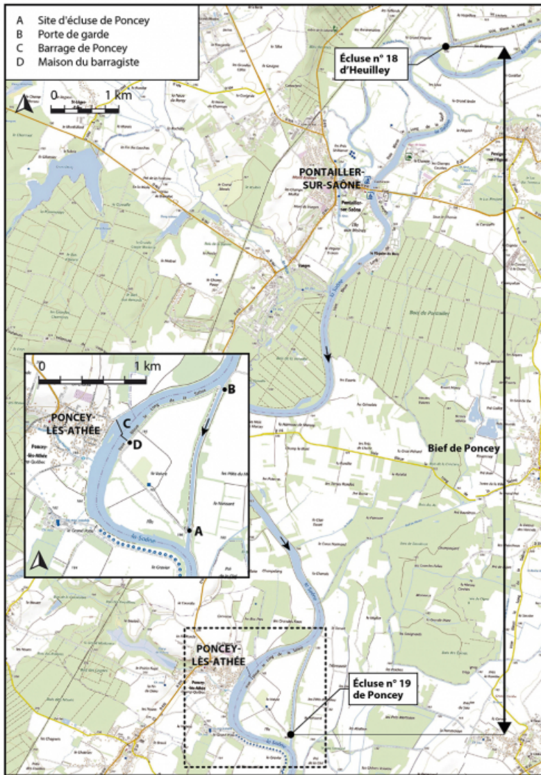
Plan de localisation (1/40 000). Extrait du ScanExpress standard © IGN 2018. 21, Flammerans