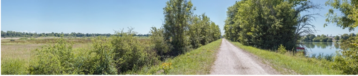
La Saône à hauteur de Flammerans, sur le chemin conduisant au barrage de Poncey. A gauche, on aperçoit de nombreux puits et à droite, la Saône.