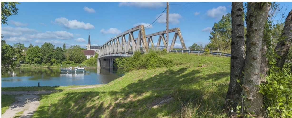
Vue d'ensemble, rive gauche.