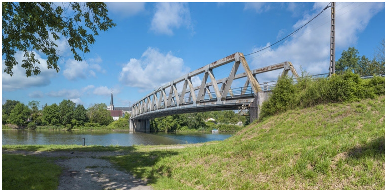
Pont routier de Lamarche-sur-Saône (21).