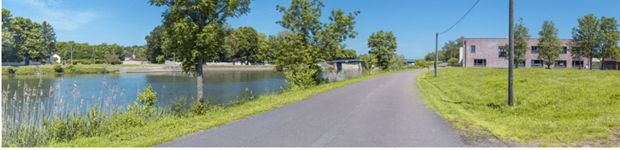
Vue d'ensemble des quais à gradins depuis la rive gauche.

21, Pontailler-sur-Saône rue du Port, lieudit : PK 251