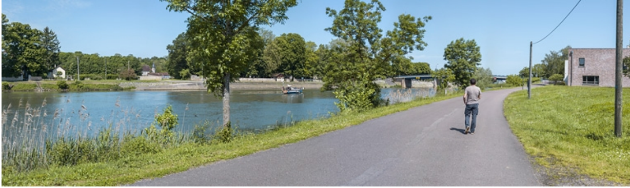
Vue d'ensemble des quais à gradins depuis la rive gauche.

21, Pontallier-sur-Saône rue du Port, lieudit : PK 251