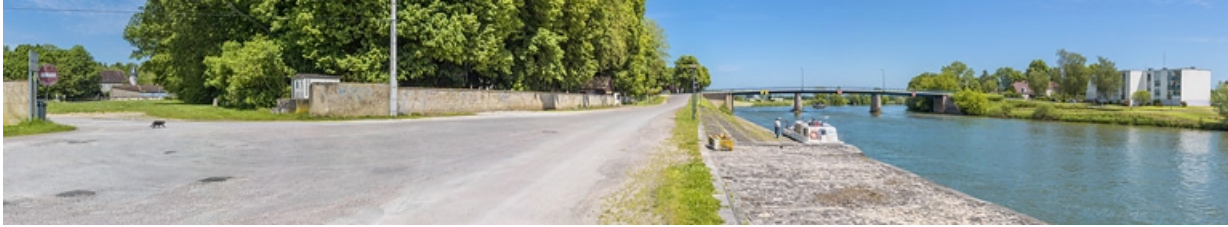
Vue d'ensemble des quais à gradins avec un bateau.

21, Pontailier-sur-Saône rue du Port, lieudit : PK 251