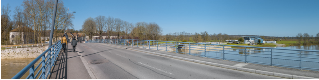
Vue d'ensemble du village de Pontailier-sur-Saône et du port, depuis le pont.

21, Pontailier-sur-Saône route départementale 959, lieudit : PK 251.5