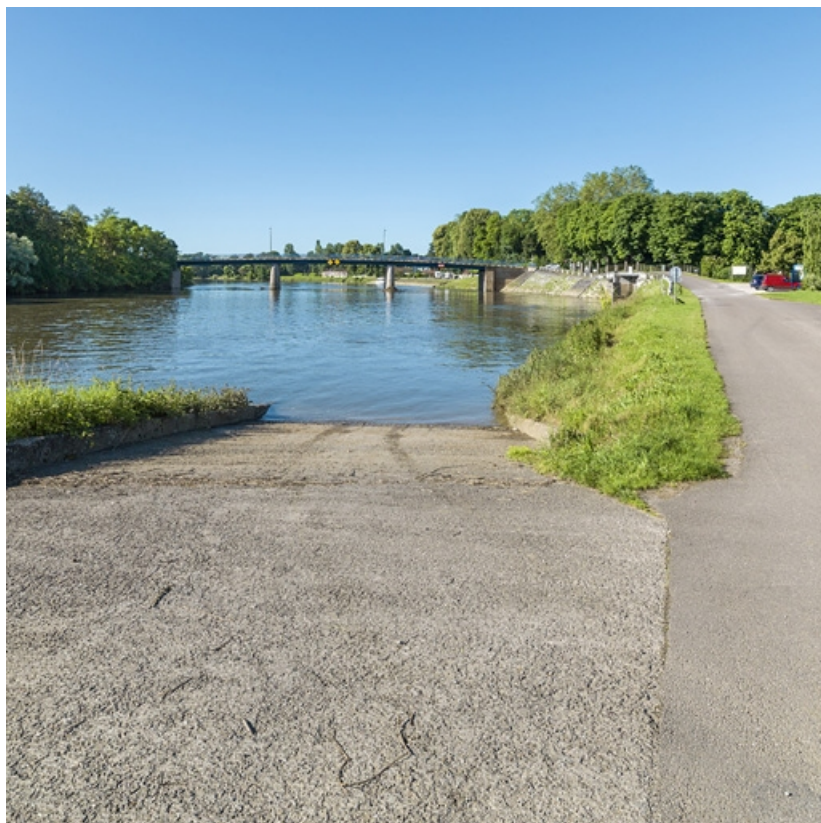
Vue d'ensemble depuis la rampe de mise à l'eau, rive droite.

21, Pontailler-sur-Saône route départementale 959, lieudit : PK 251.5