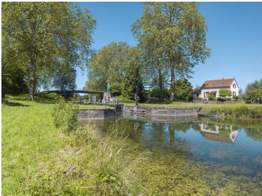
Vue d'amont. Maison éclusière à droite.