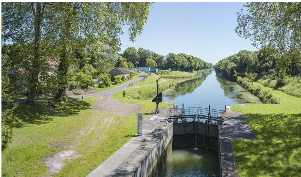
Vue des portes amont et du sas depuis le pont sur écluse.

21, Maxilly-sur-Saône, lieudit : Tremblant (le)