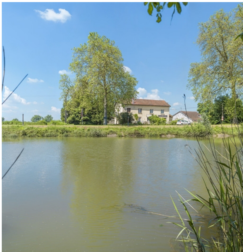
Ancien restaurant en aval du site, depuis la rive gauche.

21, Maxilly-sur-Saône, lieudit : Tremblant (le)