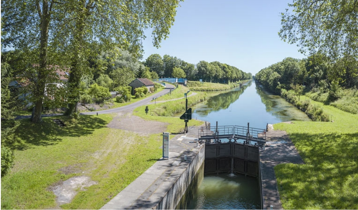
Vue des portes amont et du sas depuis le pont sur écluse.

21, Maxilly-sur-Saône, lieudit : Tremblant (le)