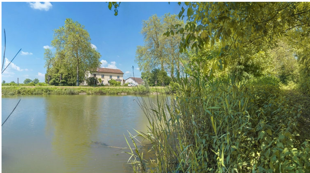
Ancien restaurant en aval du site, depuis la rive gauche.

21, Maxilly-sur-Saône, lieudit : Tremblant (le)