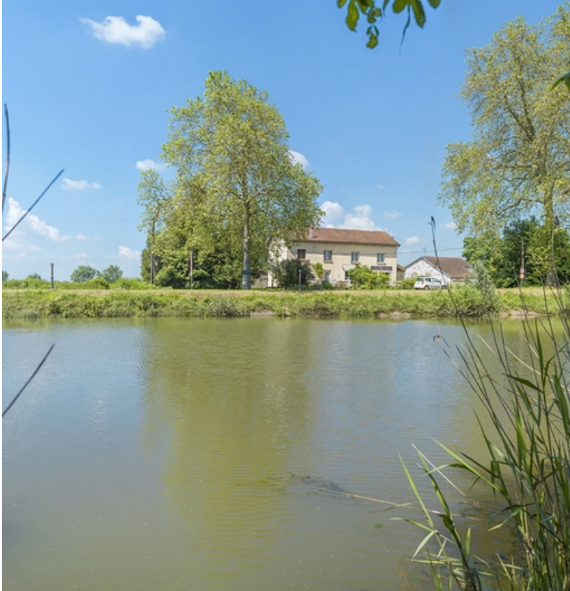
Ancien restaurant en aval du site, depuis la rive gauche.

21, Maxilly-sur-Saône, lieudit : Tremblant (le)