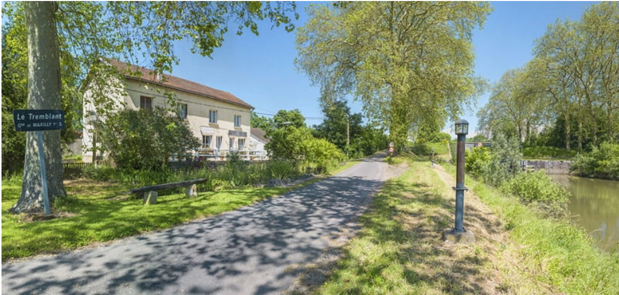
Le site d'écluse et l'ancien restaurant, au lieu-dit Le Tremblant, vus depuis la rive droite. 21, Maxilly-sur-Saône, lieudit : Tremblant (le)