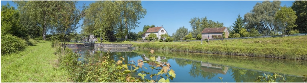
Vue d'amont. Maison éclusière à droite.

21, Maxilly-sur-Saône, lieudit : Tremblant (le)