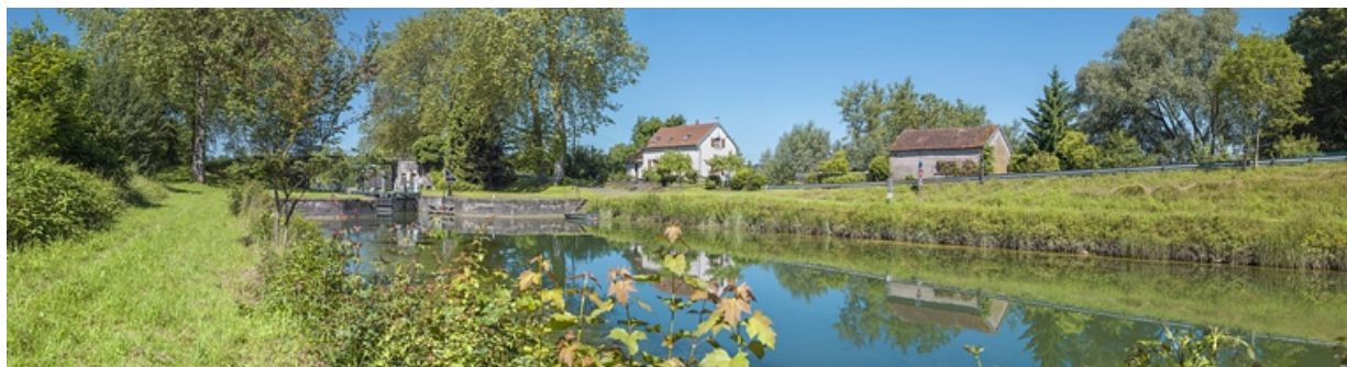
Vue d'amont. Maison éclusière à droite.

21, Maxilly-sur-Saône, lieudit : Tremblant (le)