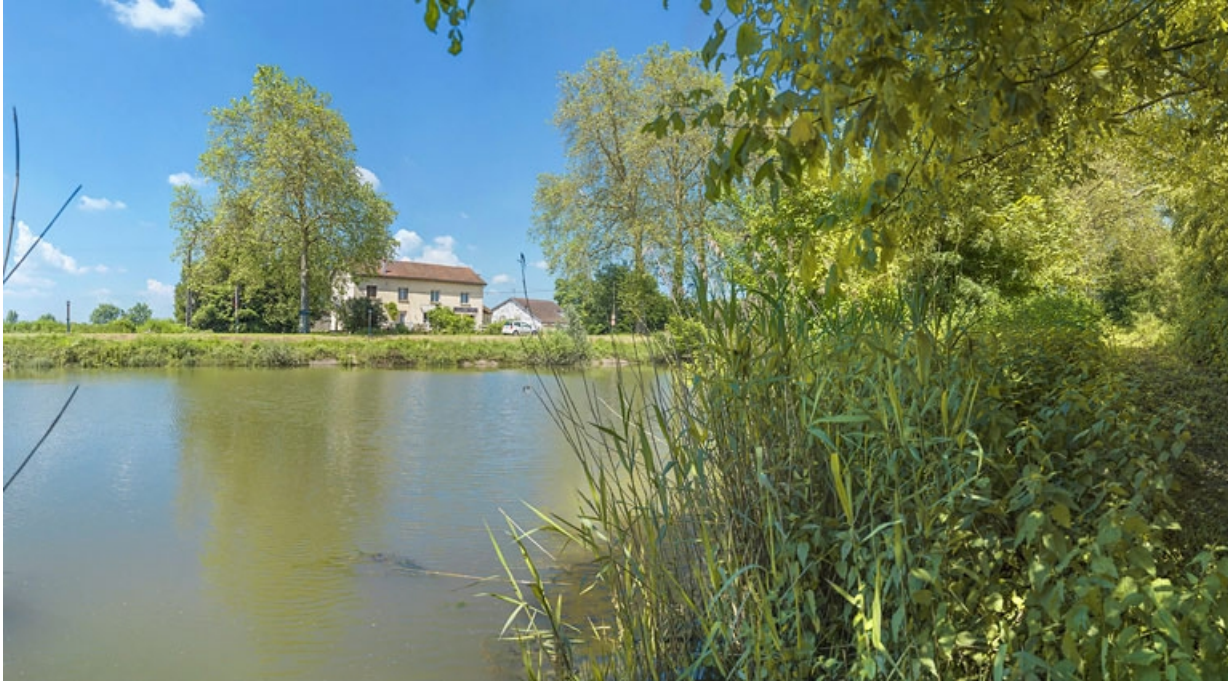
Ancien restaurant en aval du site, depuis la rive gauche.

21, Maxilly-sur-Saône, lieudit : Tremblant (le)