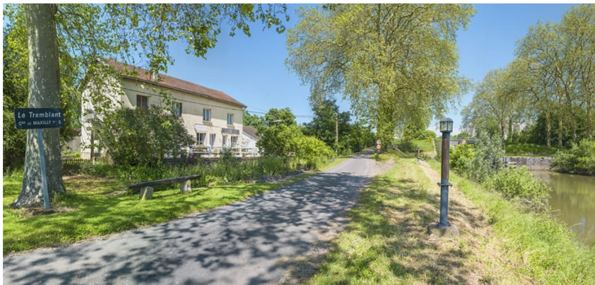
Le site d'écluse et l'ancien restaurant, au lieu-dit Le Tremblant, vus depuis la rive droite.

21, Maxilly-sur-Saône, lieudit : Tremblant (le)