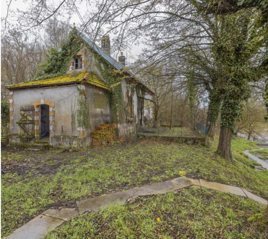
Vue de trois-quarts et de l'annexe latérale gauche.

21, Heuilley-sur-Saône, lieudit : Ile de Fley