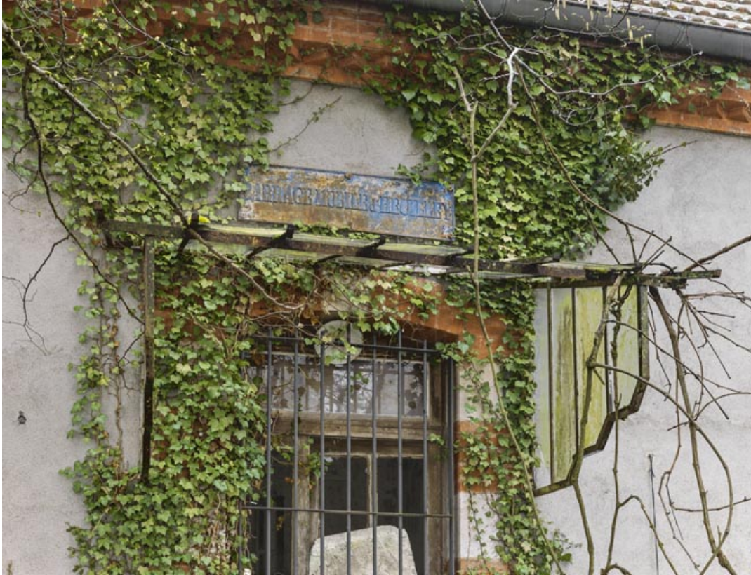
Détail de la plaque indiquant "barrage mobile d'Heuilley", au-dessus de la porte d'entrée.

21, Heuilley-sur-Saône, lieudit : Ile de Fley