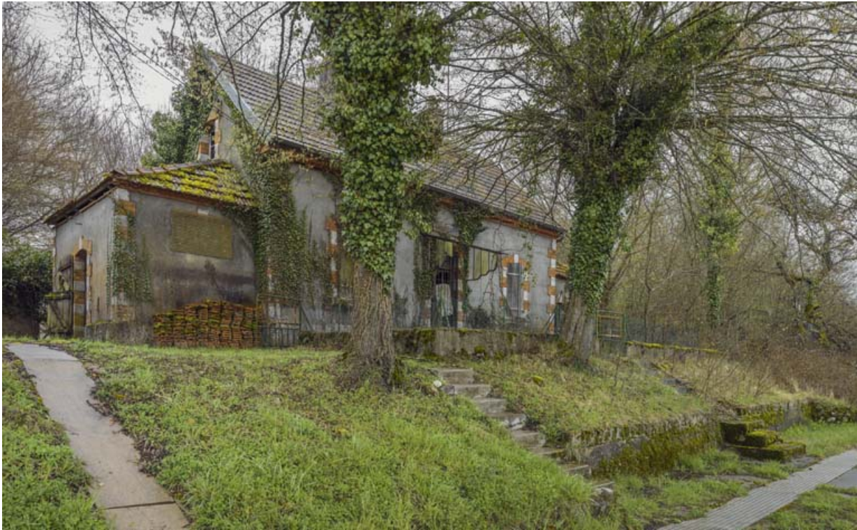
Vue d'ensemble de la maison du barragiste, sur l'île de Fley.