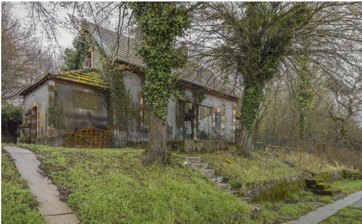
Vue d'ensemble de la maison du barragiste, sur l'île de Fley.