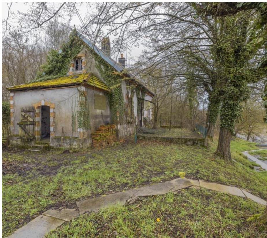
Vue de trois-quarts et de l'annexe latérale gauche.

21, Heuilley-sur-Saône, lieudit : ile de Fley