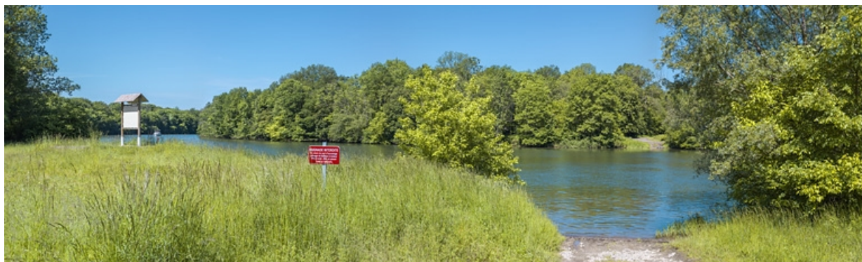
Vue depuis la rive gauche, avec la halte nautique.

21, Heuilley-sur-Saône, lieudit : Port-Saint-Pierre