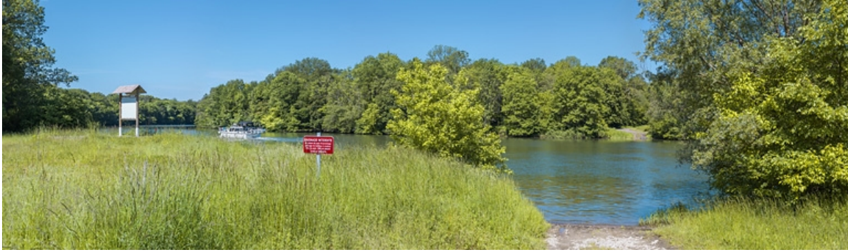
Vue depuis la rive gauche, avec la halte nautique.

21, Heuilley-sur-Saône, lieudit : Port-Saint-Pierre