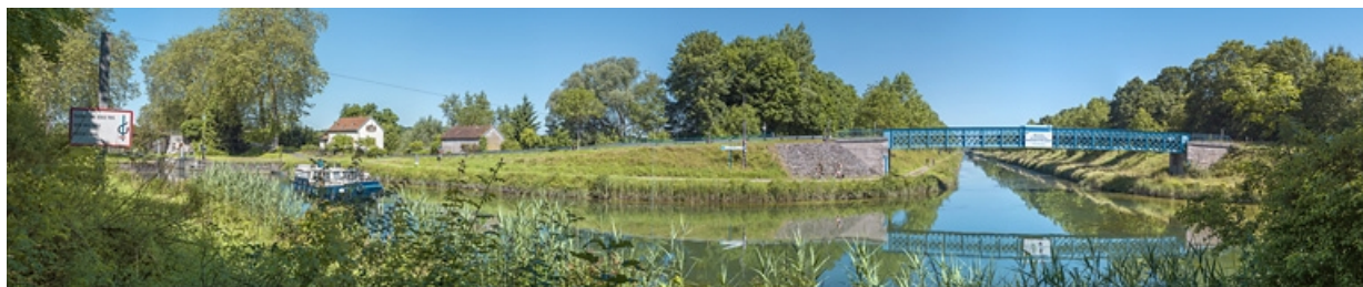
Vue d'ensemble de la passerelle avec l'entrée du canal entre Champagne et Bourgogne. A gauche, le site d'écluse 18. 21, Maxilly-sur-Saône