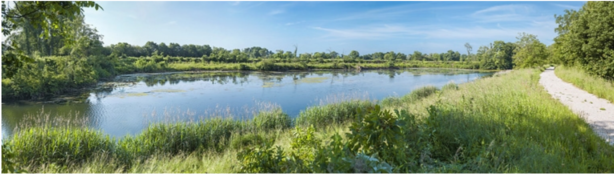
Port désaffecté avec épave de péniche.