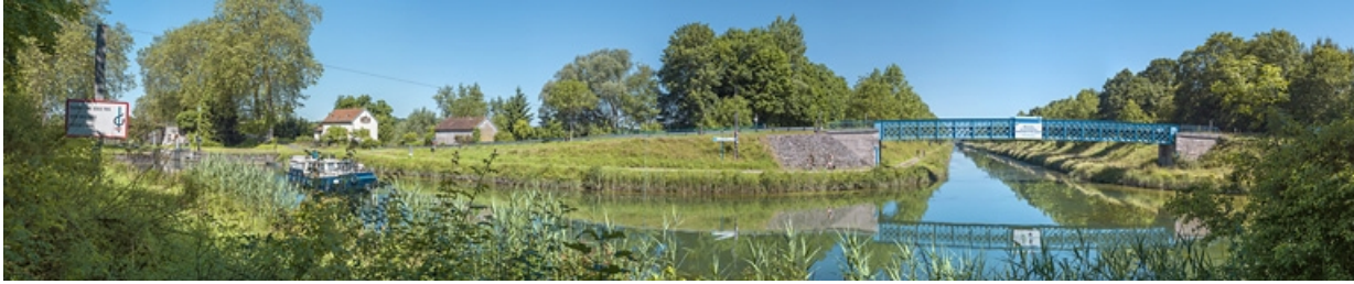
Vue d'ensemble de la passerelle avec l'entrée du canal entre Champagne et Bourgogne. A gauche, le site d'écluse 18. 21, Maxilly-sur-Saône