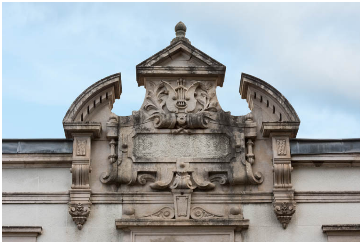
Façade antérieure : fronton échancré sculpté.