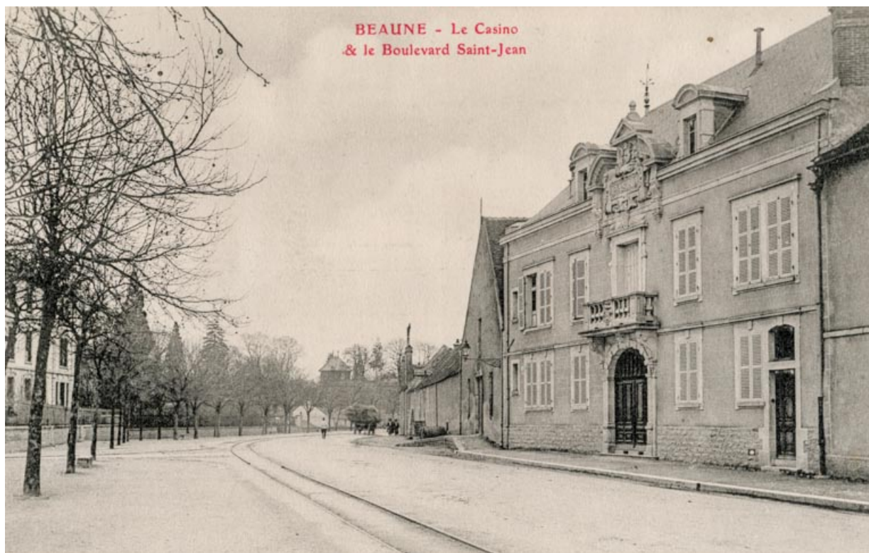
Beaune - Le Casino & le Boulevard Saint-Jean. S.d. [1er quart 20e siècle, décennie 1910]. 21, Beaune, 12 boulevard Jules Ferry