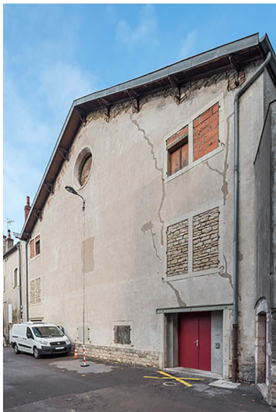
Façade postérieure, de trois quarts droite.