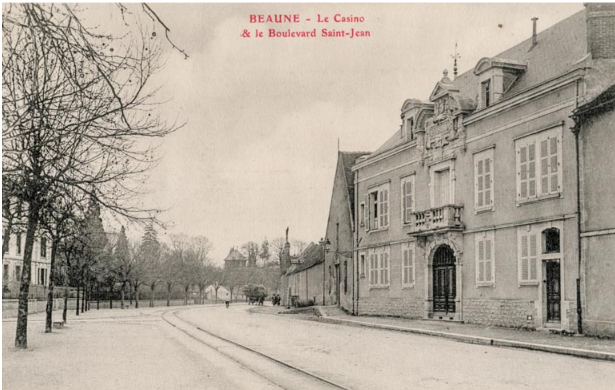
Beaune - Le Casino & le Boulevard Saint-Jean. S.d. [1er quart 20e siècle, décennie 1910]. 21, Beaune, 12 boulevard Jules Ferry

Beaune - Le Casino & le Boulevard Saint-Jean. Carte postale, s.n. S.d. [1er quart 20e siècle, décennie 1910]. Ronco Frères éd., Beaune. Date 14 aout 191. (tampon au recto) portée sur un autre tirage de la carte. Lieu de conservation : Archives municipales, Beaune - Cote du document : 4 Fi 22