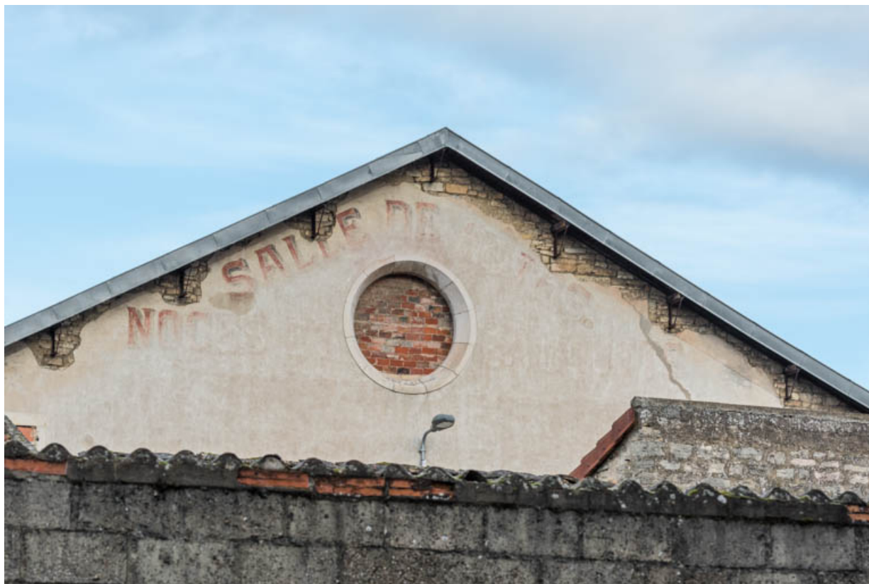
Façade postérieure : fronton et inscriptions peintes.