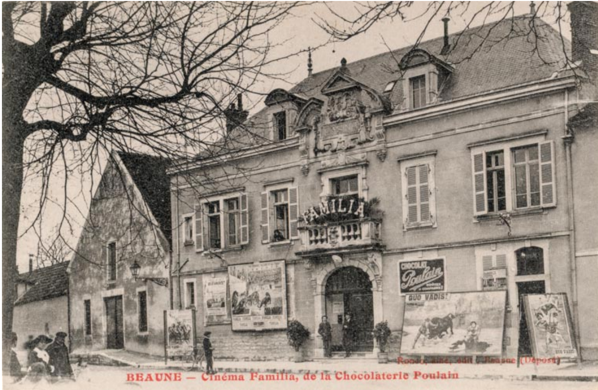
Beaune - Cinéma Familia, de la Chocolaterie Poulain. S.d. [1er quart 20e siècle].

Beaune - Cinéma Familia, de la Chocolaterie Poulain. Carte postale, s.n. S.d. [1er quart 20e siècle]. Ronco Aîné éd., Beaune. Porte la date 18 septembre 1925 (manuscrite et tampon) au verso.