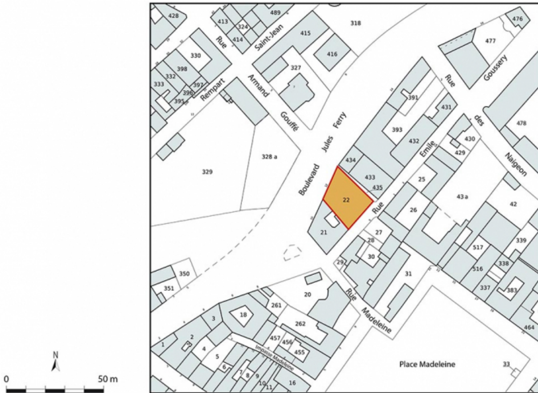
Plan-masse et de situation. Extrait du plan cadastral, 2021, section AL, 1/1 000.