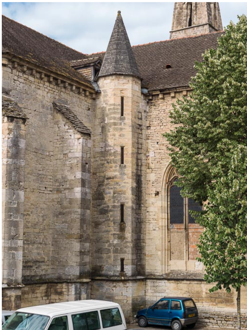
Vue de la tourelle d'escalier.