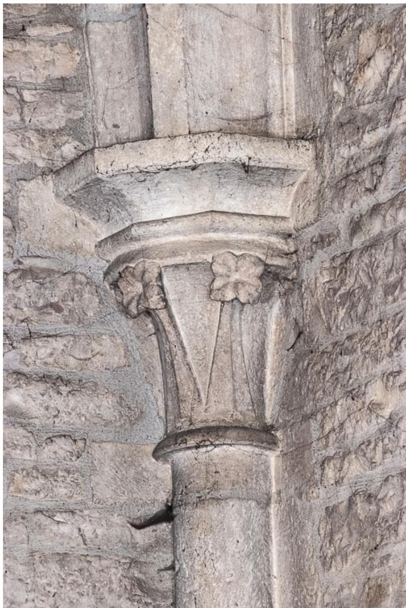
Vue d'un chapiteau du bras sud du transept. 21, Beaune, rue de l' Eglise