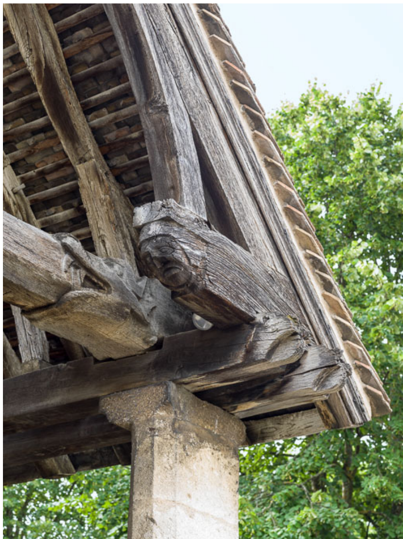
Porche : détail d'un engoulant.