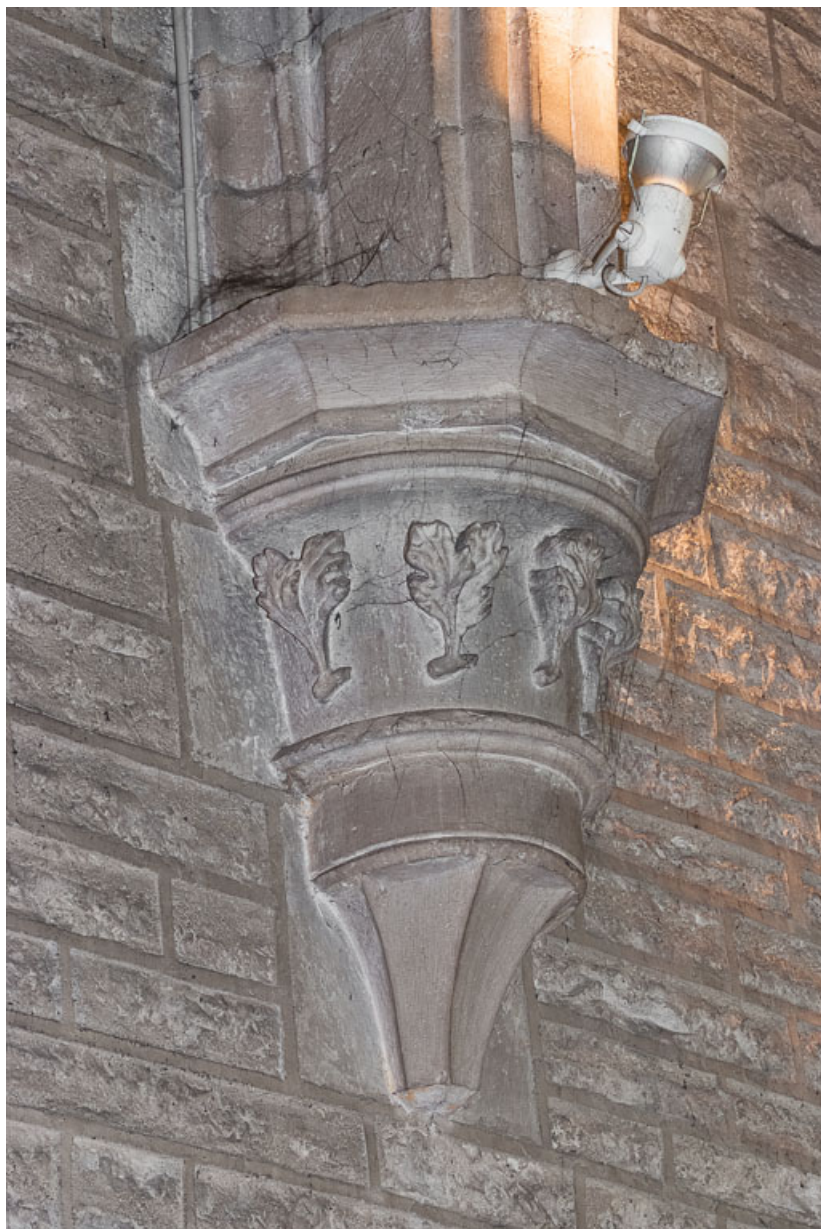
Vue d'un chapiteau de la nef.