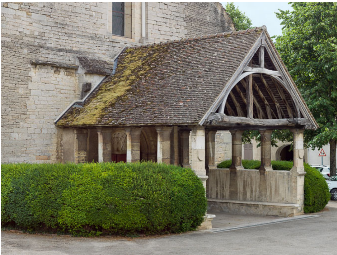
Porche : vue de trois-quarts.