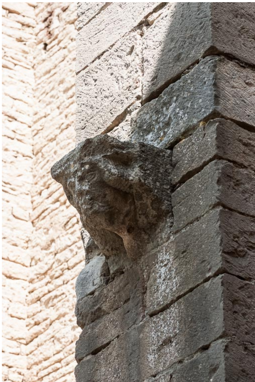
Vue d'une tête sculptée, gouttereau sud.