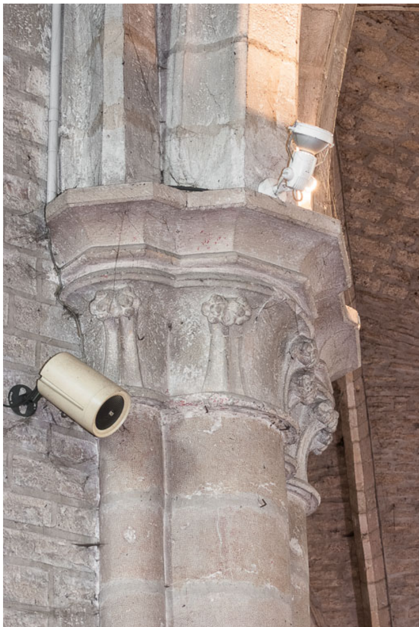
Vue d'un chapiteau d'un pilier de la croisée.