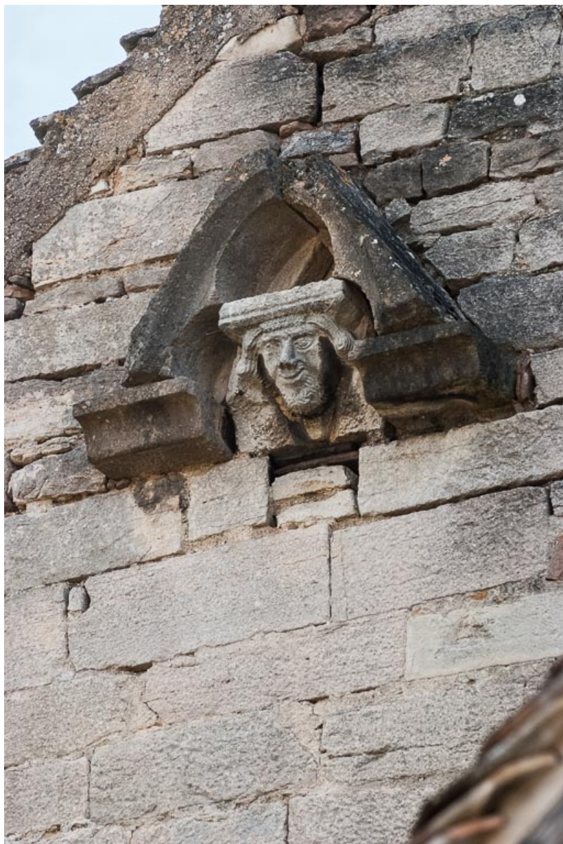
Vue d'une tête sculptée sur le pignon.