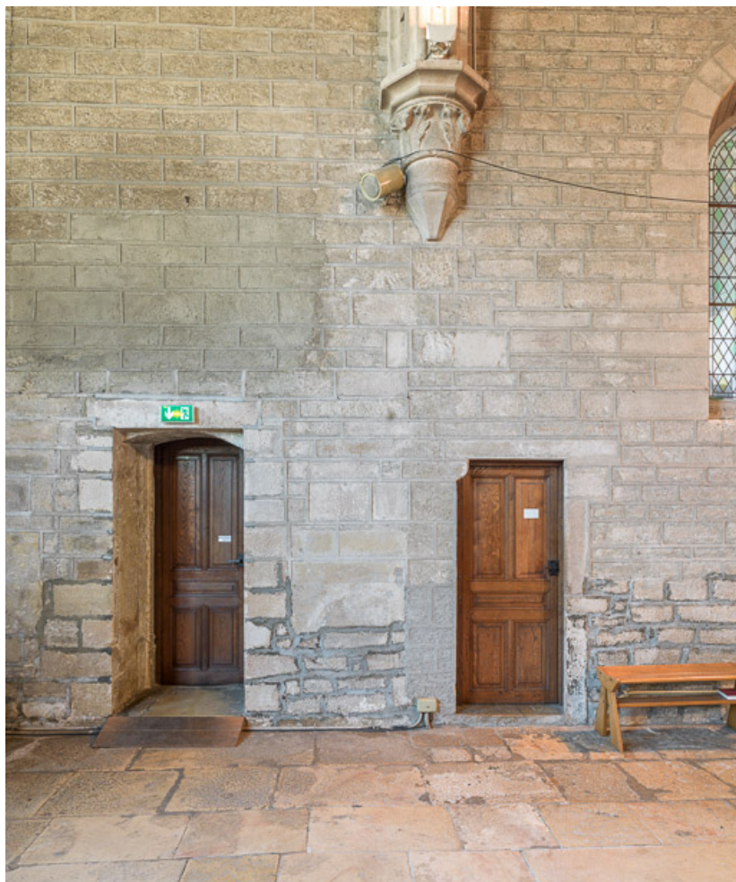
Vue des portes de la sacristie, dans le chœur.