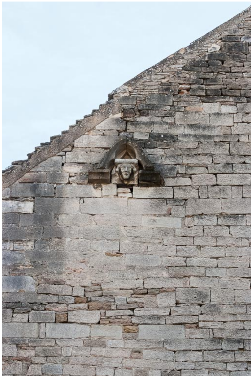
Vue d'une tête sculptée sur le pignon.