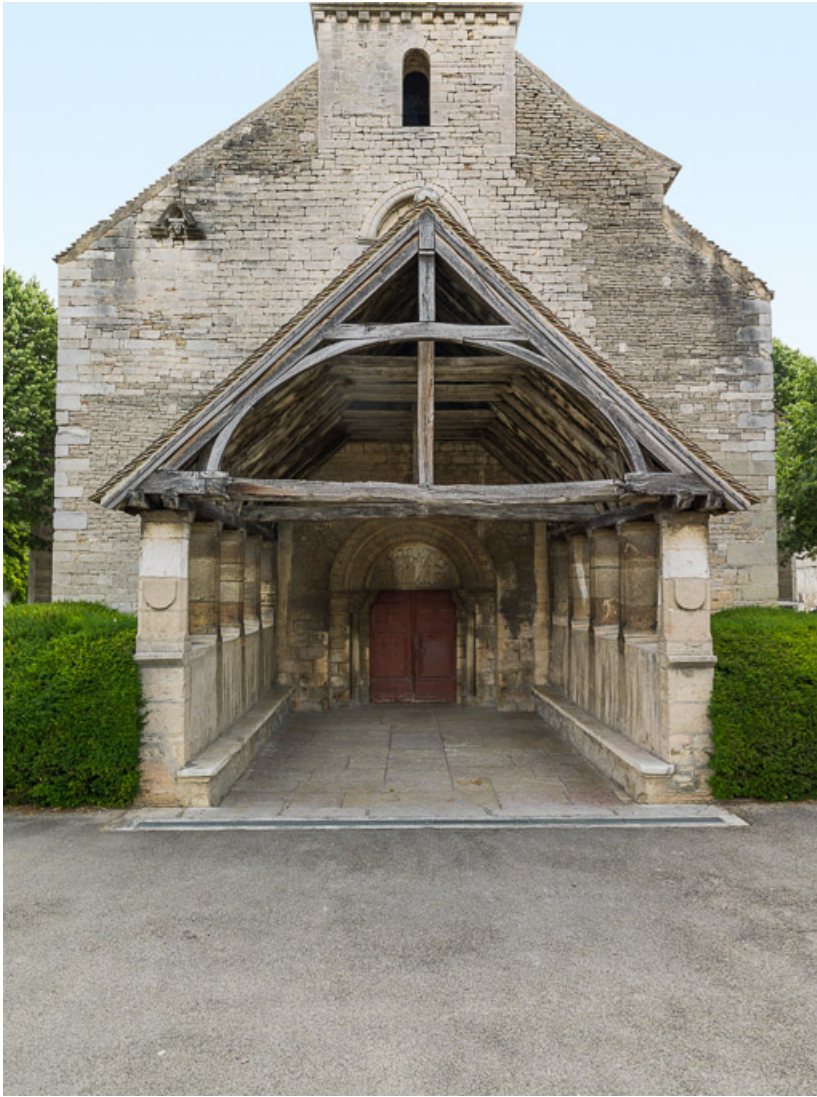
Porche : vue de face.