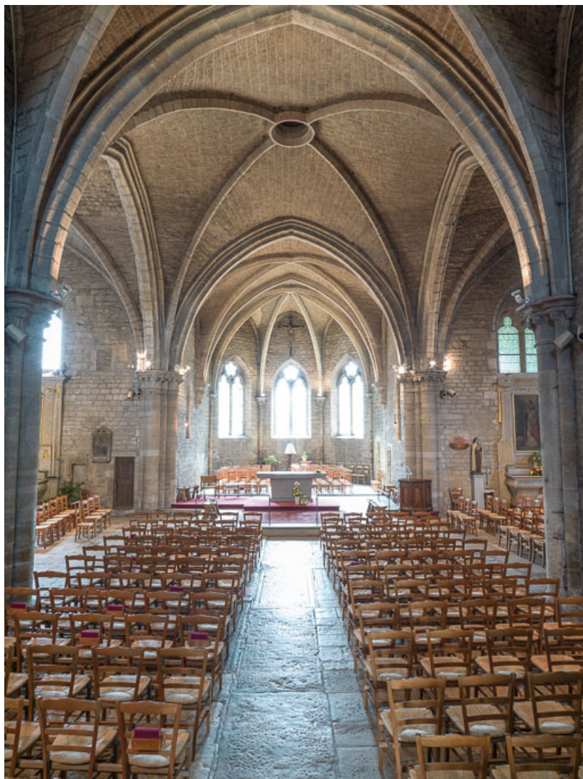
Vue de la nef, vers le chœur.