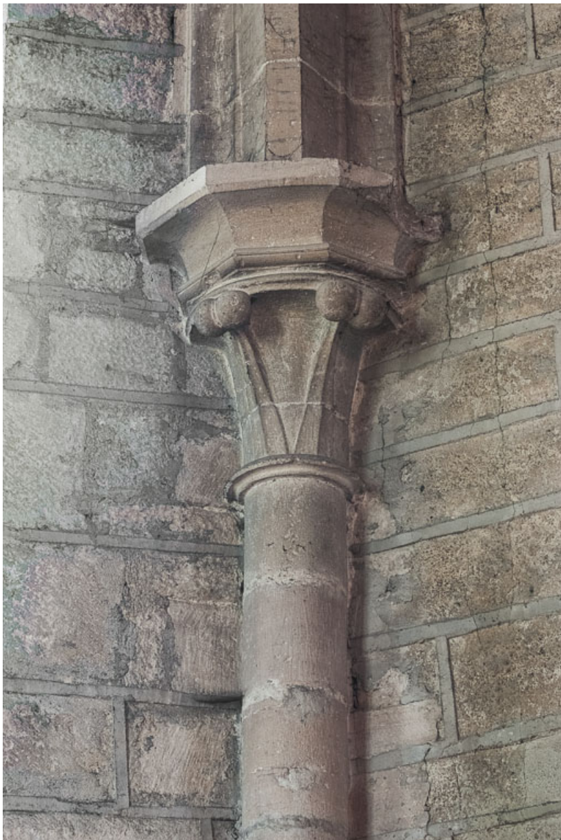
Vue d'un chapiteau du chœur.