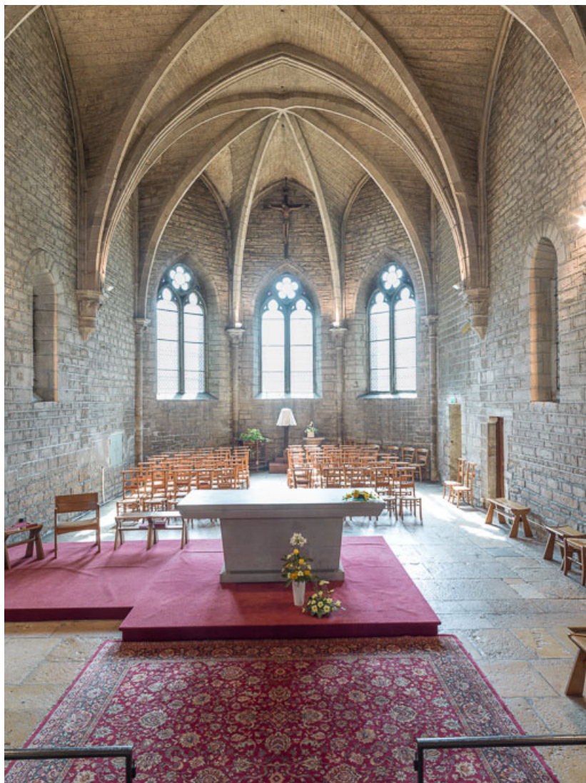
Vue du maître-autel et du chœur.