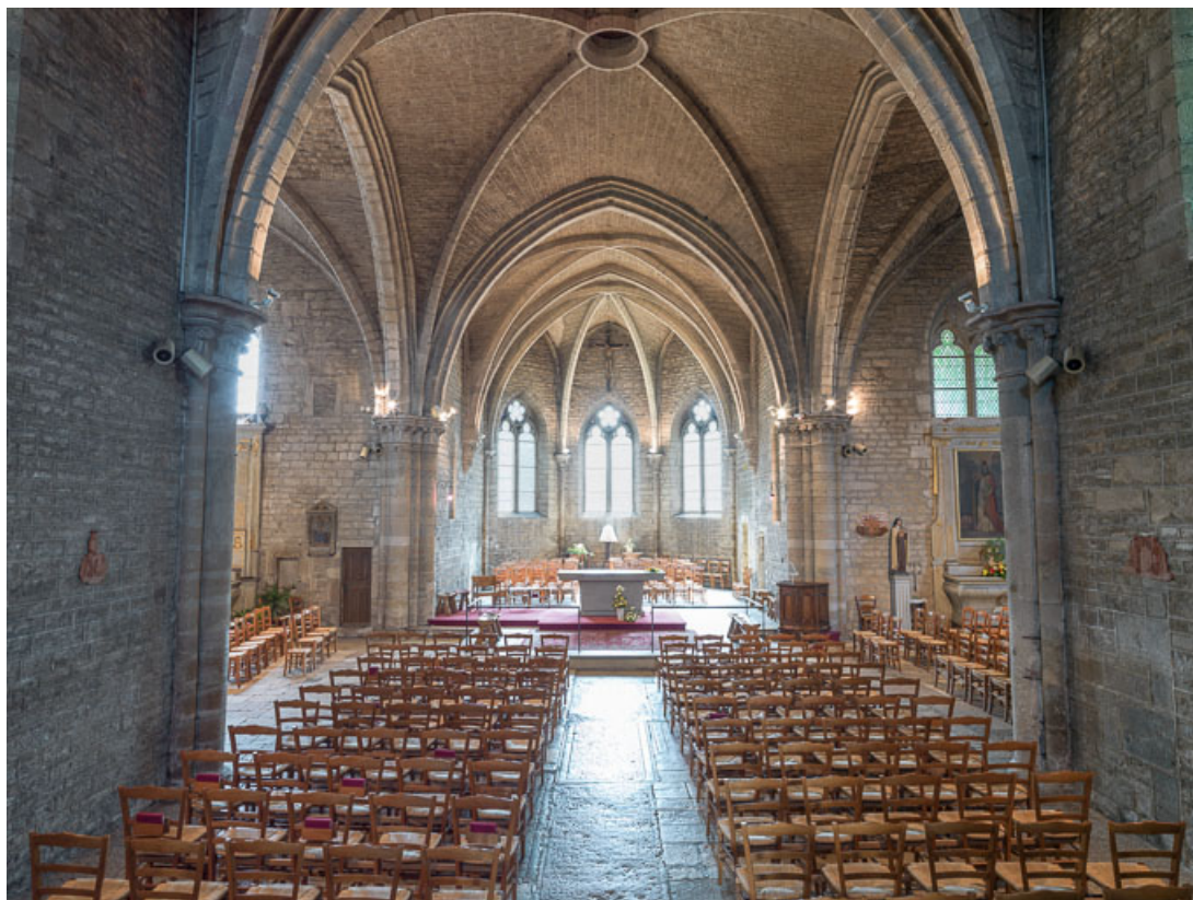
Vue de la nef, vers le chœur.