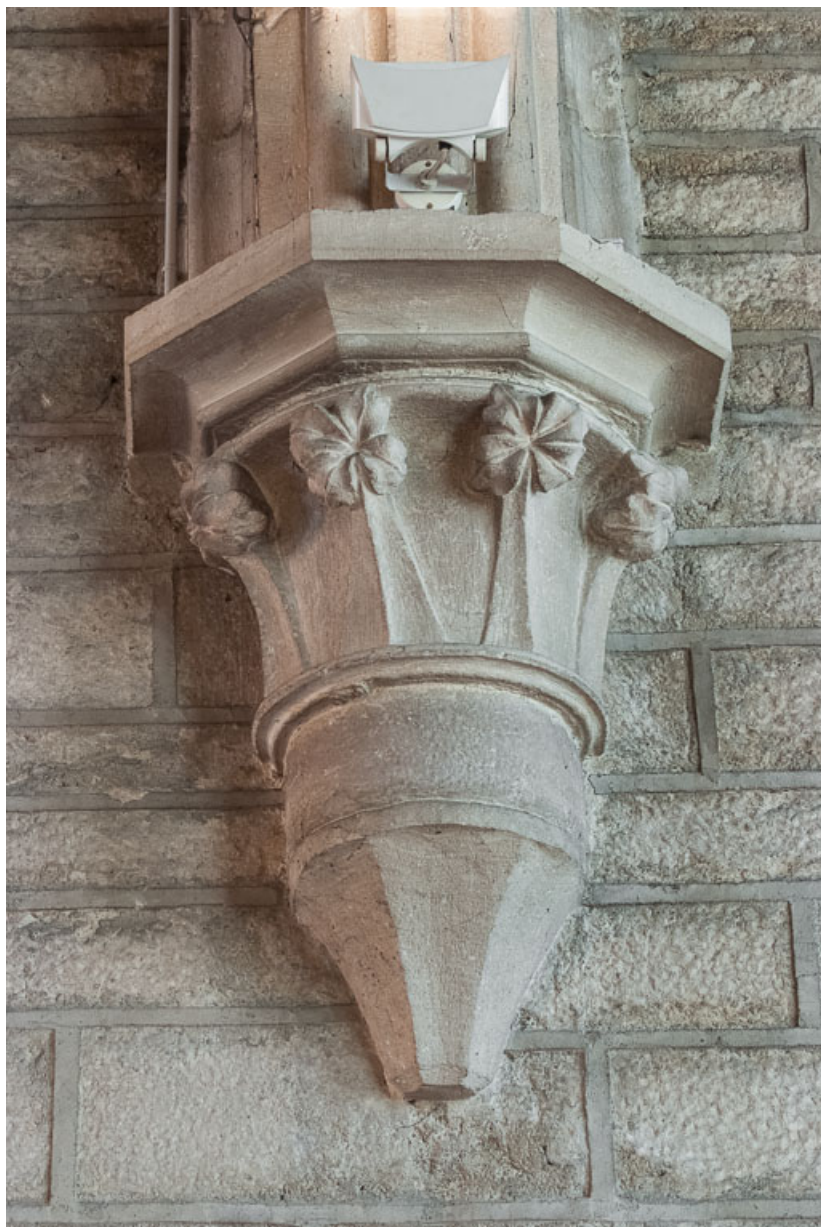
Vue d'un chapiteau de la nef.