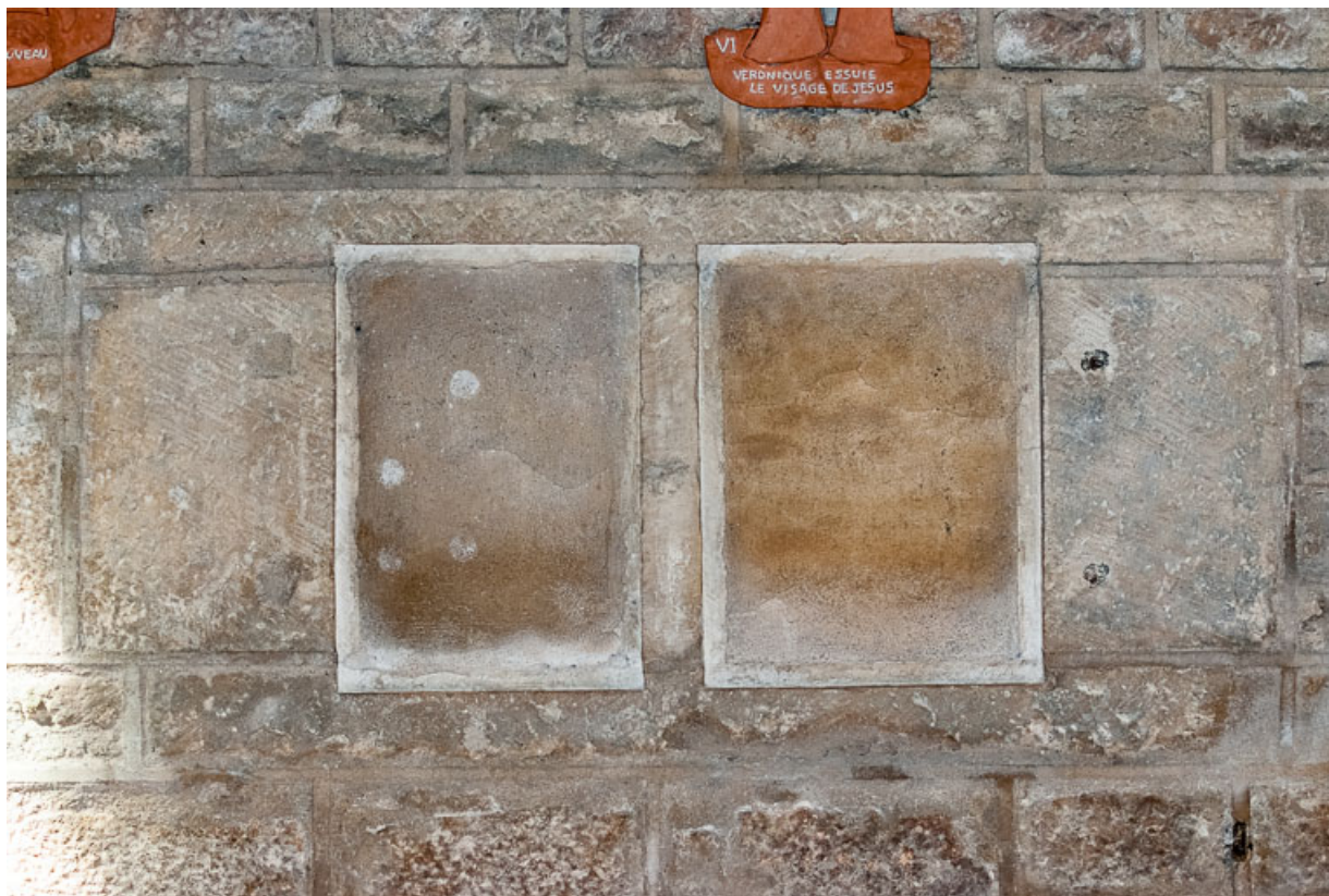
Lavabos murés, mur nord de la nef.