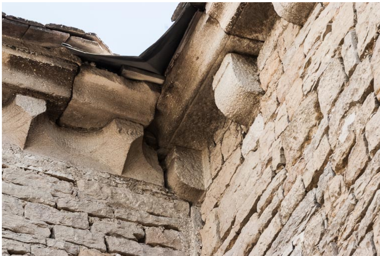
Corniche à modillons, à l'angle de la nef et du bras sud.