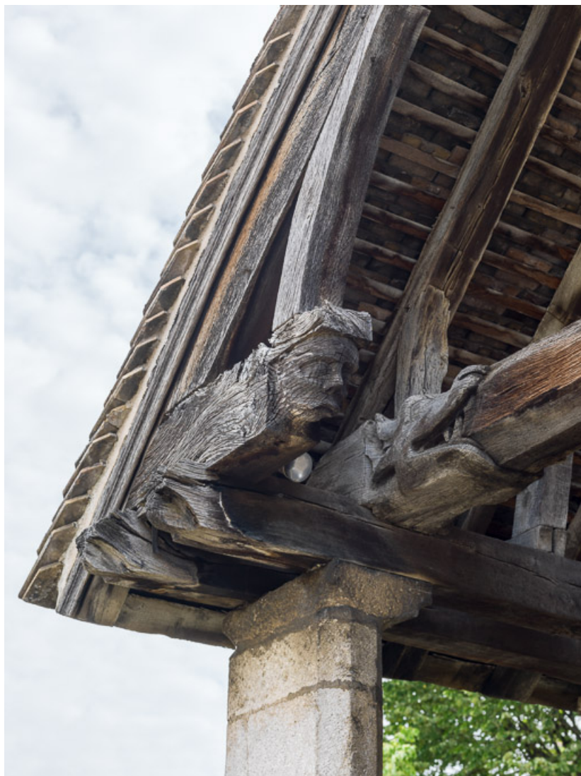
Porche : détail d'un engoulant.