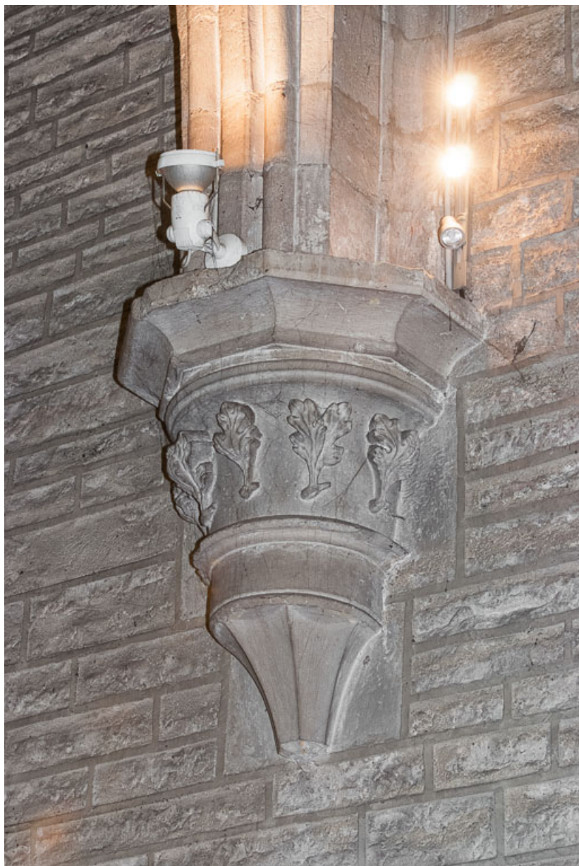
Vue d'un chapiteau de la nef.