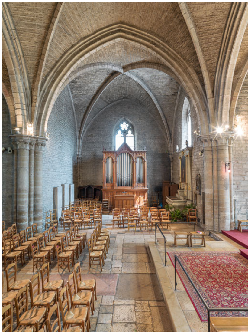
Vue axiale du bras nord.