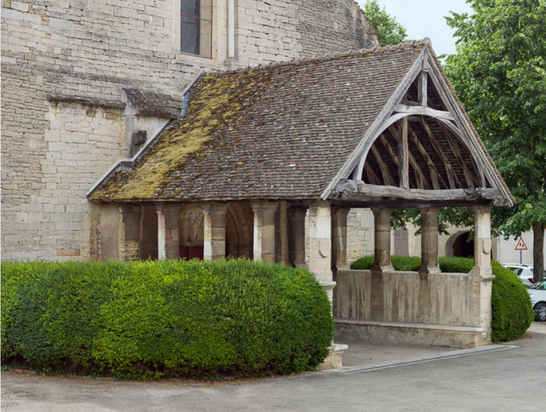
Porche : vue de trois-quarts.