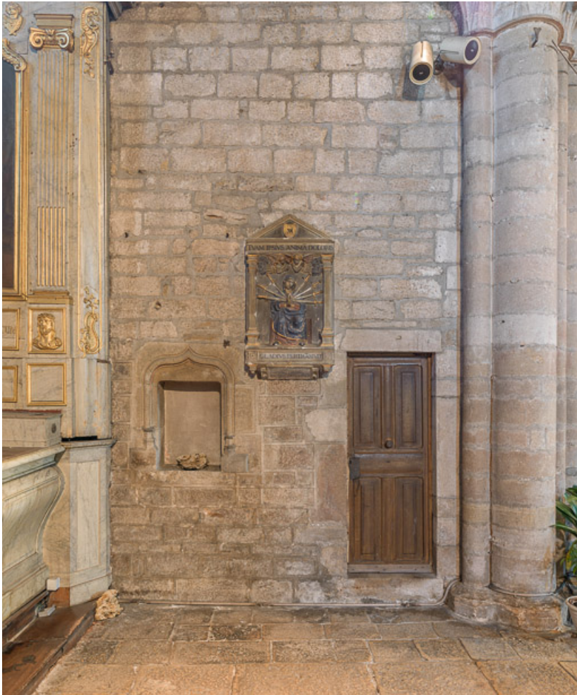
Vue de la porte menant aux combles et d'un lavabo, mur est du bras sud. 21, Beaune, rue de l' Eglise