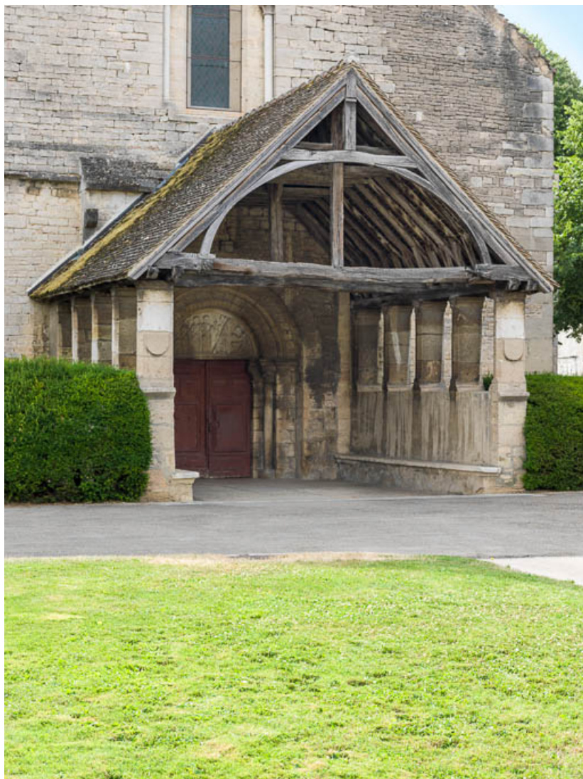
Porche : vue de trois-quarts.