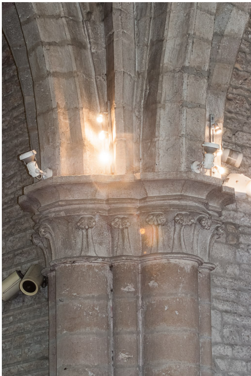
Vue d'un chapiteau d'un pilier de la croisée.