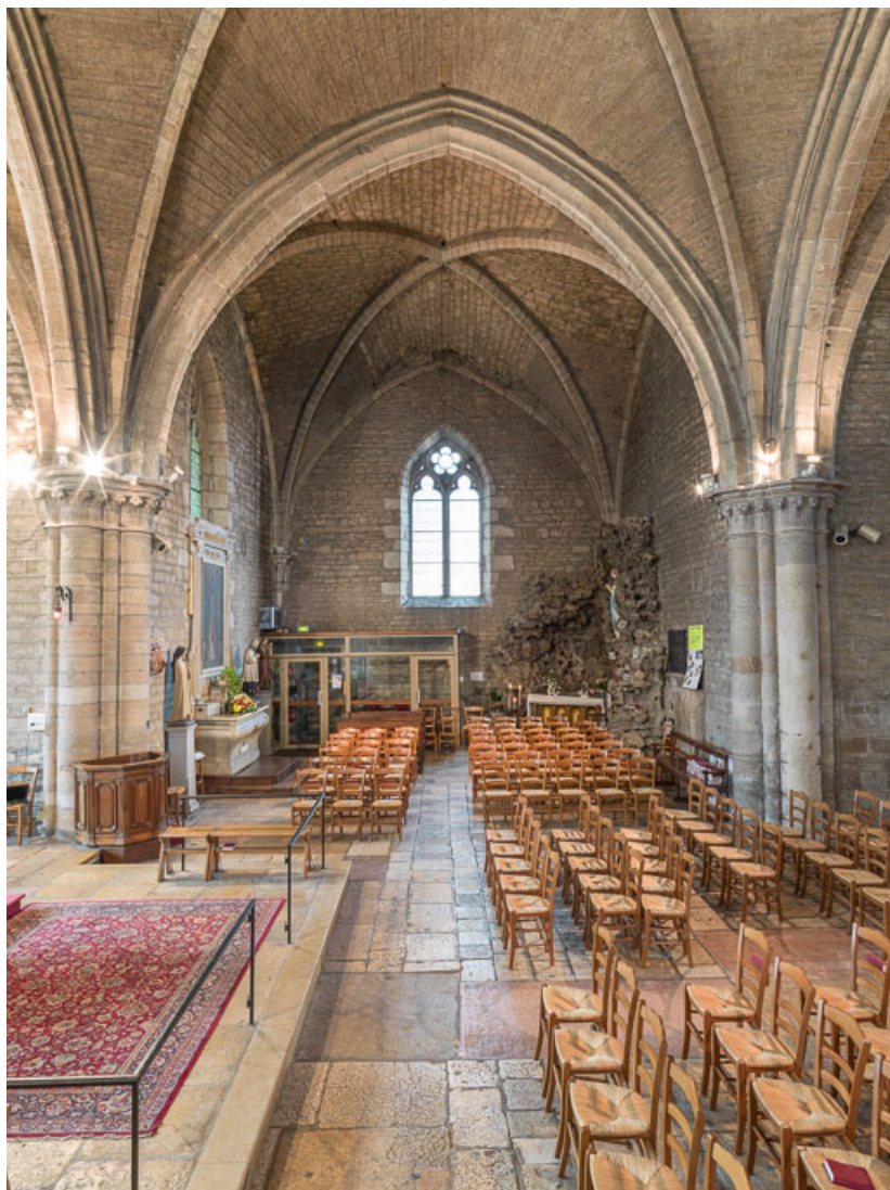
Vue axiale du bras sud.