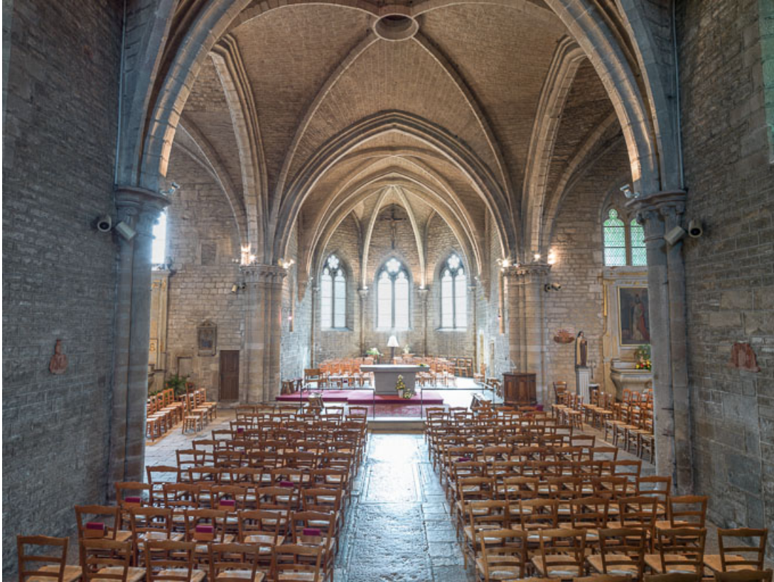
Vue de la nef, vers le chœur.