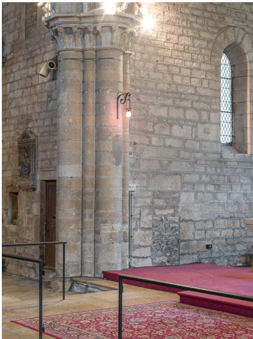
Vue d'un pilier de la croisée.