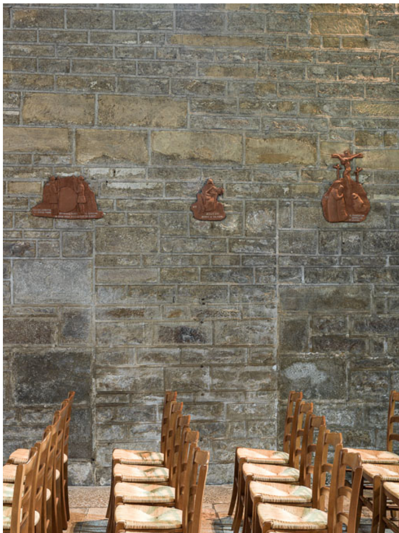
Porte murée, bras nord de la nef.