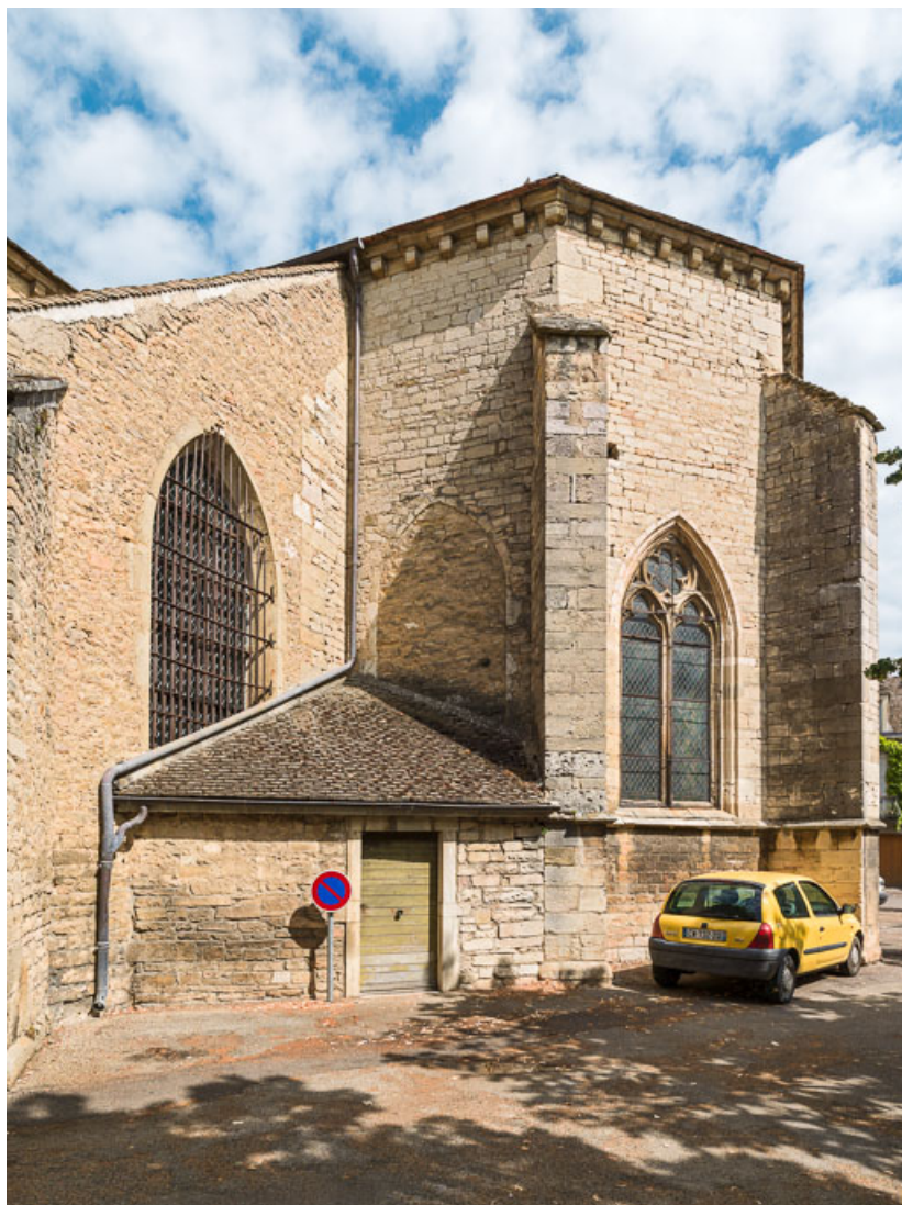
Vue du chevet et de la sacristie.