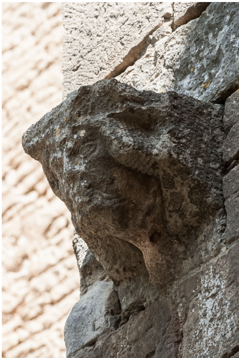
Vue d'une tête sculptée, gouttereau sud.