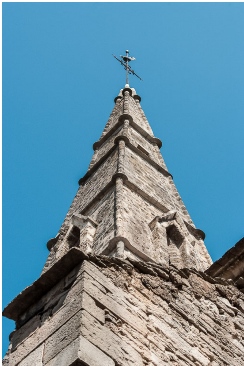
Vue du clocher, depuis le pied du massif occidental.