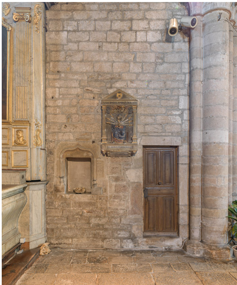
Vue de la porte menant aux combles et d'un lavabo, mur est du bras sud. 21, Beaune, rue de l' Eglise