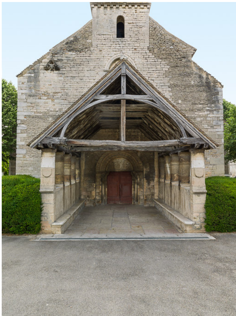
Porche : vue de face.