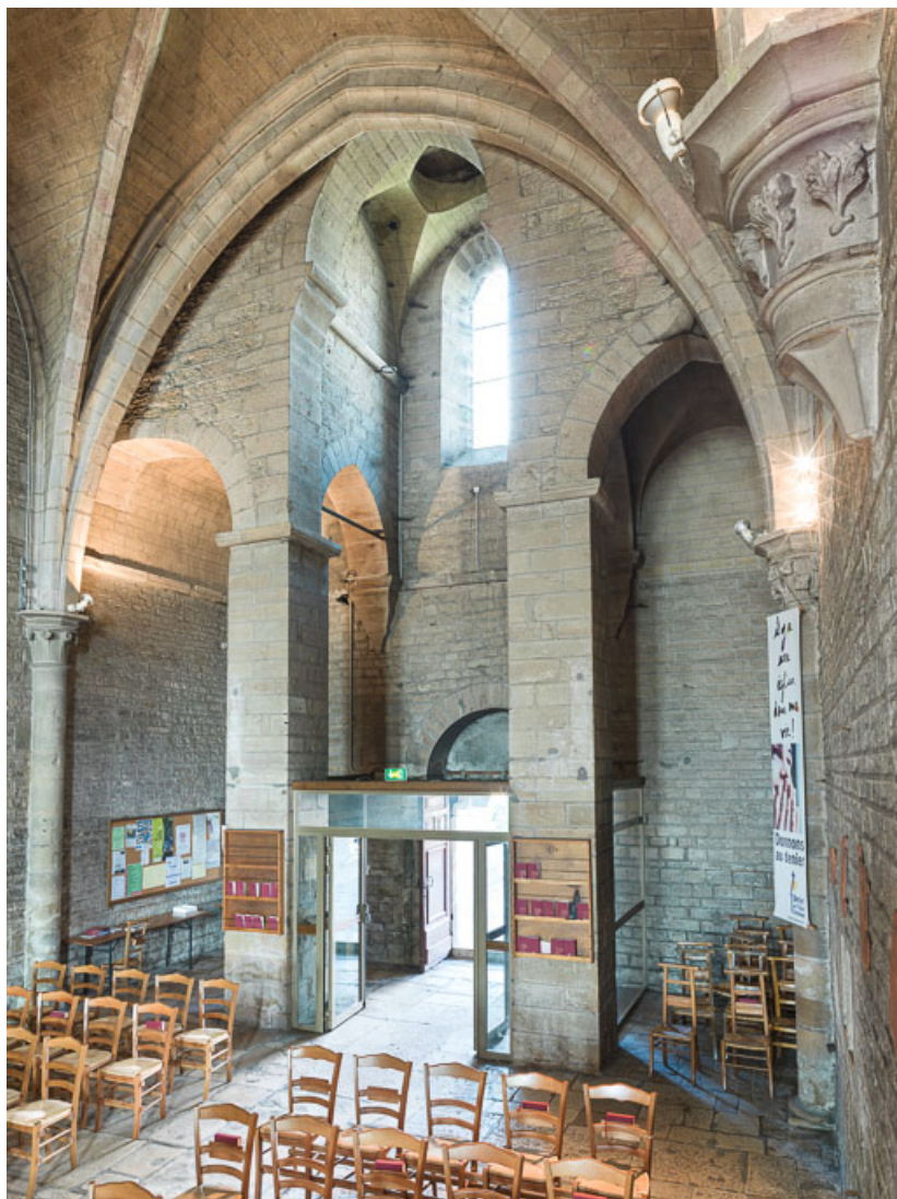
Vue du massif de maçonnerie soutenant le clocher.