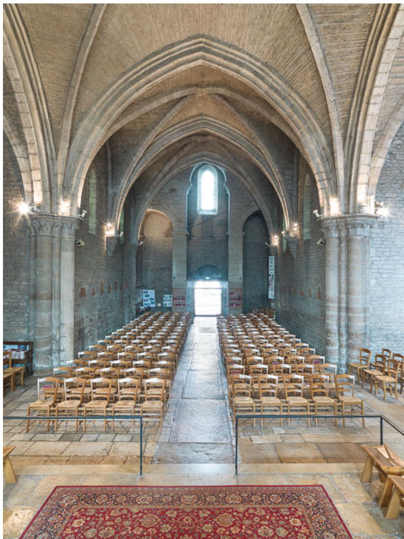
Vue de la nef, vers l'entrée.