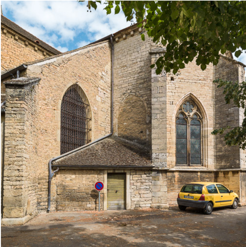
Vue du chevet et de la sacristie.