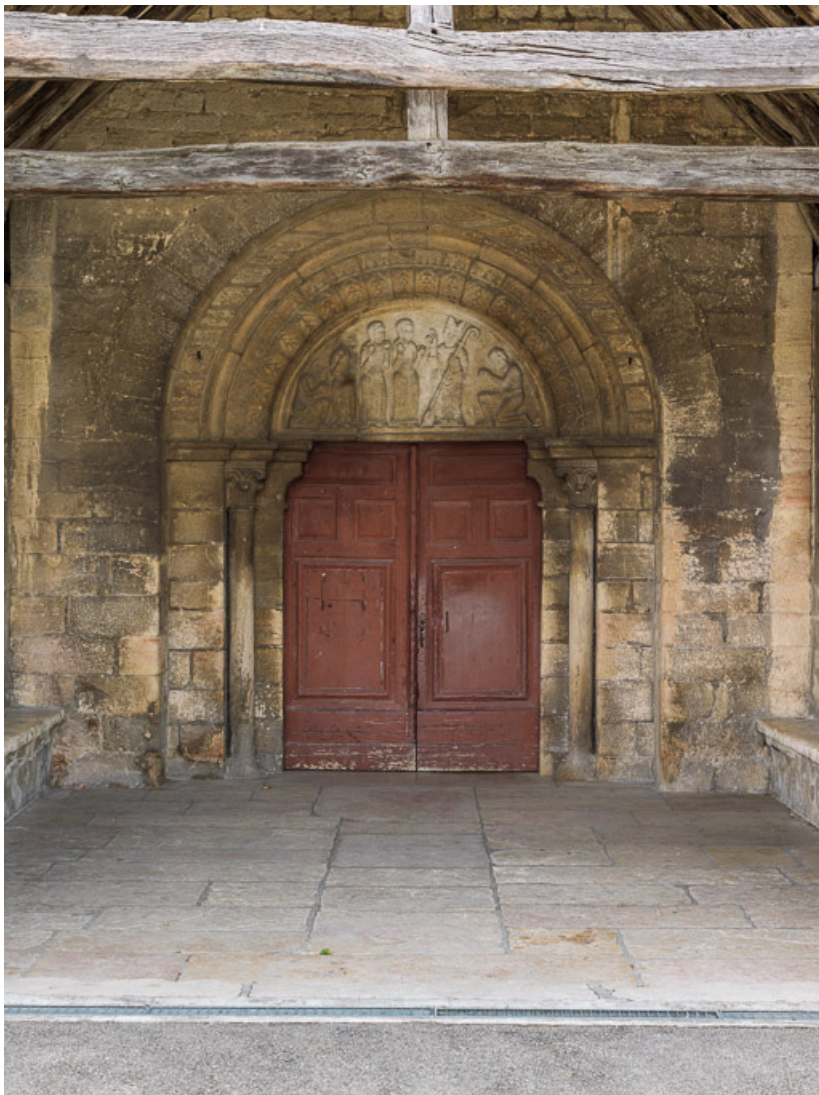
Porche : vue du portail et du tympan.