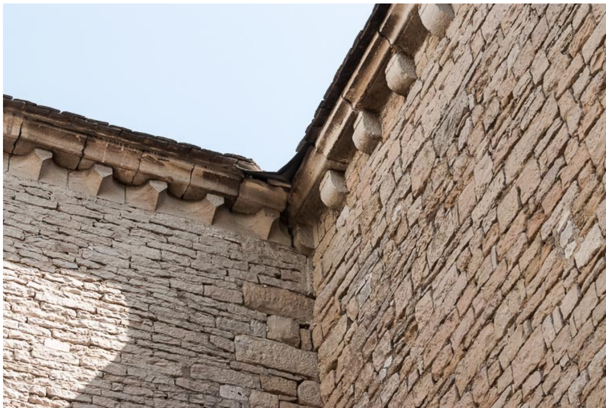
Corniche à modillons, à l'angle de la nef et du bras sud.