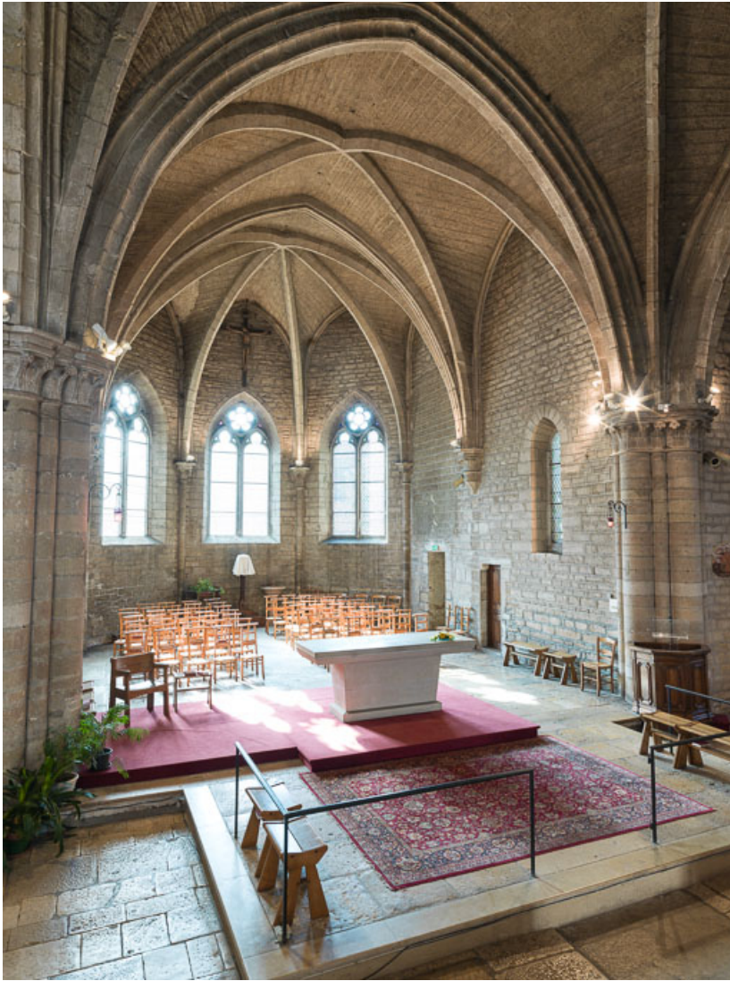
Vue du chœur.