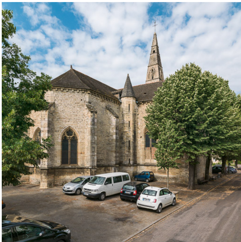
Vue du chevet et du bras nord.