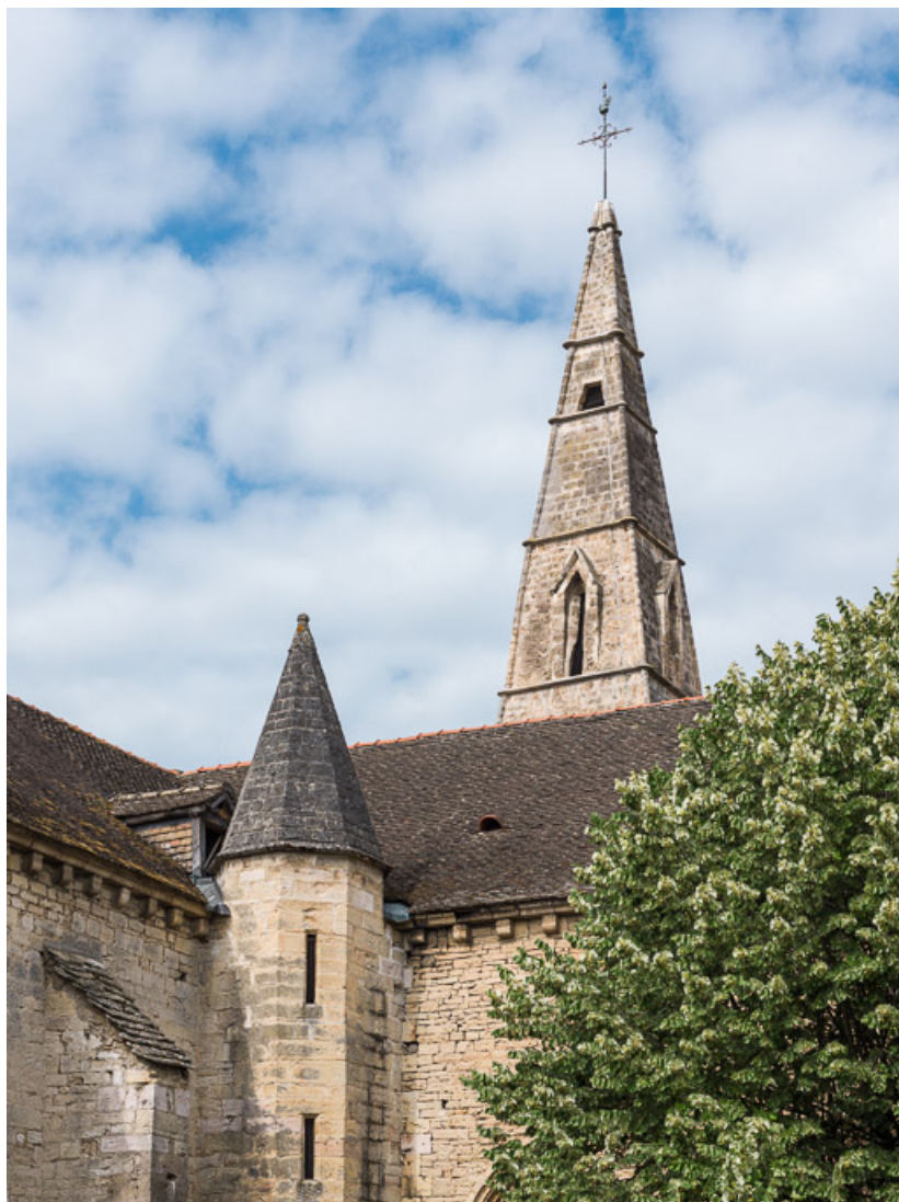
Vue du clocher, depuis l'arrière de l'église.