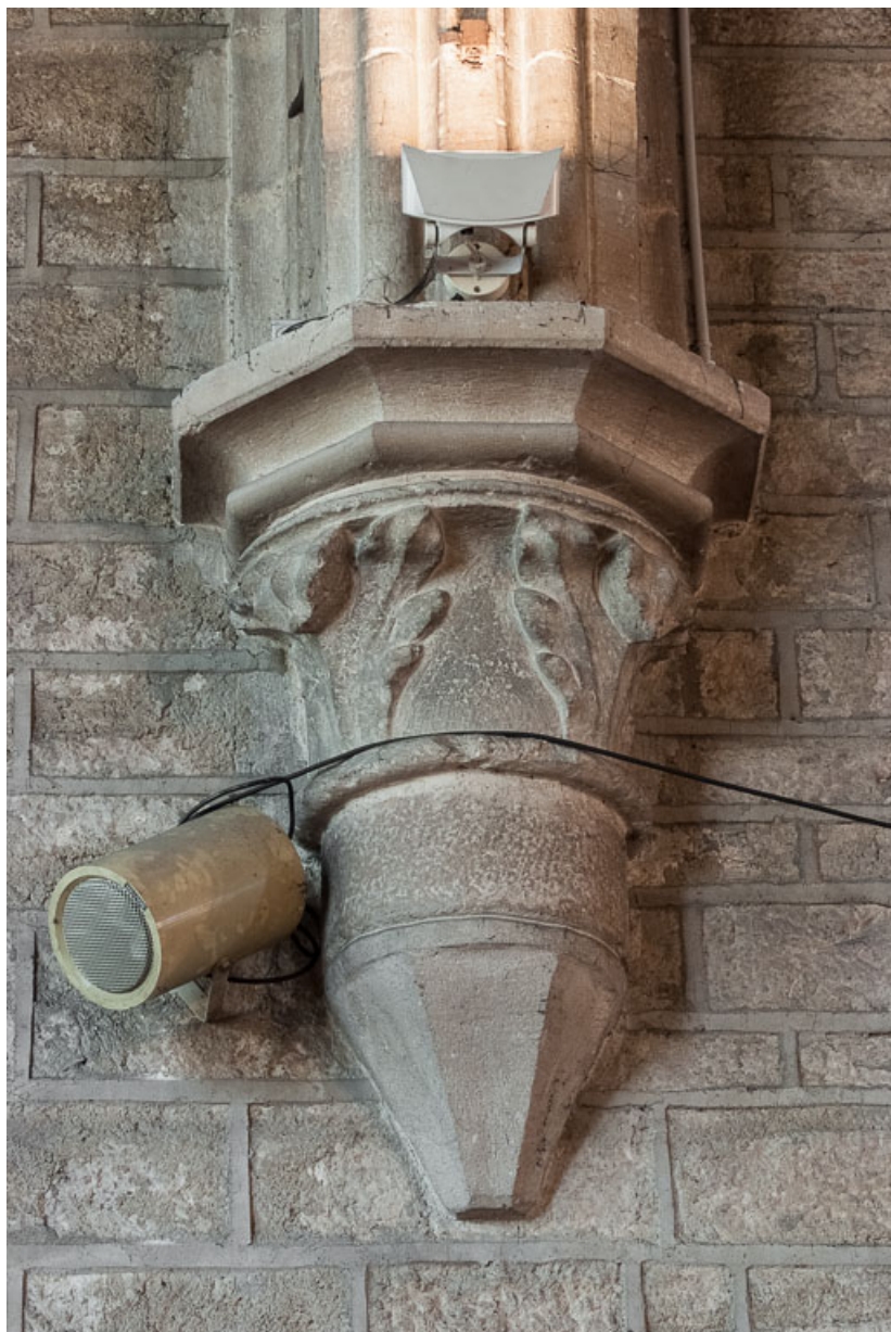
Vue d'un chapiteau de la nef.