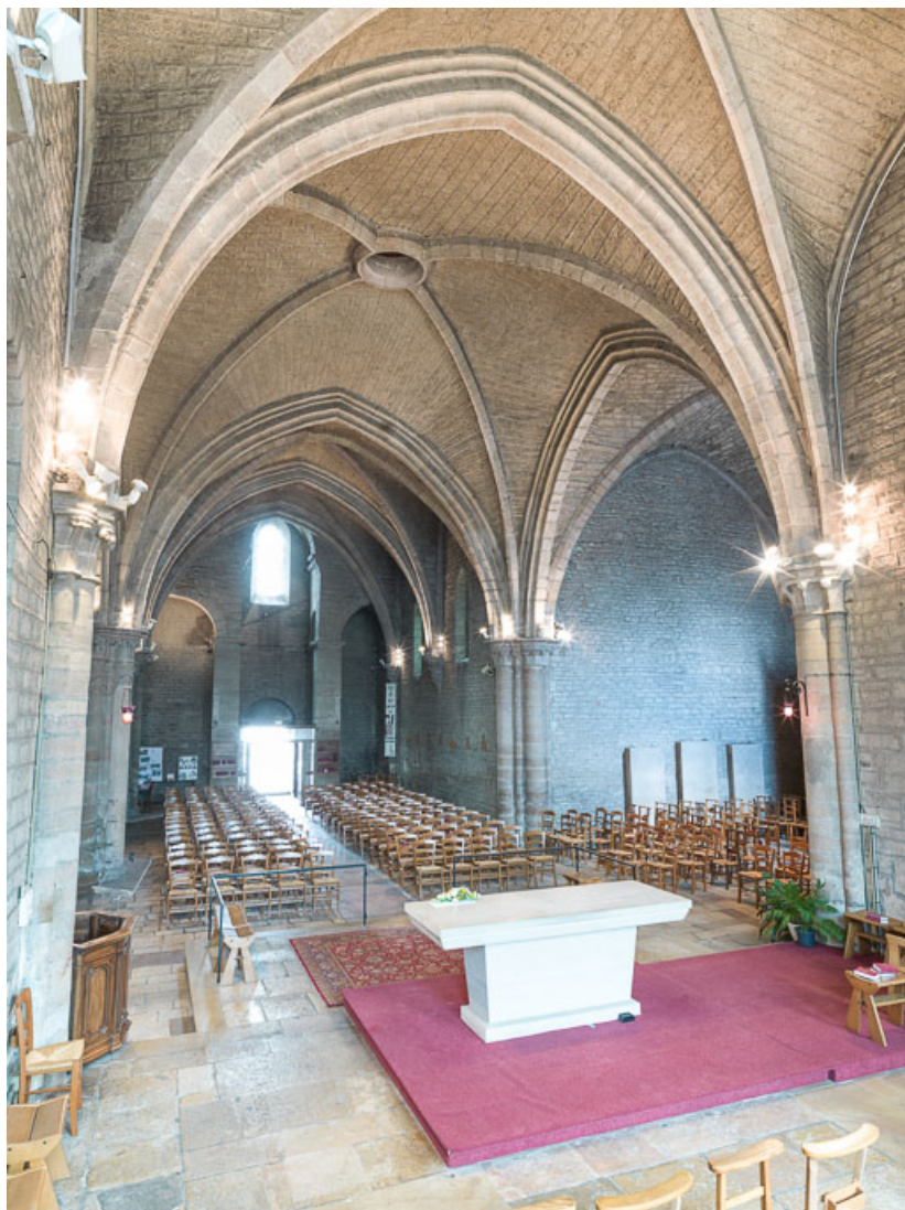
Vue du chœur, vers l'entrée.