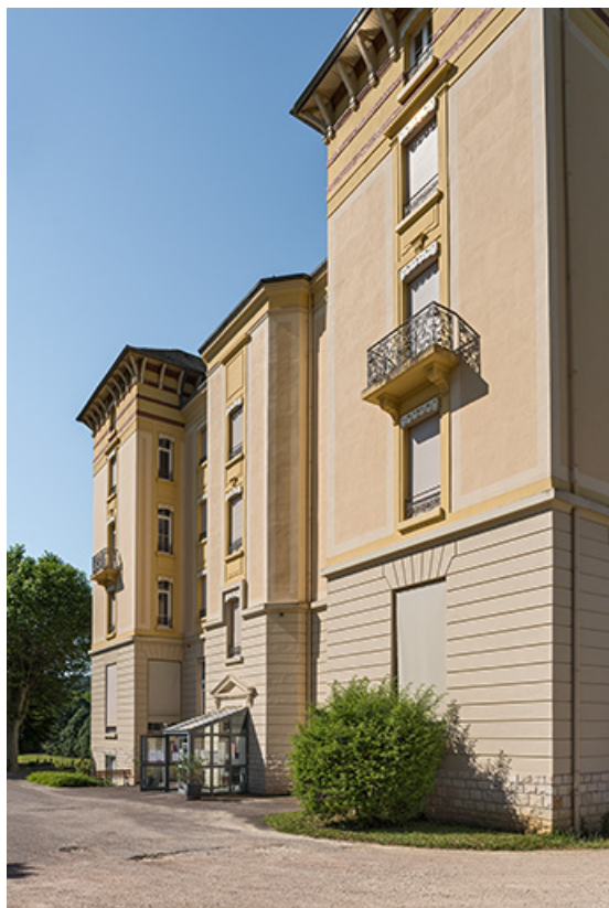
Façade nord-est avec l'entrée de l'escalier.