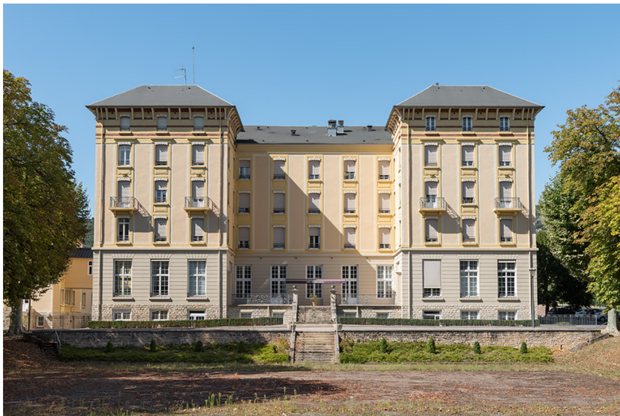
Façade principale sur le parc.