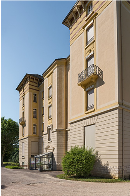
Façade nord-est avec l'entrée de l'escalier.