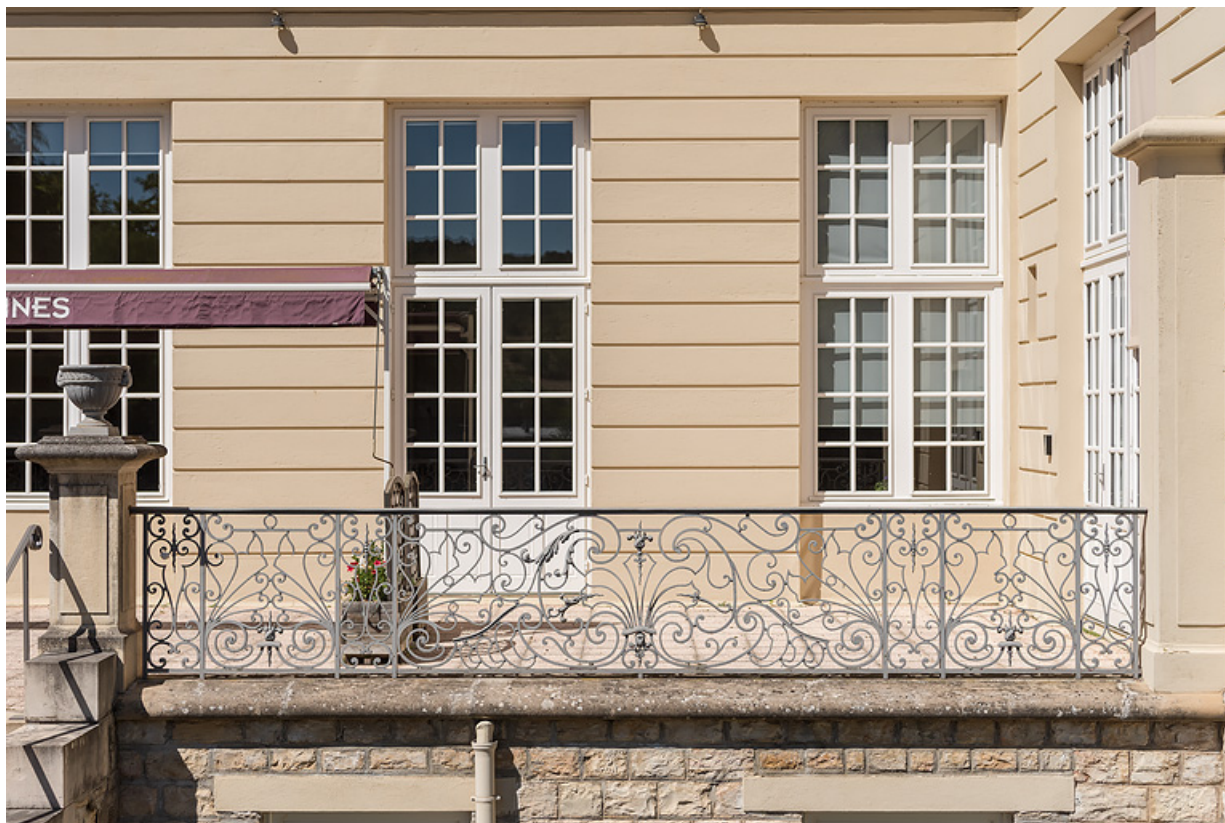
Garde-corps de la terrasse en façade principale, partie droite.