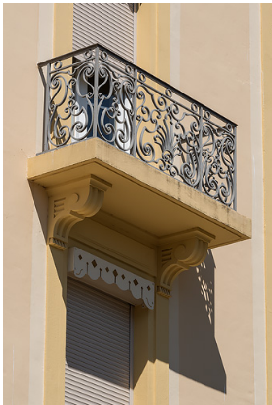
Balcon à l'extrémité est de l'aile nord.