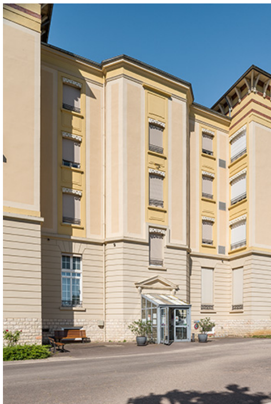
Façade nord-est avec l'entrée de l'escalier.