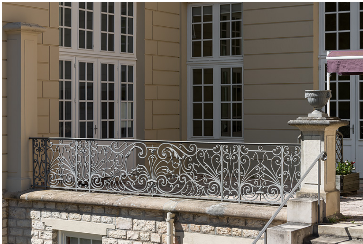
Garde-corps de la terrasse en façade principale, partie gauche.