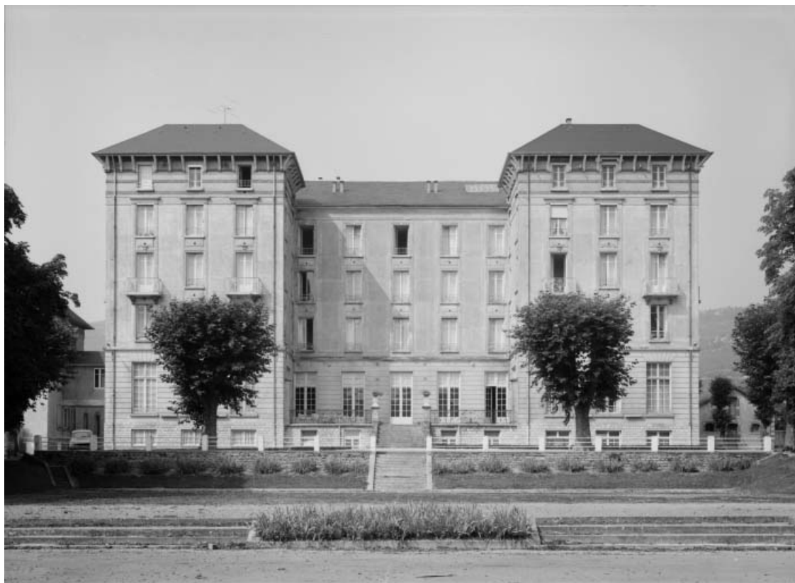
Grand Hôtel des Bains.