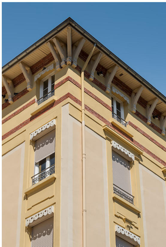
Détail du décor de la façade (angle de l'extrémité est de l'aile nord).