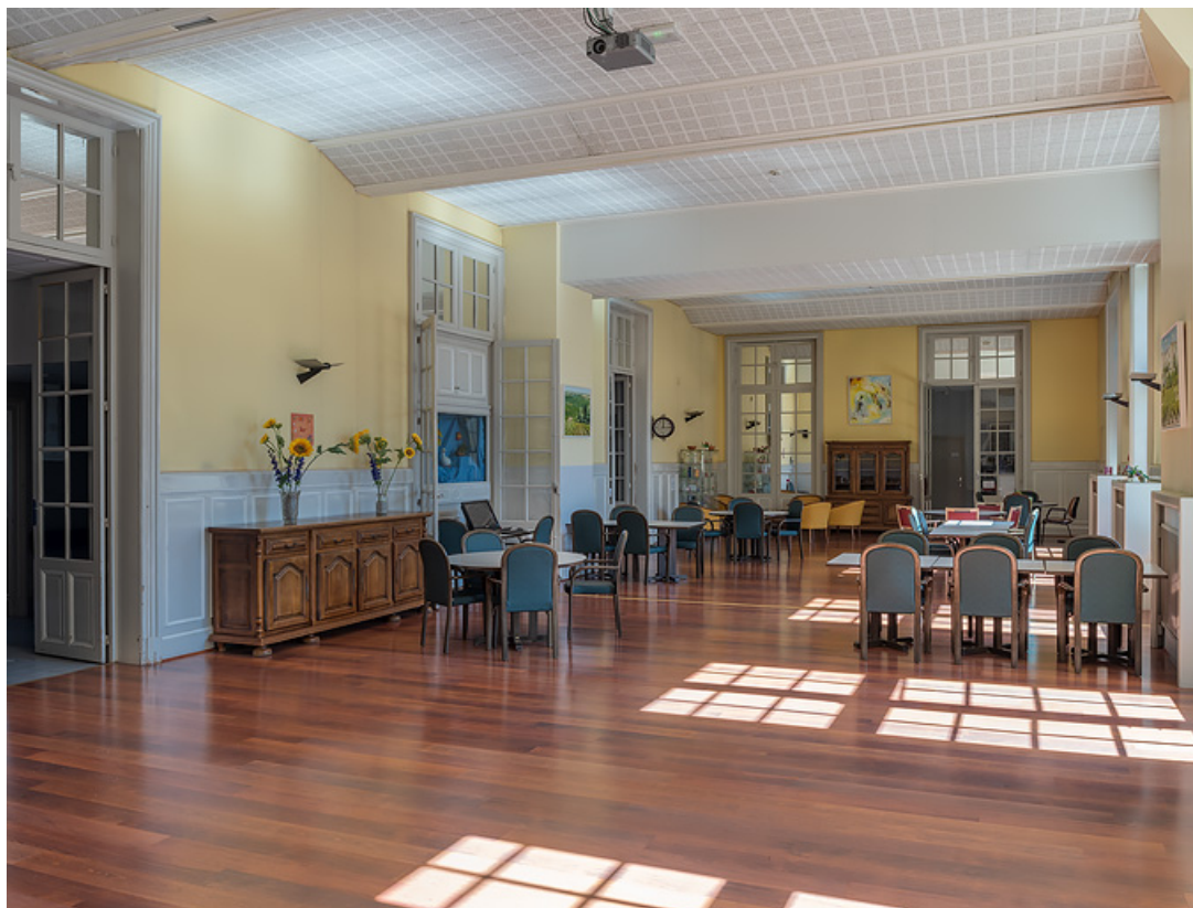
Grande salle du rez-de-chaussée.