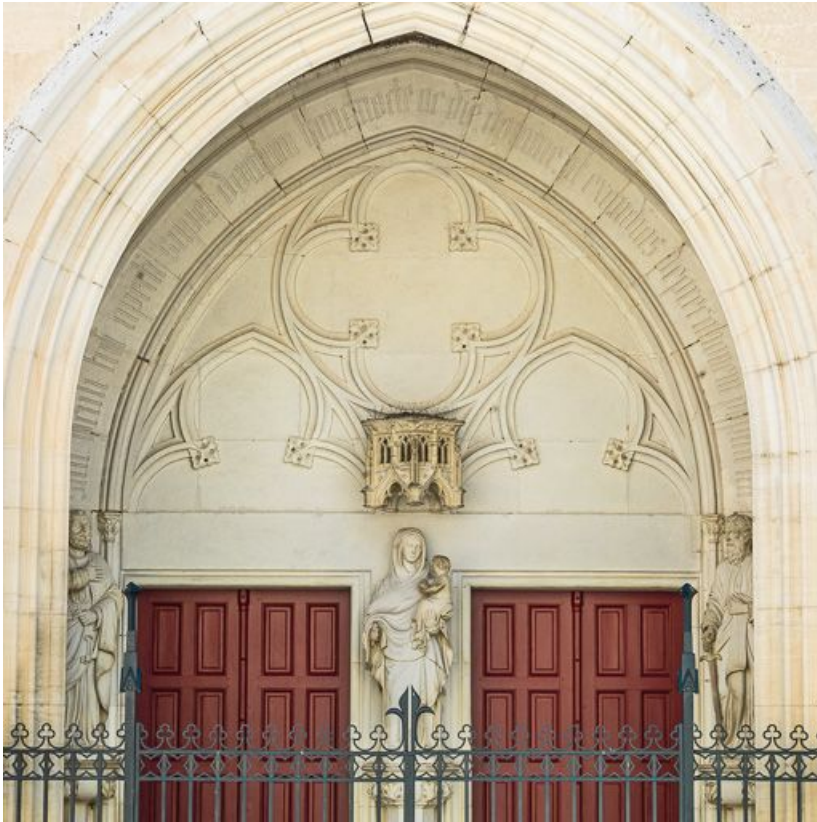
Portail: détail du tympan.

21, Meursault place de l' Hôtel de Ville