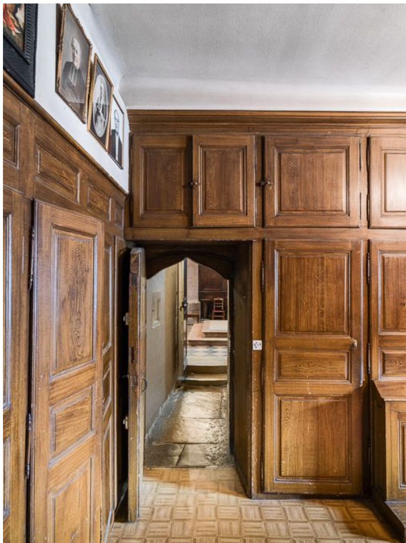
Vue du couloir menant au chœur depuis la sacristie.

21, Meursault place de l' Hôtel de Ville