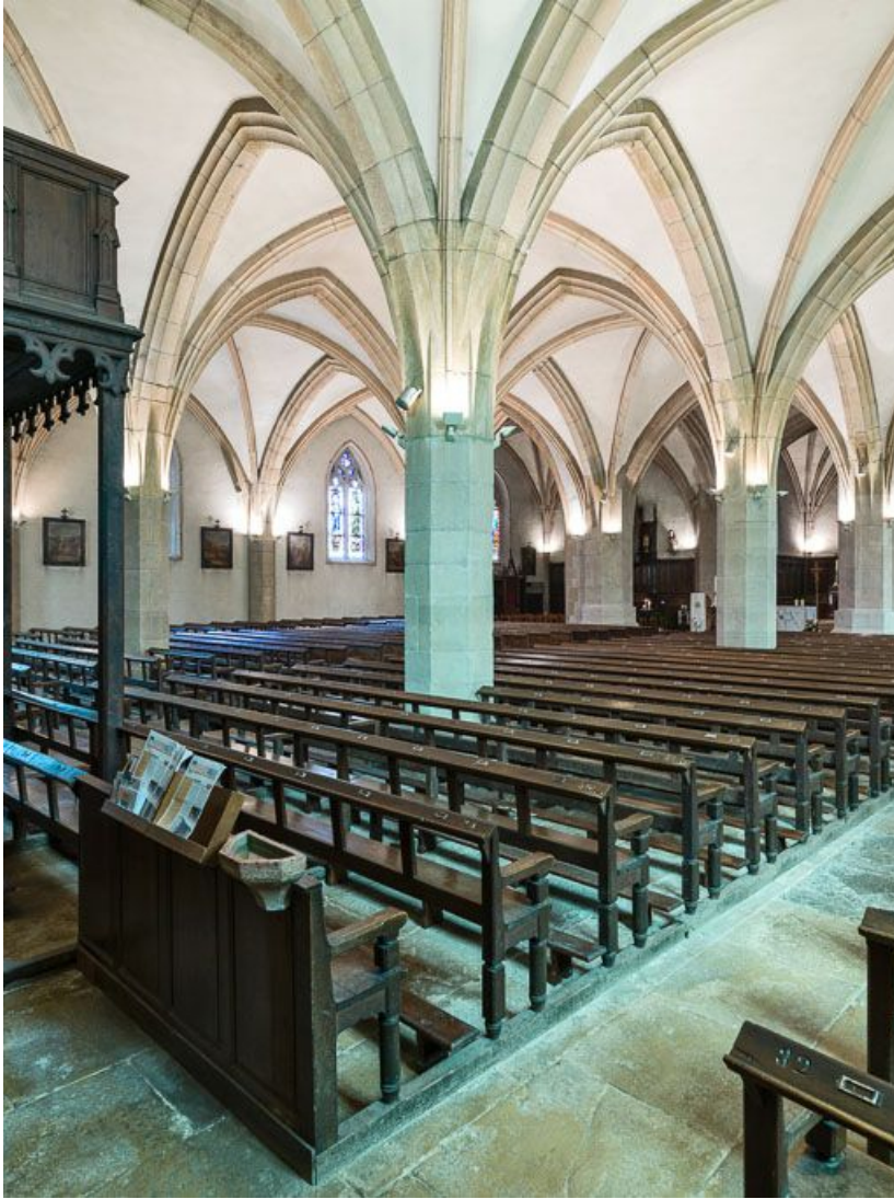
Vue d'ensemble depuis le bas côté droit.

21, Meursault place de l' Hôtel de Ville