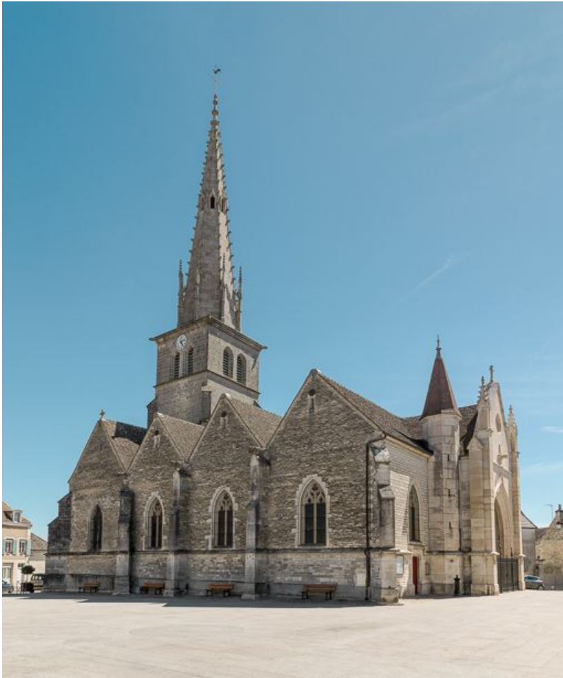
Vue d'ensemble de l'élévation nord.

21, Meursault place de l' Hôtel de Ville