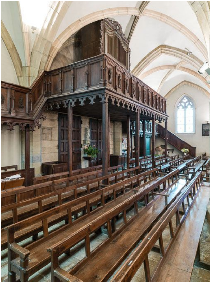
Vue de trois quarts de la tribune d'orgue.

21, Meursault place de l' Hôtel de Ville