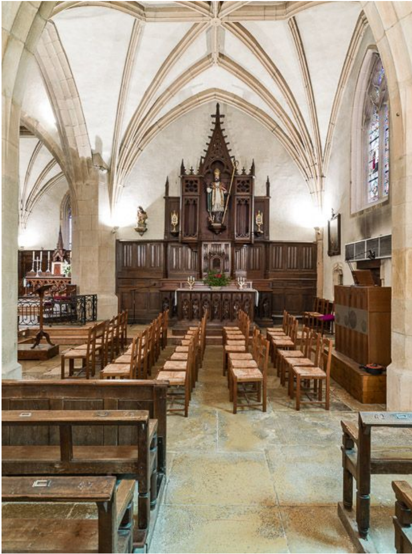
Vue d'ensemble de la chapelle du bas côté droit.

21, Meursault place de l' Hôtel de Ville