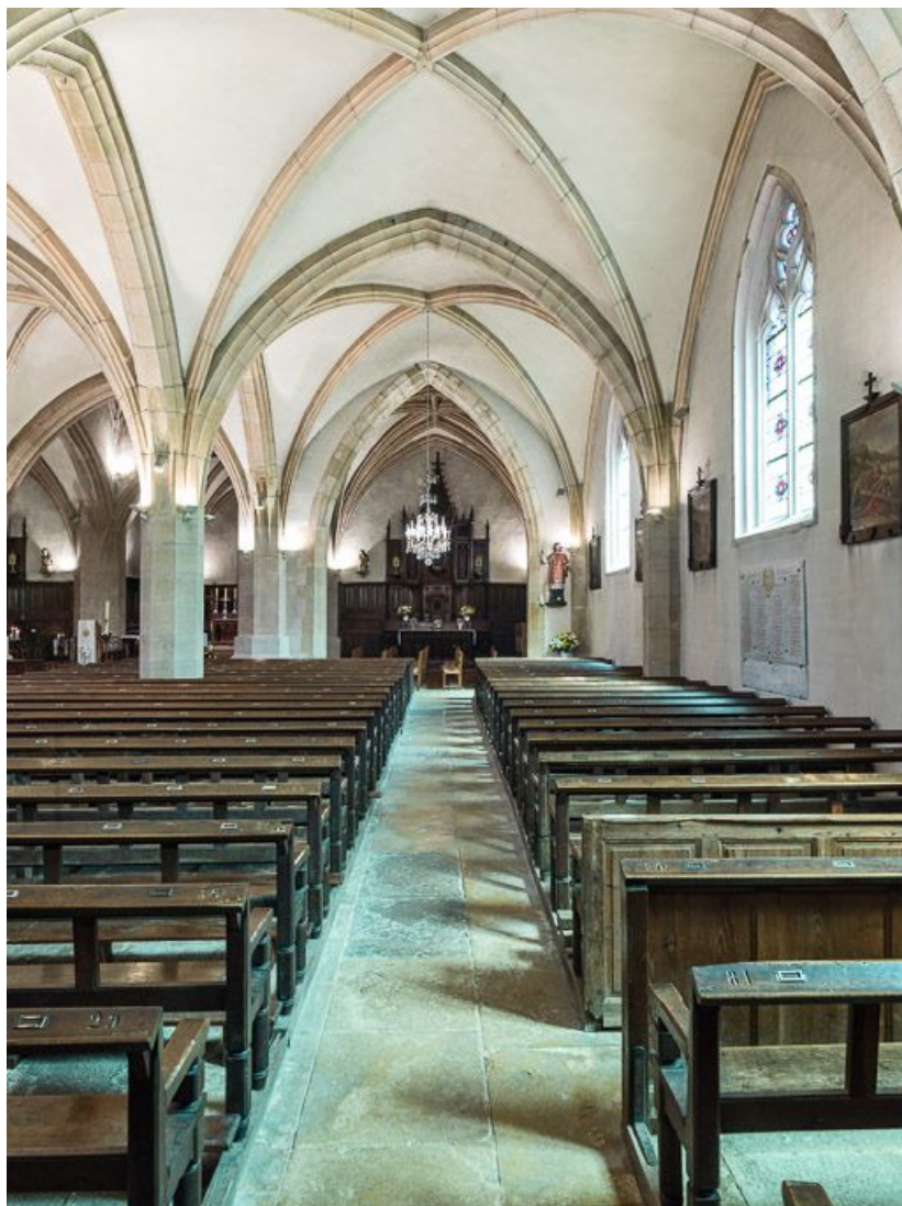
Vue d'ensemble du bas côté sud.

21, Meursault place de l' Hôtel de Ville