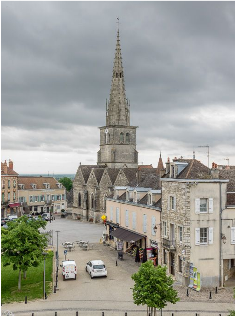
Vue d'ensemble depuis la mairie.

21, Meursault place de l' Hôtel de Ville