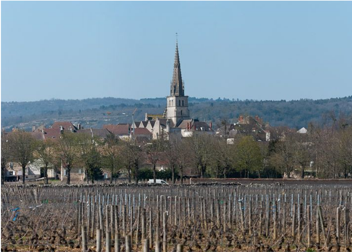
L'église et les vignes au premier plan.

21, Meursault place de l' Hôtel de Ville