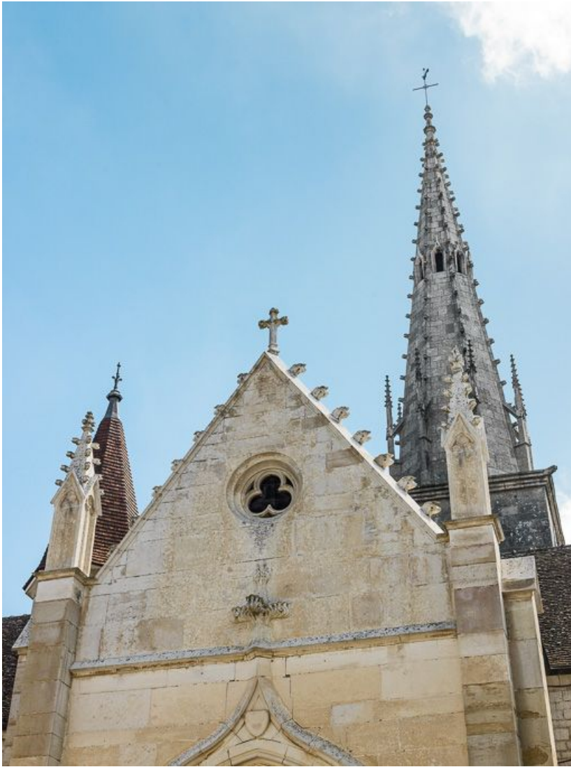
Façade ouest et flèche du clocher.

21, Meursault place de l' Hôtel de Ville