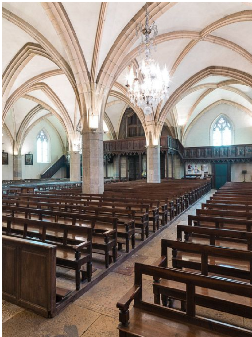
Vue d'ensemble des trois vaisseaux depuis la chapelle du bas côté gauche. 21, Meursault place de l' Hôtel de Ville