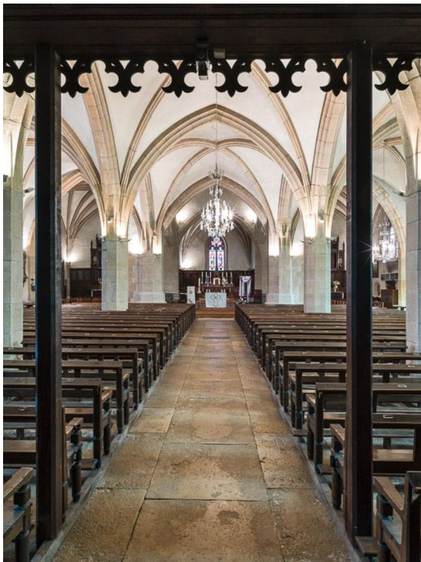
Vue de la nef, vers le chœur.

21, Meursault place de l' Hôtel de Ville