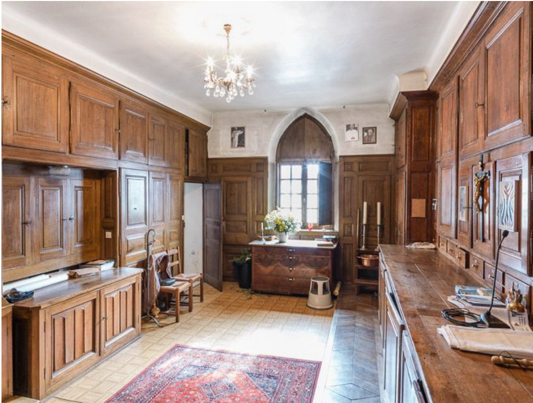
Vue d'ensemble de la sacristie.

21, Meursault place de l' Hôtel de Ville