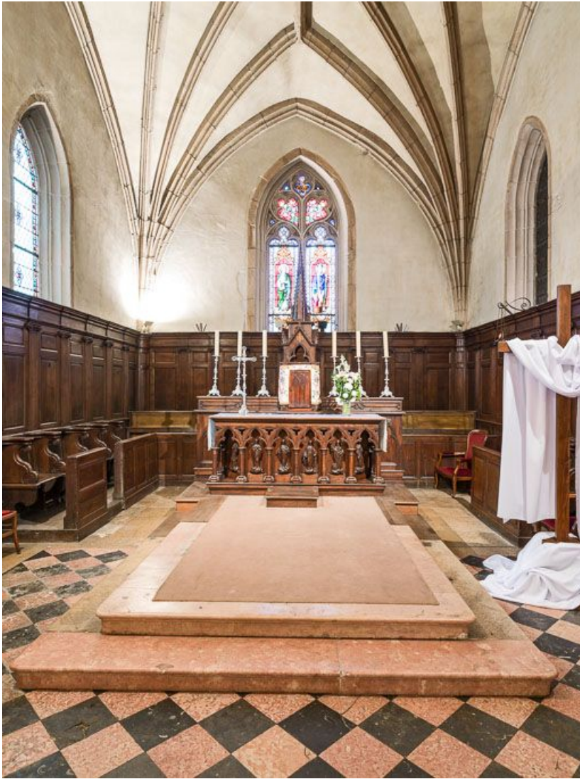
Vue d'ensemble du chœur.

21, Meursault place de l' Hôtel-de-Ville