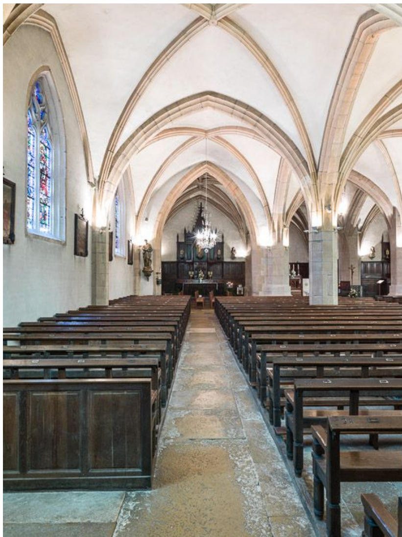
Vue d'ensemble du bas côté nord.

21, Meursault place de l' Hôtel de Ville