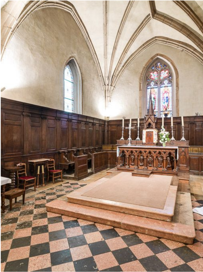
Vue du chœur de trois quarts gauche.

21, Meursault place de l' Hôtel de Ville