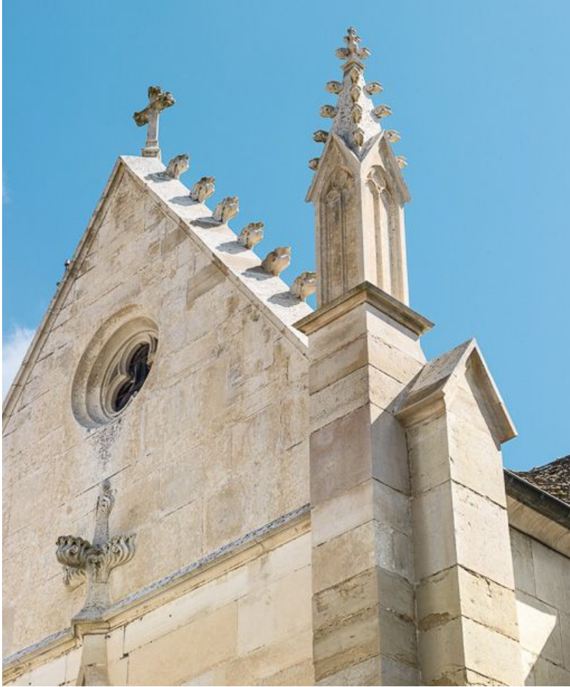
Façade: détail des pinacles et crochets.

21, Meursault place de l' Hôtel de Ville