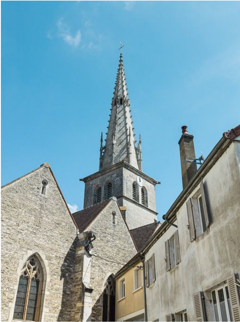
Elévation sud et clocher.

21, Meursault place de l' Hôtel de Ville