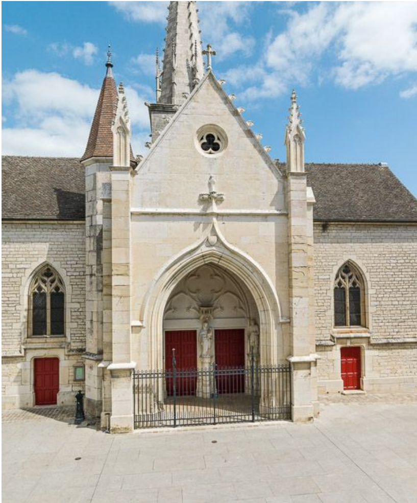
Vue d'ensemble de la façade ouest.

21, Meursault place de l' Hôtel de Ville