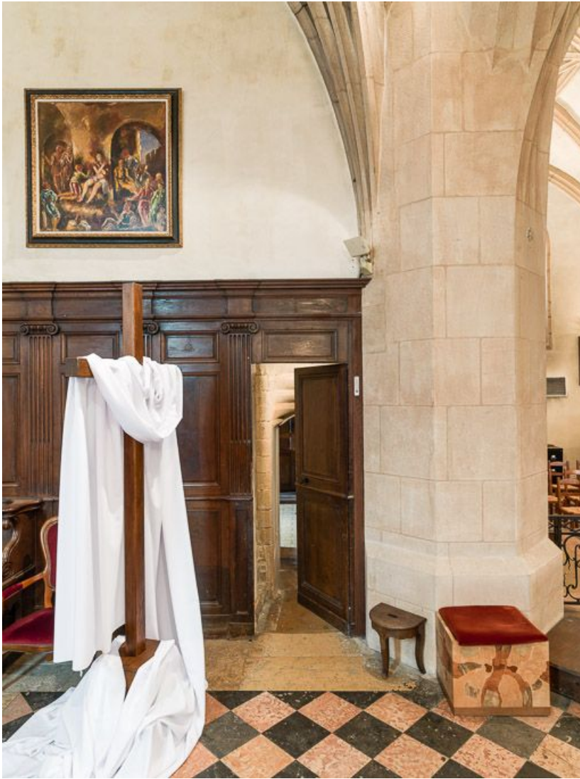
Porte de la sacristie.

21, Meursault place de l' Hôtel de Ville