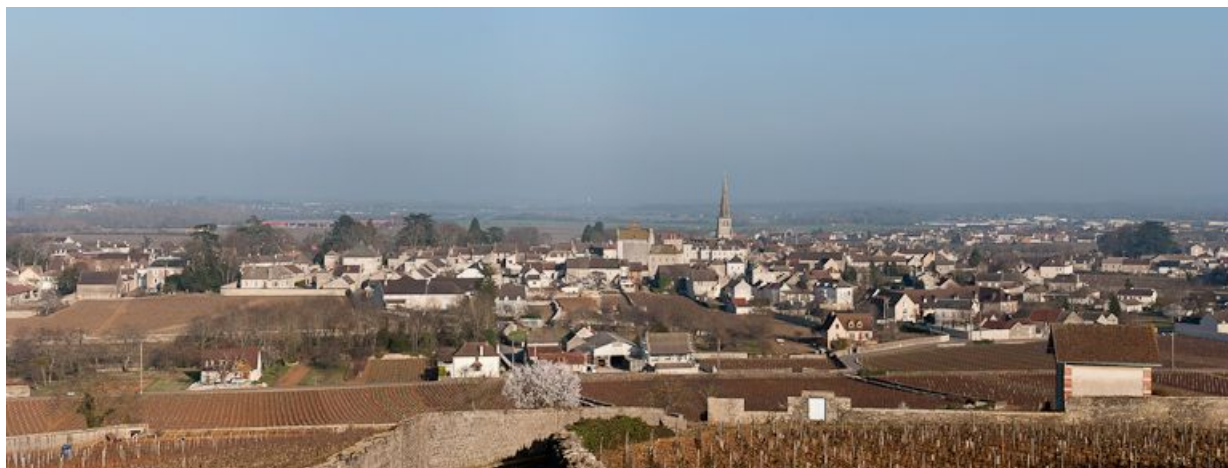
Le village de Meursault avec, au centre, l'église.

21, Meursault place de l' Hôtel de Ville