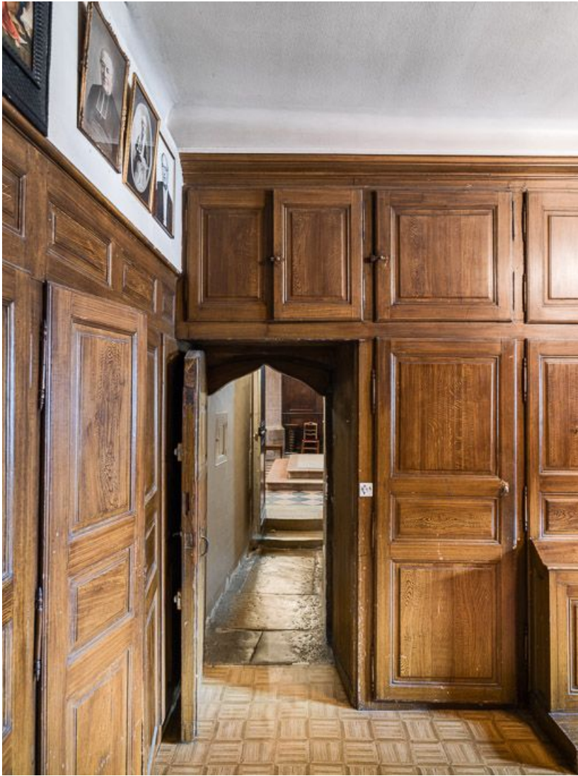
Vue du couloir menant au chœur depuis la sacristie.

21, Meursault place de l' Hôtel de Ville