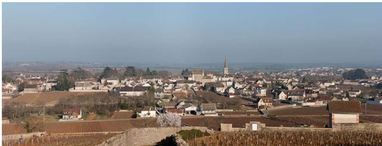
Le village de Meursault avec, au centre, l'église.

21, Meursault place de l' Hôtel de Ville