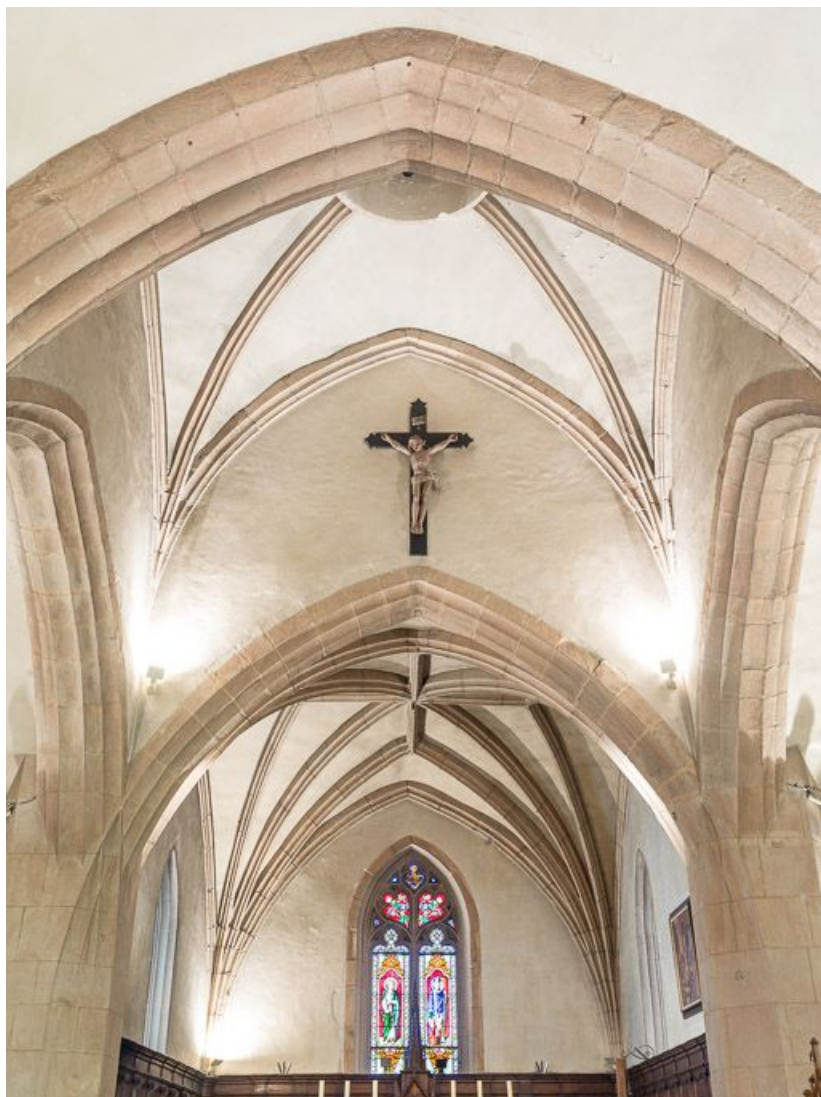
Voûtes du chœur et de la travée sous clocher.

21, Meursault place de l' Hôtel de Ville