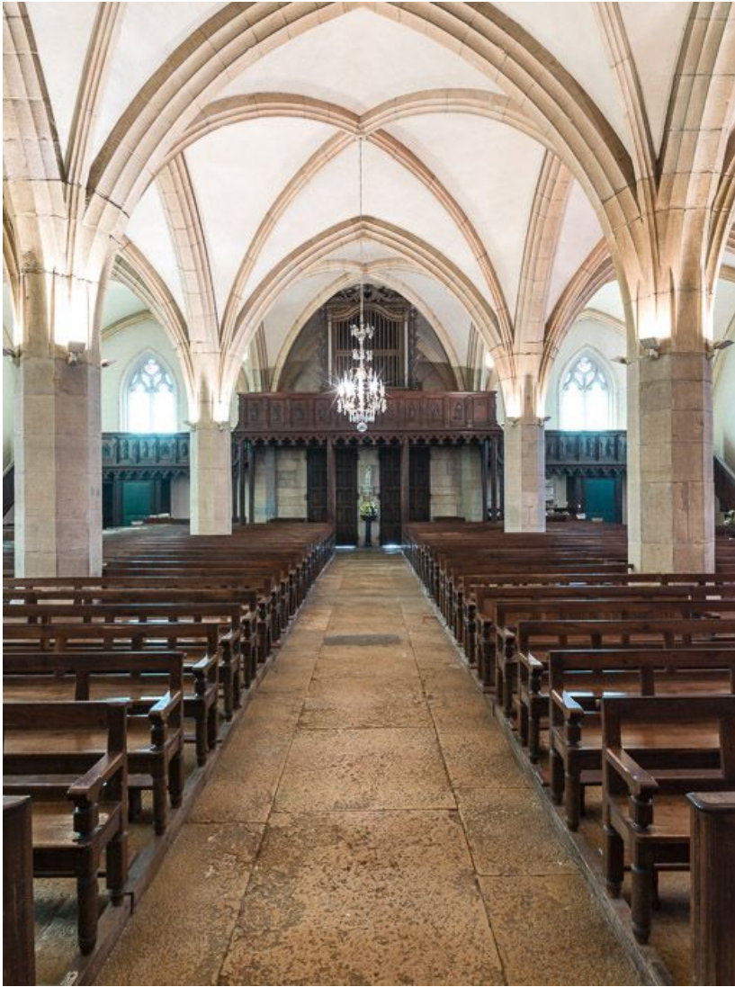
Vue d'ensemble depuis le chœur.

21, Meursault place de l' Hôtel de Ville