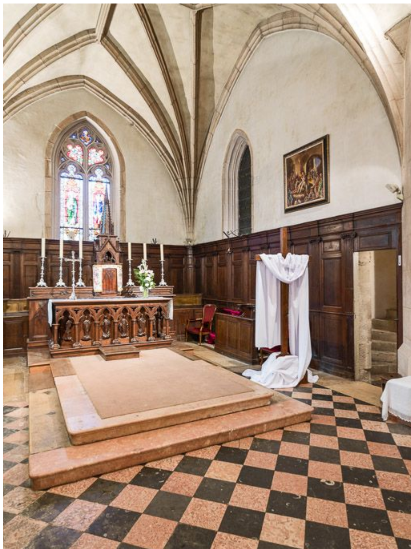
Vue du chœur de trois quarts droit. 21, Meursault place de l' Hôtel de Ville