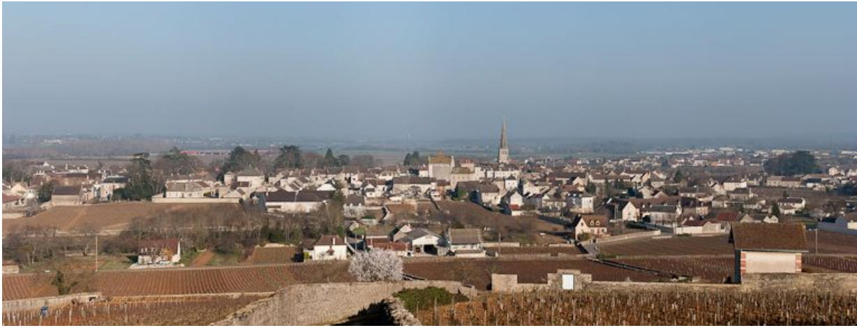
Le village de Meursault avec, au centre, l'église.

21, Meursault place de l' Hôtel de Ville