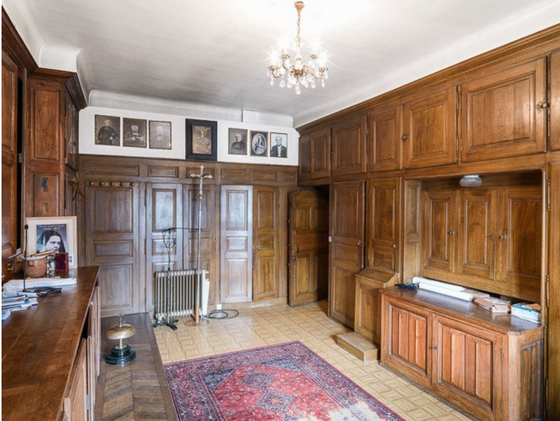
Vue d'ensemble de la sacristie.

21, Meursault place de l' Hôtel de Ville