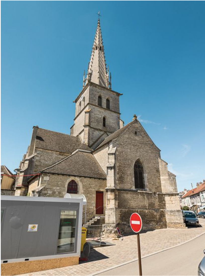
Vue d'ensemble du chevet.

21, Meursault place de l' Hôtel de Ville