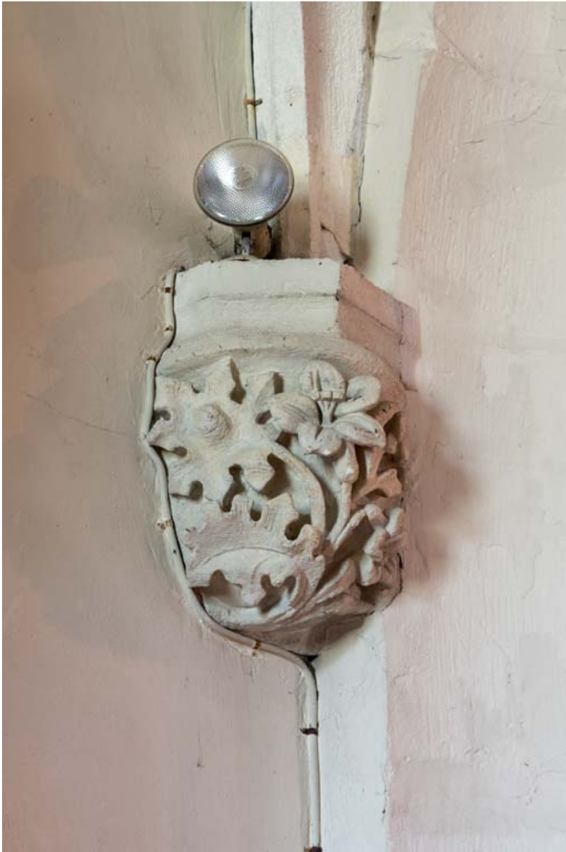
Chapelle nord : culot sud-est.