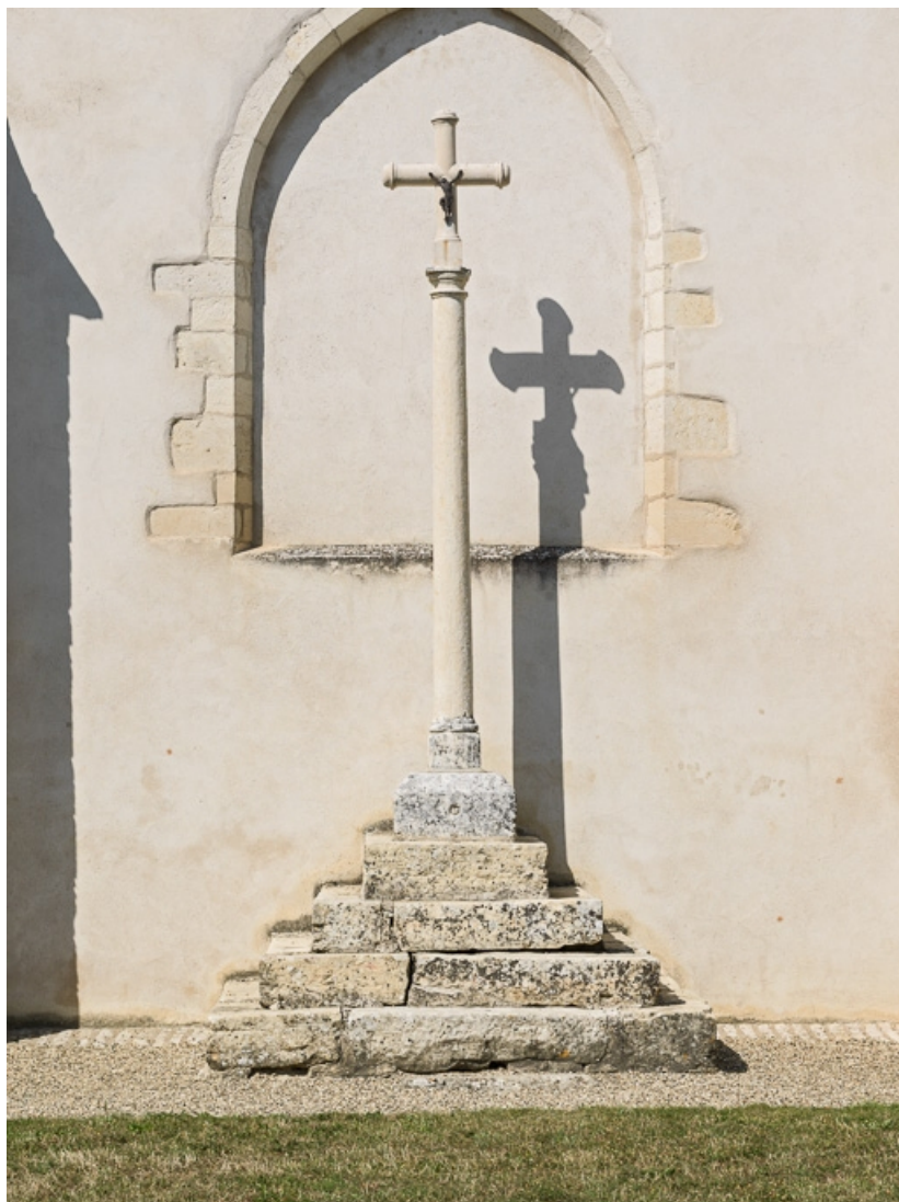
Croix monumentale contre le chevet. 21, Auxey-Duresses rue de la Commune