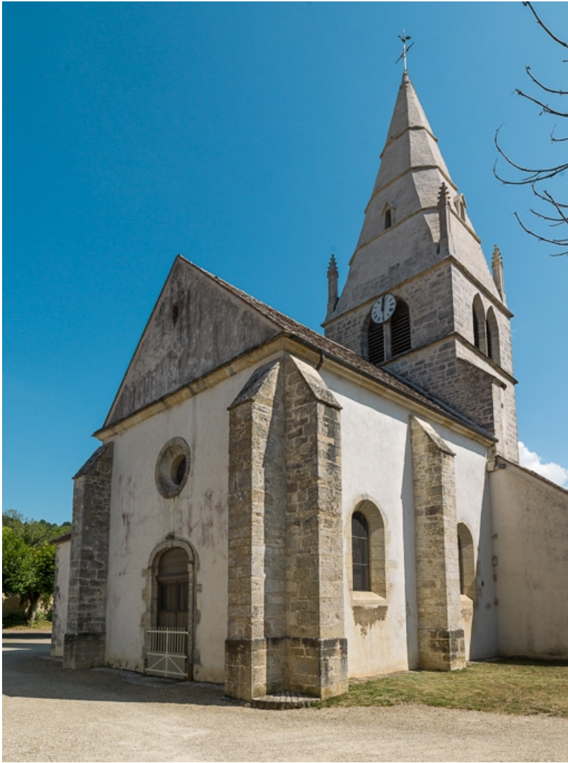
Façade et élévation sud.