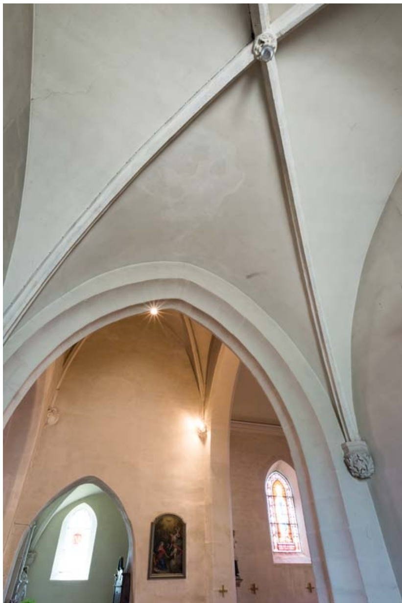
Culot et clef de voûte de la chapelle nord.