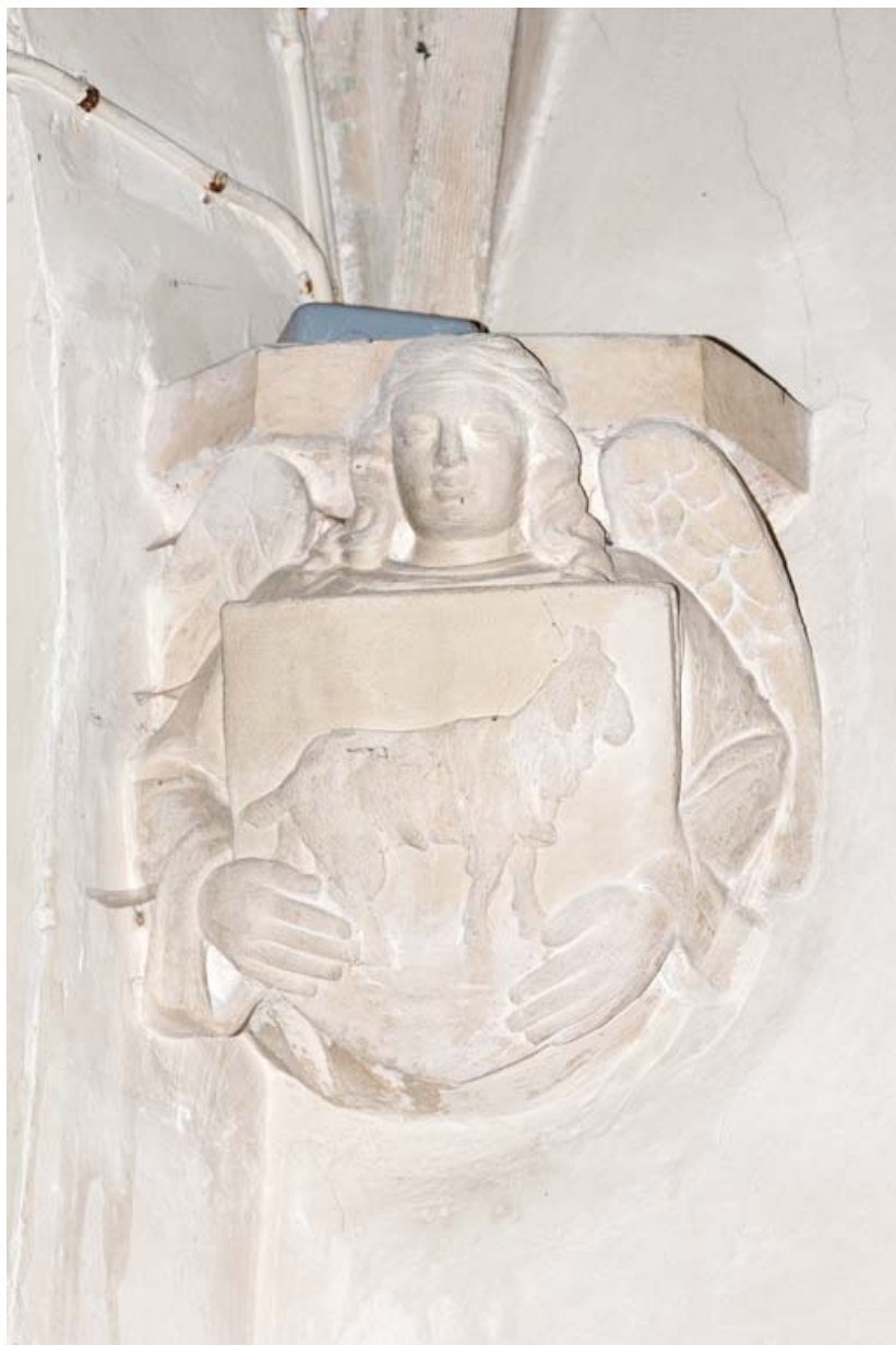
Culot au niveau de la croisée du transept et de la chapelle sud.