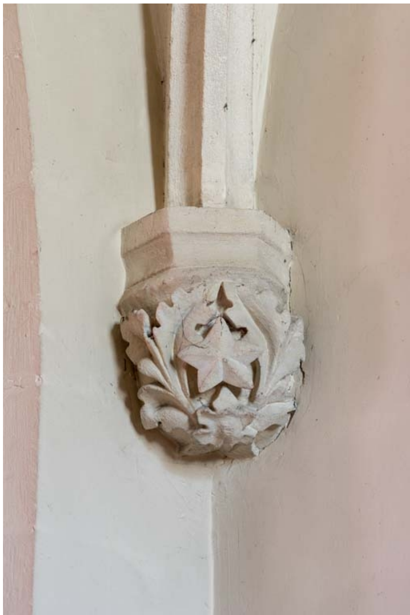
Chapelle nord : culot sud-ouest.