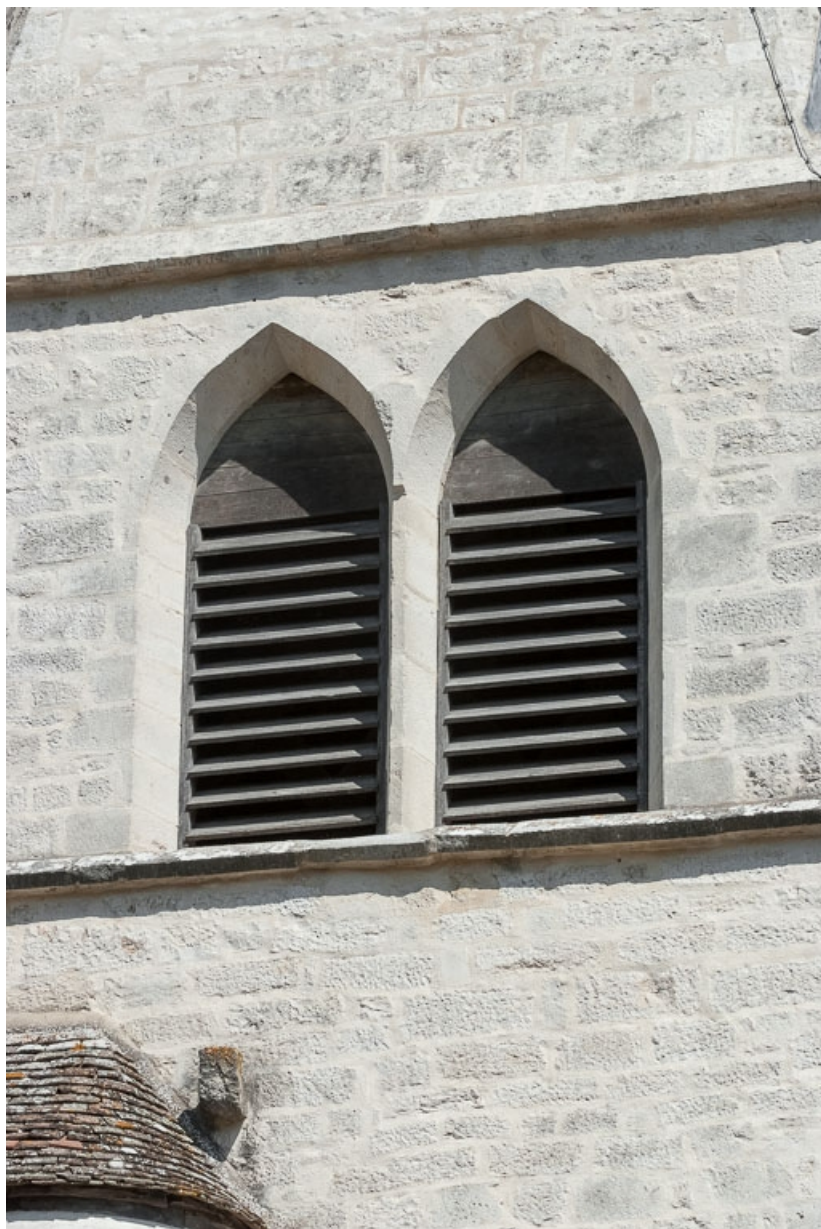
Clocher : détail de deux baies jumelées.