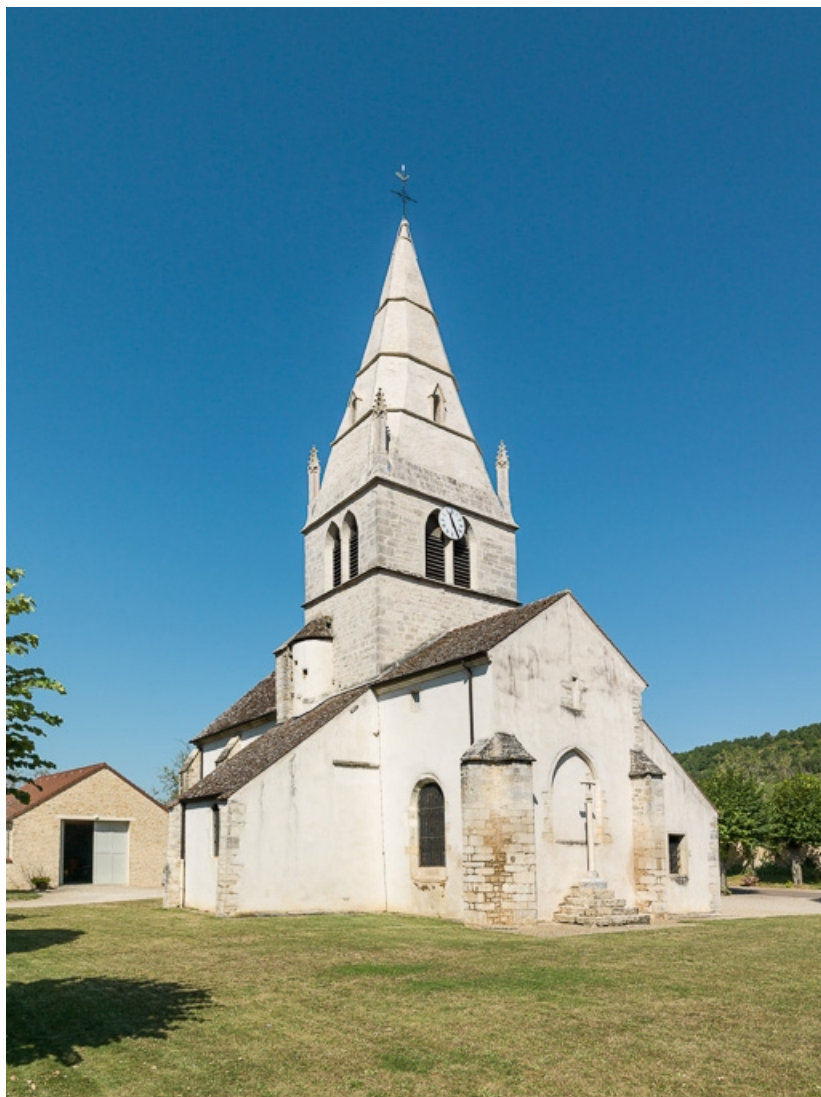
Vue de trois quarts côté chevet.