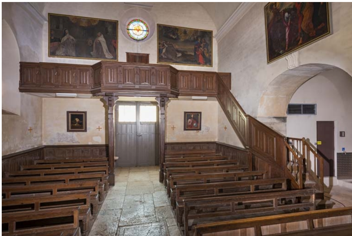
Vue d'ensemble depuis le chœur : la tribune.