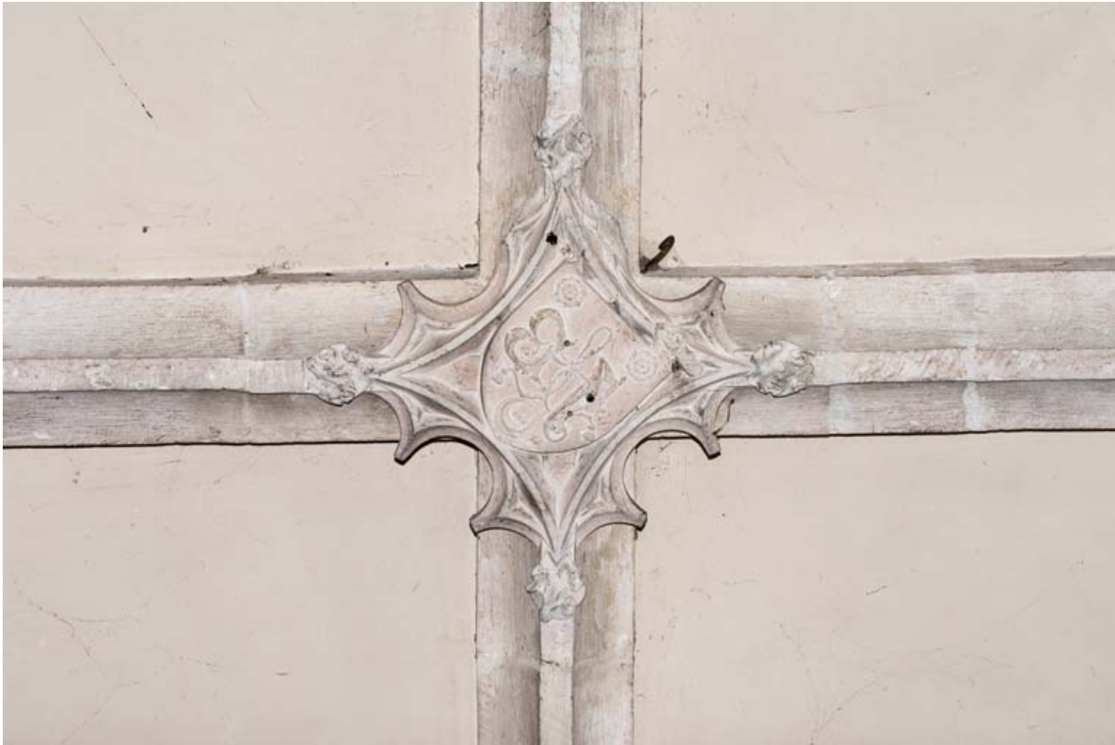
Clé de voûte du chœur.