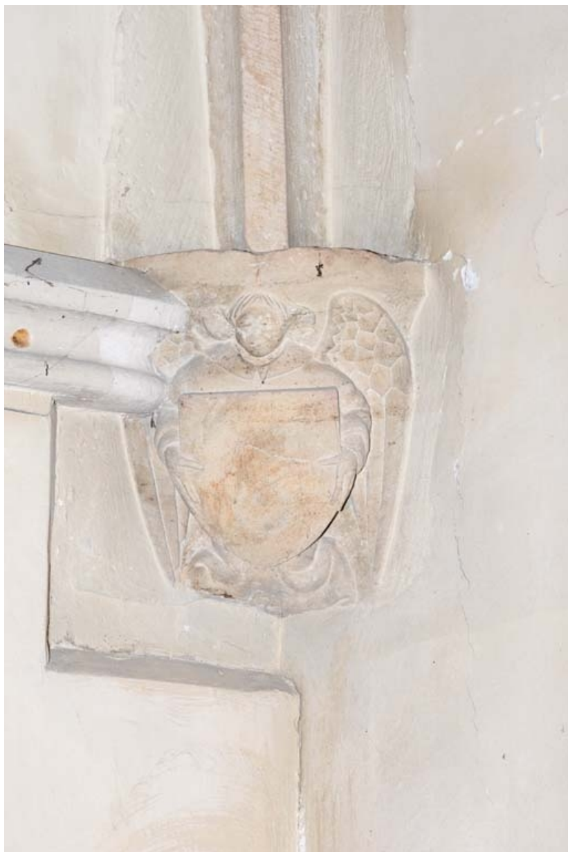
Culot représentant un ange portant un écu, à gauche dans le chœur.