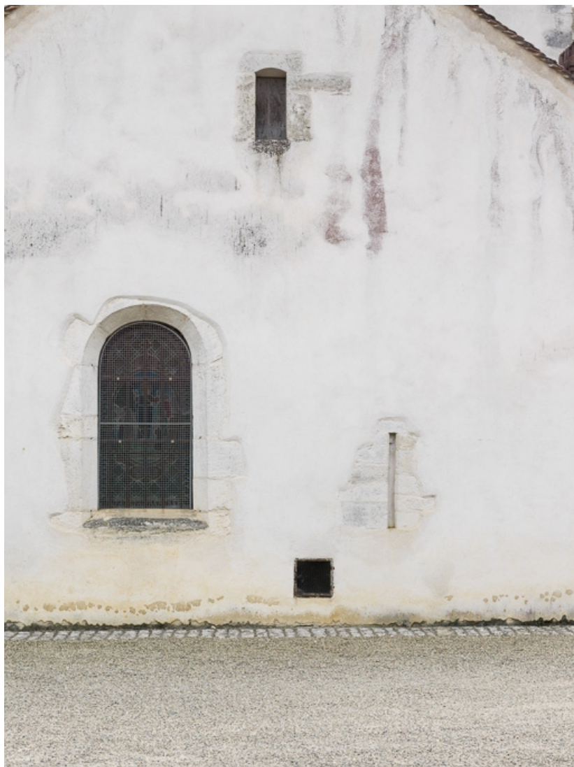
Détail de baies de l'élévation nord. On peut y voir une des deux archères. 21, Auxey-Duresses rue de la Commune