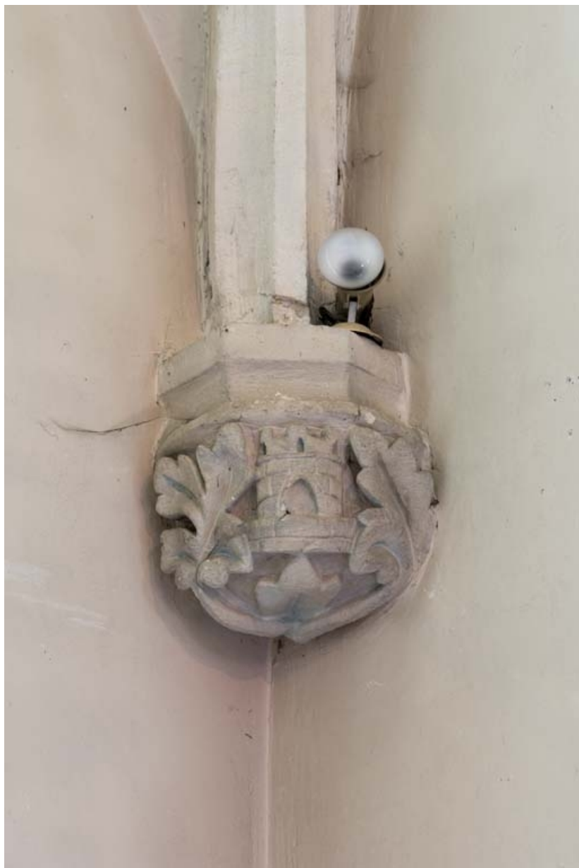
Chapelle nord : culot de l'angle nord-est.