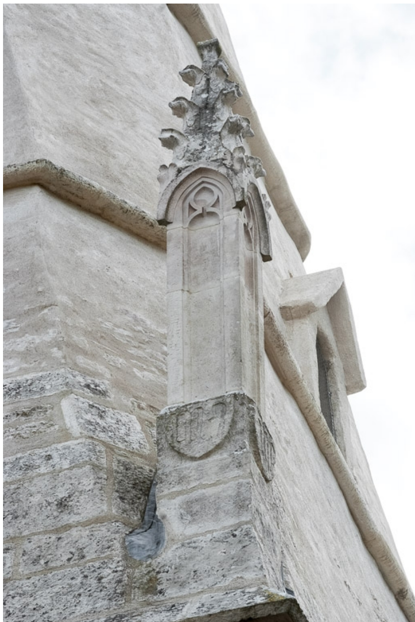
Clocher, pinnacle nord-ouest.