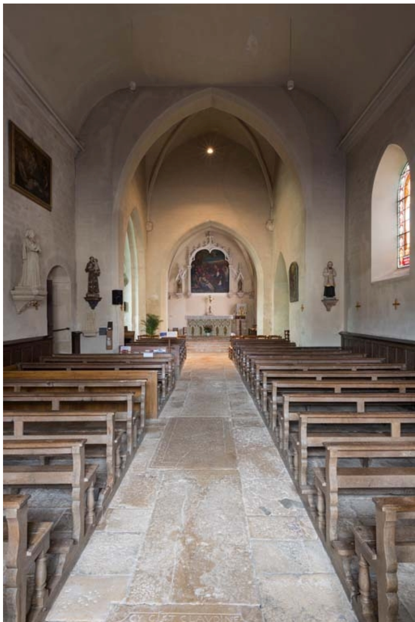
Vue d'ensemble de l'intérieur de l'église depuis la porte d'entrée.