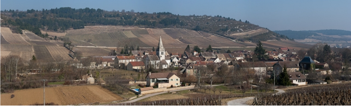
L'église paroissiale, au coeur du village d'Auxey.