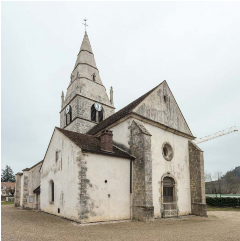
Vue d'ensemble de trois-quarts.