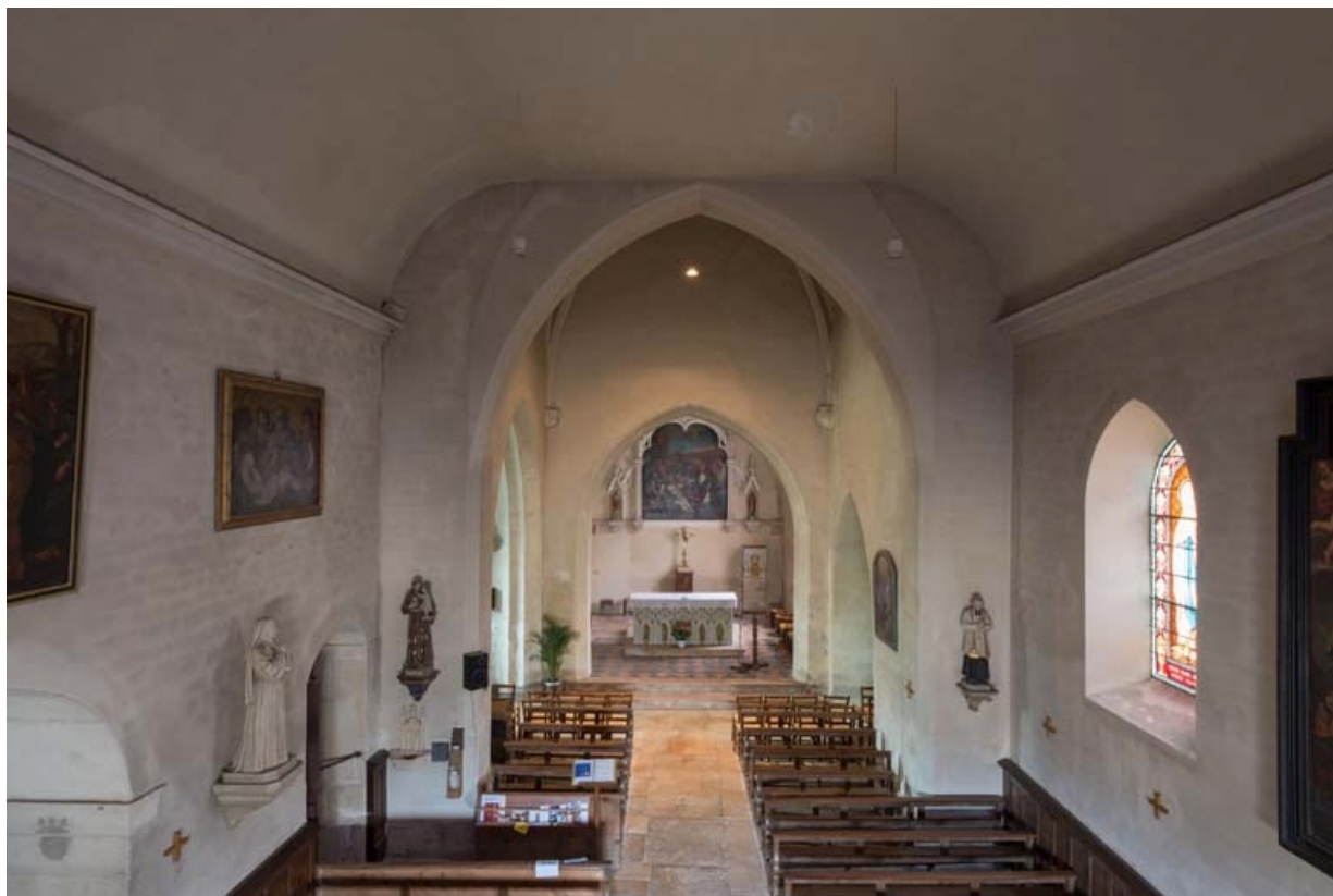
Vue d'ensemble depuis la tribune de l'entrée.