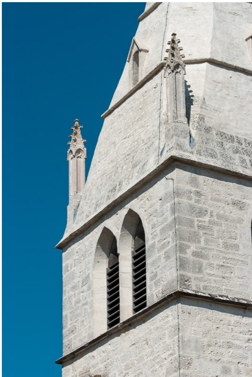
Clocher, détail des baies et des pinacles.