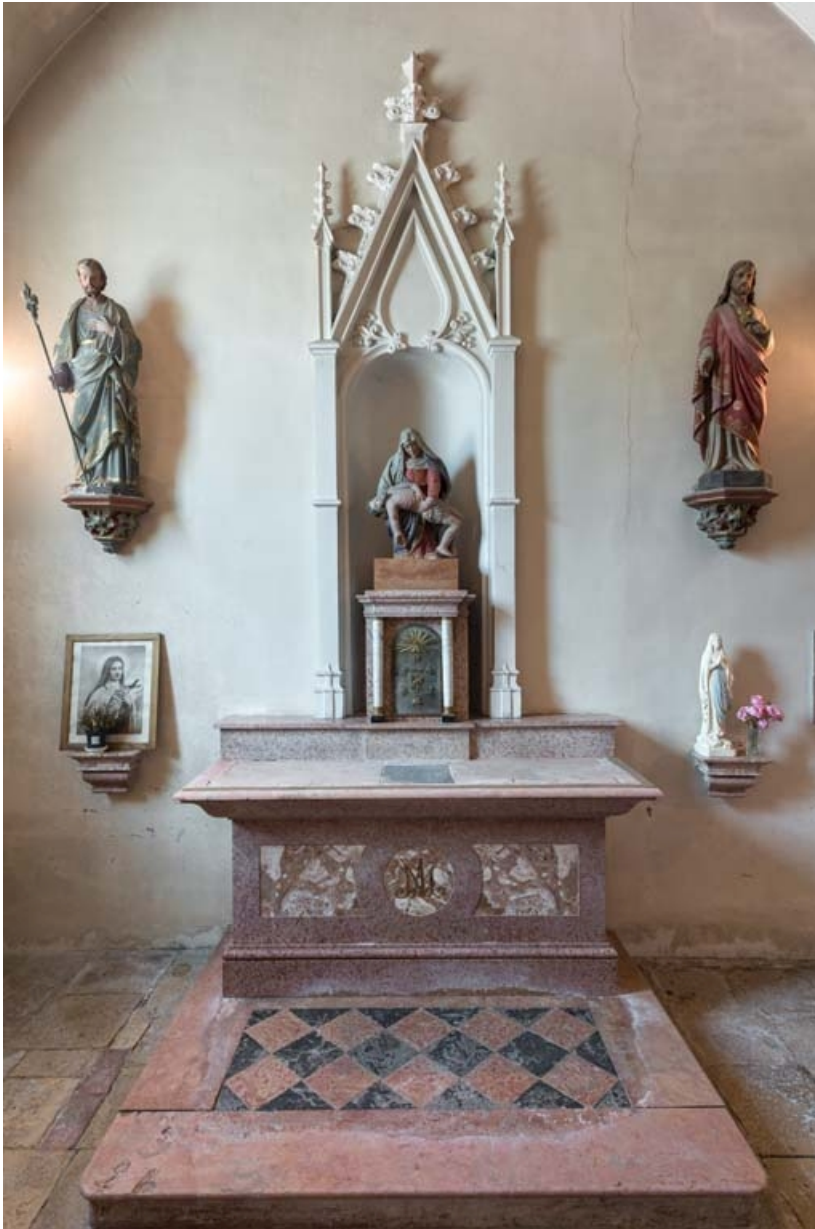
Chapelle nord : autel secondaire.