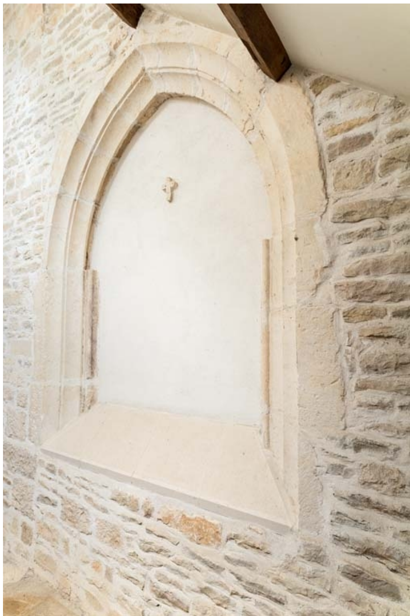
Baie en arc brisé bouchée dans le sas de l'entrée.