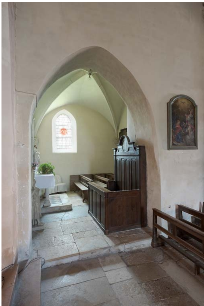
Chapelle sud et le banc de fabrique, vus du chœur.