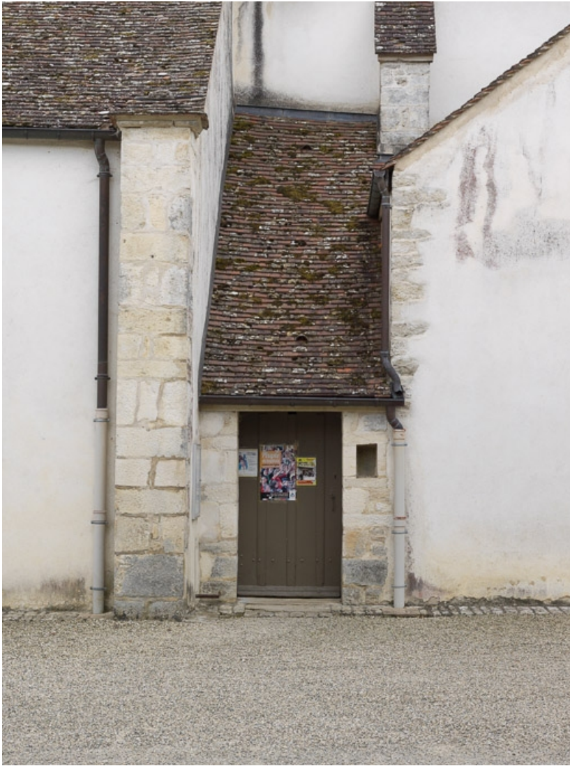
Porte latérale nord : porte et sas d'entrée.