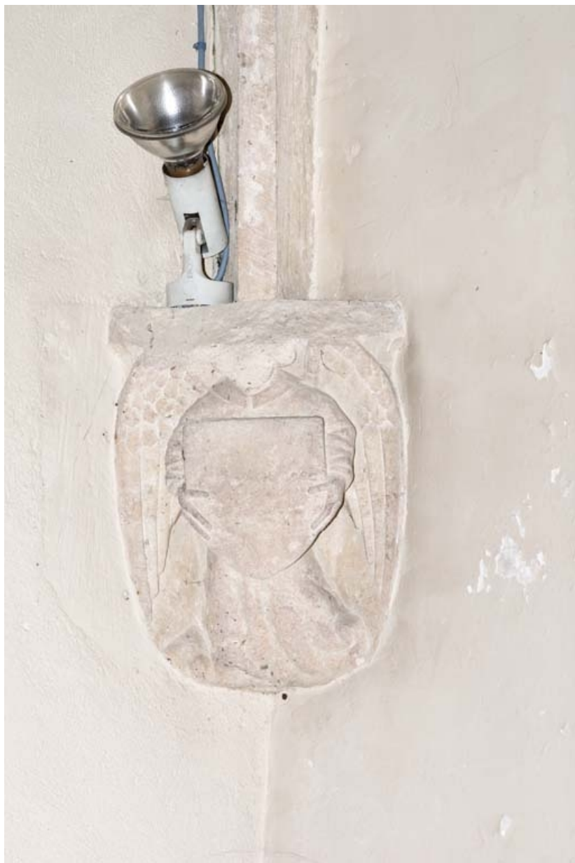
Culot représentant un ange portant un écu dans le chœur.