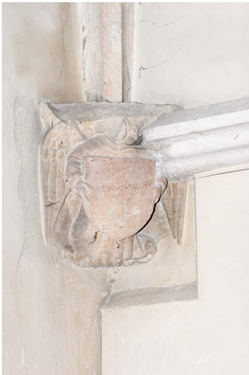
Culot représentant un ange portant un écu, à gauche dans le chœur.