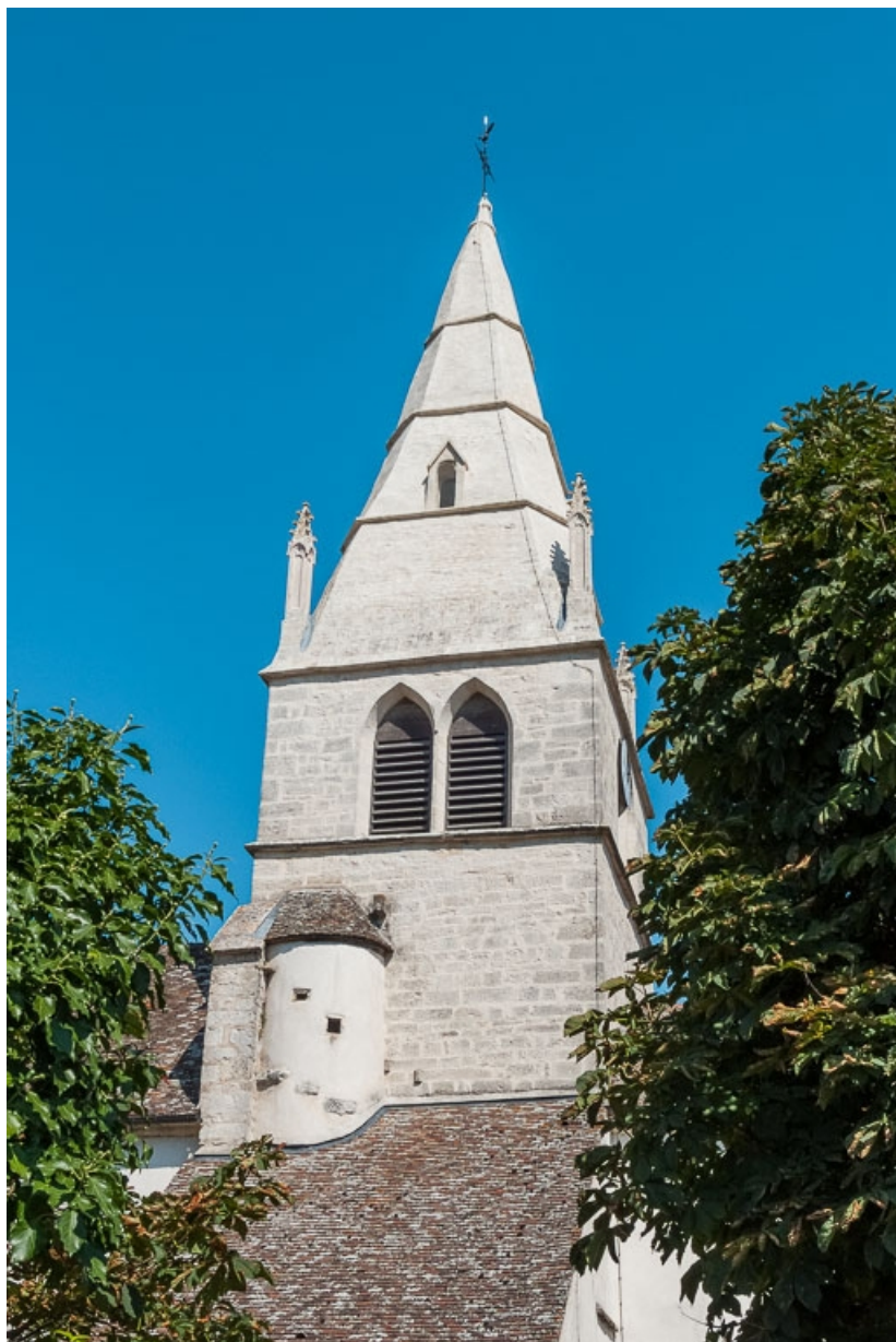
Face sud du clocher avec la tourselle d'escalier.