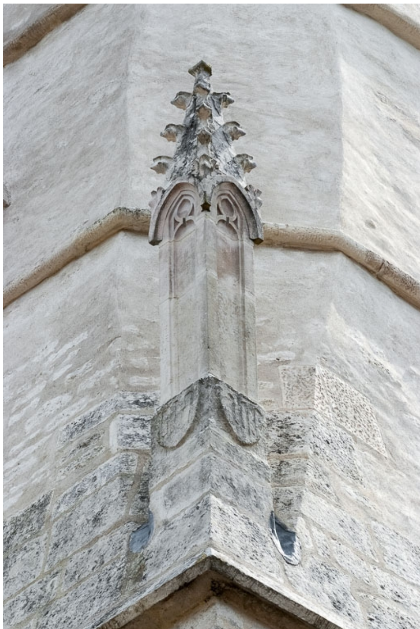
Clocher, pinacle nord-ouest.