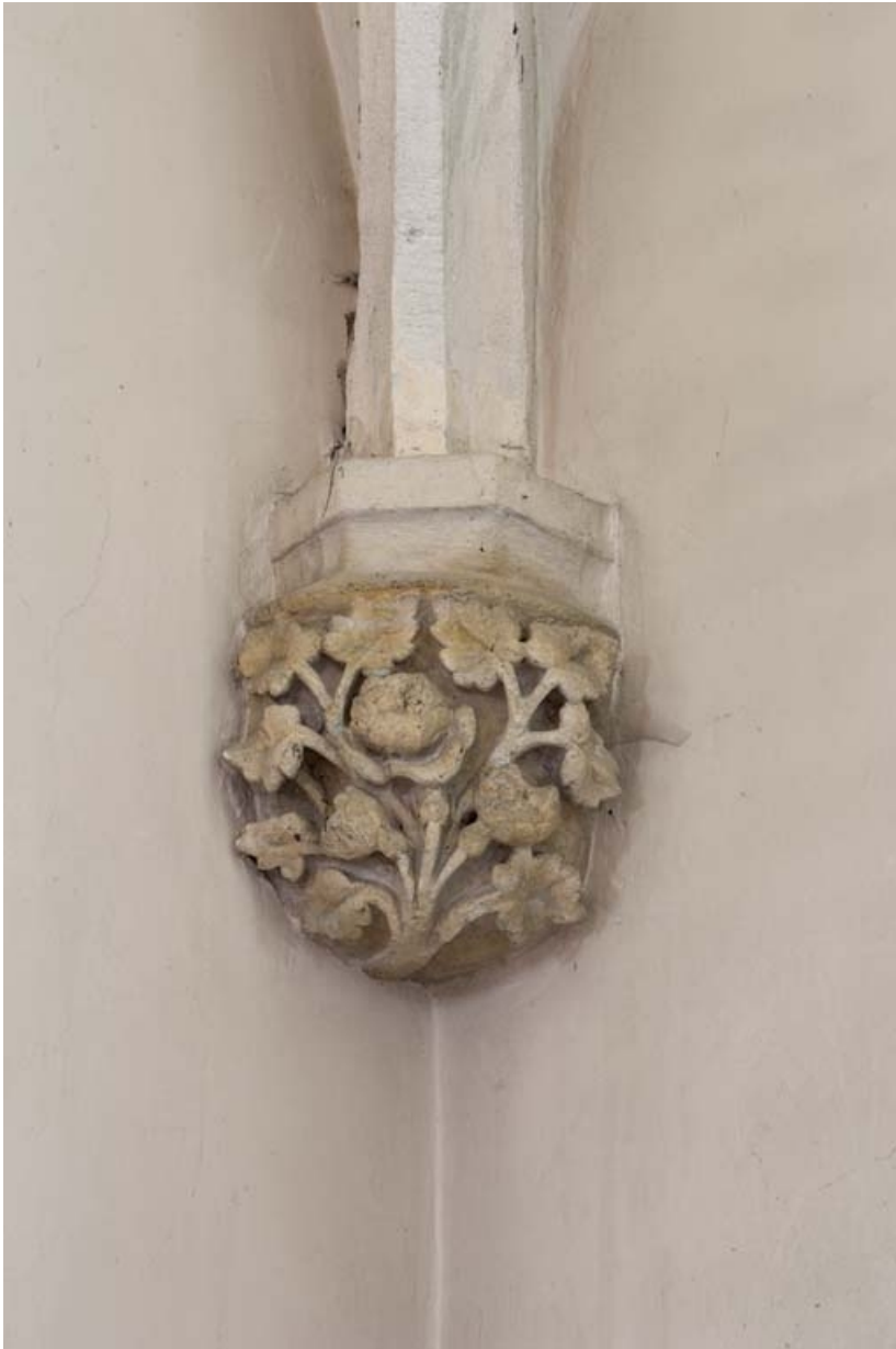
Chapelle nord : culot nord-ouest.