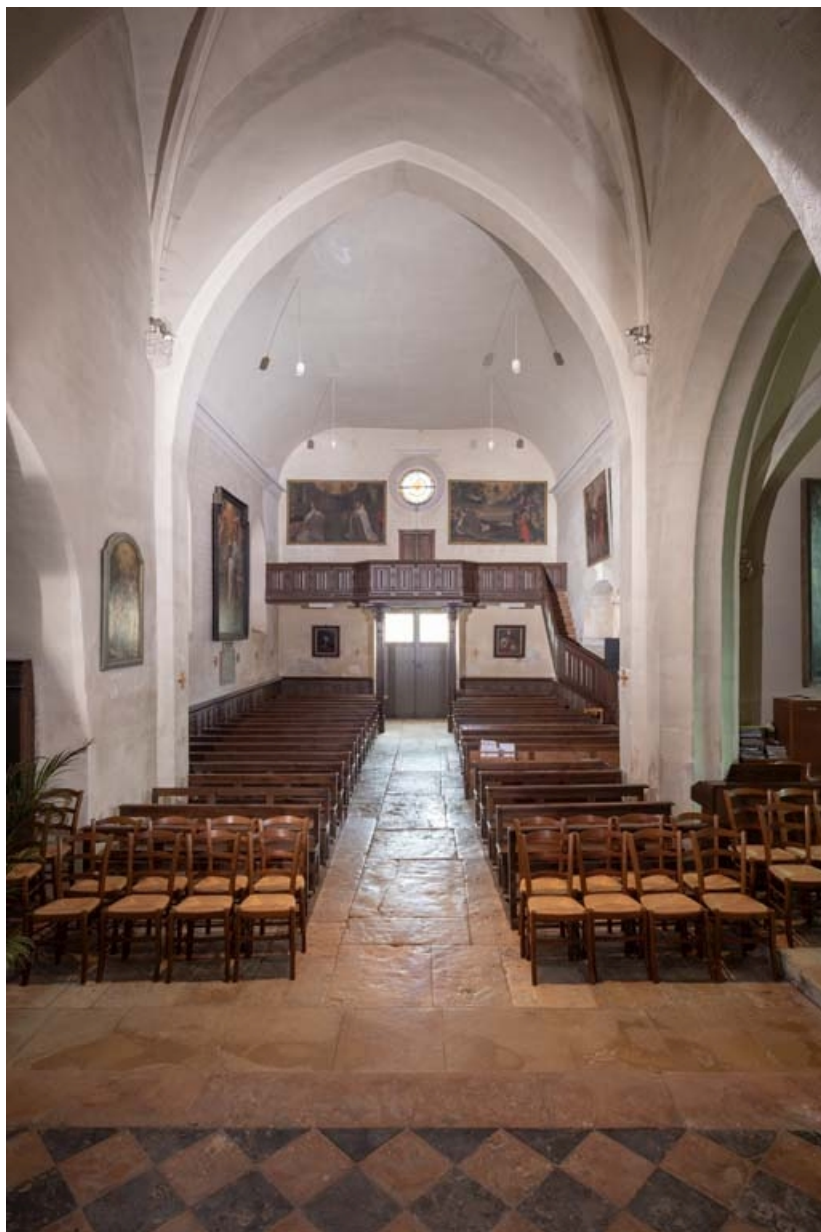
Vue d'ensemble de la nef depuis le chœur.