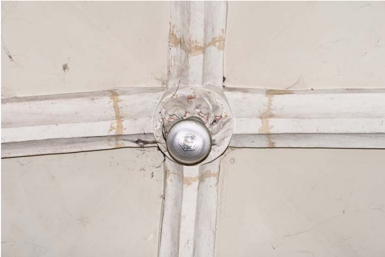
Clé de voûte de la chapelle sud.