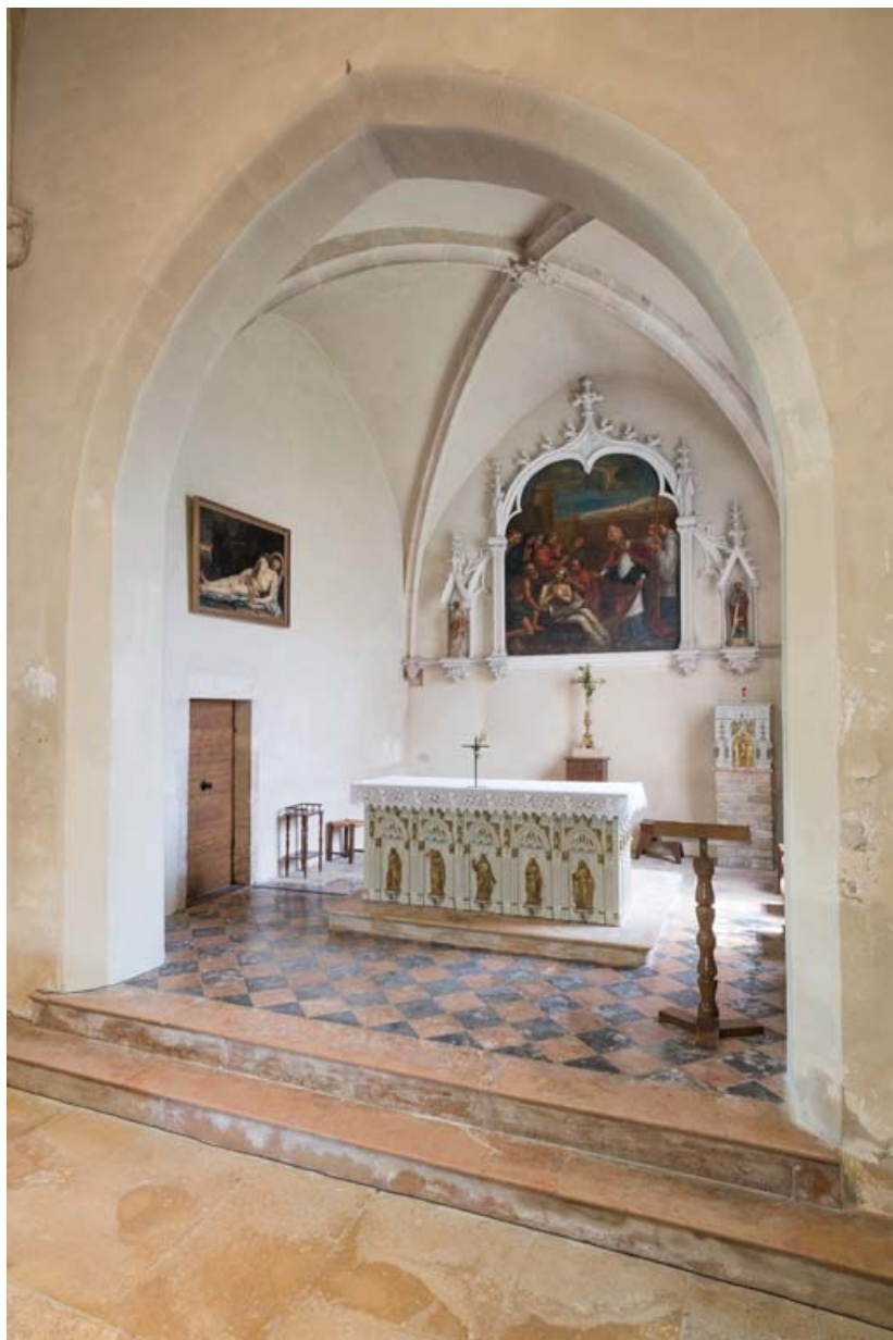
Le chœur vu depuis la nef, de trois-quarts.