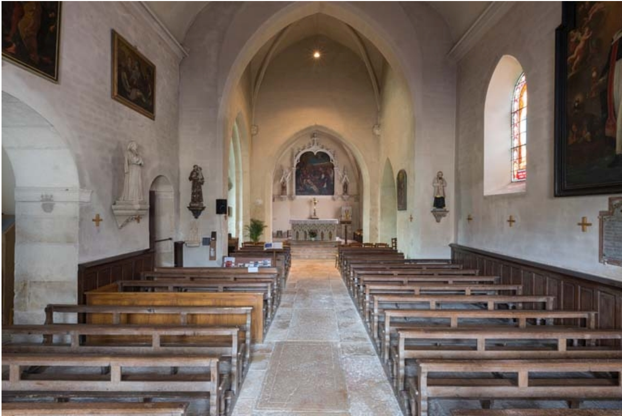
Vue d'ensemble de l'intérieur de l'église depuis la porte d'entrée.