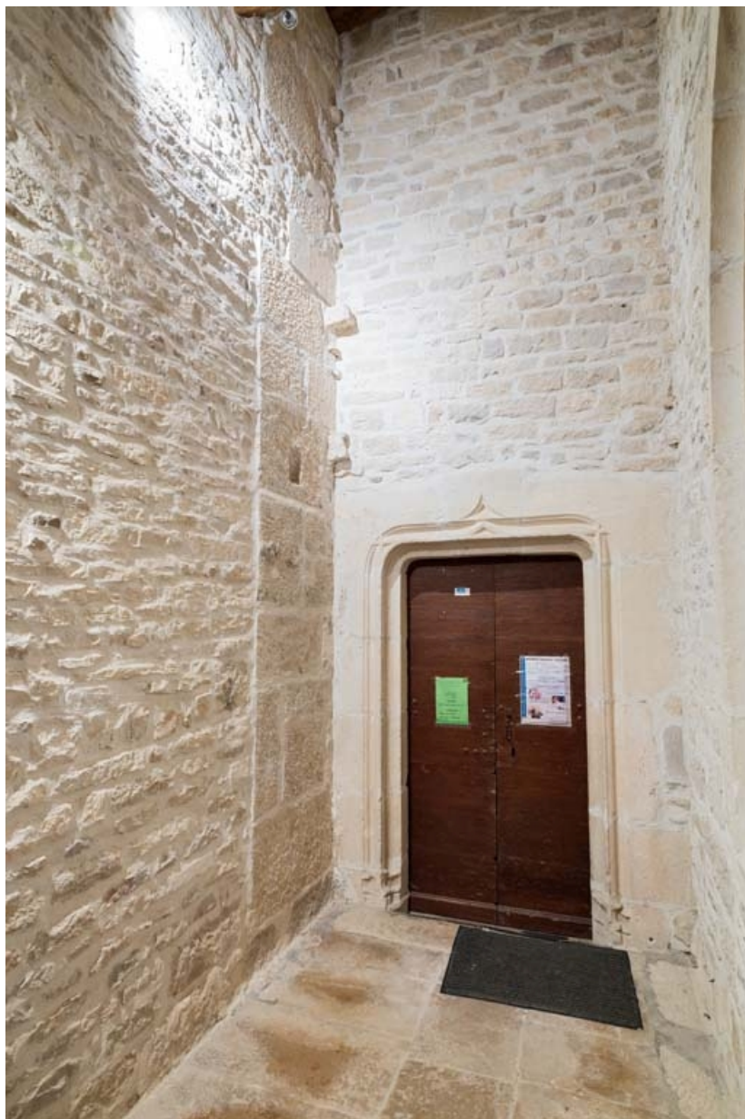
Porte d'entrée donnant dans la nef.