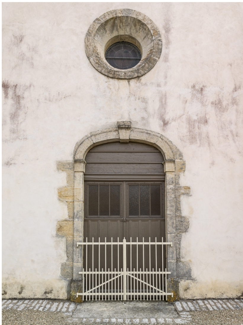
Façade, détail de la porte et de l'oculus.