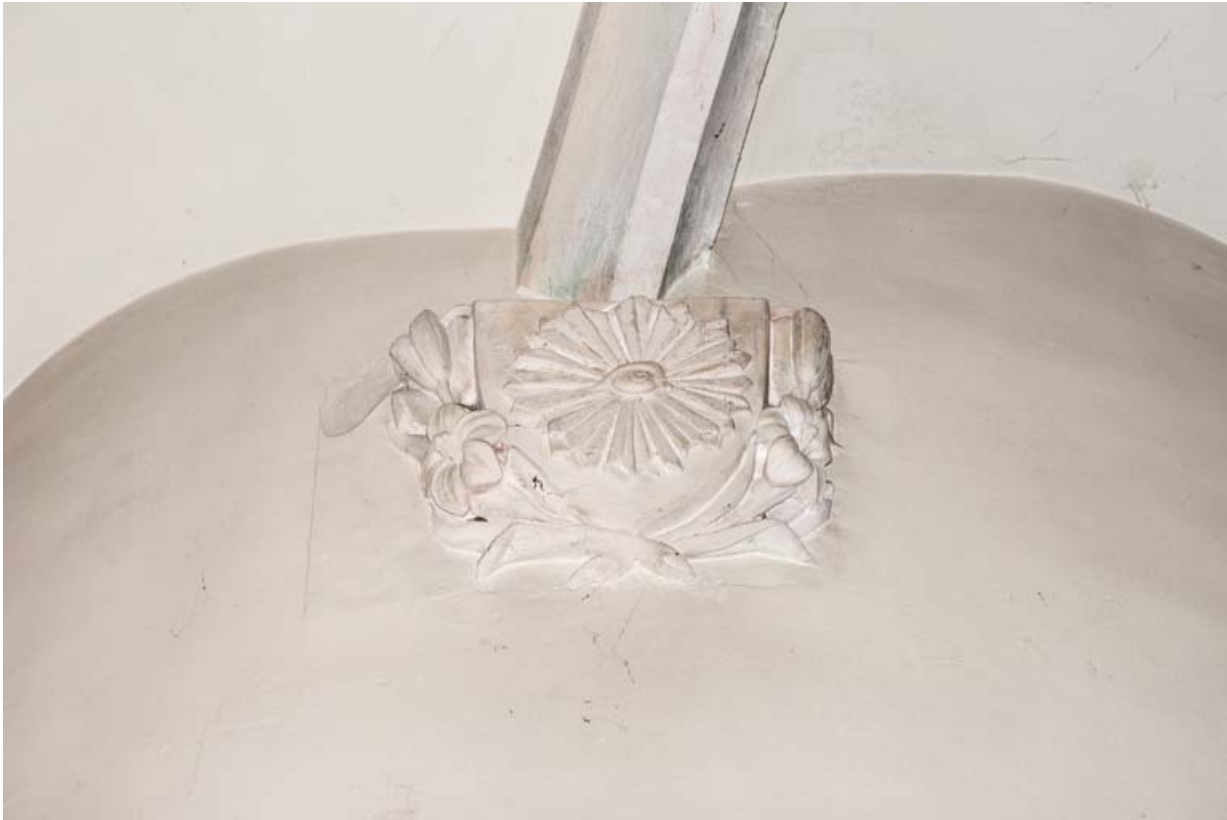
Culot sculpté d'une fleur (marguerite ?) de la chapelle sud, au niveau de la tourelle d'escalier. 21, Auxey-Duresses rue de la Commune