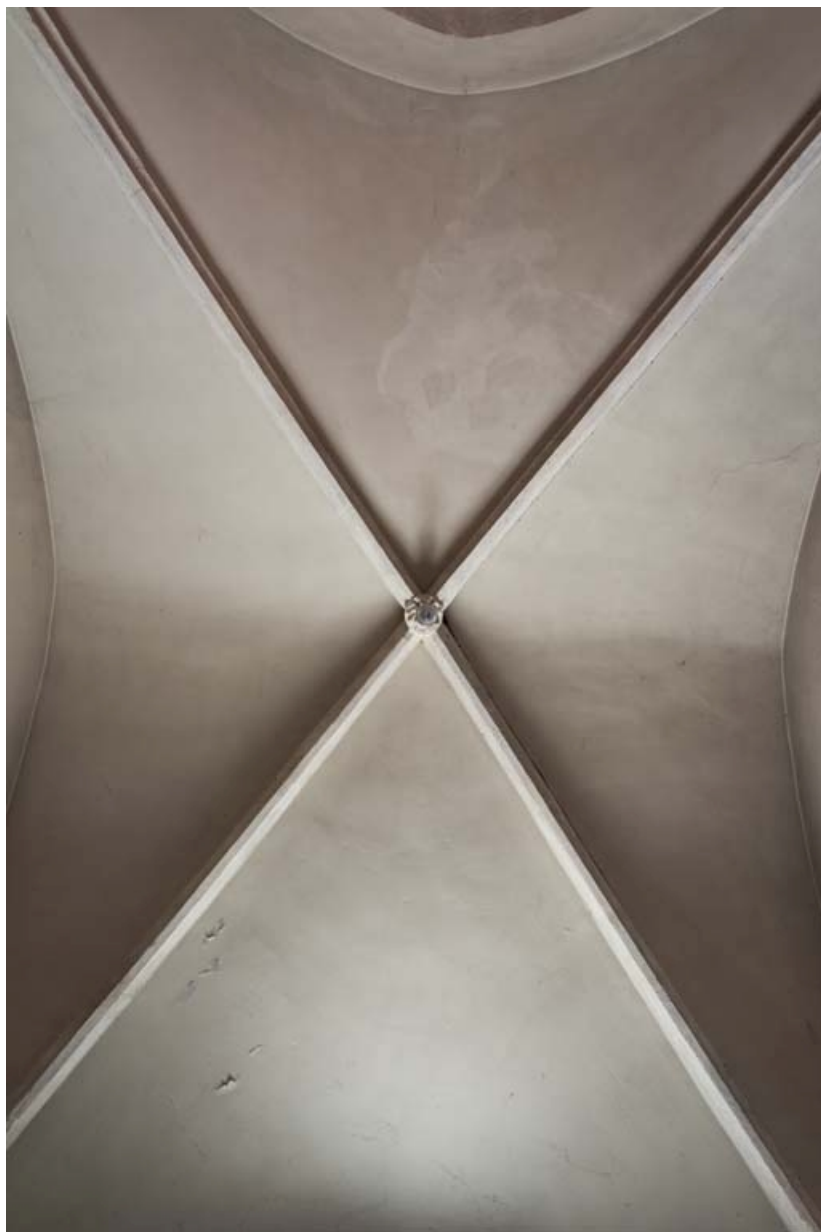
Chapelle nord : voûte et clef de voûte.