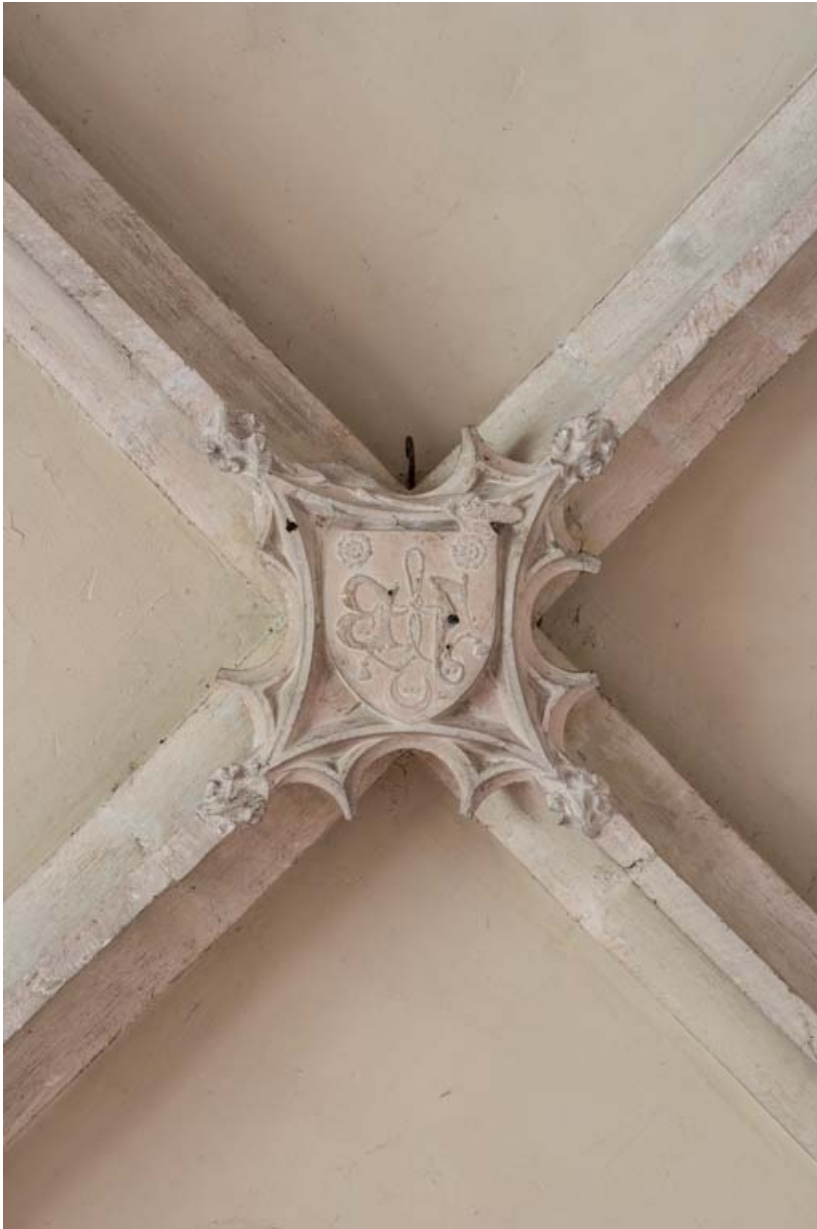
Clef de voûte du chœur.