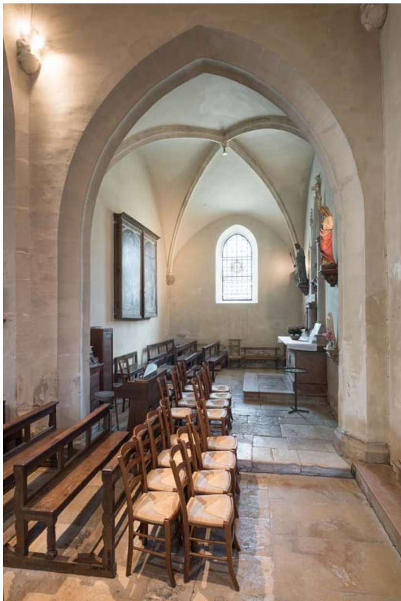
Vue d'ensemble de la chapelle nord.