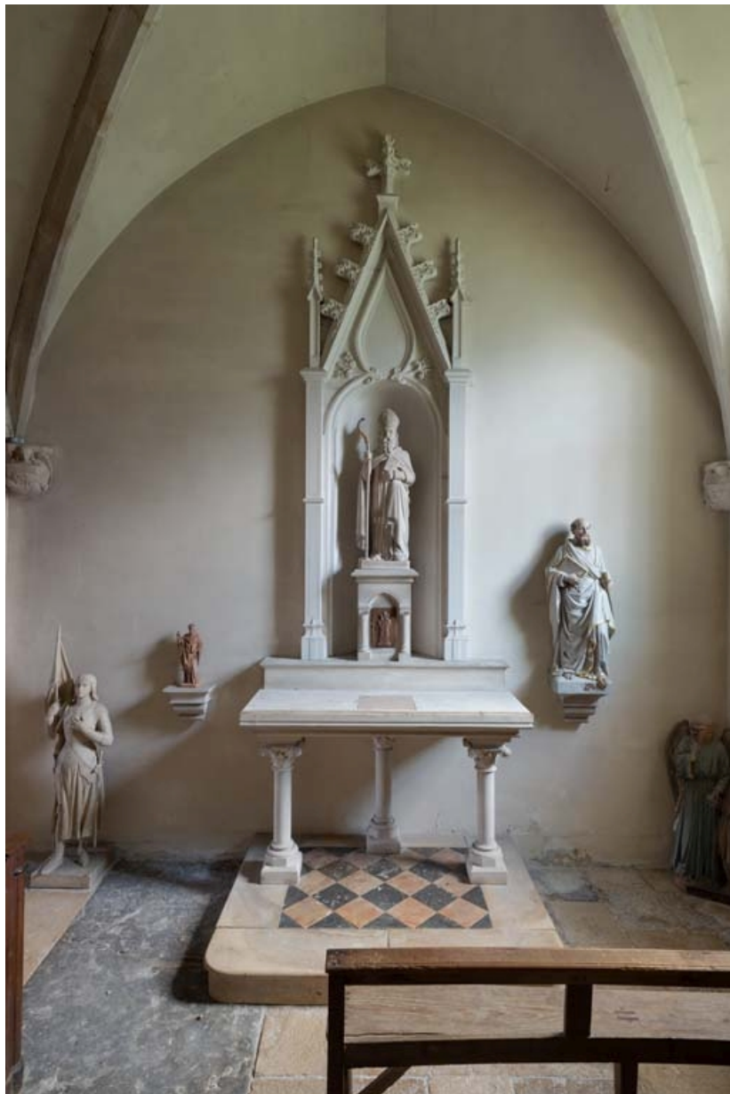
Autel de la chapelle sud.