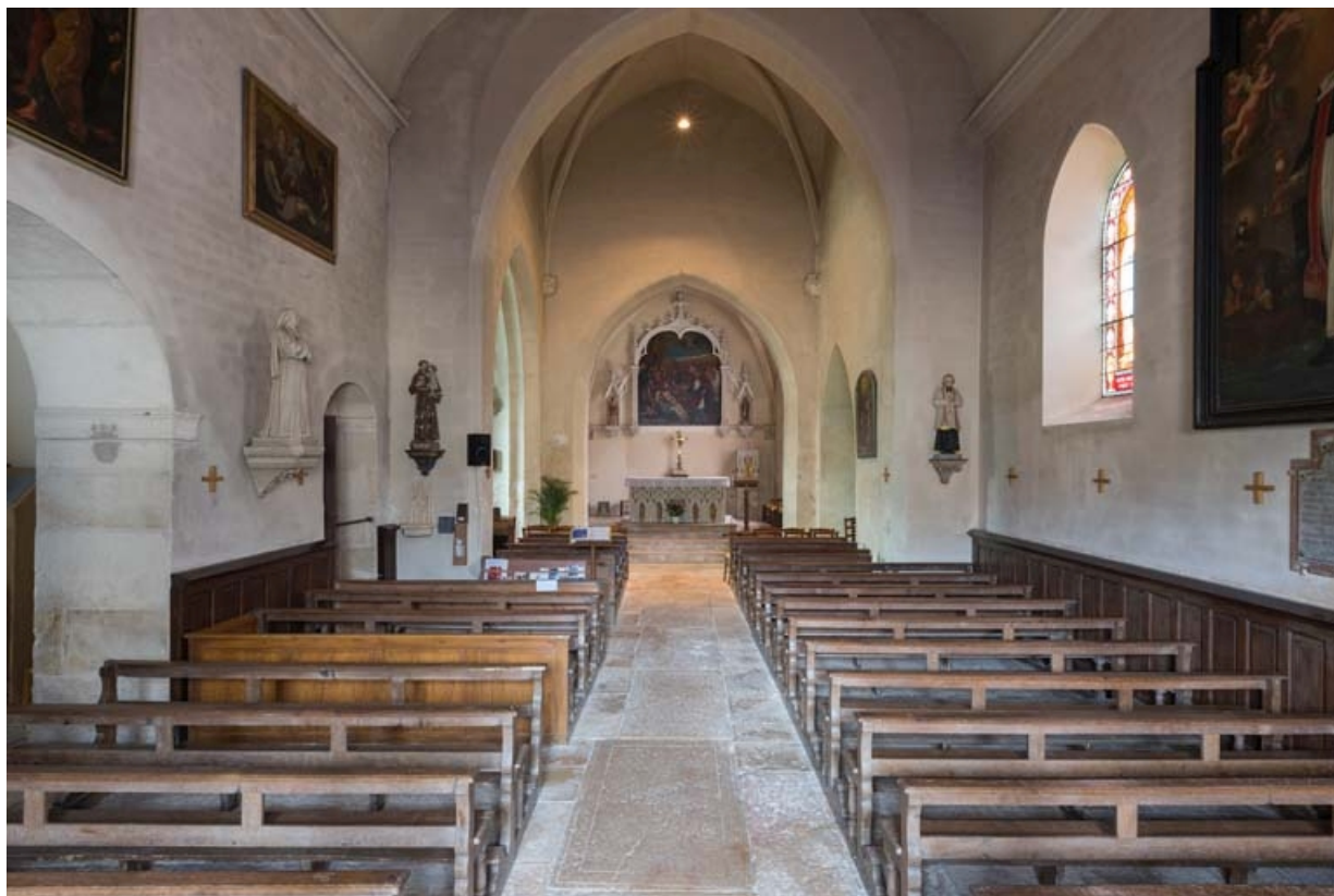
Vue d'ensemble de l'intérieur de l'église depuis la porte d'entrée.