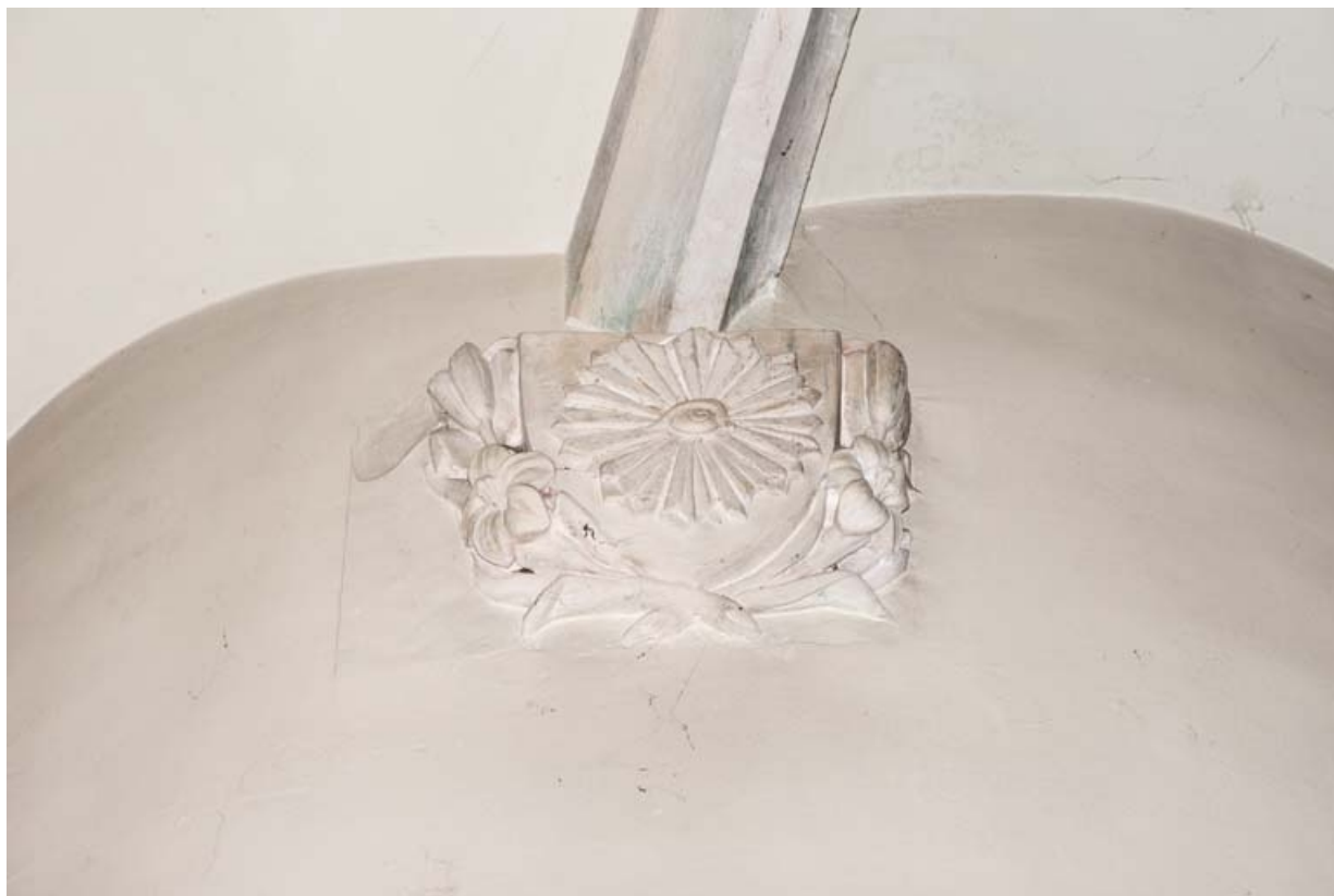
Culot sculpté d'une fleur (marguerite ?) de la chapelle sud, au niveau de la tourelle d'escalier. 21, Auxey-Duresses rue de la Commune