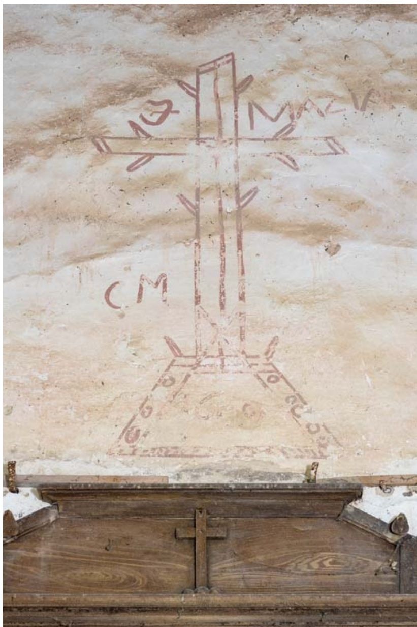
Peinture murale, au niveau du mur du chœur.

21, Auxey-Duresses rue de la Fontaine, lieudit : Petit-Auxey