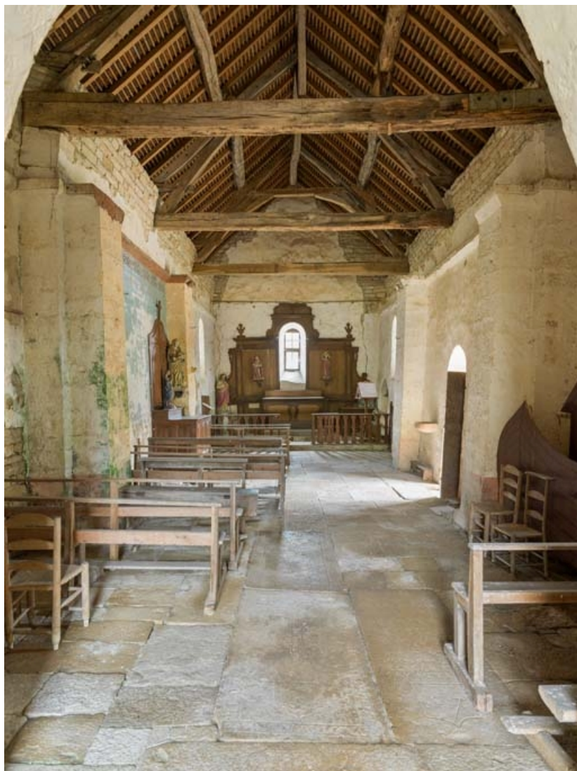
La nef, depuis l'entrée.

21, Auxey-Duresses rue de la Fontaine, lieudit : Petit-Auxey