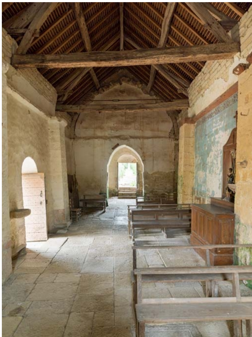
La nef, vue depuis le chœur.

21, Auxey-Duresses rue de la Fontaine, lieudit : Petit-Auxey