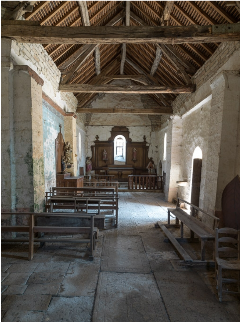
Vue d'ensemble depuis l'entrée.

21, Auxey-Duresses rue de la Fontaine, lieudit : Petit-Auxey