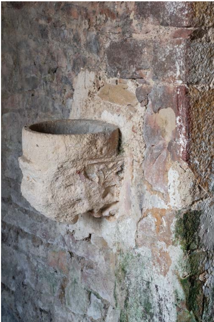
Bénitier du clocher-porche.

21, Auxey-Duresses rue de la Fontaine, lieudit : Petit-Auxey