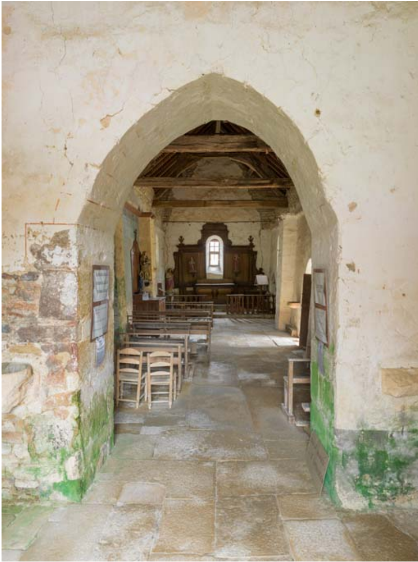
La nef, vue depuis le clocher-porche.

21, Auxey-Duresses rue de la Fontaine, lieudit : Petit-Auxey