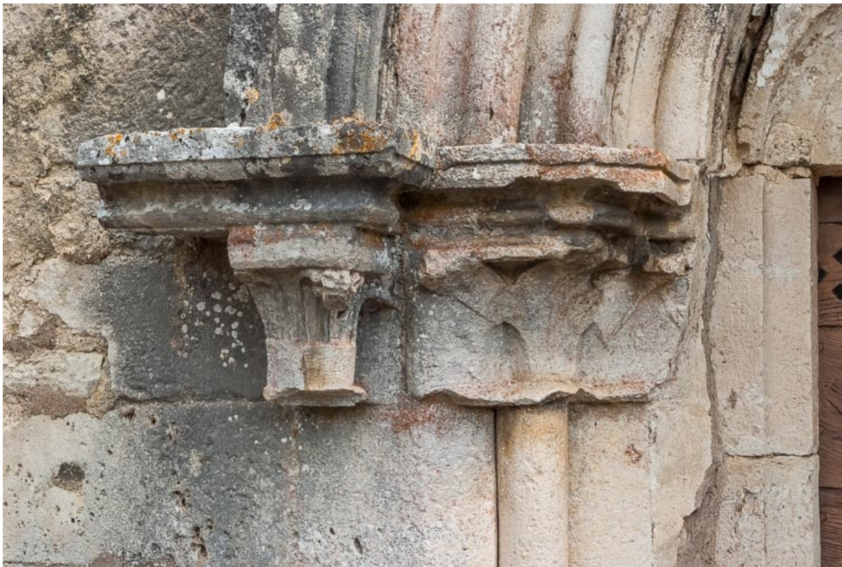
Portail, détail des chapiteaux.

21, Auxey-Duresses rue de la Fontaine, lieudit : Petit-Auxey