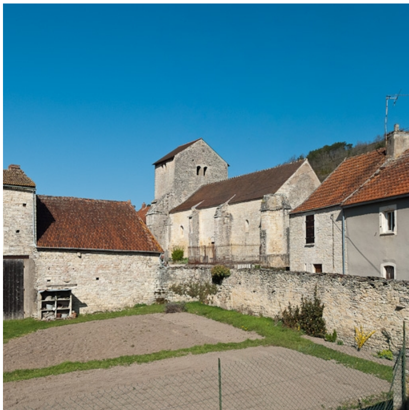
Eglise d'Auxey-le-Petit : vue d'ensemble côté chevet.

21, Auxey-Duresses rue de la Fontaine, lieudit : Petit-Auxey