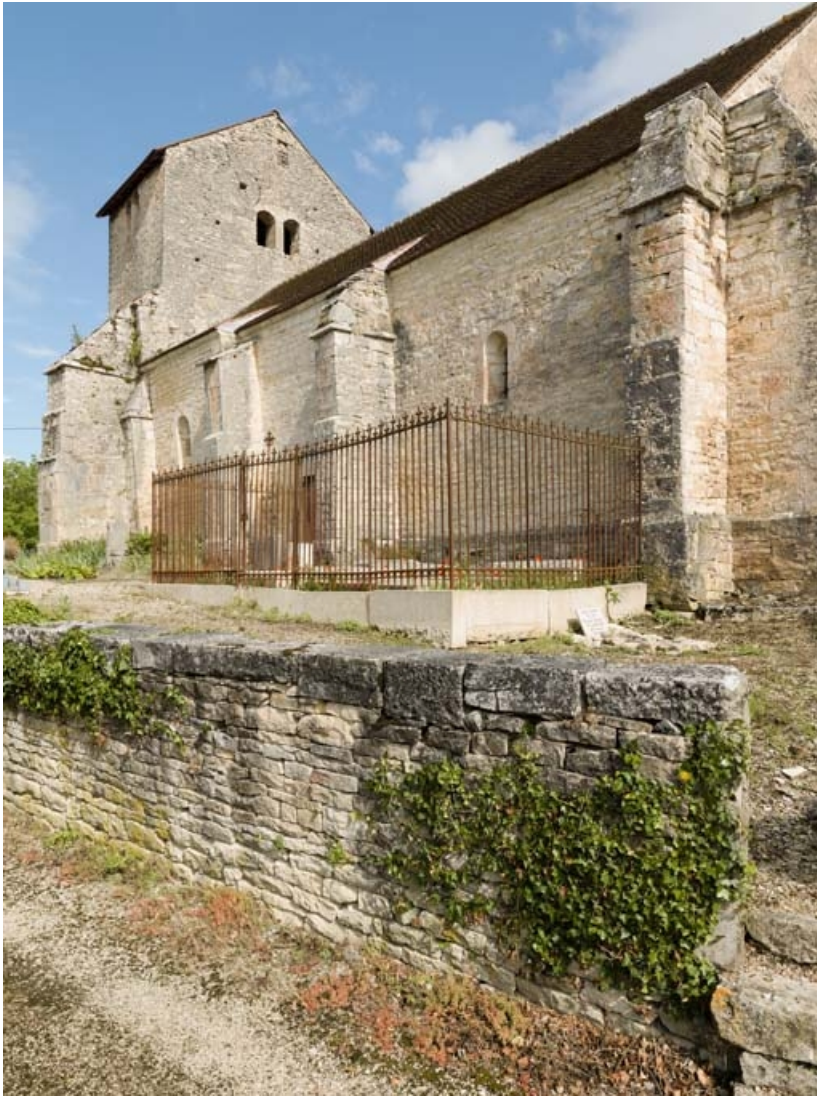
Enclos funéraire sur le mur sud de l'église.

21, Auxey-Duresses rue de la Fontaine, lieudit : Petit-Auxey