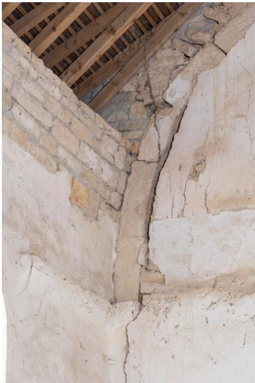
Détail du départ de voûte à l'angle sud-ouest de la nef. 21, Auxey-Duresses rue de la Fontaine, lieudit : Petit-Auxey