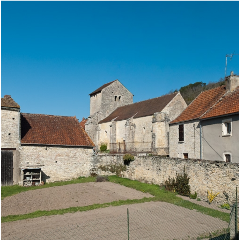
Eglise d'Auxey-le-Petit : vue d'ensemble côté chevet.

21, Auxey-Duresses rue de la Fontaine, lieudit : Petit-Auxey