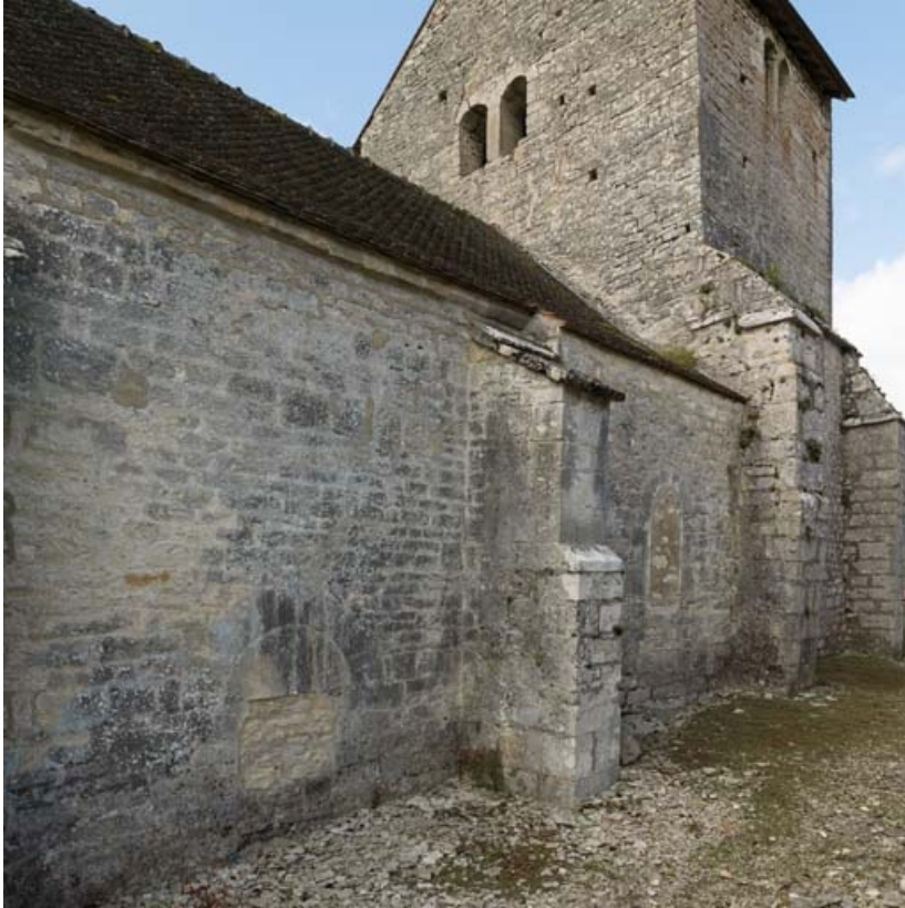
Détail des baies bouchées de l'élévation nord.

21, Auxey-Duresses rue de la Fontaine, lieudit : Petit-Auxey