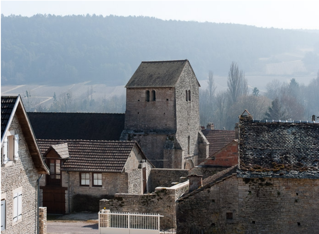
Eglise d'Auxey-le-Petit : façade et clocher.

21, Auxey-Duresses rue de la Fontaine, lieudit : Petit-Auxey