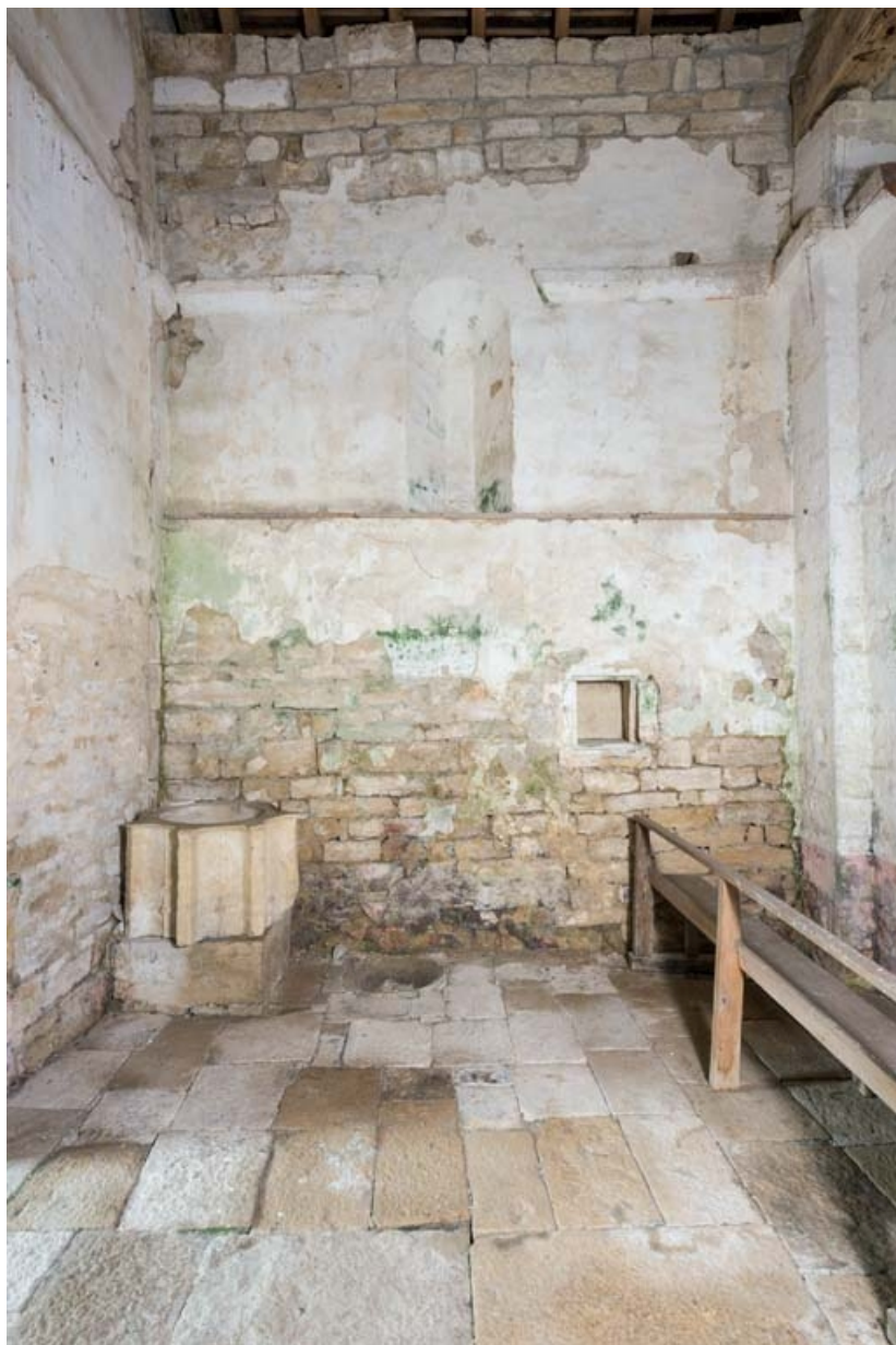
Fonts baptismaux et niche dans le mur nord de la nef.

21, Auxey-Duresses rue de la Fontaine, lieudit : Petit-Auxey