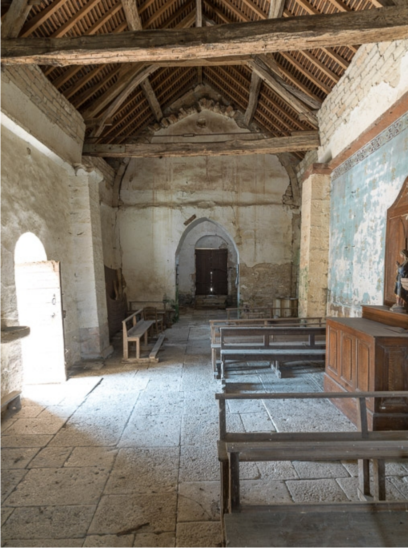
Vue d'ensemble depuis le chœur.

21, Auxey-Duresses rue de la Fontaine, lieudit : Petit-Auxey