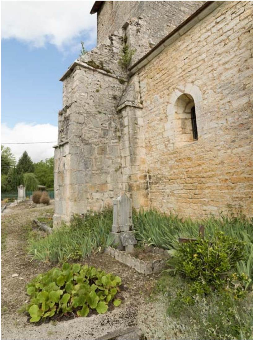
Contrefort à l'angle du clocher-porche et de la nef, élévation sud.

21, Auxey-Duresses rue de la Fontaine, lieudit : Petit-Auxey