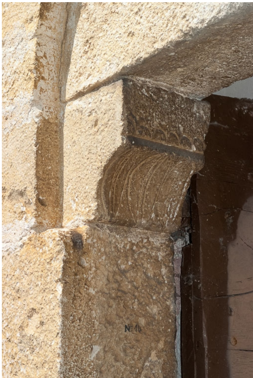
Porte latérale, détail d'un coussinet.

21, Auxey-Duresses rue de la Fontaine, lieudit : Petit-Auxey