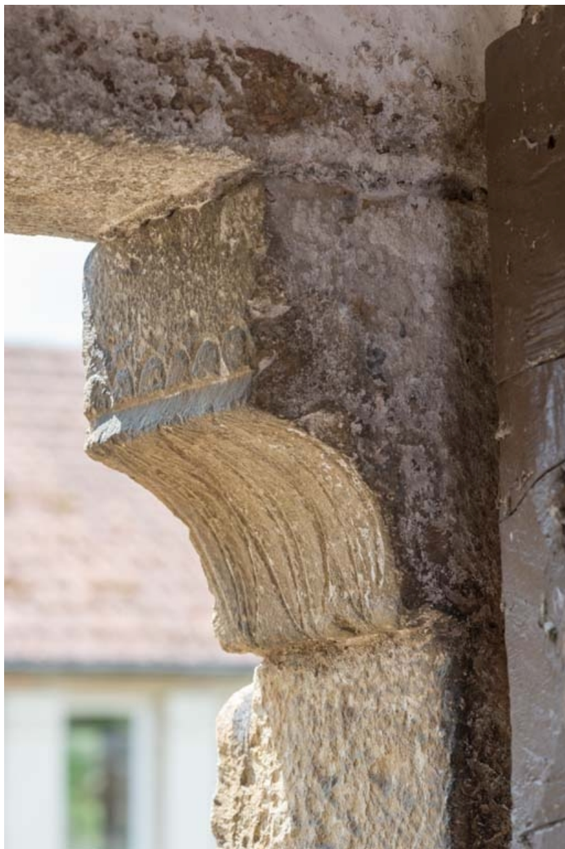
Détail des gravures sur le coussinet de la porte sud.

21, Auxey-Duresses rue de la Fontaine, lieudit : Petit-Auxey