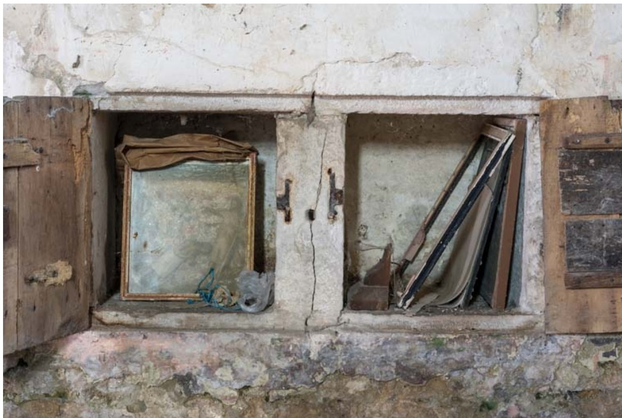
Double niche ouverte dans le chœur.

21, Auxey-Duresses rue de la Fontaine, lieudit : Petit-Auxey