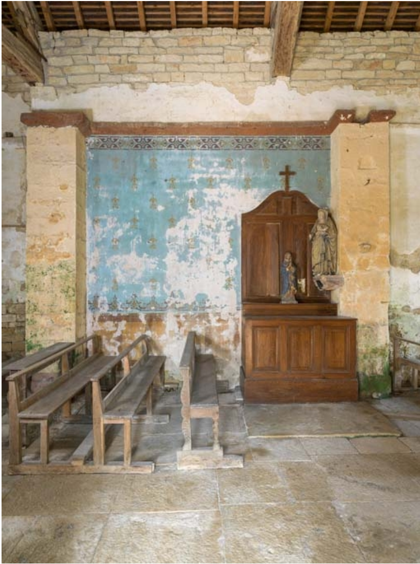
Peintures murales sur le mur nord de la nef.

21, Auxey-Duresses rue de la Fontaine, lieudit : Petit-Auxey