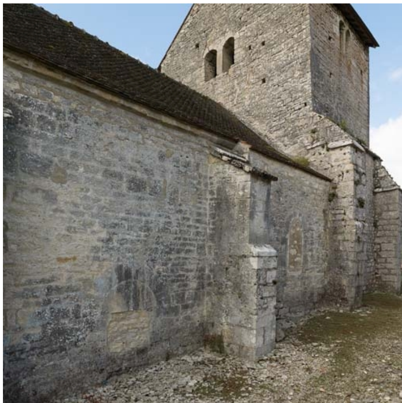
Détail des baies bouchées de l'élévation nord.

21, Auxey-Duresses rue de la Fontaine, lieudit : Petit-Auxey