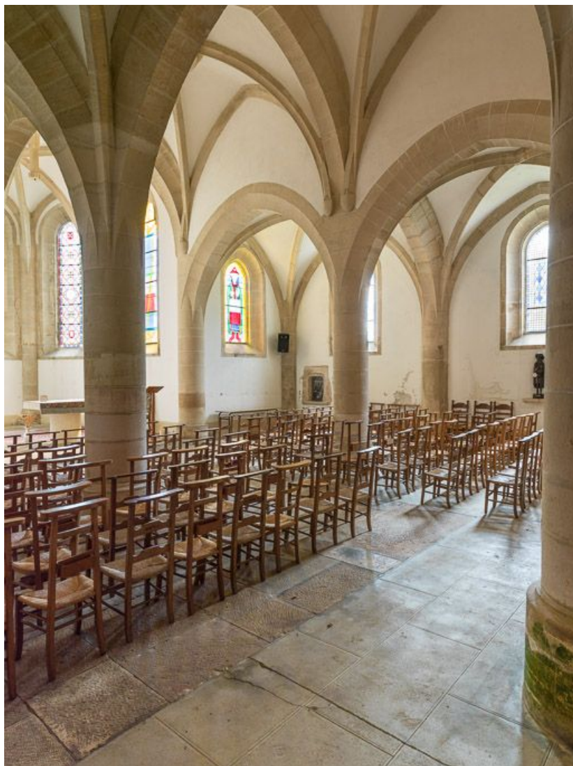
Vue d'ensemble de la nef, vers le sud-est.

21, Ladoix-Serrigny, 1 rue de la Chapelle