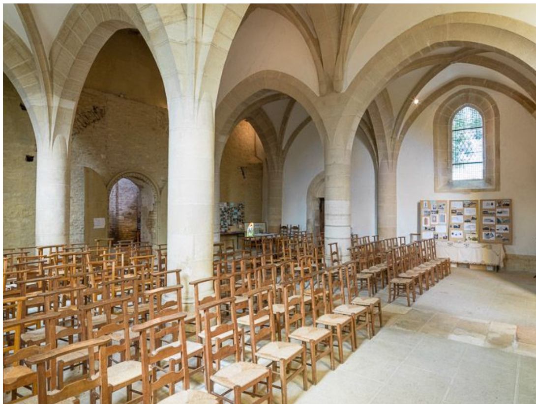
Vue d'ensemble de la nef, vers le nord-ouest.

21, Ladoix-Serrigny, 1 rue de la Chapelle