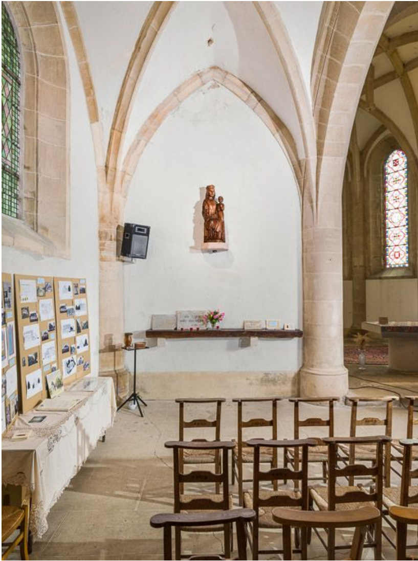
Vue du mur nord-est de la nef.

21, Ladoix-Serrigny, 1 rue de la Chapelle