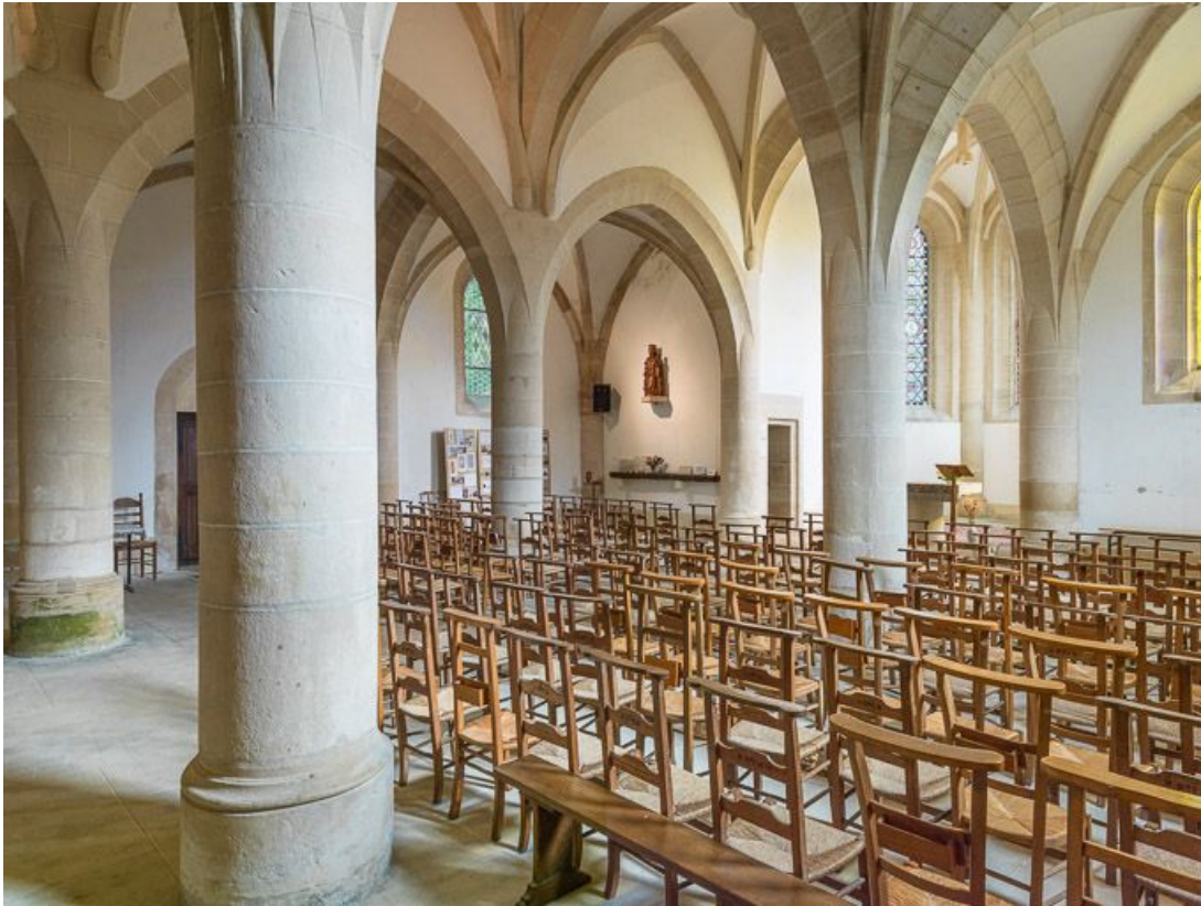
Vue d'ensemble de la nef, vers le nord-est.

21, Ladoix-Serrigny, 1 rue de la Chapelle