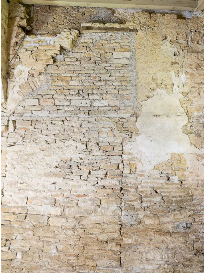
Ancienne chapelle : vue du mur à l'angle sud- ouest.

21, Ladoix-Serrigny, 1 rue de la Chapelle