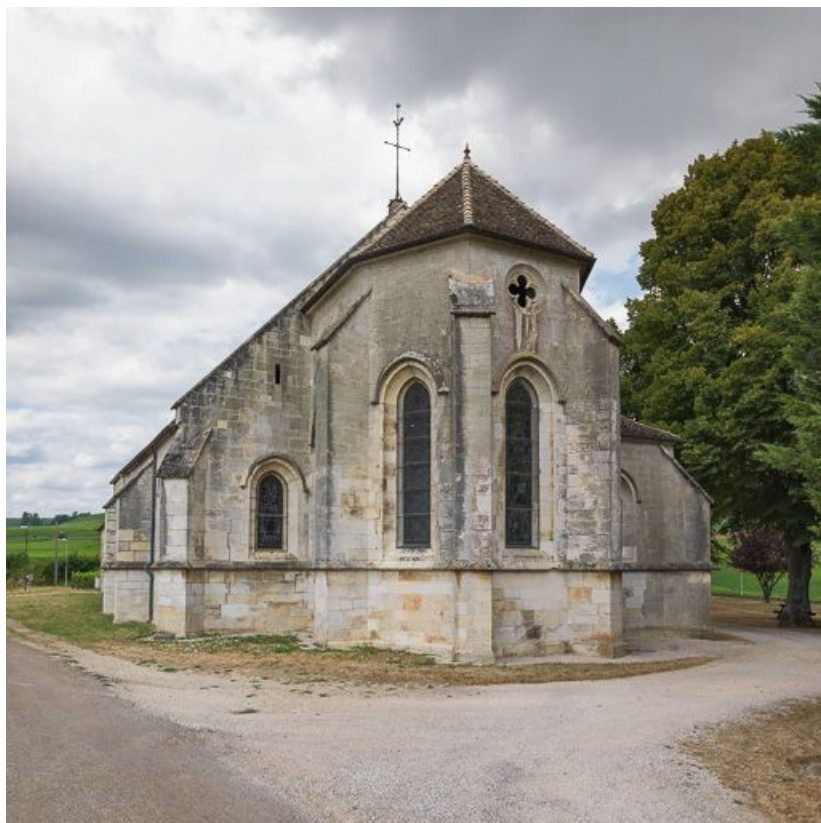
Vue du chevet de la chapelle.

21, Ladoix-Serrigny, 1 rue de la Chapelle