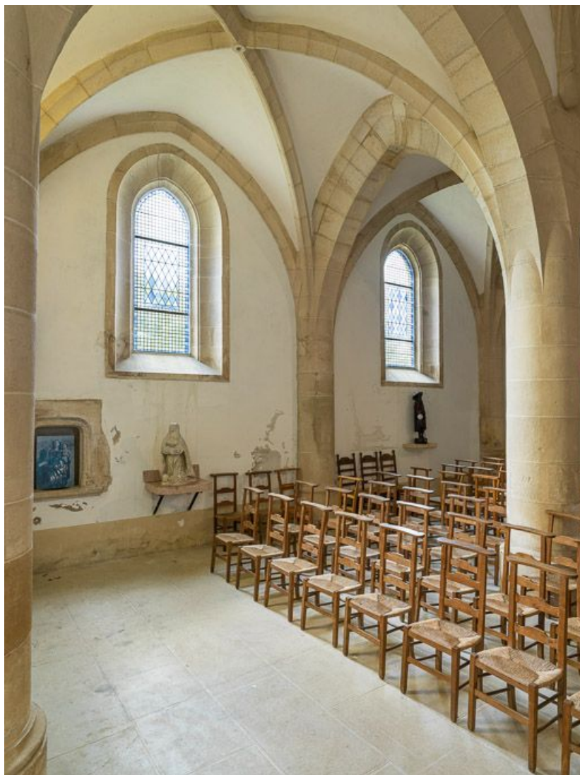
Vue de la nef depuis le chœur, en direction du sud-ouest.

21, Ladoix-Serrigny, 1 rue de la Chapelle