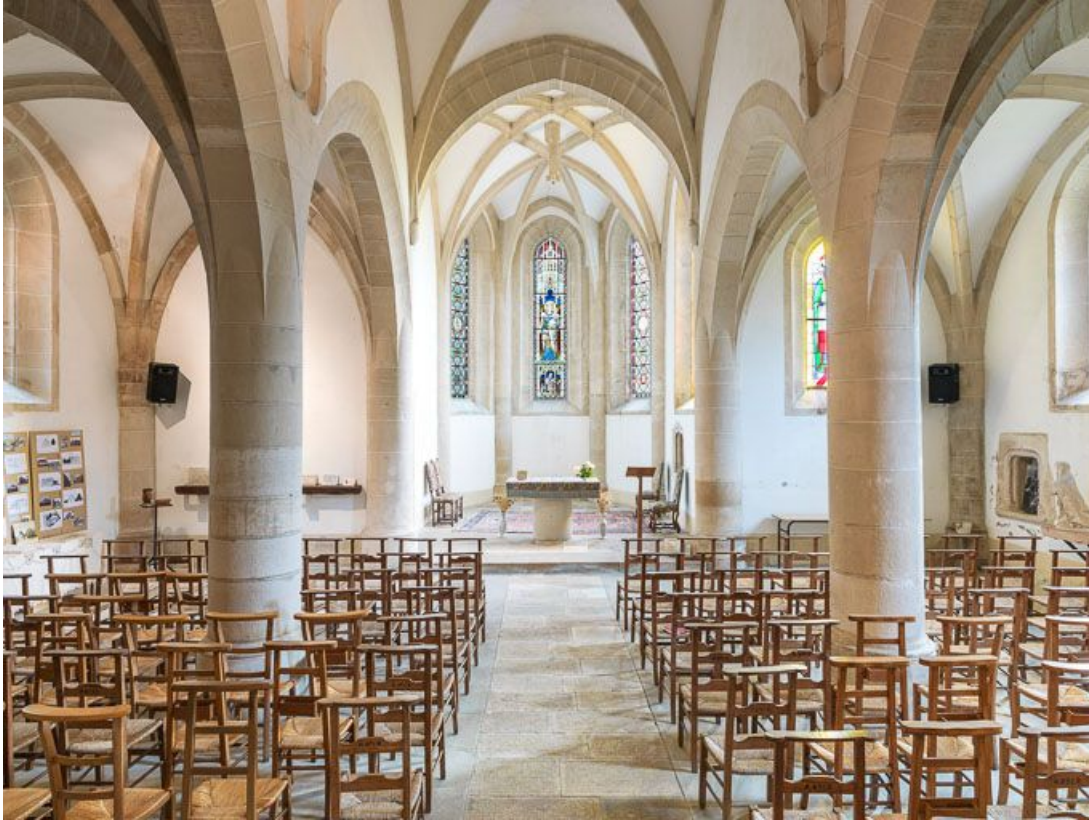
Vue d'ensemble de l'intérieur de la chapelle, vers le chœur.

21, Ladoix-Serrigny, 1 rue de la Chapelle