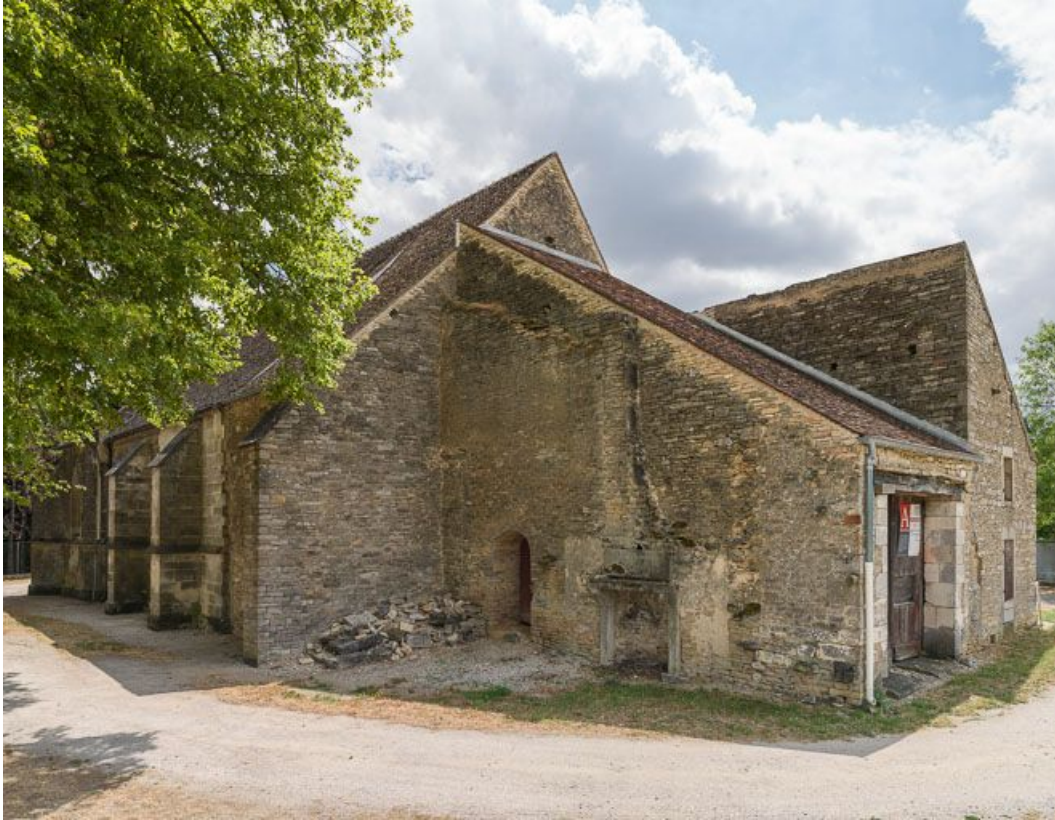
Vue de l'angle nord-ouest.

21, Ladoix-Serrigny, 1 rue de la Chapelle