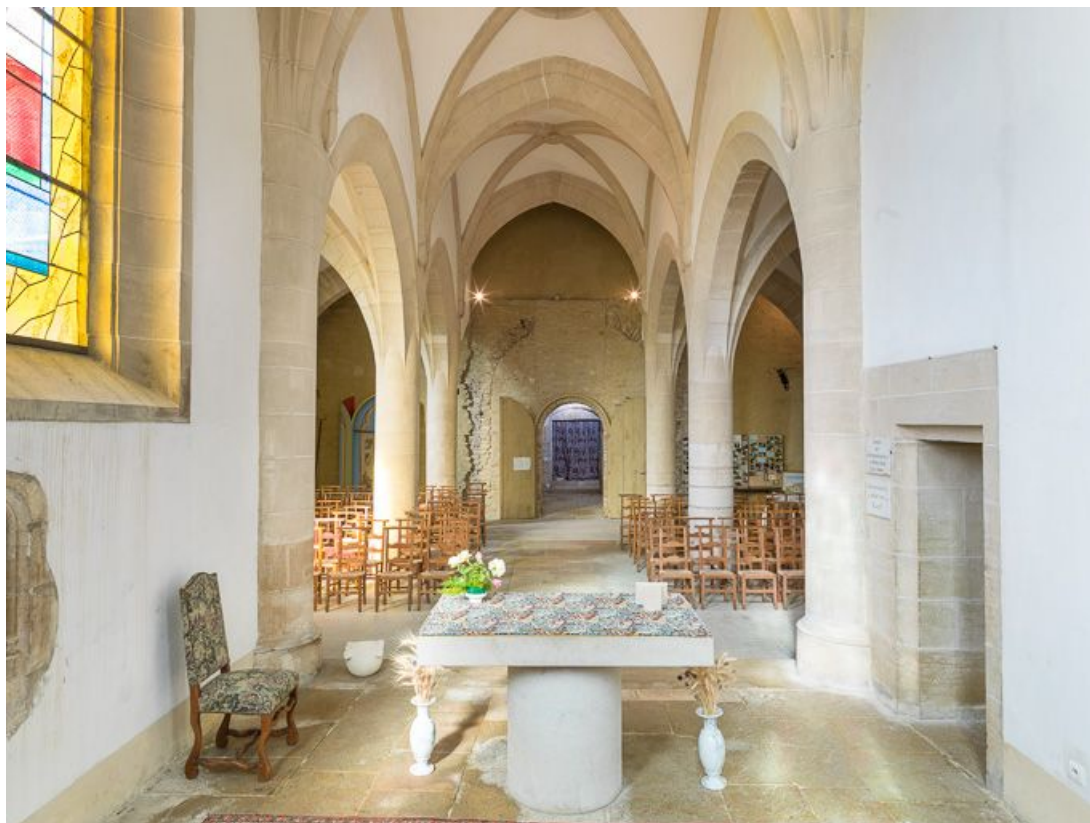
Vue d'ensemble de l'intérieur de la chapelle : chœur et nef.

21, Ladoix-Serrigny, 1 rue de la Chapelle