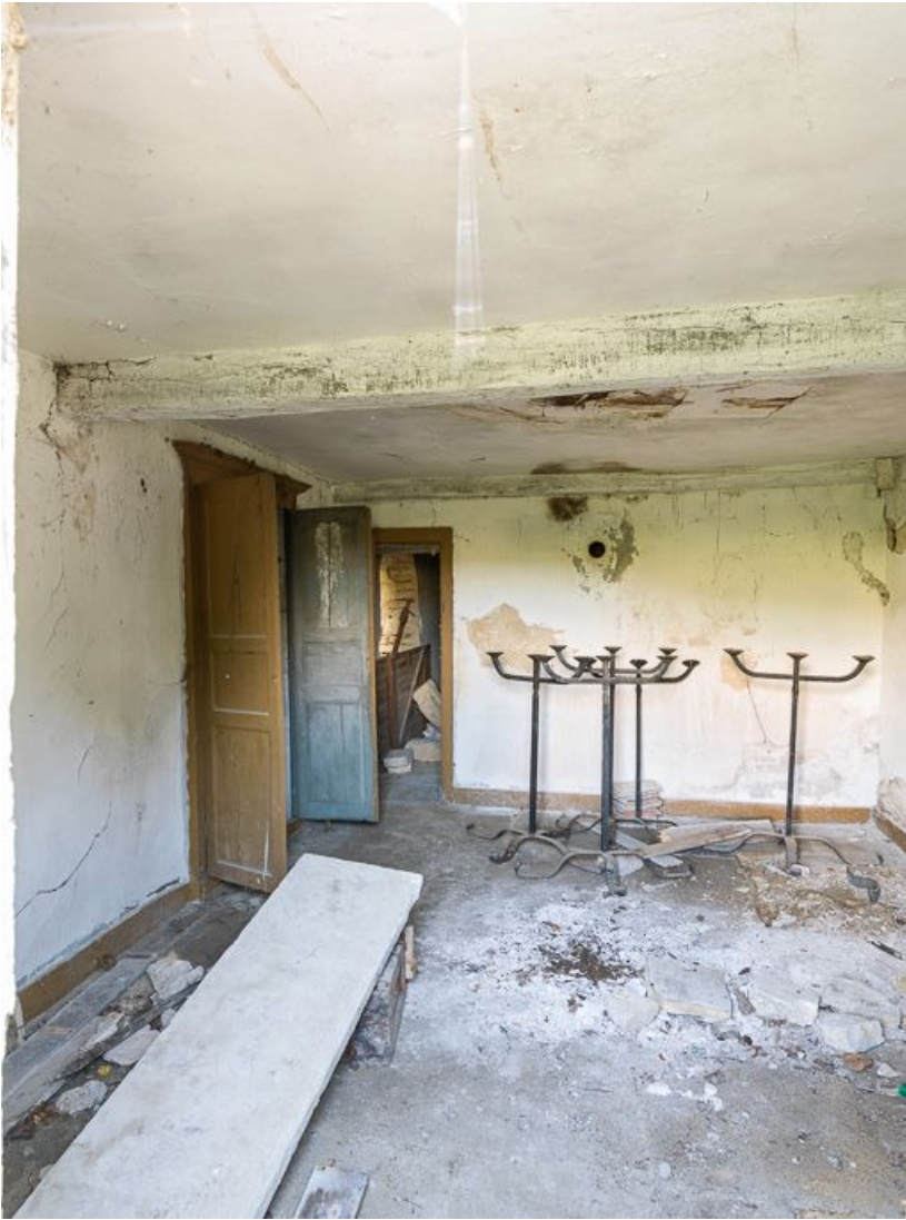
Vue d'un ancien logement (rez-de-chaussée). 21, Ladoix-Serrigny, 1 rue de la Chapelle