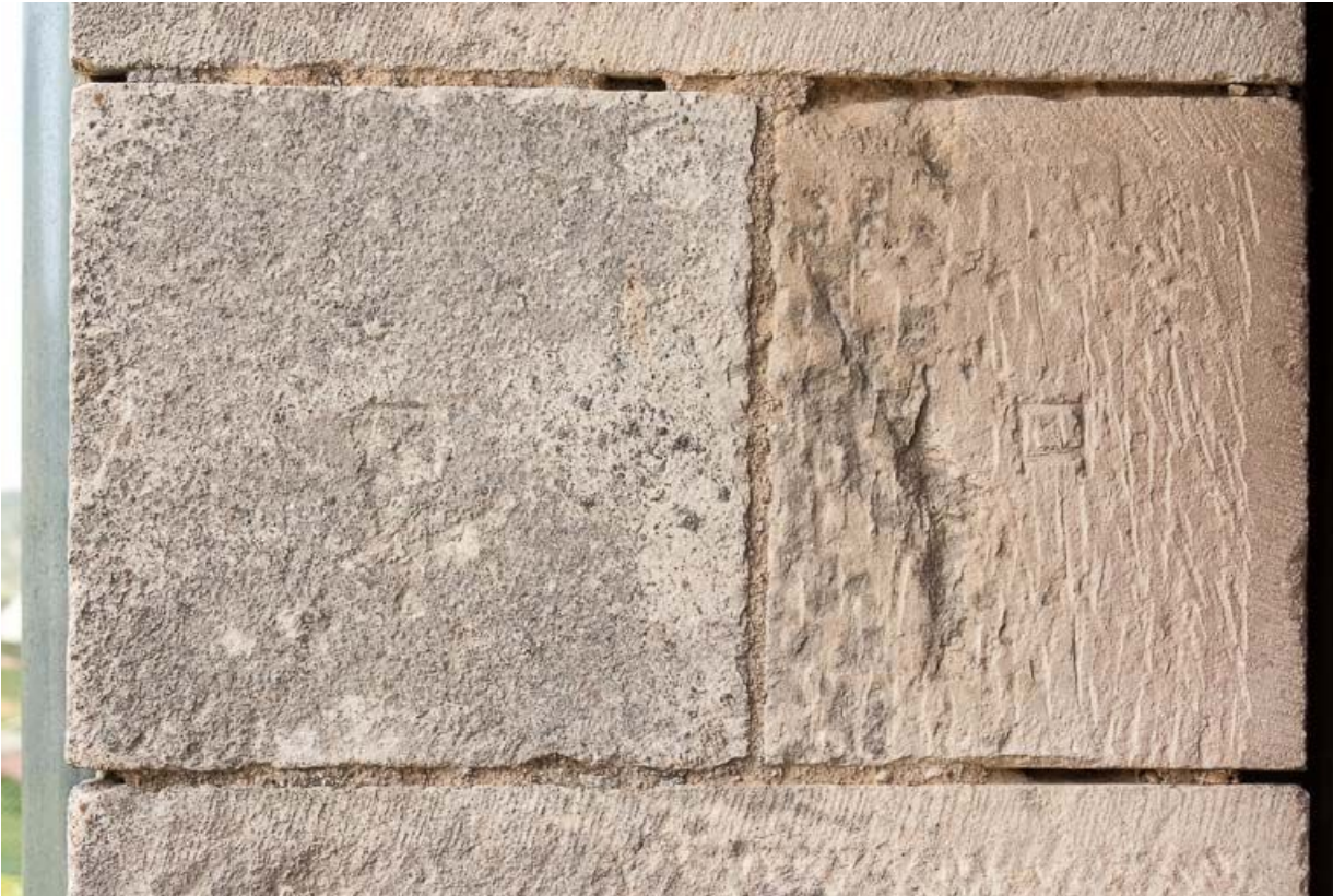
Marque de tâcheron sur la porte charretière à l'ouest de l'édifice.

21, Ladoix-Serrigny, 1 rue de la Chapelle