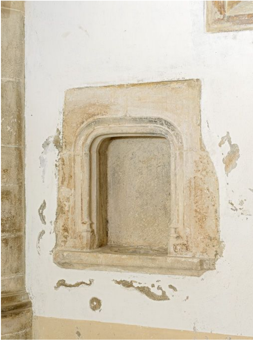
Vue du lavabo situé dans le mur sud de la nef.

21, Ladoix-Serrigny, 1 rue de la Chapelle