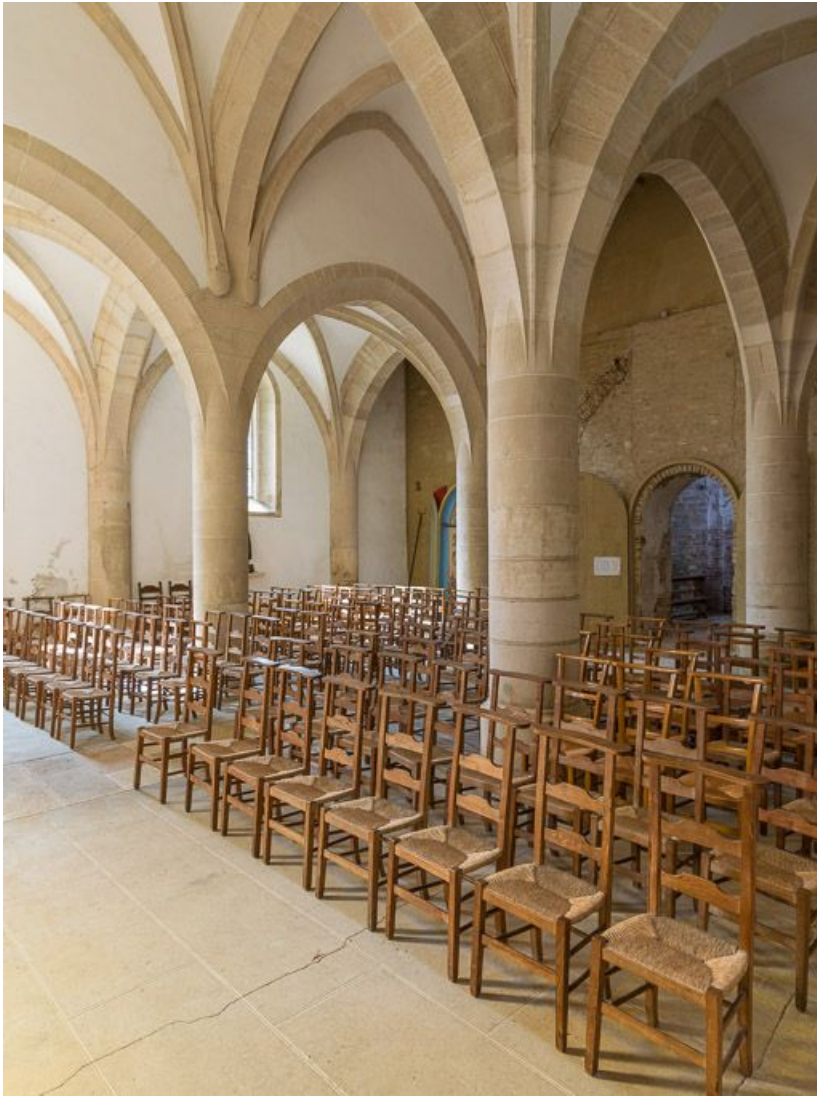
Vue d'ensemble de la nef, vers le sud-ouest.

21, Ladoix-Serrigny, 1 rue de la Chapelle