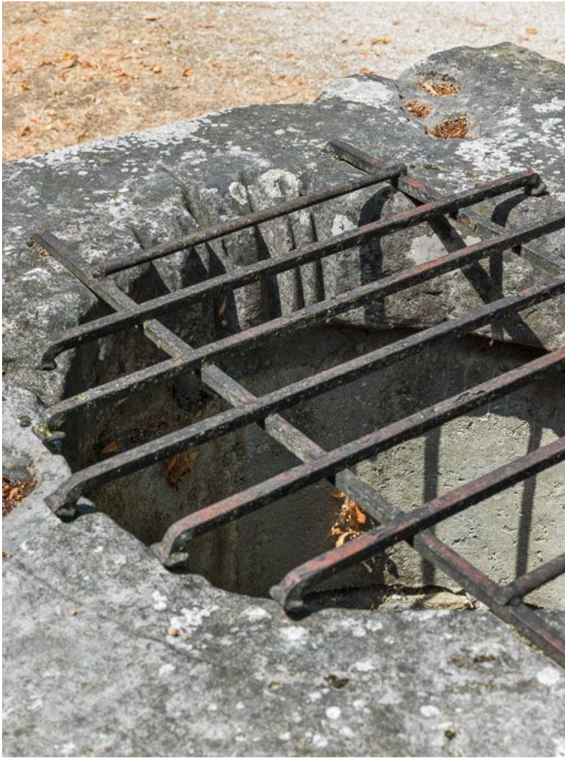
Puits : grille et traces d'usure de cordes.

21, Ladoix-Serrigny, 1 rue de la Chapelle