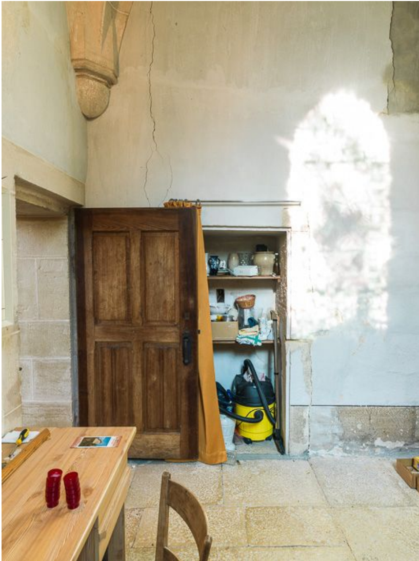
Vue d'ensemble de la sacristie.

21, Ladoix-Serrigny, 1 rue de la Chapelle