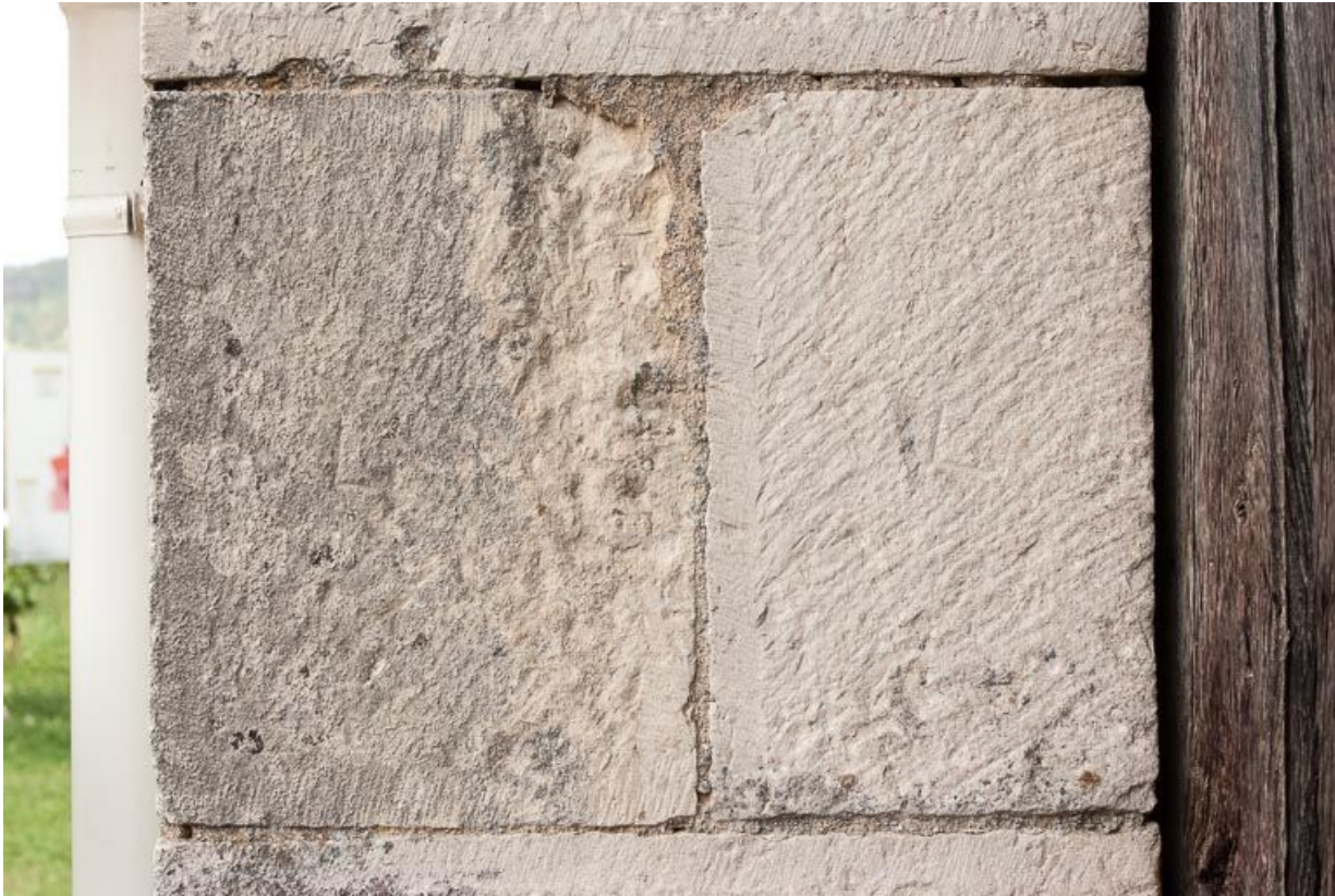
Marque de tâcheron sur la porte charretière à l'ouest de l'édifice.

21, Ladoix-Serrigny, 1 rue de la Chapelle