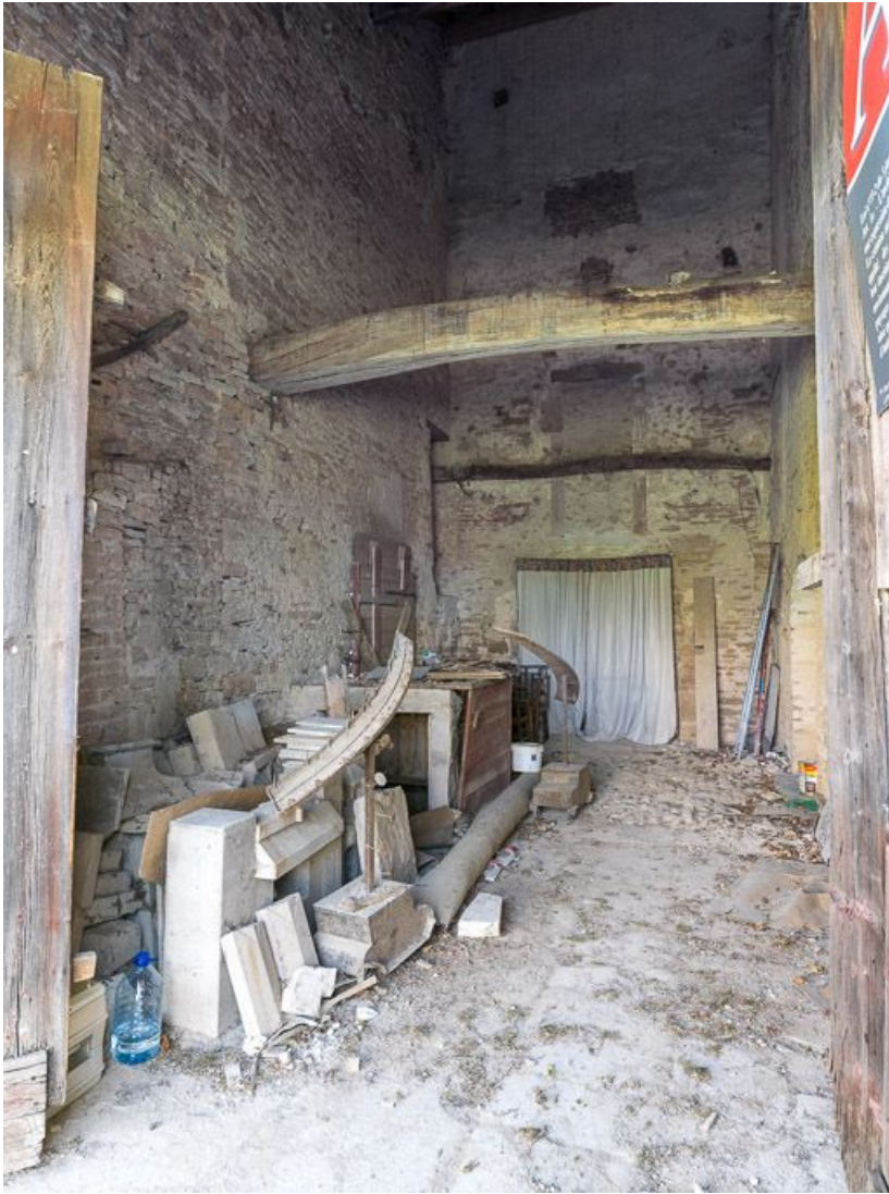
Vue du corps d'exploitation de l'ancienne ferme.

21, Ladoix-Serrigny, 1 rue de la Chapelle