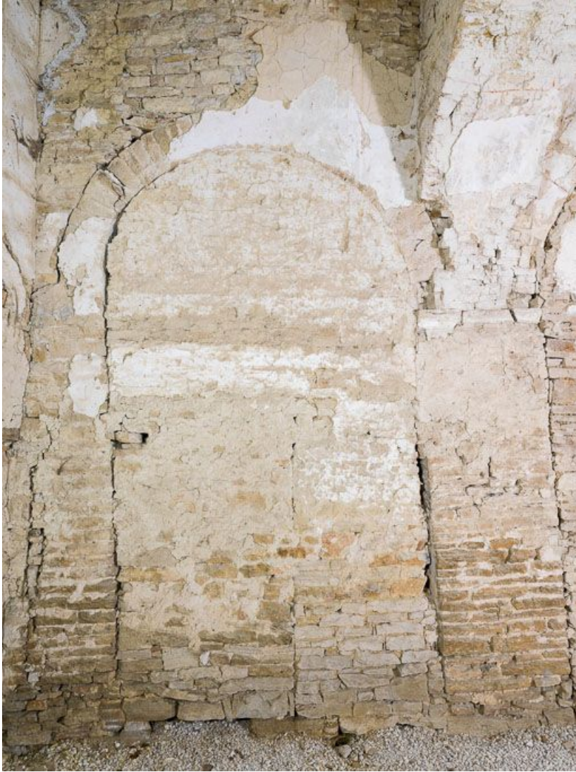
Ancienne chapelle : vue du mur est.

21, Ladoix-Serrigny, 1 rue de la Chapelle