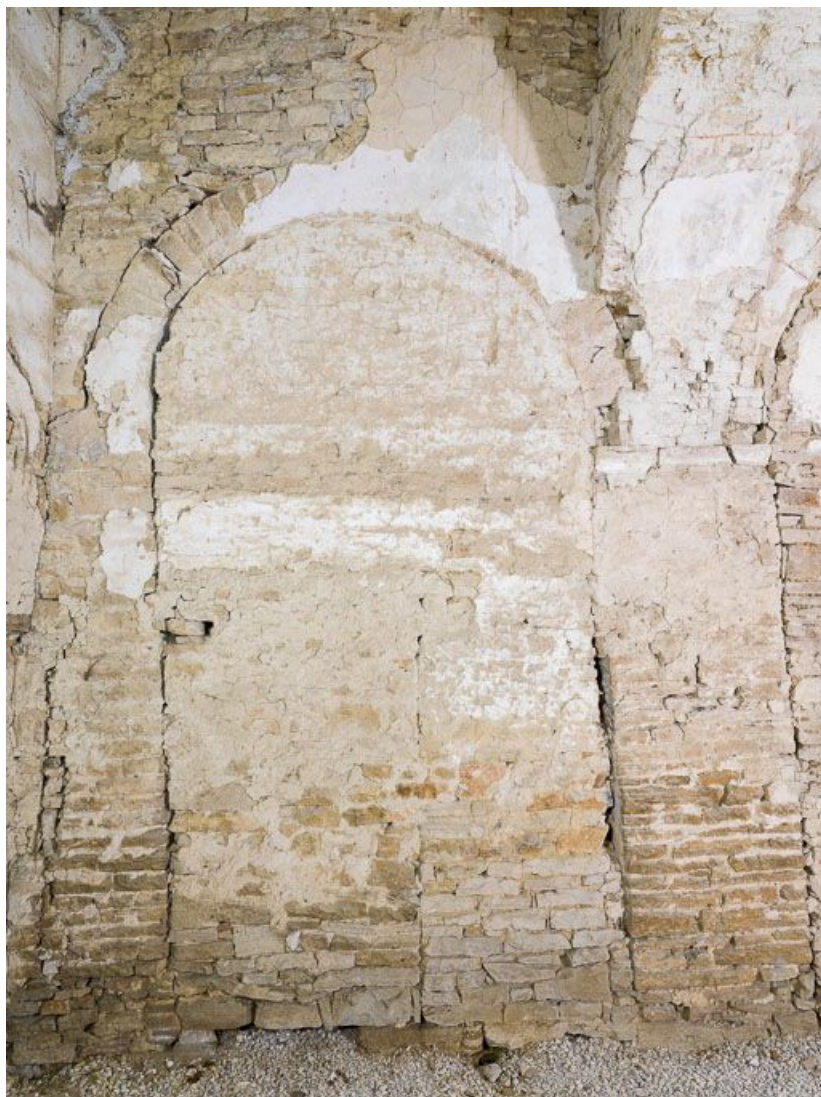
Ancienne chapelle : vue du mur est.

21, Ladoix-Serrigny, 1 rue de la Chapelle