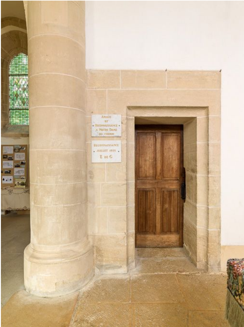
Vue de la porte de la sacristie.

21, Ladoix-Serrigny, 1 rue de la Chapelle