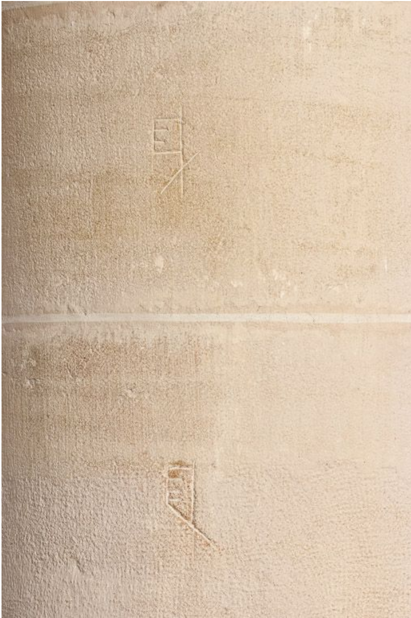
Marques de tâcheron ou d'assemblage sur un pilier de la nef.

21, Ladoix-Serrigny, 1 rue de la Chapelle