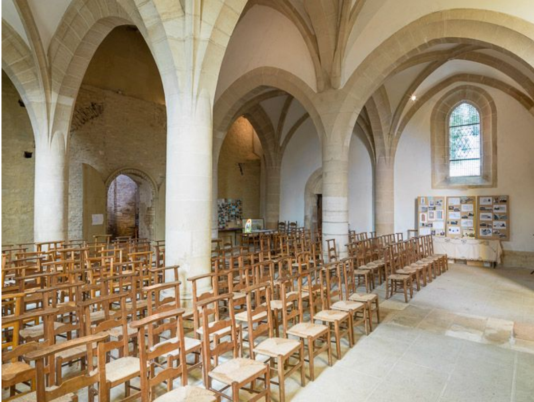
Vue d'ensemble de la nef, vers le nord-ouest.

21, Ladoix-Serrigny, 1 rue de la Chapelle