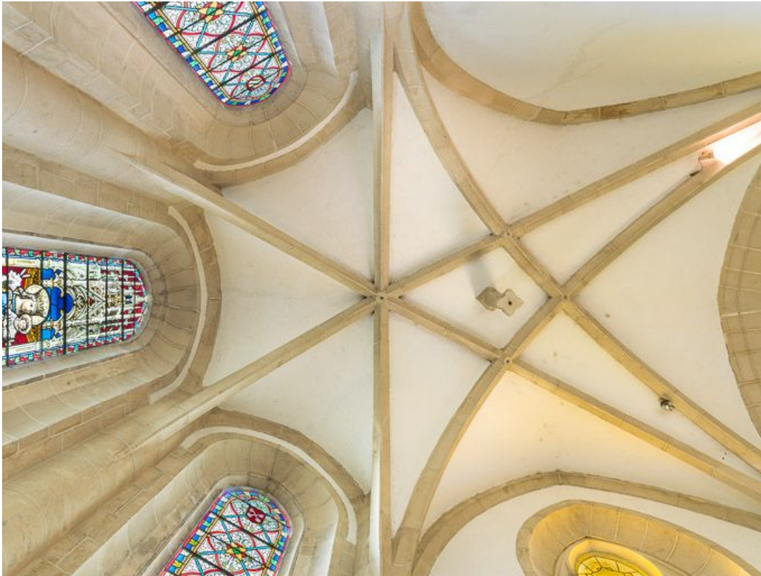
Vue de la voûte du chœur : détail.

21, Ladoix-Serrigny, 1 rue de la Chapelle