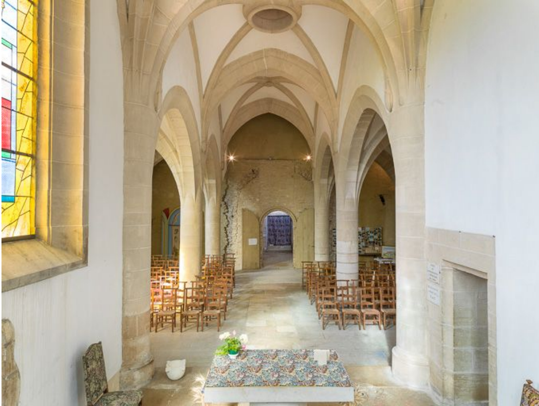
Vue d'ensemble de l'intérieur de la chapelle, depuis le chœur.

21, Ladoix-Serrigny, 1 rue de la Chapelle