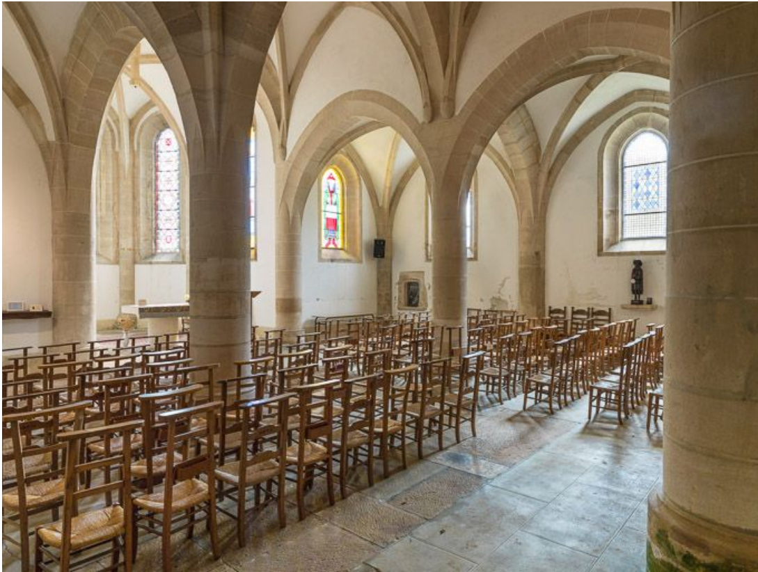
Vue d'ensemble de la nef, vers le sud-est.

21, Ladoix-Serrigny, 1 rue de la Chapelle