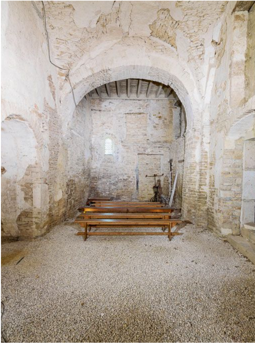
Ancienne chapelle : vue vers le Sud.

21, Ladoix-Serrigny, 1 rue de la Chapelle