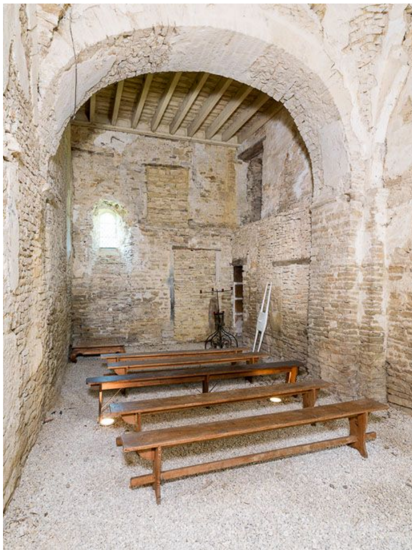
Ancienne chapelle : vue vers le sud, de trois-quarts.

21, Ladoix-Serrigny, 1 rue de la Chapelle