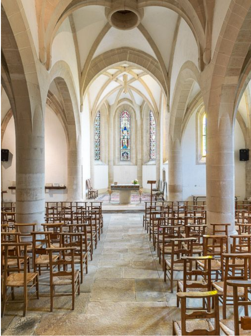
Vue d'ensemble de l'intérieur de la chapelle, vers le chœur.

21, Ladoix-Serrigny, 1 rue de la Chapelle