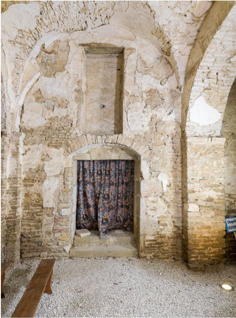
Ancienne chapelle : vue de la porte menant à la ferme (mur est).

21, Ladoix-Serrigny, 1 rue de la Chapelle