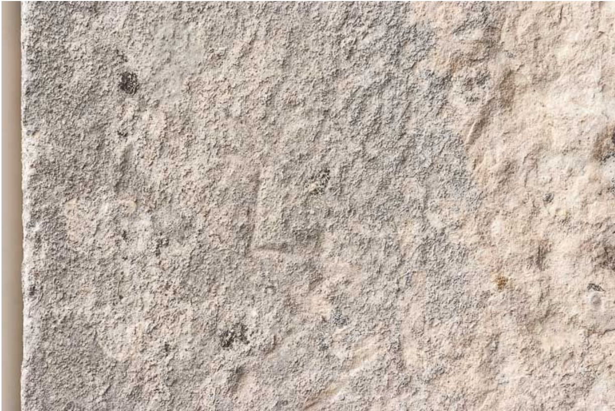
Marque de tâcheron sur la porte charretière à l'ouest de l'édifice.

21, Ladoix-Serrigny, 1 rue de la Chapelle