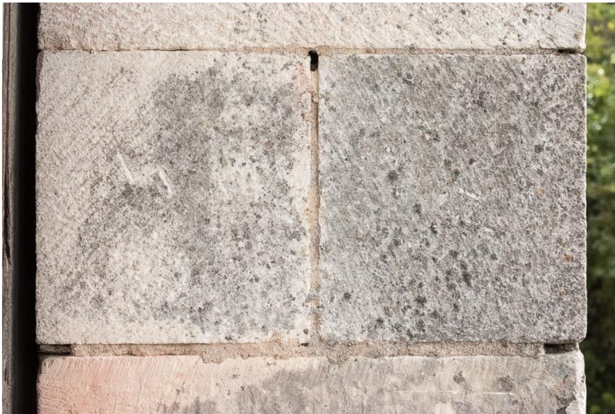
Marque de tâcheron sur la porte charretière à l'ouest de l'édifice.

21, Ladoix-Serrigny, 1 rue de la Chapelle