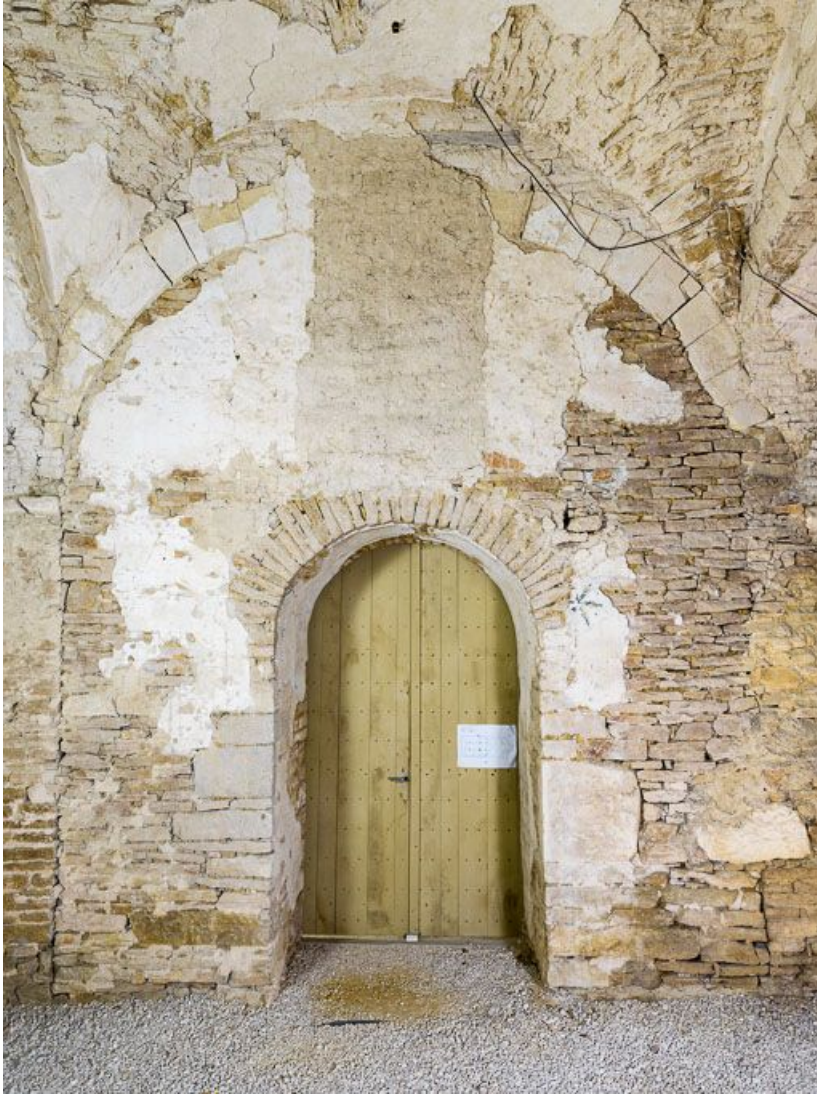
Ancienne chapelle : vue de la porte menant à la chapelle (mur ouest).

21, Ladoix-Serrigny, 1 rue de la Chapelle