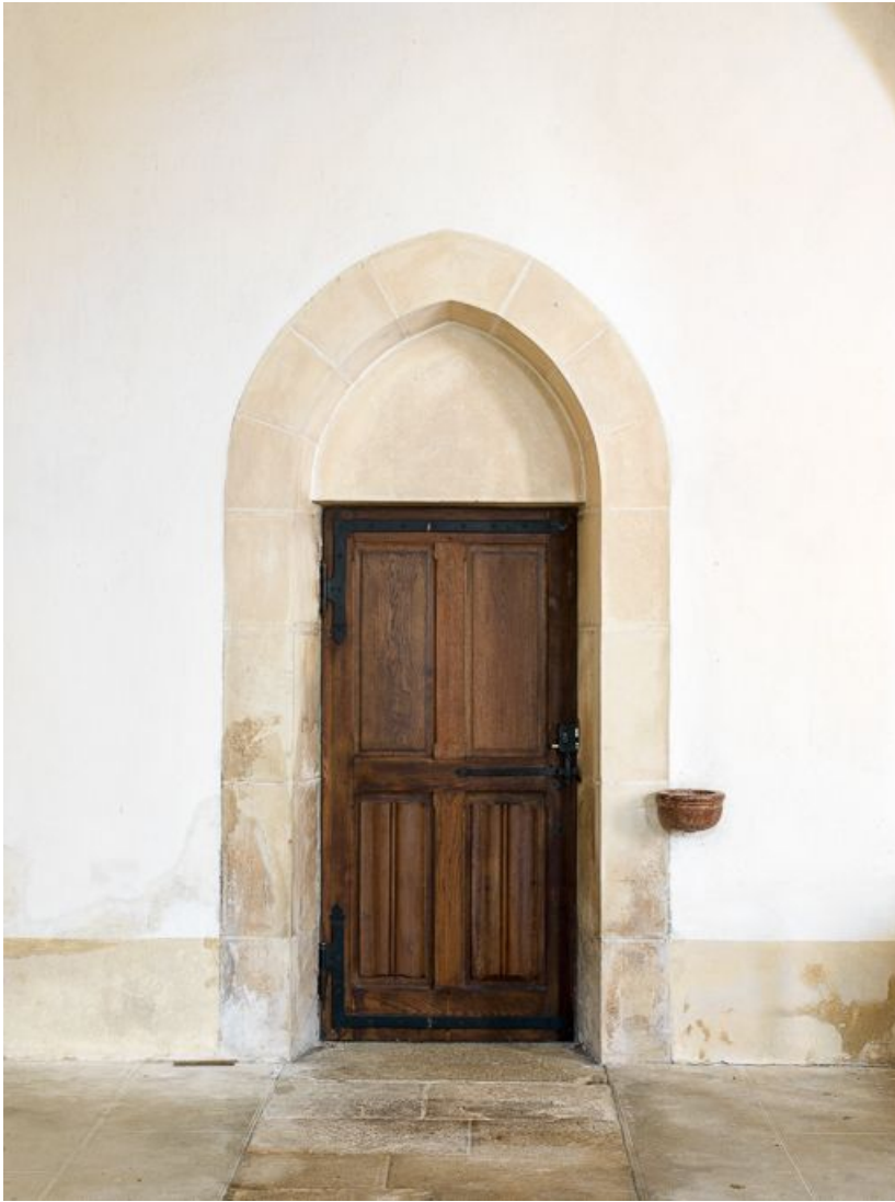
Vue de la porte d'entrée.

21, Ladoix-Serrigny, 1 rue de la Chapelle