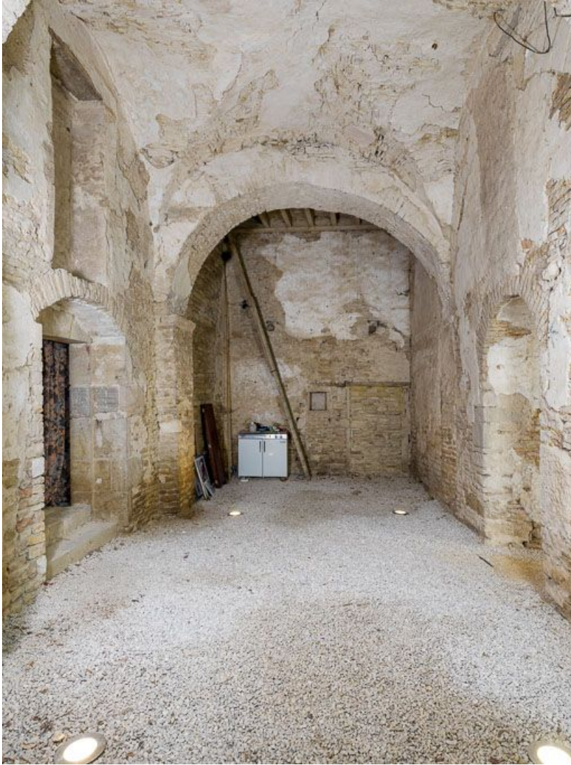
Ancienne chapelle : vue vers le Nord. 21, Ladoix-Serrigny, 1 rue de la Chapelle