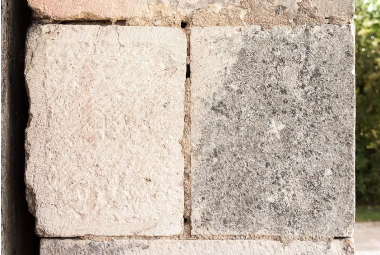
Marque de tâcheron sur la porte charretière à l'ouest de l'édifice.

21, Ladoix-Serrigny, 1 rue de la Chapelle