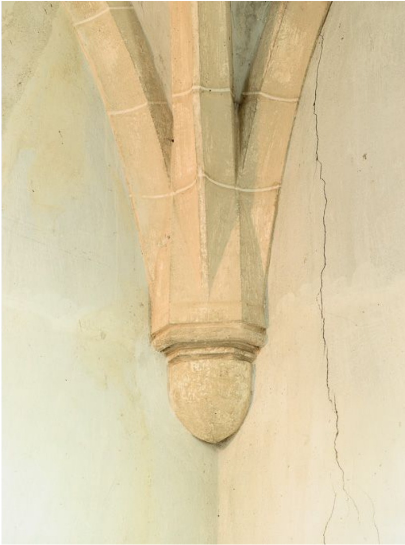
Vue d'un culot et du départ des ogives de la voûte de la sacristie.

21, Ladoix-Serrigny, 1 rue de la Chapelle