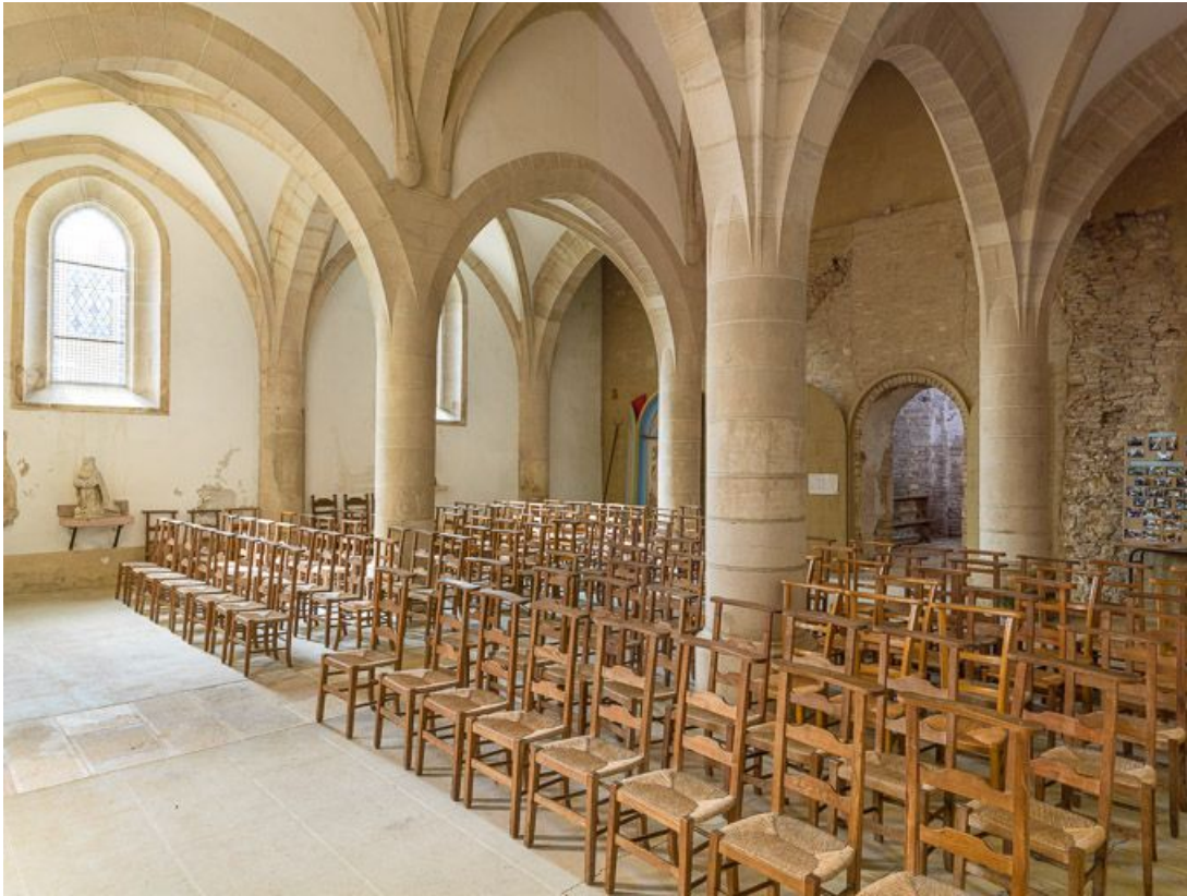
Vue d'ensemble de la nef, vers le sud-ouest.

21, Ladoix-Serrigny, 1 rue de la Chapelle