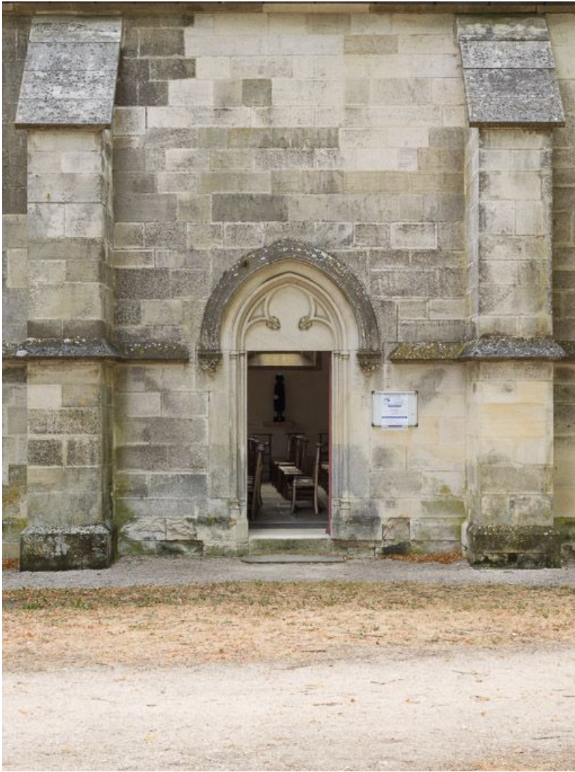
Vue de la porte d'entrée de la chapelle (pignon nord).

21, Ladoix-Serrigny, 1 rue de la Chapelle