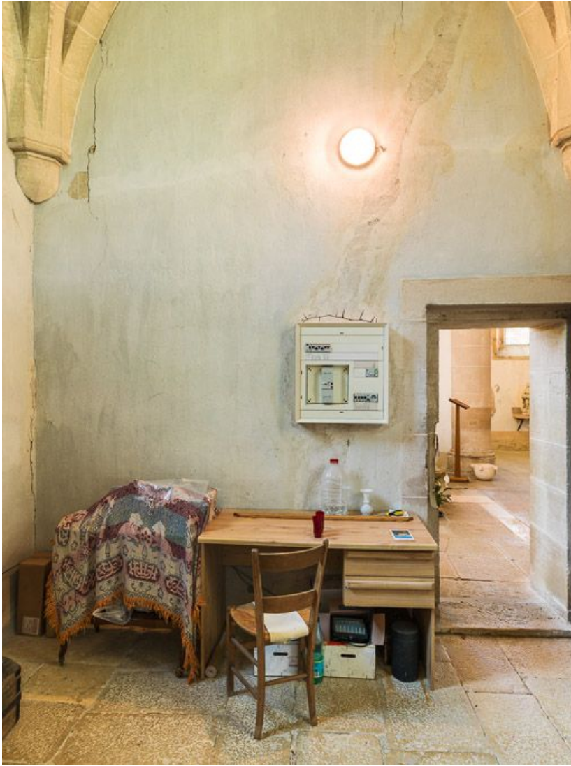
Vue d'ensemble de la sacristie.

21, Ladoix-Serrigny, 1 rue de la Chapelle