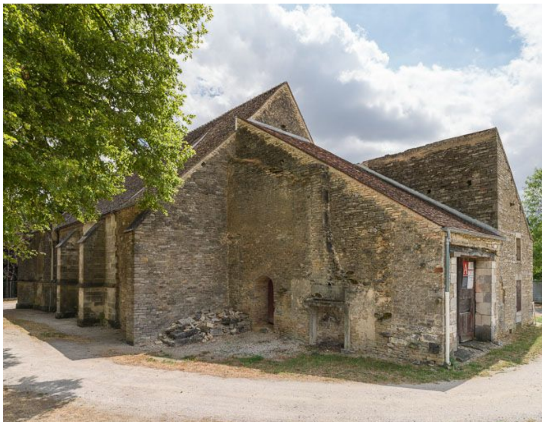
Vue de l'angle nord-ouest.

21, Ladoix-Serrigny, 1 rue de la Chapelle