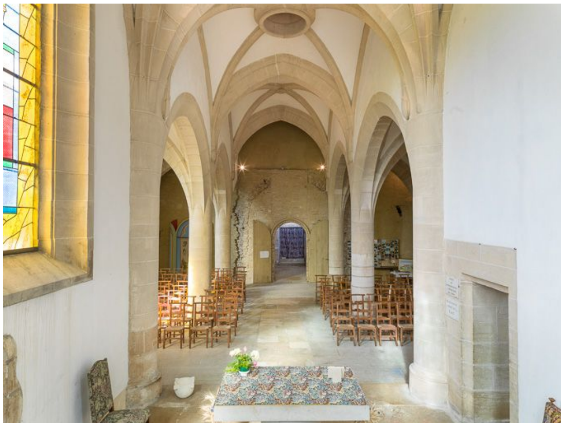
Vue d'ensemble de l'intérieur de la chapelle, depuis le chœur.

21, Ladoix-Serrigny, 1 rue de la Chapelle