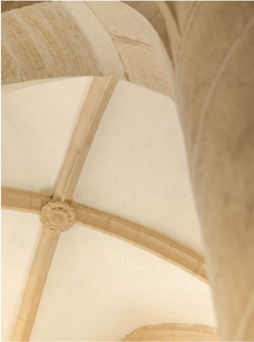
Vue d'une clé de voûte de la nef (travée ouest).

21, Ladoix-Serrigny, 1 rue de la Chapelle