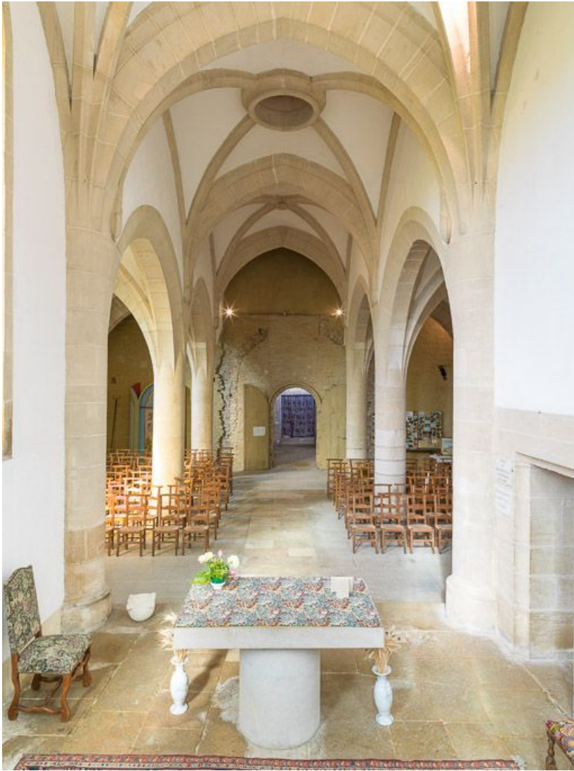
Vue d'ensemble de l'intérieur de la chapelle, depuis le chœur.

21, Ladoix-Serrigny, 1 rue de la Chapelle