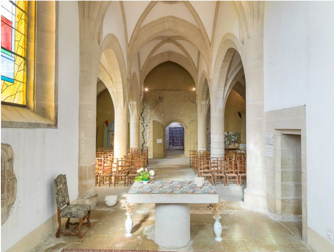
Vue d'ensemble de l'intérieur de la chapelle : chœur et nef.

21, Ladoix-Serrigny, 1 rue de la Chapelle