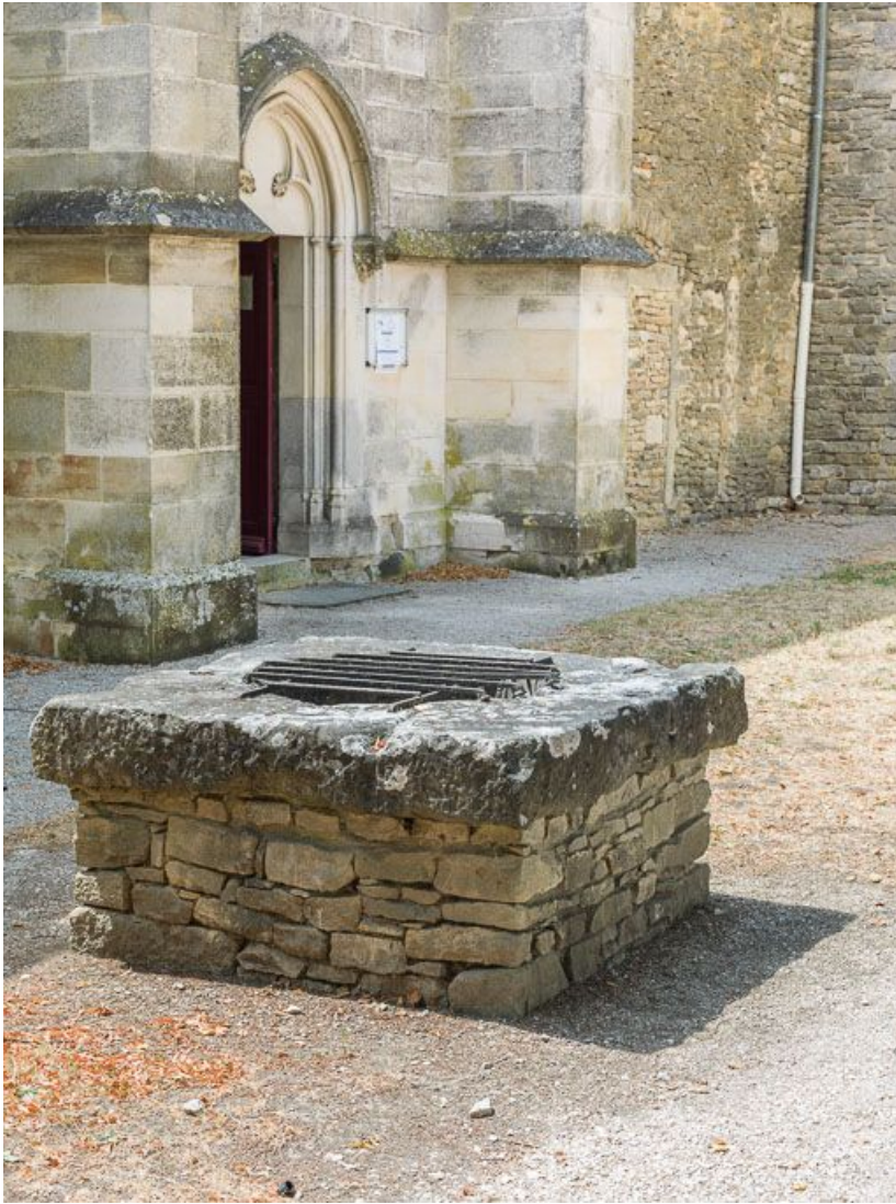
Puits : vue d'ensemble.

21, Ladoix-Serrigny, 1 rue de la Chapelle