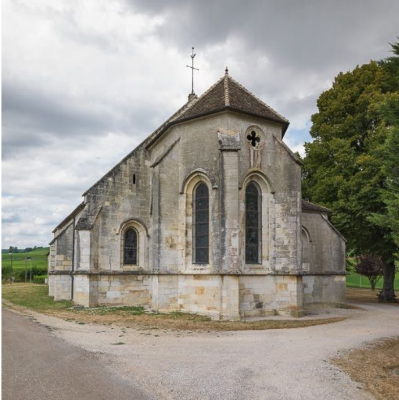
Vue du chevet de la chapelle.

21, Ladoix-Serrigny, 1 rue de la Chapelle