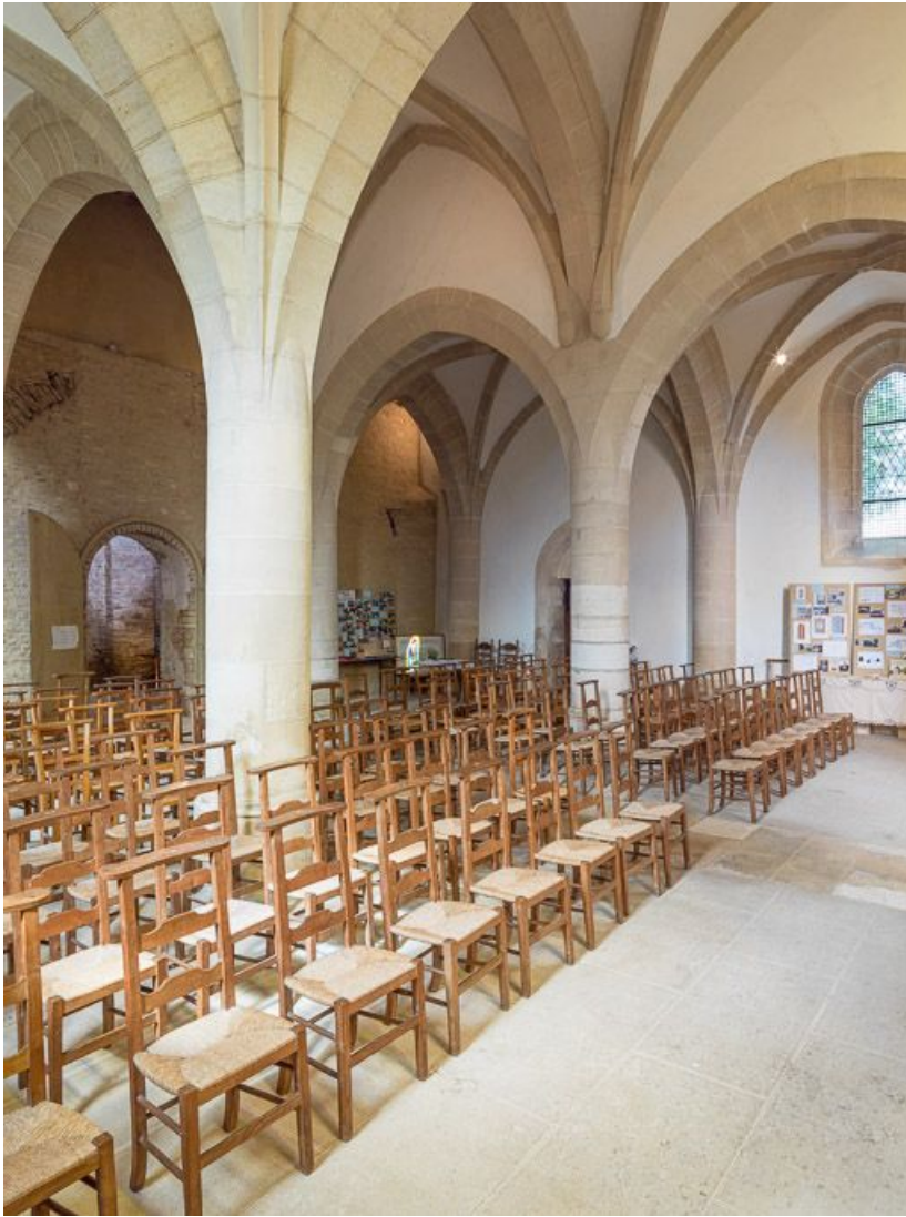
Vue d'ensemble de la nef, vers le nord-ouest.

21, Ladoix-Serrigny, 1 rue de la Chapelle