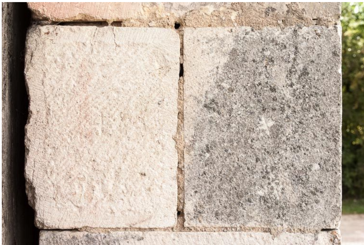
Marque de tâcheron sur la porte charretière à l'ouest de l'édifice.

21, Ladoix-Serrigny, 1 rue de la Chapelle