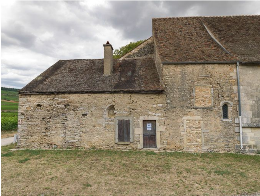
Vue du pignon sud.

21, Ladoix-Serrigny, 1 rue de la Chapelle