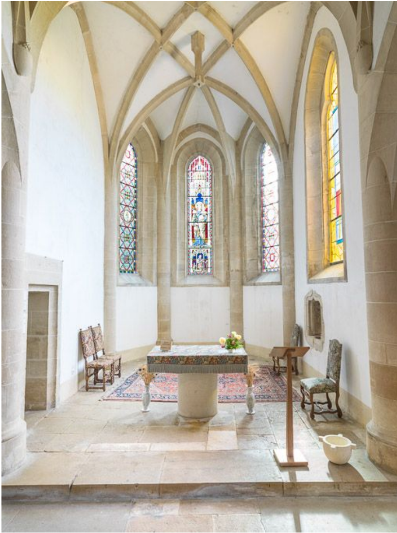
Vue d'ensemble du chœur.

21, Ladoix-Serrigny, 1 rue de la Chapelle