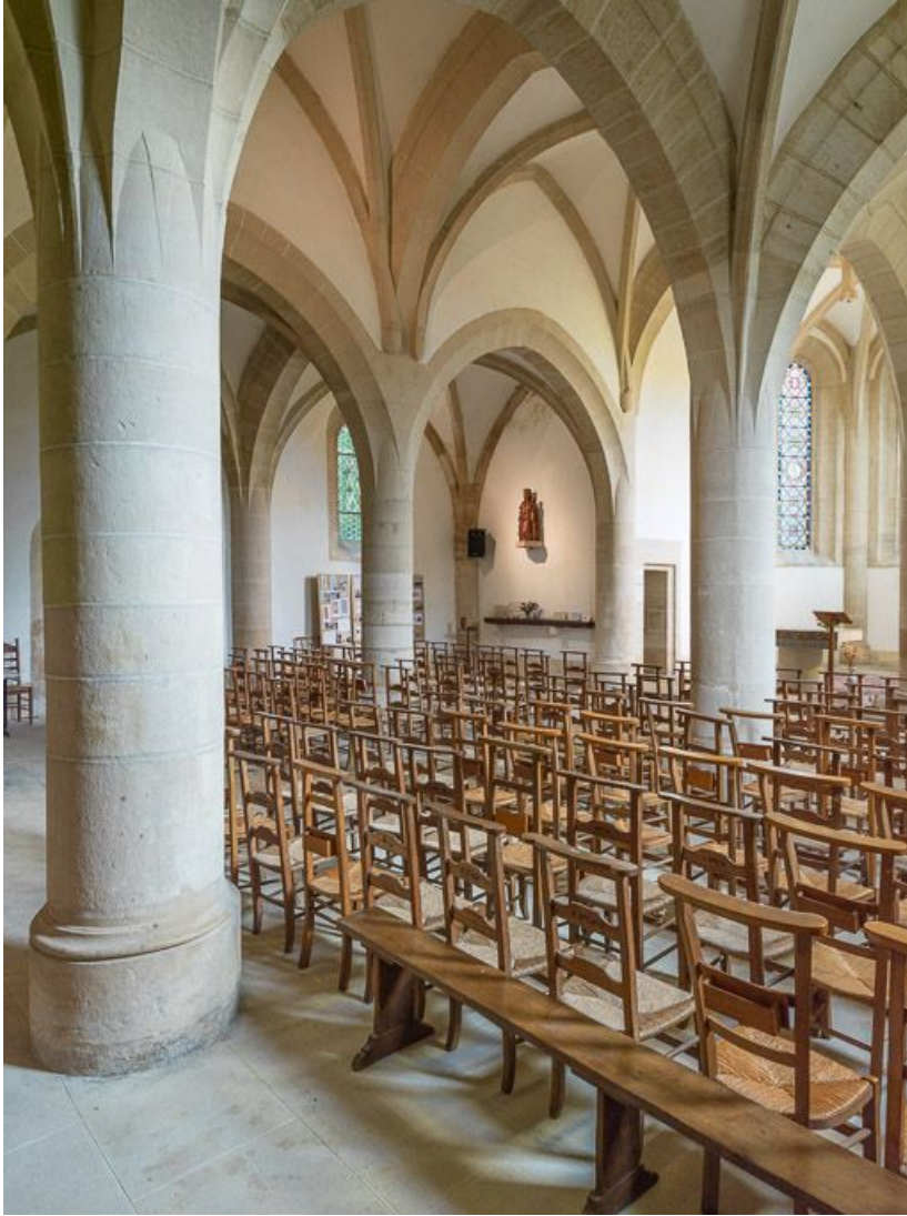
Vue d'ensemble de la nef, vers le nord-est.

21, Ladoix-Serrigny, 1 rue de la Chapelle