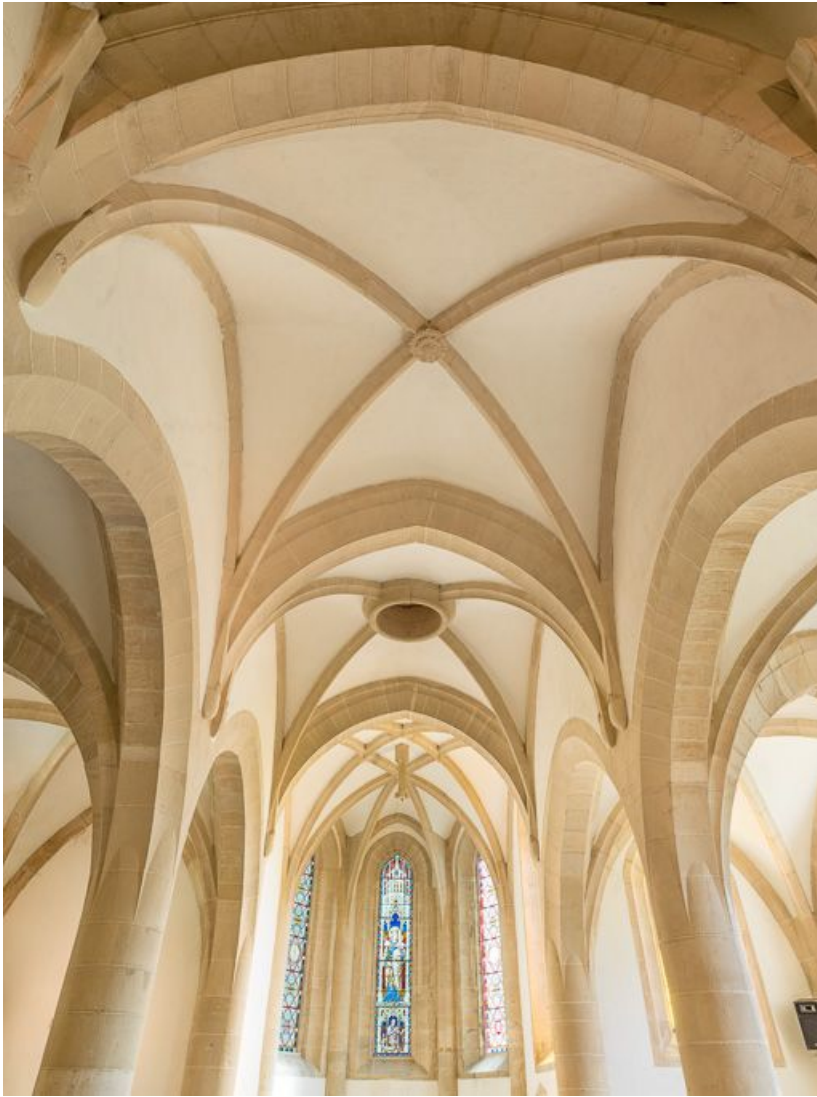
Vue des voûtes de la nef.

21, Ladoix-Serrigny, 1 rue de la Chapelle