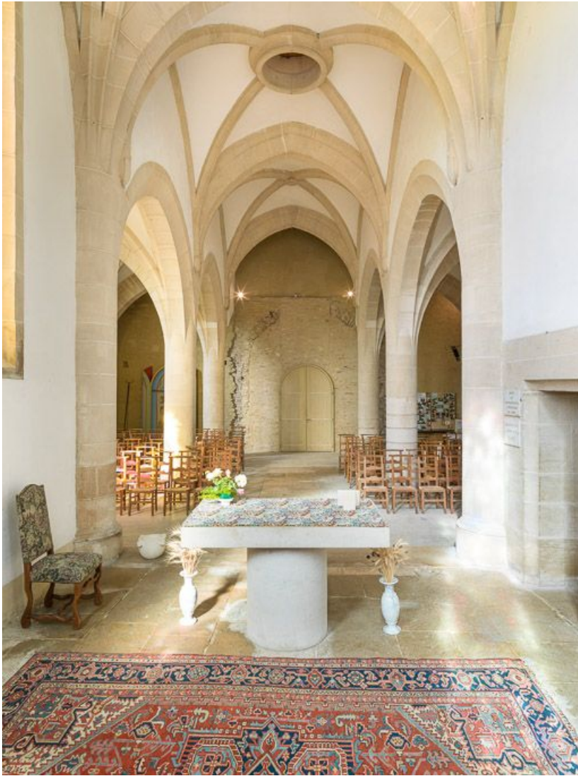
Vue d'ensemble de l'intérieur de la chapelle, depuis le chœur.

21, Ladoix-Serrigny, 1 rue de la Chapelle