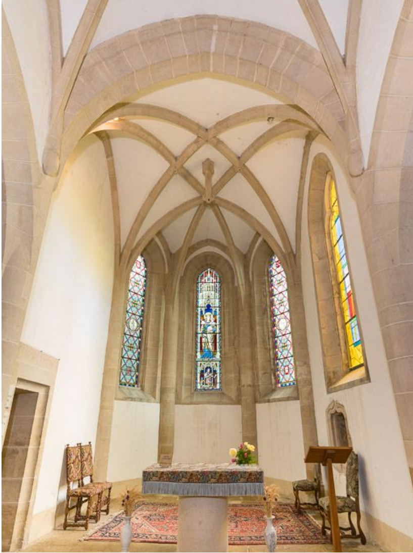
Vue de la voûte du chœur.

21, Ladoix-Serrigny, 1 rue de la Chapelle