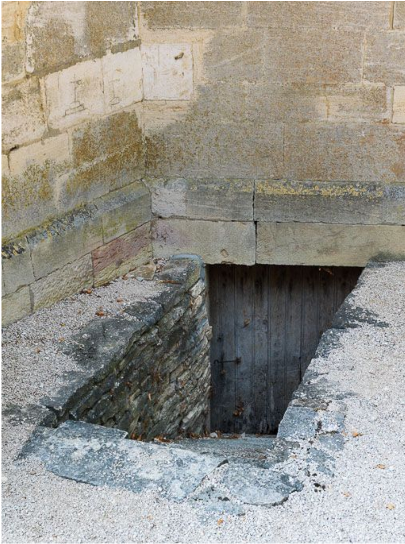
Vue de la porte de la cave (chevet).

21, Ladoix-Serrigny, 1 rue de la Chapelle