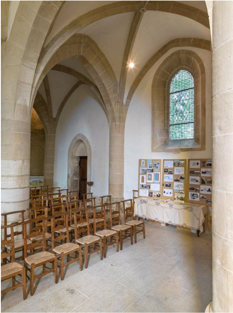
Vue de la nef depuis le chœur, en direction du nord-ouest.

21, Ladoix-Serrigny, 1 rue de la Chapelle