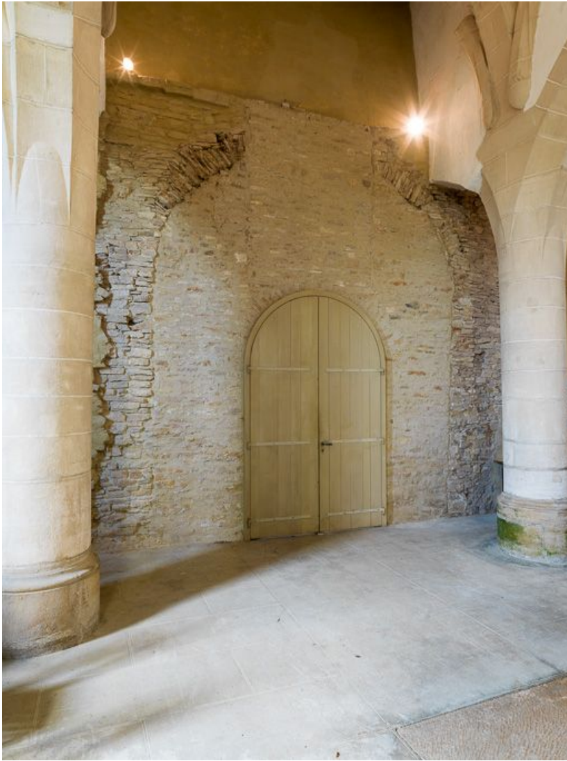
Vue du mur du fond de la nef (ouest). 21, Ladoix-Serrigny, 1 rue de la Chapelle