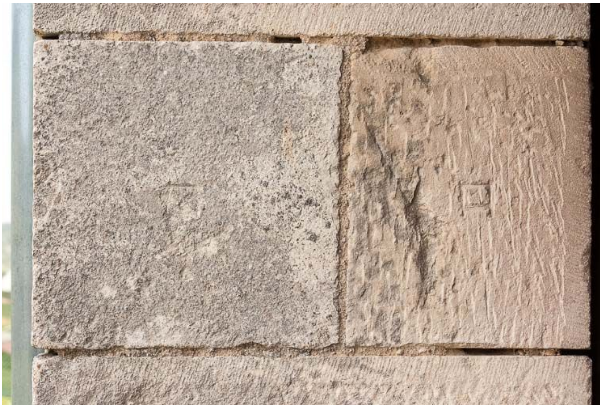
Marque de tâcheron sur la porte charretière à l'ouest de l'édifice.

21, Ladoix-Serrigny, 1 rue de la Chapelle