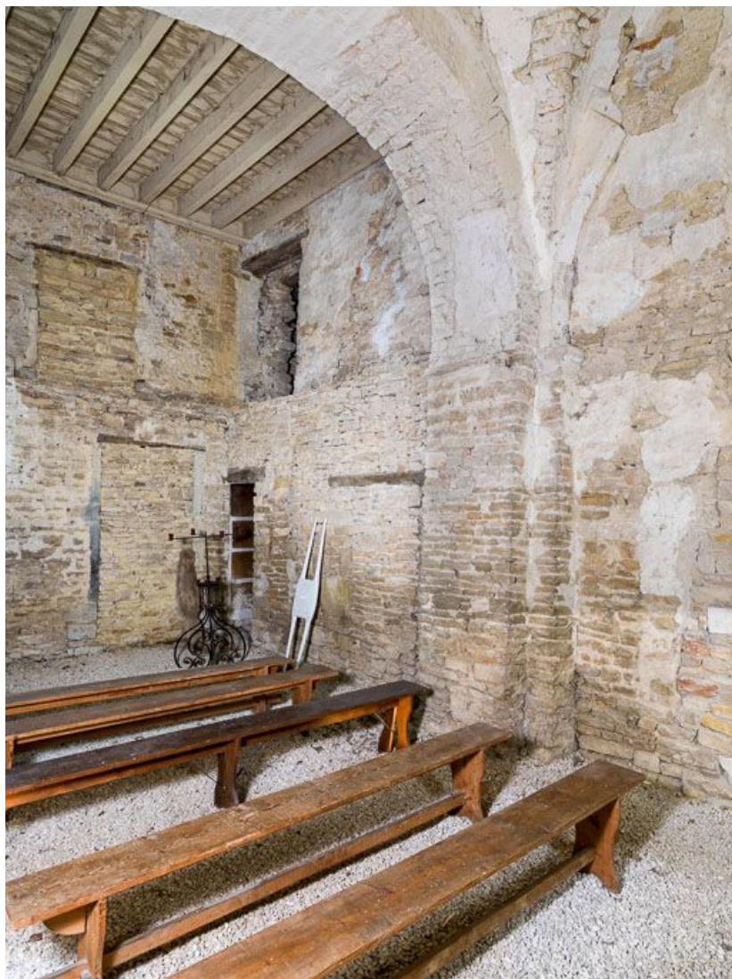
Ancienne chapelle : vue de l'angle sud-ouest.

21, Ladoix-Serrigny, 1 rue de la Chapelle