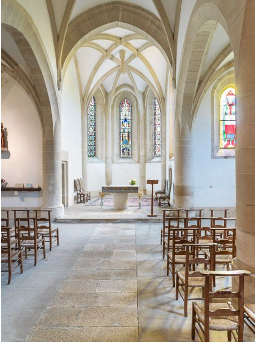
Vue d'ensemble de l'intérieur de la chapelle, vers le chœur.

21, Ladoix-Serrigny, 1 rue de la Chapelle