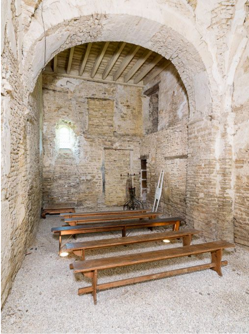
Ancienne chapelle : vue vers le sud, de trois-quarts.

21, Ladoix-Serrigny, 1 rue de la Chapelle