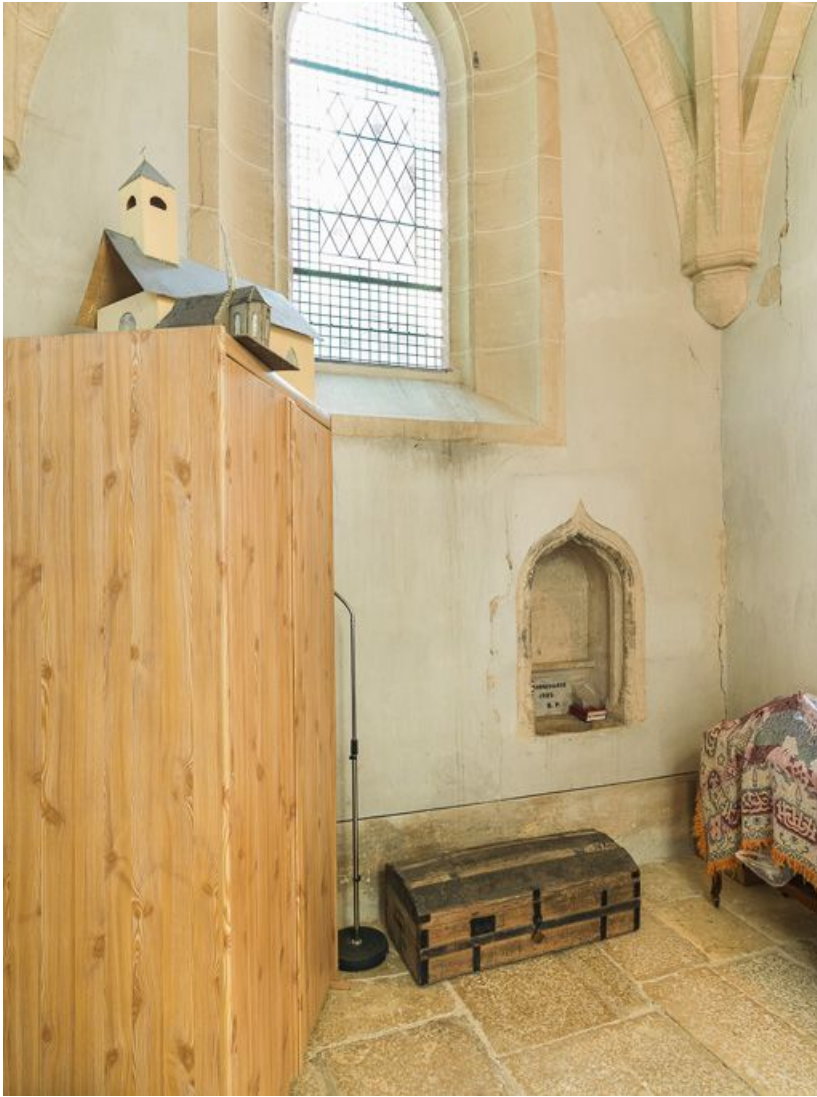
Vue d'ensemble de la sacristie.

21, Ladoix-Serrigny, 1 rue de la Chapelle