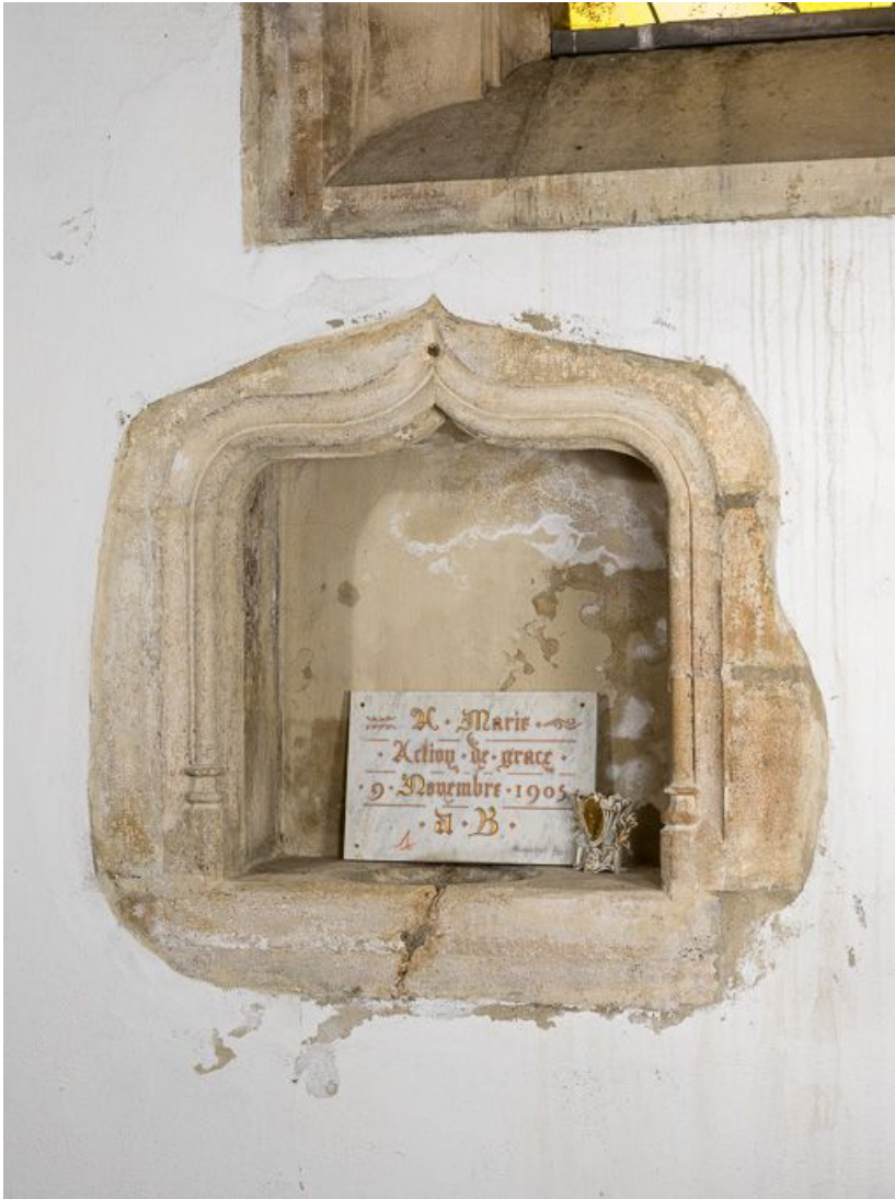
Vue du lavabo du chœur.

21, Ladoix-Serrigny, 1 rue de la Chapelle