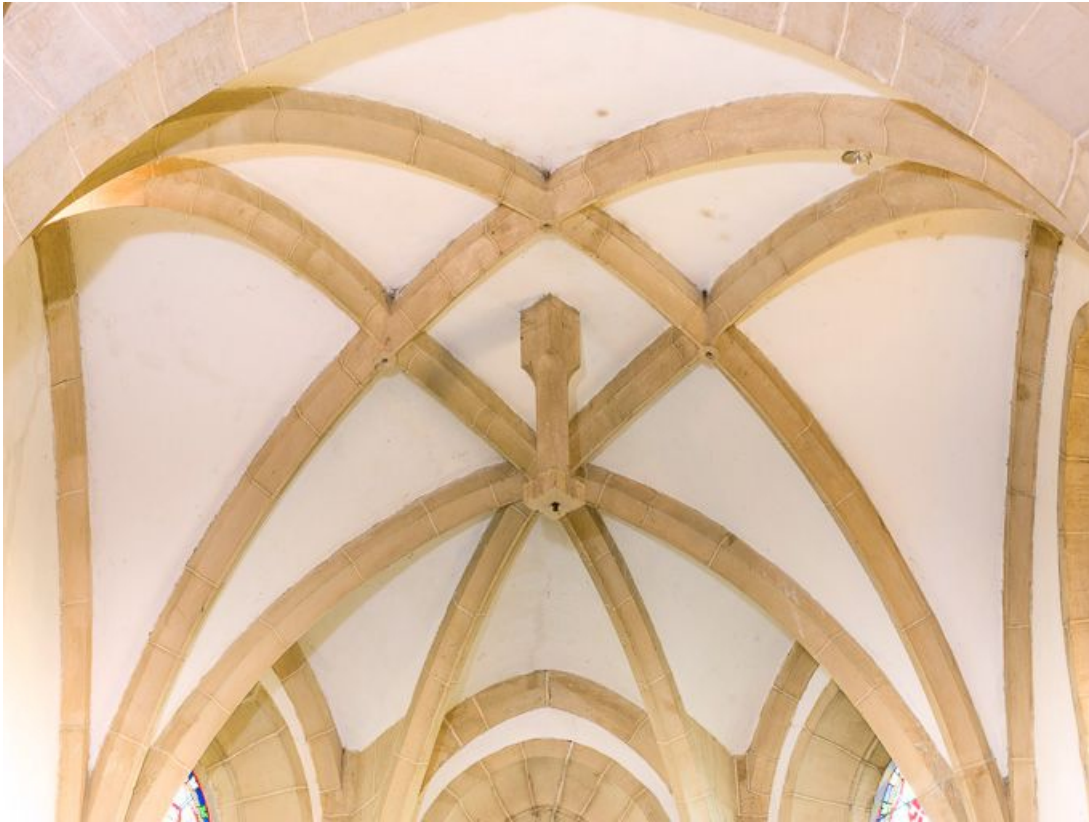
Vue de la voûte du chœur.

21, Ladoix-Serrigny, 1 rue de la Chapelle