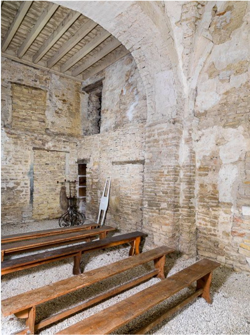
Ancienne chapelle : vue de l'angle sud-ouest.

21, Ladoix-Serrigny, 1 rue de la Chapelle