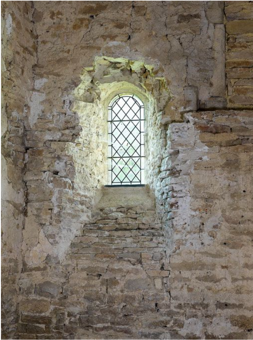
Ancienne chapelle : vue de la baie romane du mur sud.

21, Ladoix-Serrigny, 1 rue de la Chapelle