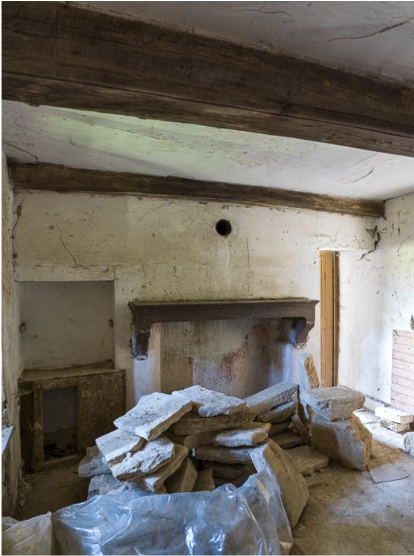
Vue d'un ancien logement (rez-de-chaussée). 21, Ladoix-Serrigny, 1 rue de la Chapelle