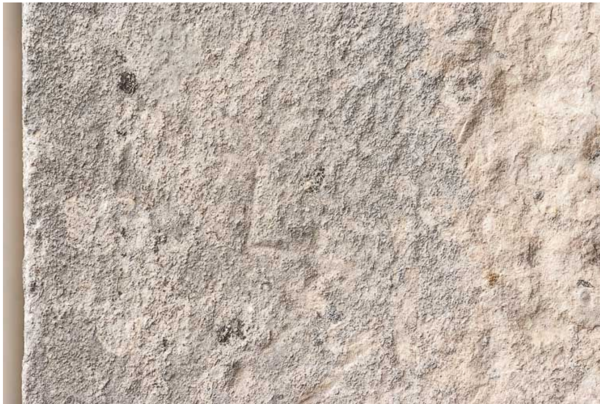
Marque de tâcheron sur la porte charretière à l'ouest de l'édifice.

21, Ladoix-Serrigny, 1 rue de la Chapelle