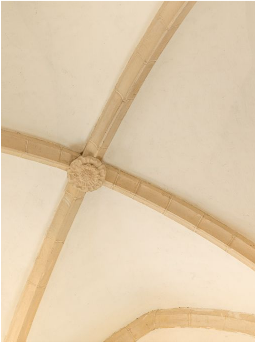
Vue d'une clé de voûte de la nef (travée ouest).

21, Ladoix-Serrigny, 1 rue de la Chapelle