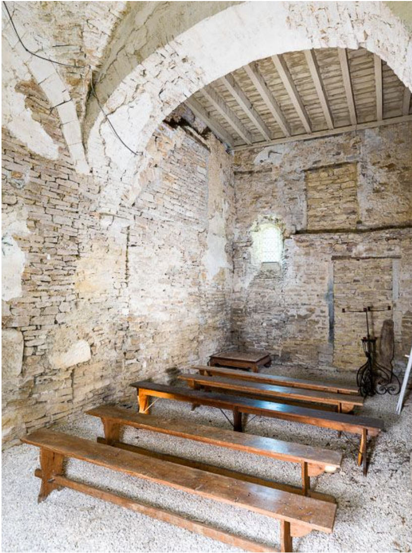
Ancienne chapelle : vue vers le sud, de trois-quarts.

21, Ladoix-Serrigny, 1 rue de la Chapelle