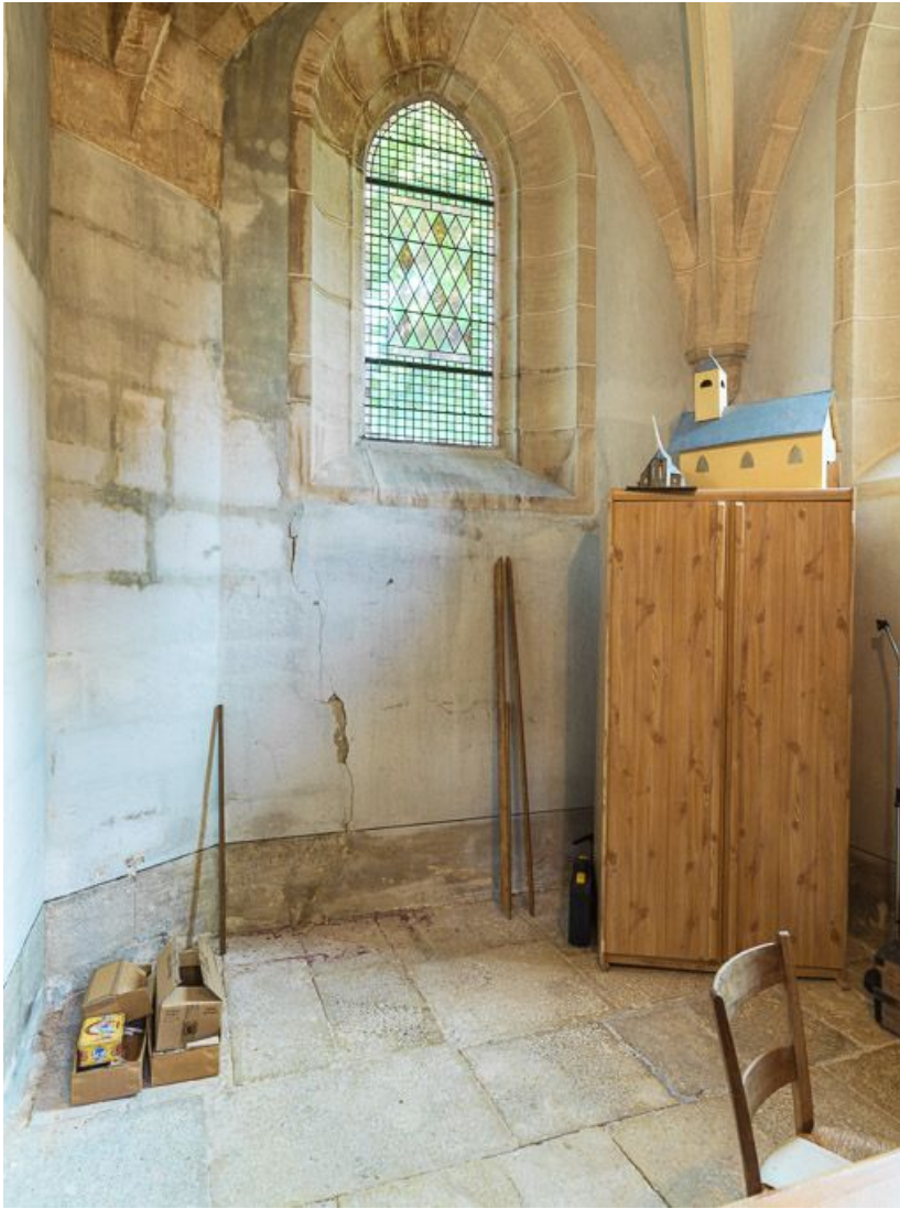
Vue d'ensemble de la sacristie.

21, Ladoix-Serrigny, 1 rue de la Chapelle