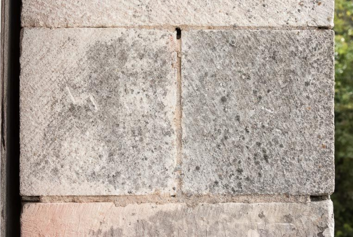
Marque de tâcheron sur la porte charretière à l'ouest de l'édifice.

21, Ladoix-Serrigny, 1 rue de la Chapelle