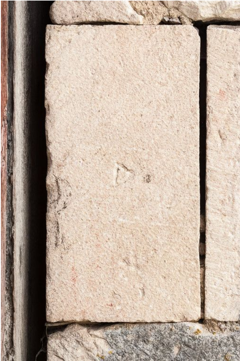
Marque de tâcheron sur la porte charretière à l'ouest de l'édifice.

21, Ladoix-Serrigny, 1 rue de la Chapelle