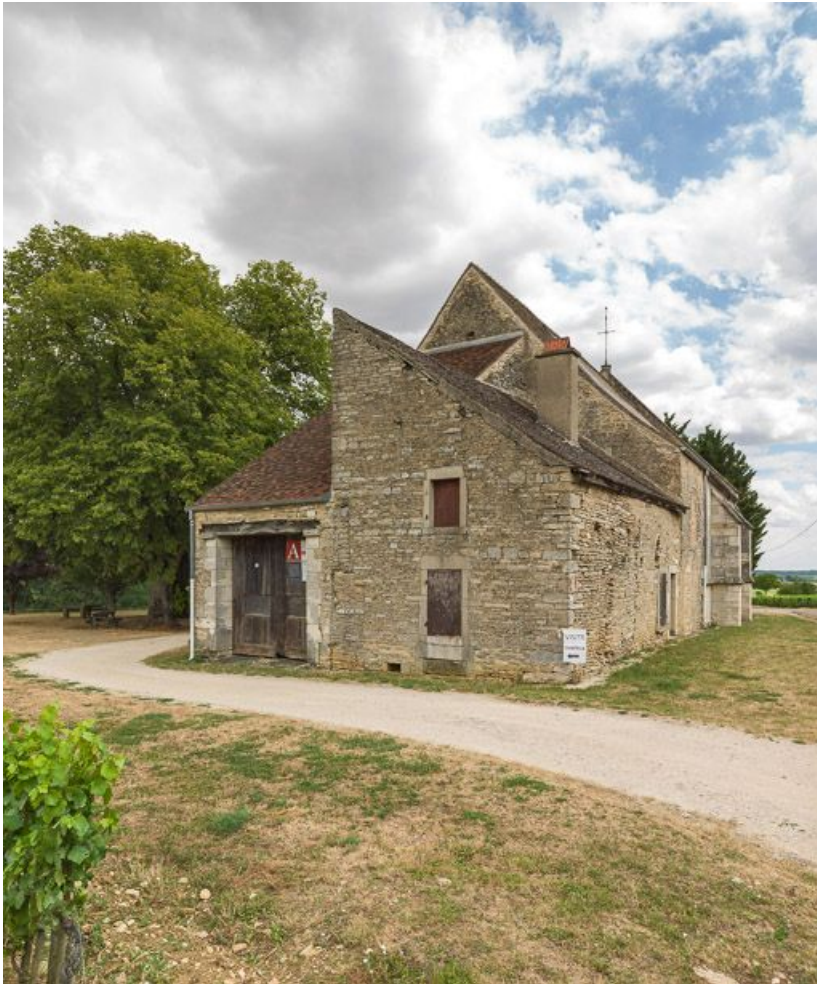
Vue de la façade ouest.

21, Ladoix-Serrigny, 1 rue de la Chapelle