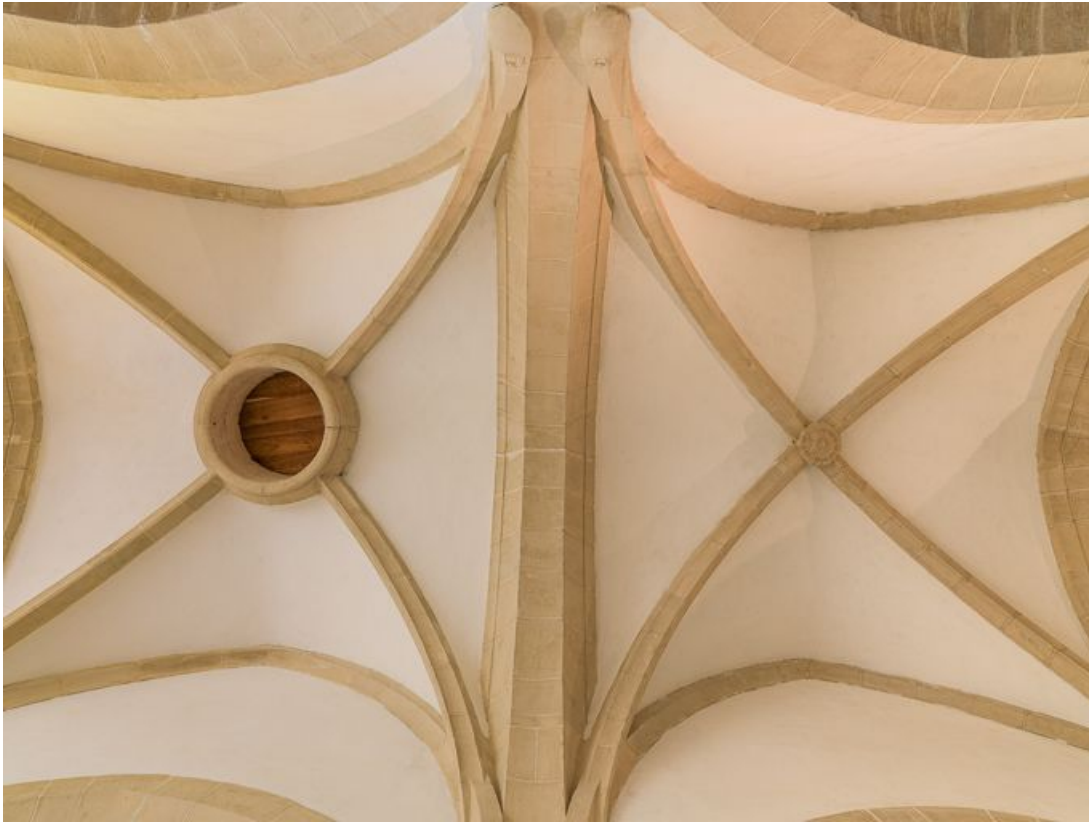
Vue des voûtes de la nef.

21, Ladoix-Serrigny, 1 rue de la Chapelle