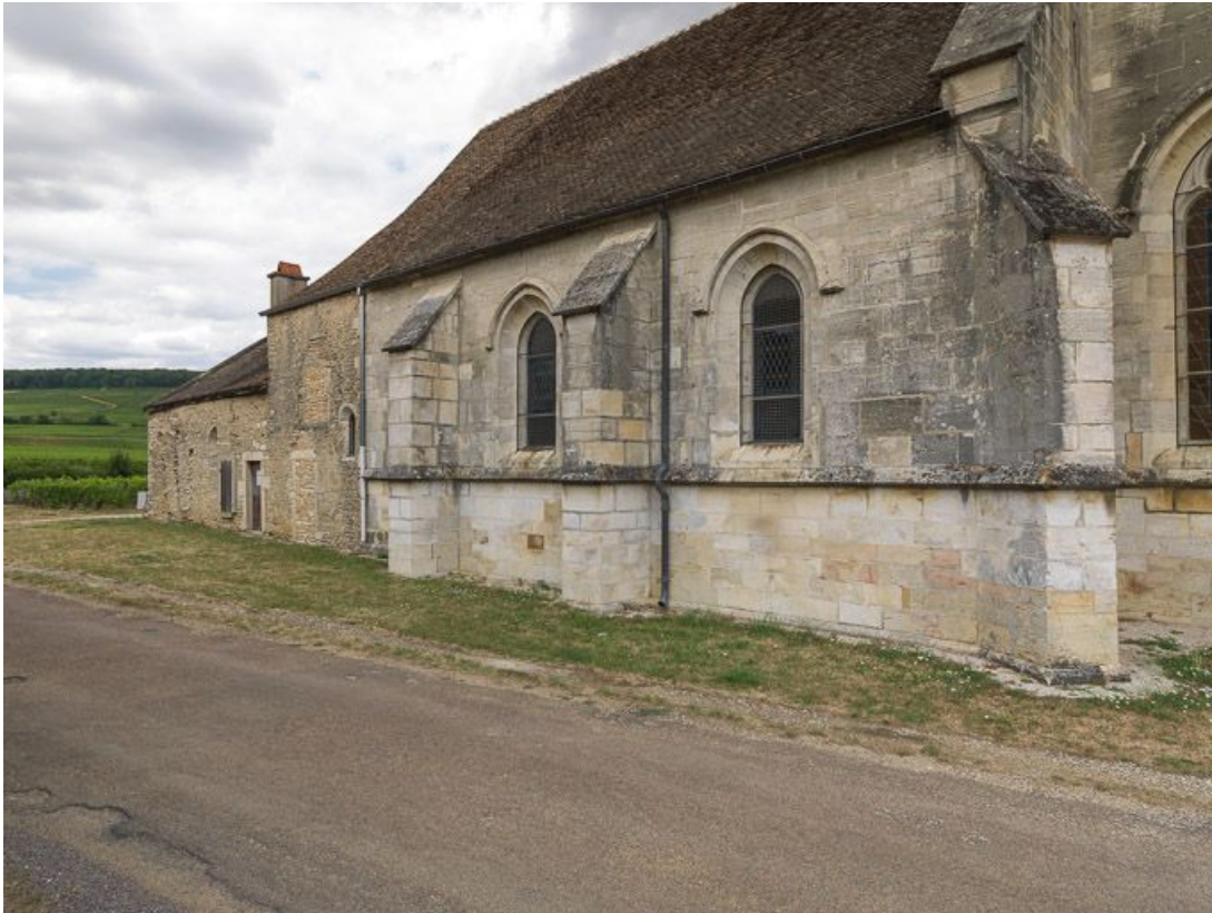
Vue du pignon sud de la chapelle.

21, Ladoix-Serrigny, 1 rue de la Chapelle