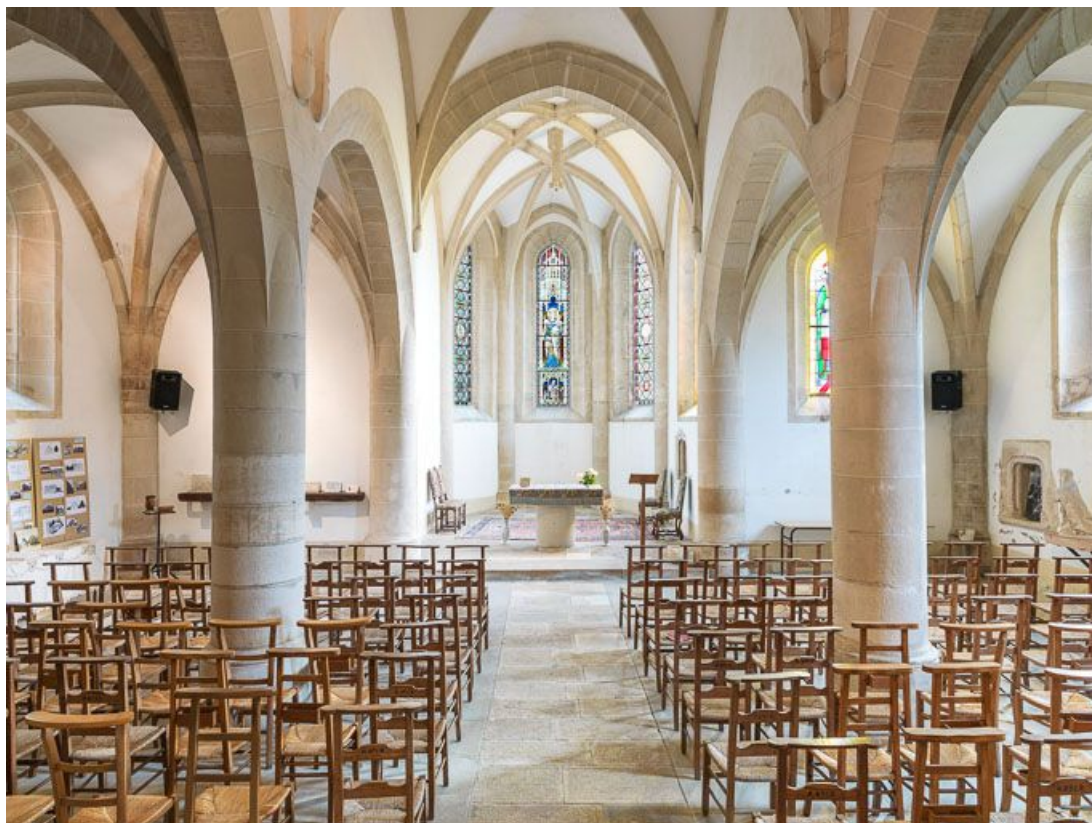
Vue d'ensemble de l'intérieur de la chapelle, vers le chœur.

21, Ladoix-Serrigny, 1 rue de la Chapelle