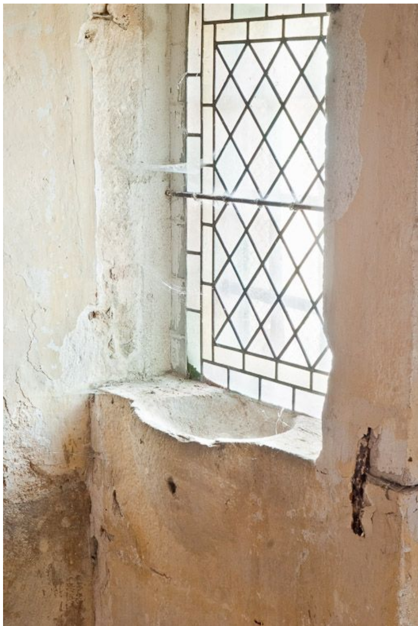
Bénitier dans l'appui de la fenêtre à droite en entrant.

21, Volnay R.D. 973, lieudit : près de En Verseuil