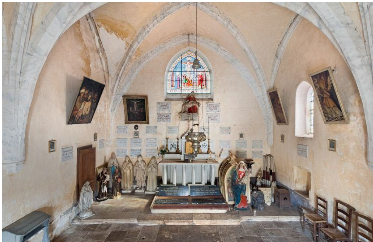
Vue d'ensemble depuis l'entrée.

21, Volnay R.D. 973, lieudit : près de En Verseuil