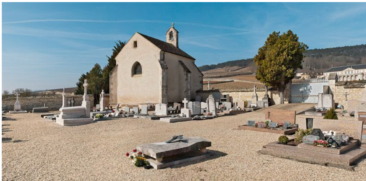
Vue côté chevet et cimetière.

21, Volnay R.D. 973, lieudit : près de En Verseuil