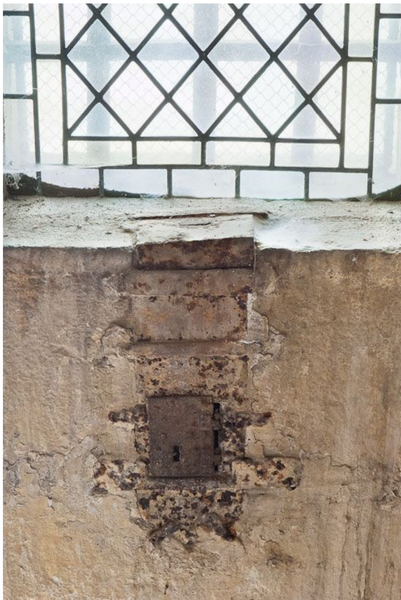
Tronc dans l'appui de la fenêtre à gauche en entrant.

21, Volnay R.D. 973, lieudit : près de En Verseuil