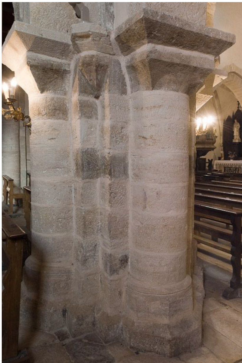
Premier pilier entre la nef et le bas-côté droit. 21, Volnay Eglise