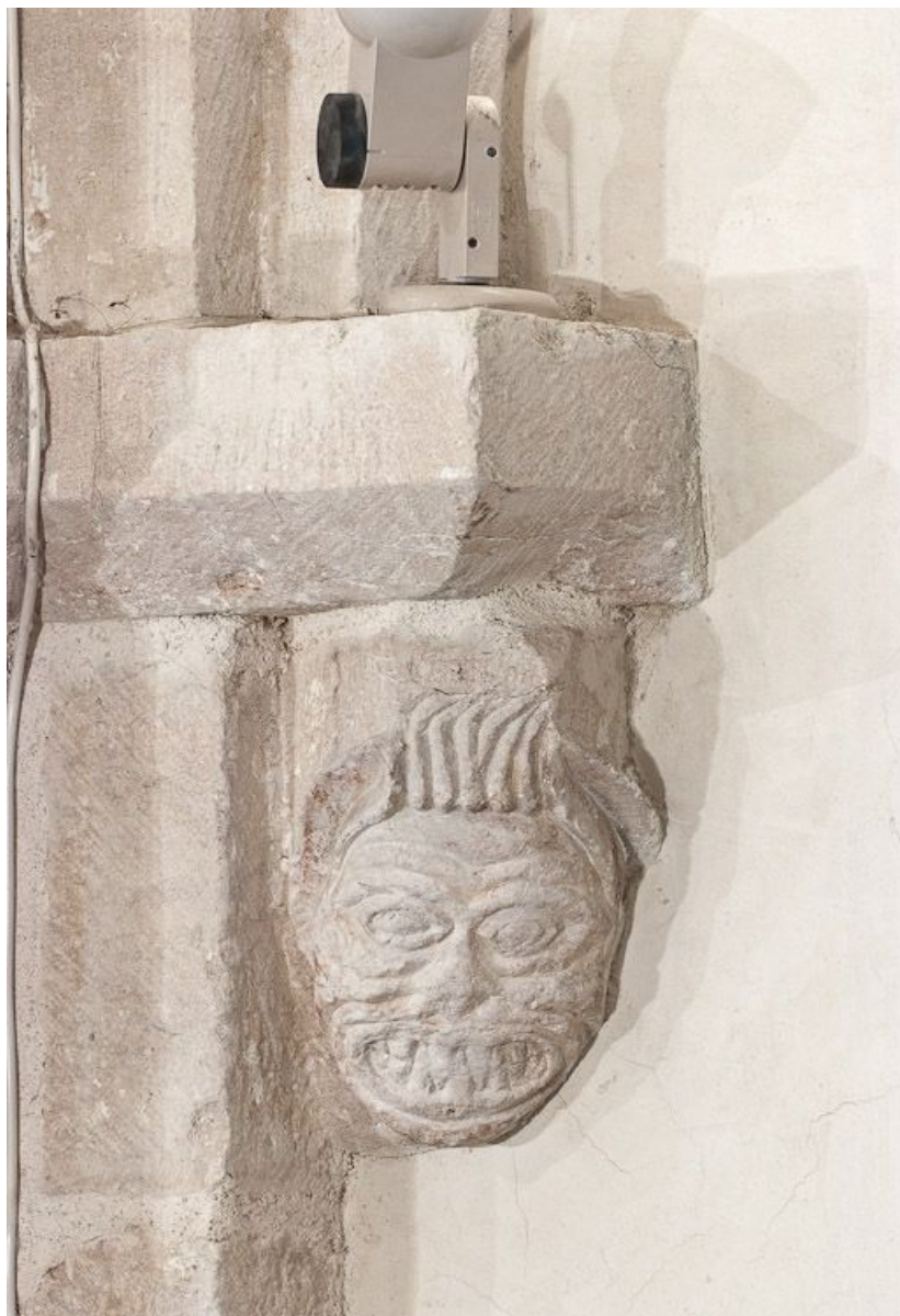
Culot antérieur gauche de la troisième travée du bas-côté gauche. 21, Volnay Eglise