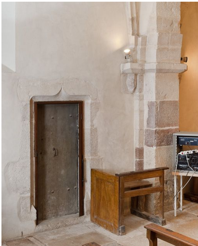
Porte de la tourelle d'escalier.