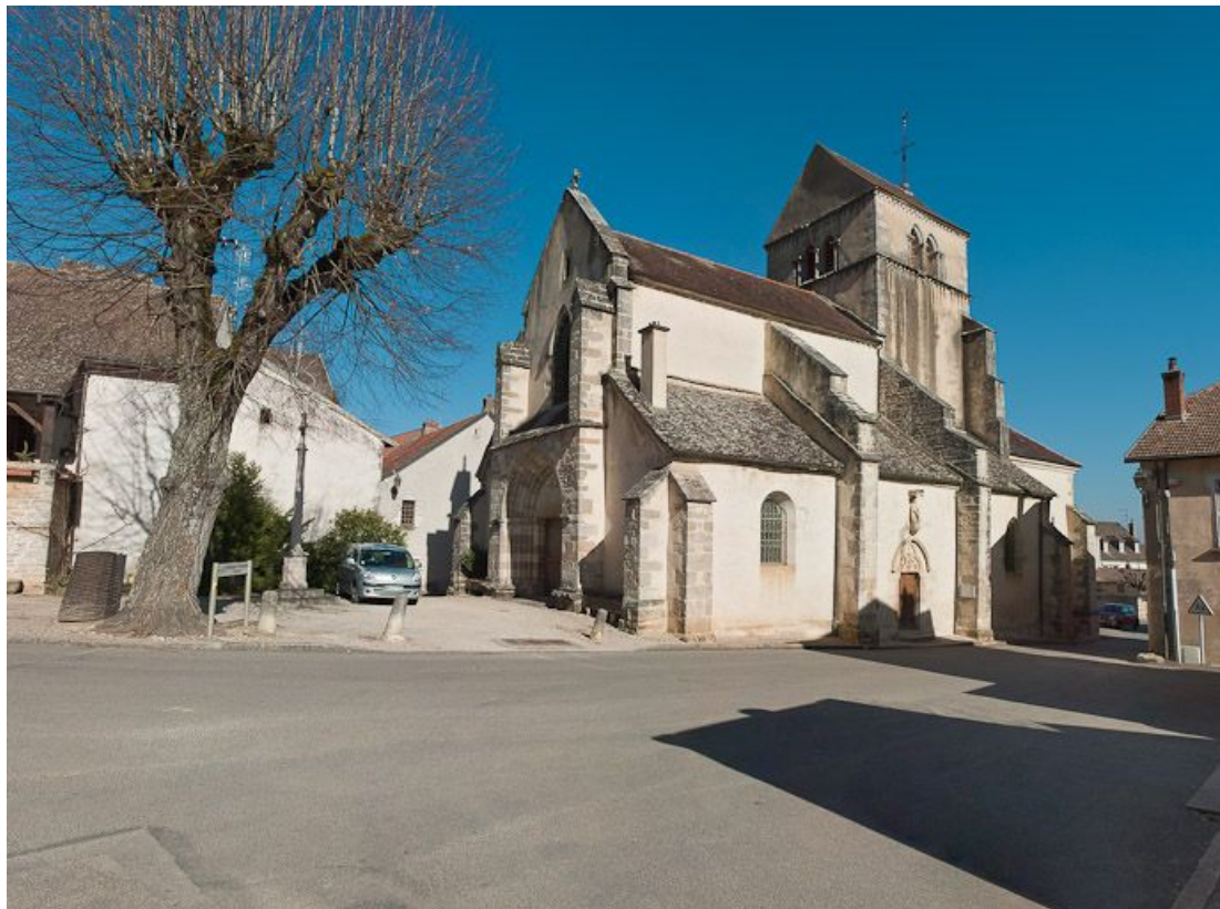
Vue d'ensemble de trois-quarts droit.