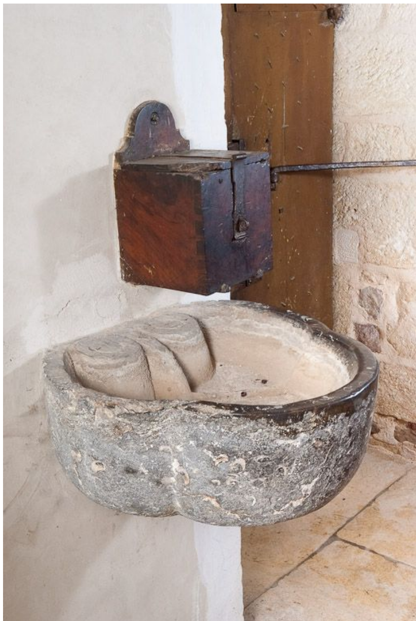
Bénitier de la porte latérale.