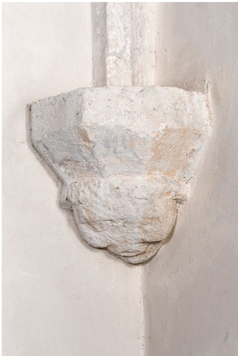
Culot antérieur gauche de la première travée du bas-côté gauche. 21, Volnay Eglise