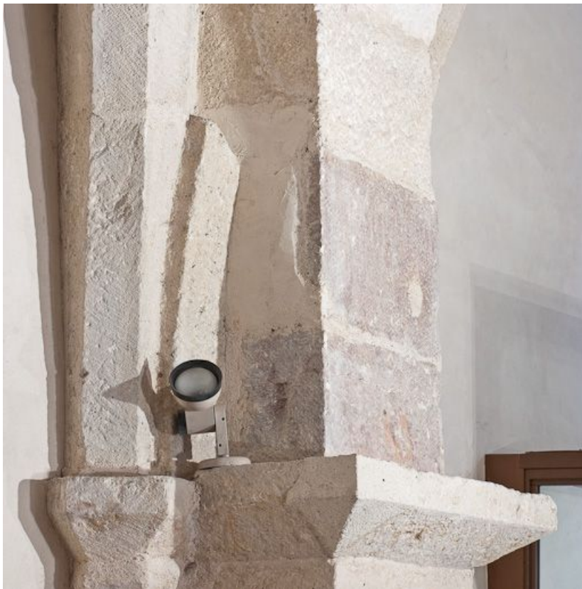
Départ des nervures de l'angle antérieur gauche de la troisième travée du bas-côté droit. 21, Volnay Eglise

N° de l'illustration : 20112100144NUC2AQ