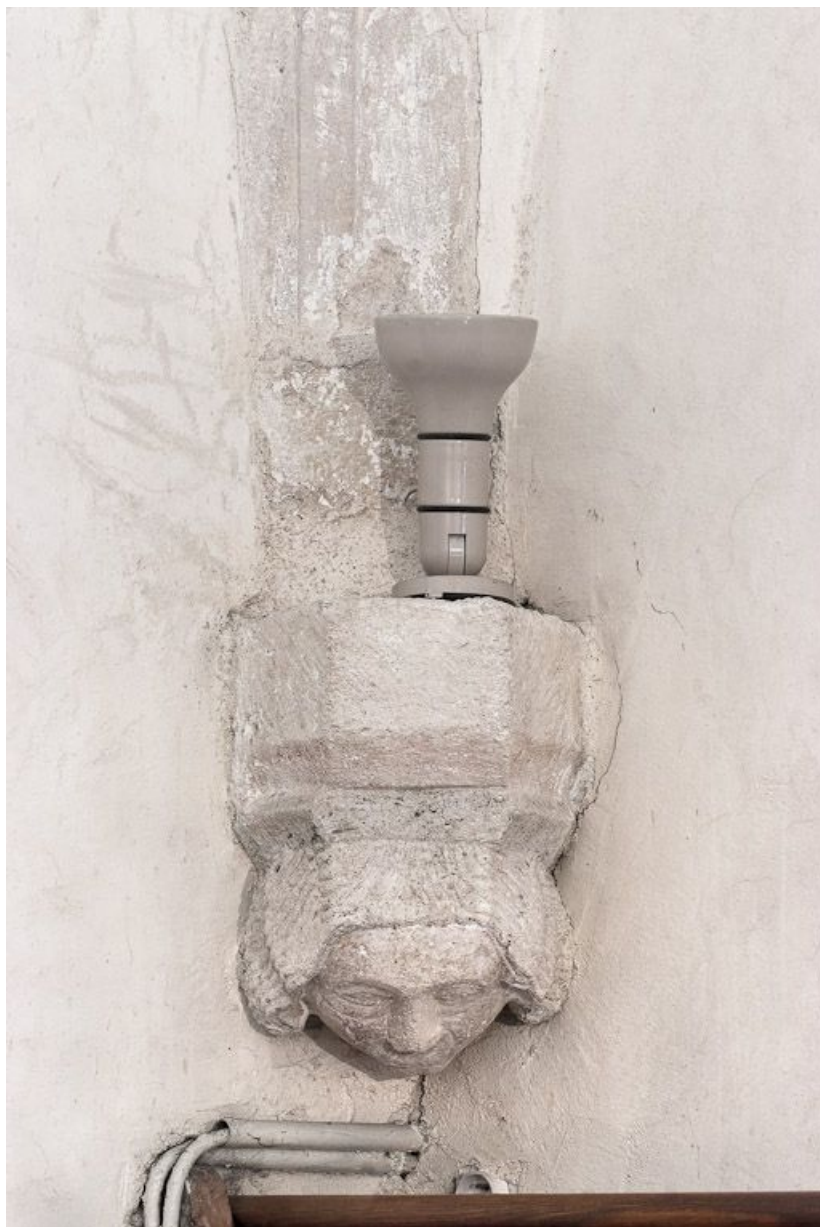
Culot antérieur gauche de la première travée de la nef. 21, Volnay Eglise