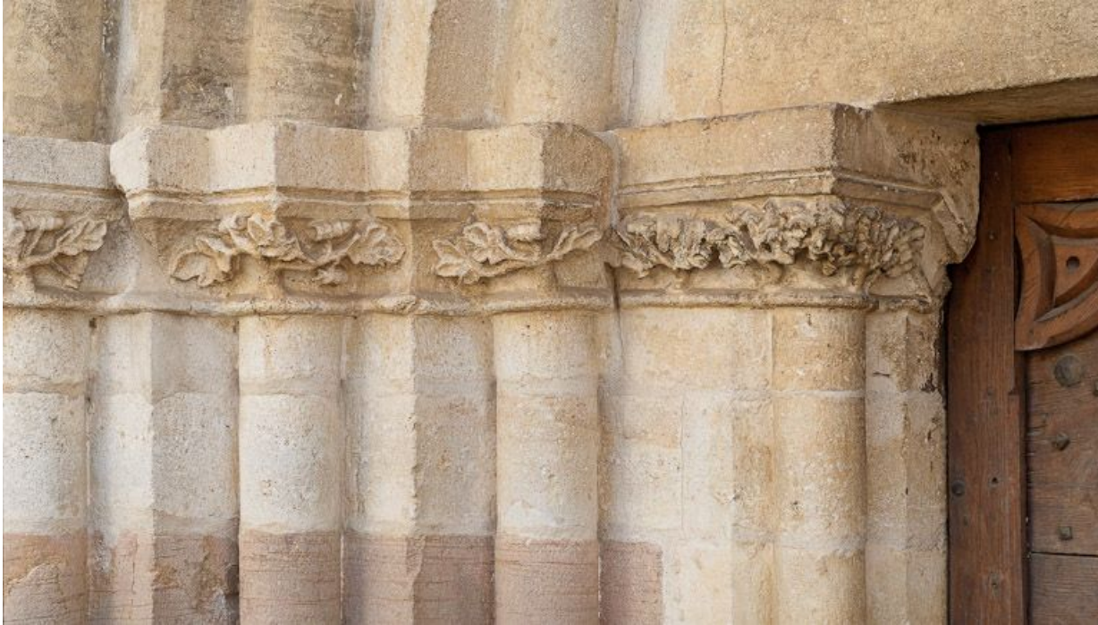
Portail : chapiteaux des colonnettes gauches de l'ébrasement.