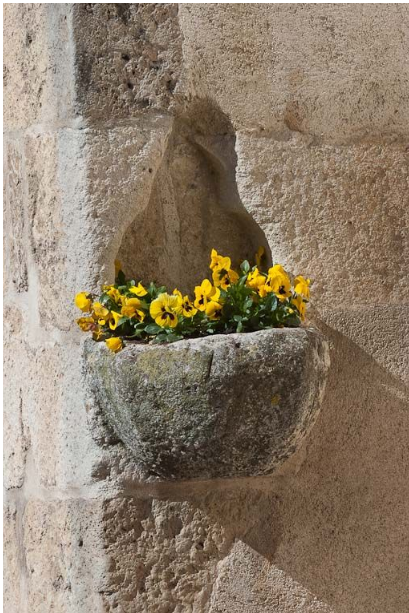
Bénitier à gauche de la porte latérale.