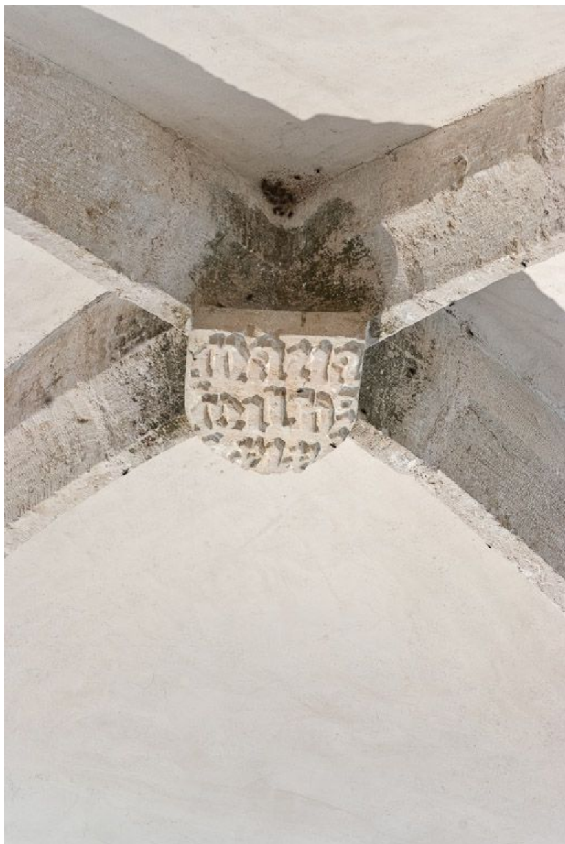
Clef de voûte de la deuxième travée de la nef. 21, Volnay Eglise