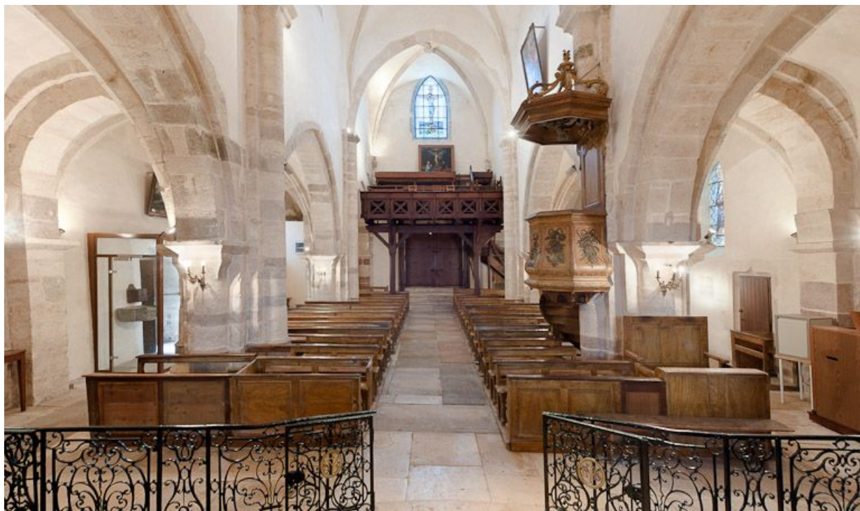
Nef et bas-côté depuis le chœur.