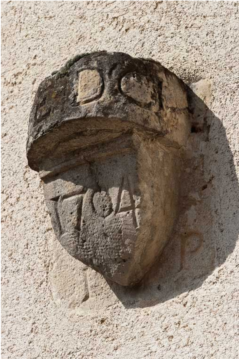
Console extérieure sur le mur de la sacristie. 21, Volnay Eglise