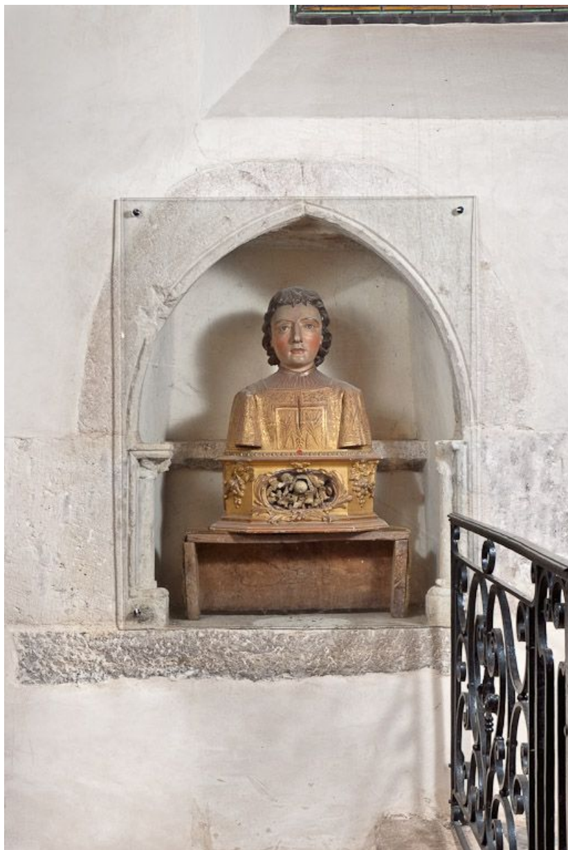
Lavabo de la chapelle du bas-côté gauche. 21, Volnay Eglise