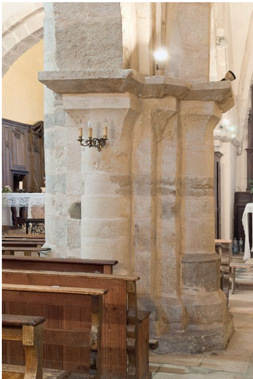
Deuxième pilier entre la nef et le bas-côté droit, vue antérieure. 21, Volnay Eglise