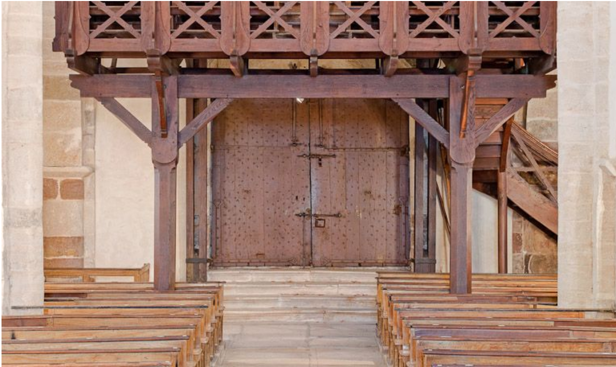
Porte principale depuis la nef. 21, Volnay Eglise

N° de l'illustration : 20112100119NUC4AQ