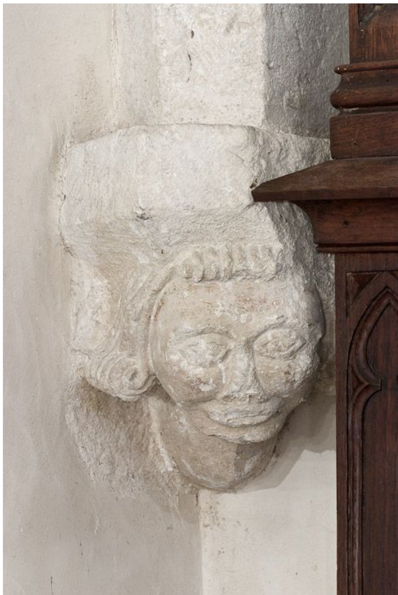
Culot postérieur gauche de la troisième travée du bas-côté gauche. 21, Volnay Eglise