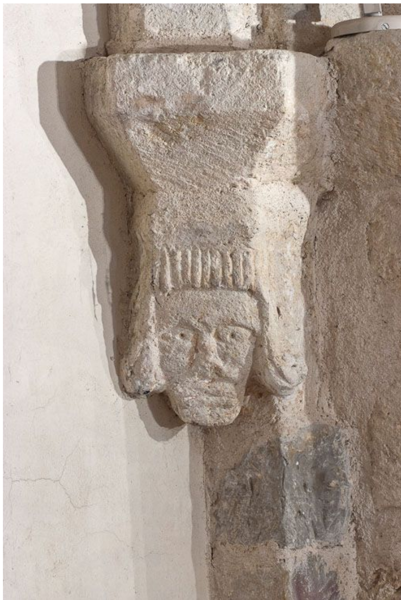
Culot antérieur droit de la troisième travée du bas-côté droit. 21, Volnay Eglise