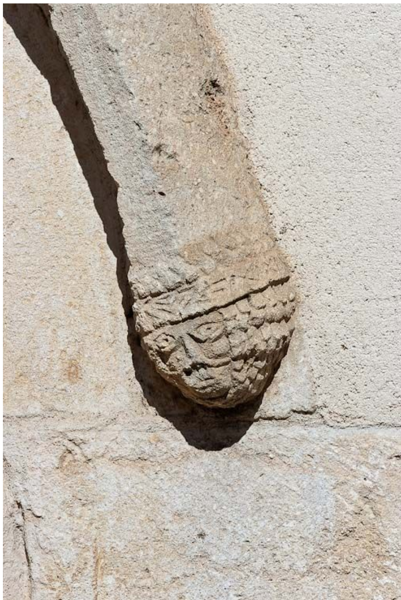
Porte latérale : culot droit de l'archivolte.