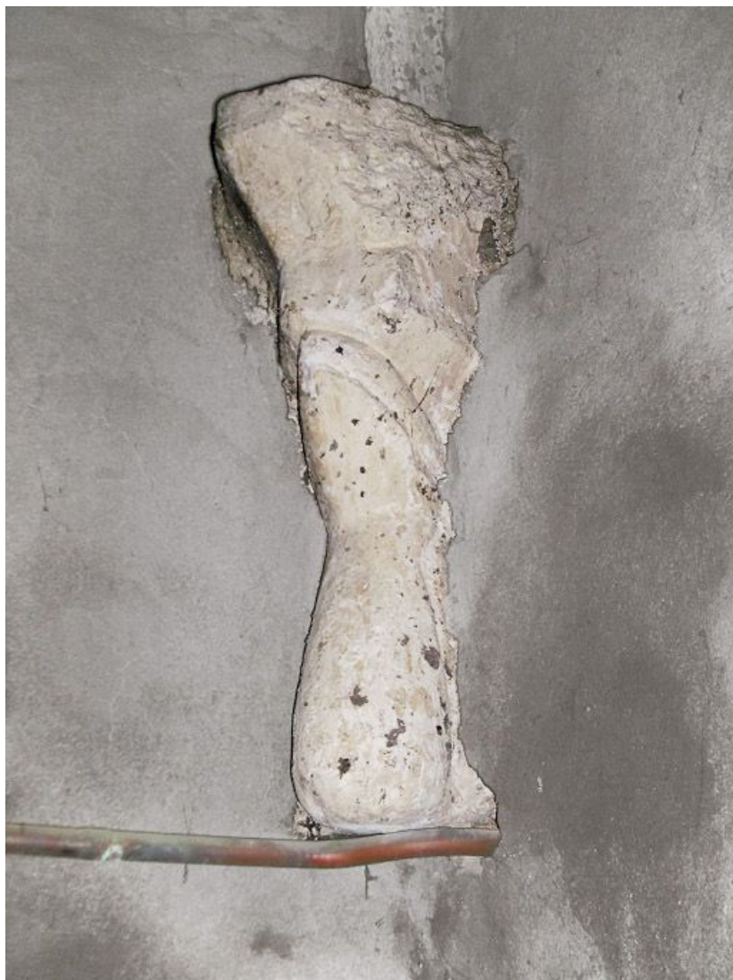
Culot antérieur droit de la première travée du bas-côté droit.