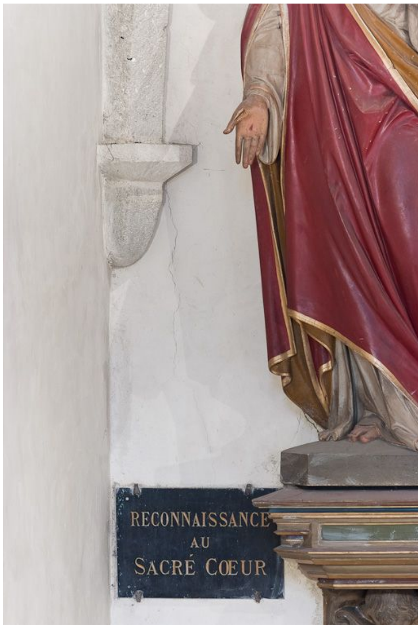
Culot postérieur gauche de la troisième travée de la nef. 21, Volnay Eglise