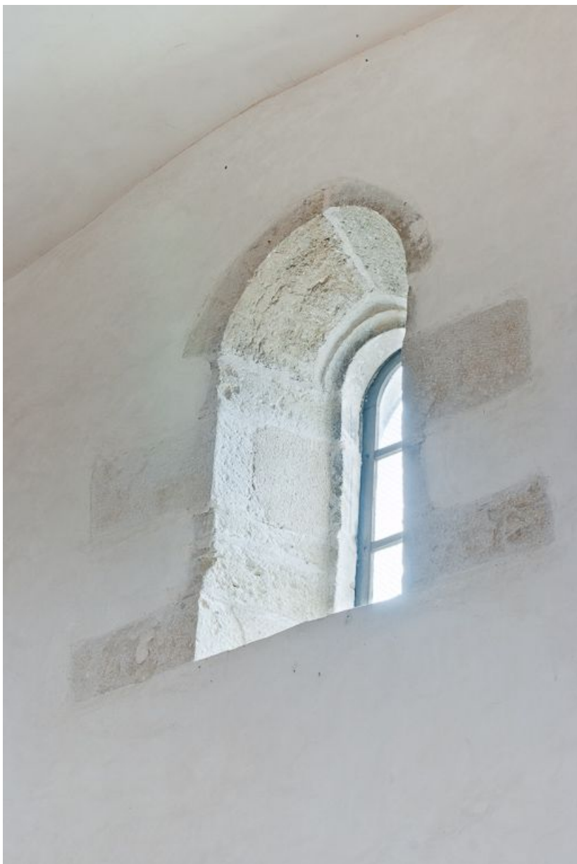
Fenêtre haute droite de la deuxième travée de la nef.