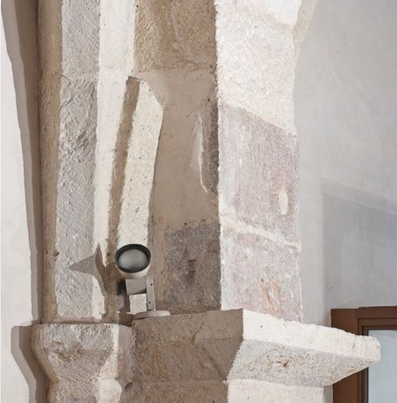
Départ des nervures de l'angle antérieur gauche de la troisième travée du bas-côté droit. 21, Volnay Eglise

N° de l'illustration : 20112100144NUC2AQ