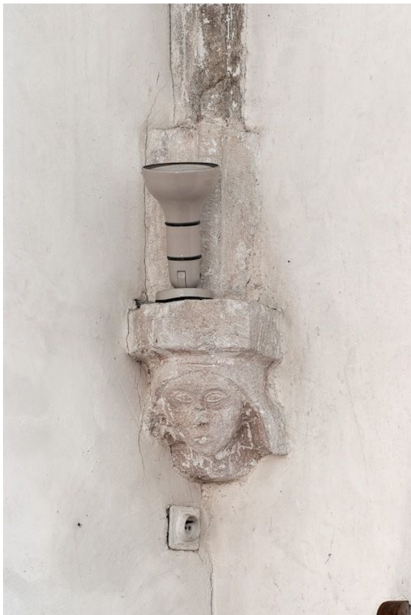
Culot antérieur droit de la première travée de la nef.