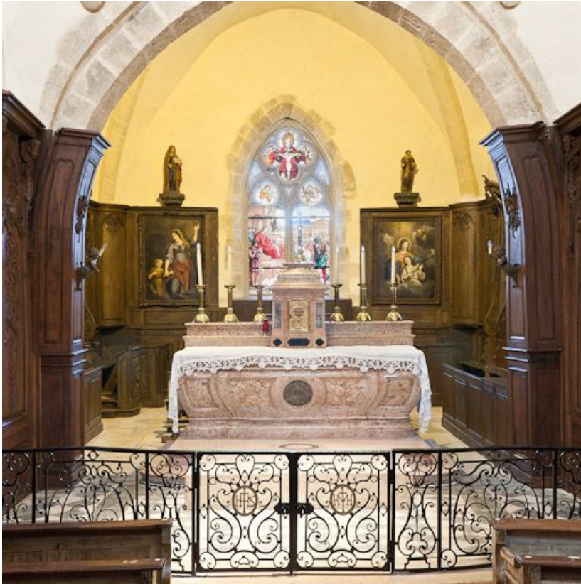
Choeur et maître-autel.