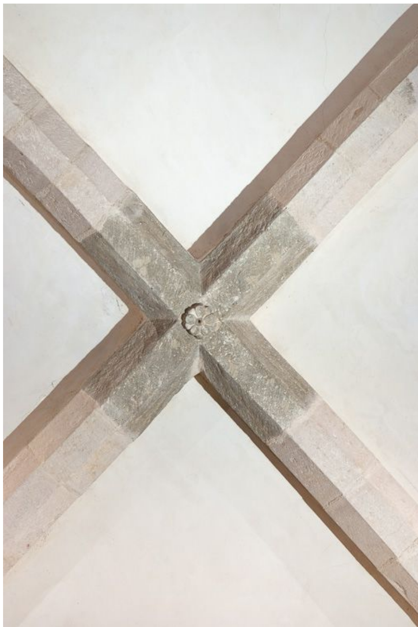
Clef de voûte du chœur.