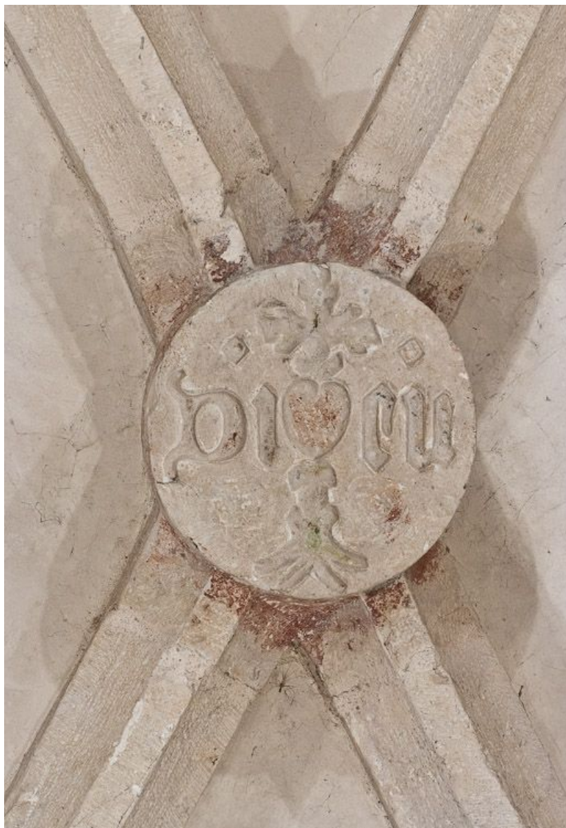
Clef de voûte de la deuxième travée du bas-côté droit.