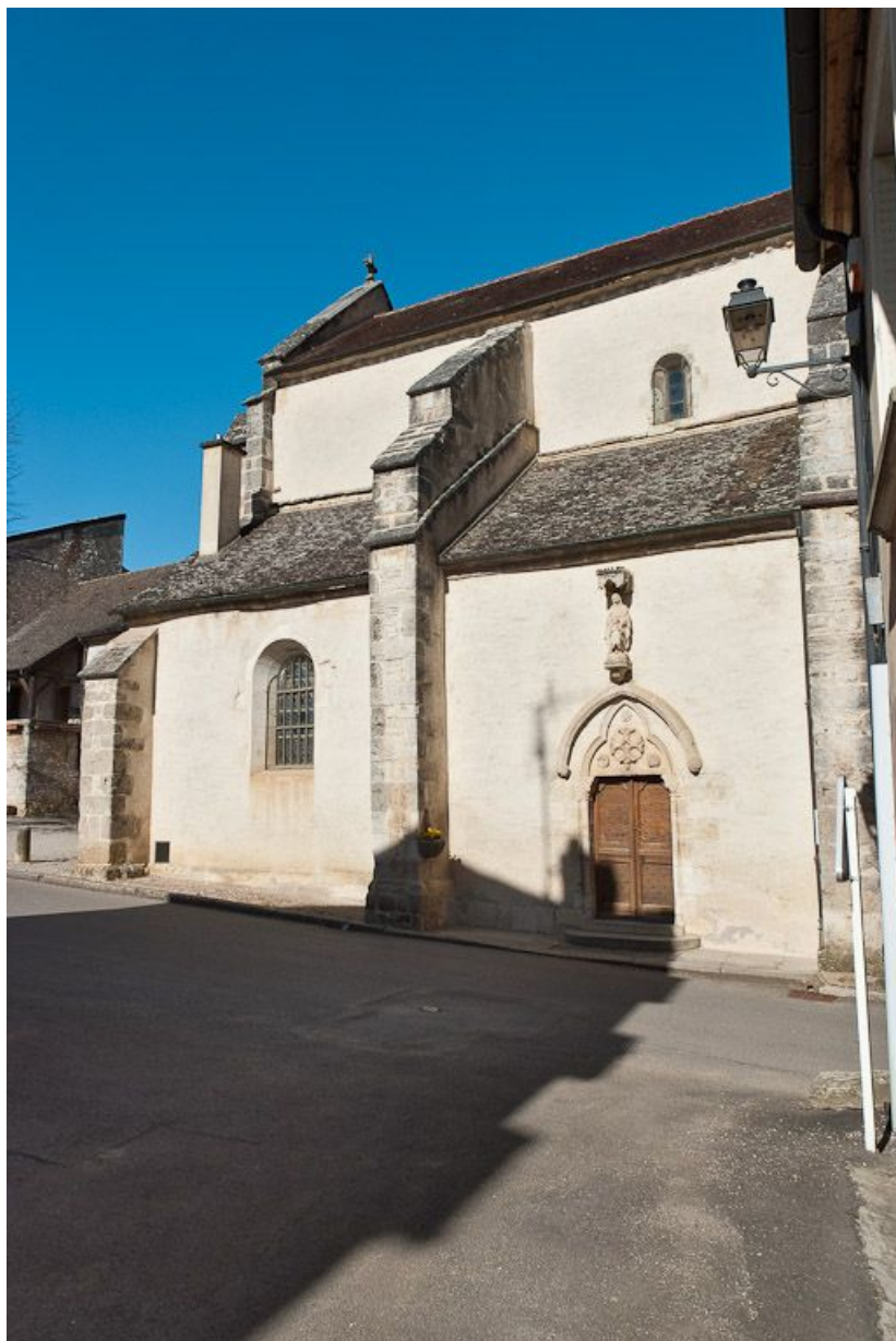
Elévation droite de la nef.