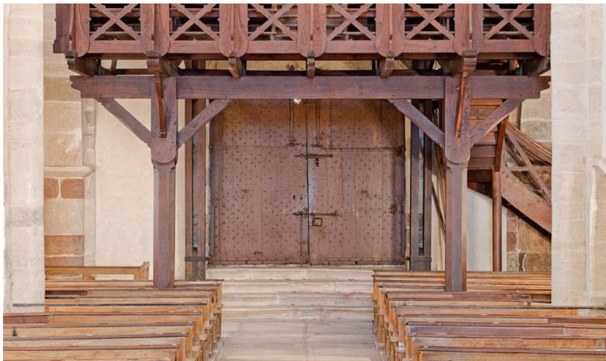
Porte principale depuis la nef. 21, Volnay Eglise

N° de l'illustration : 20112100119NUC4AQ