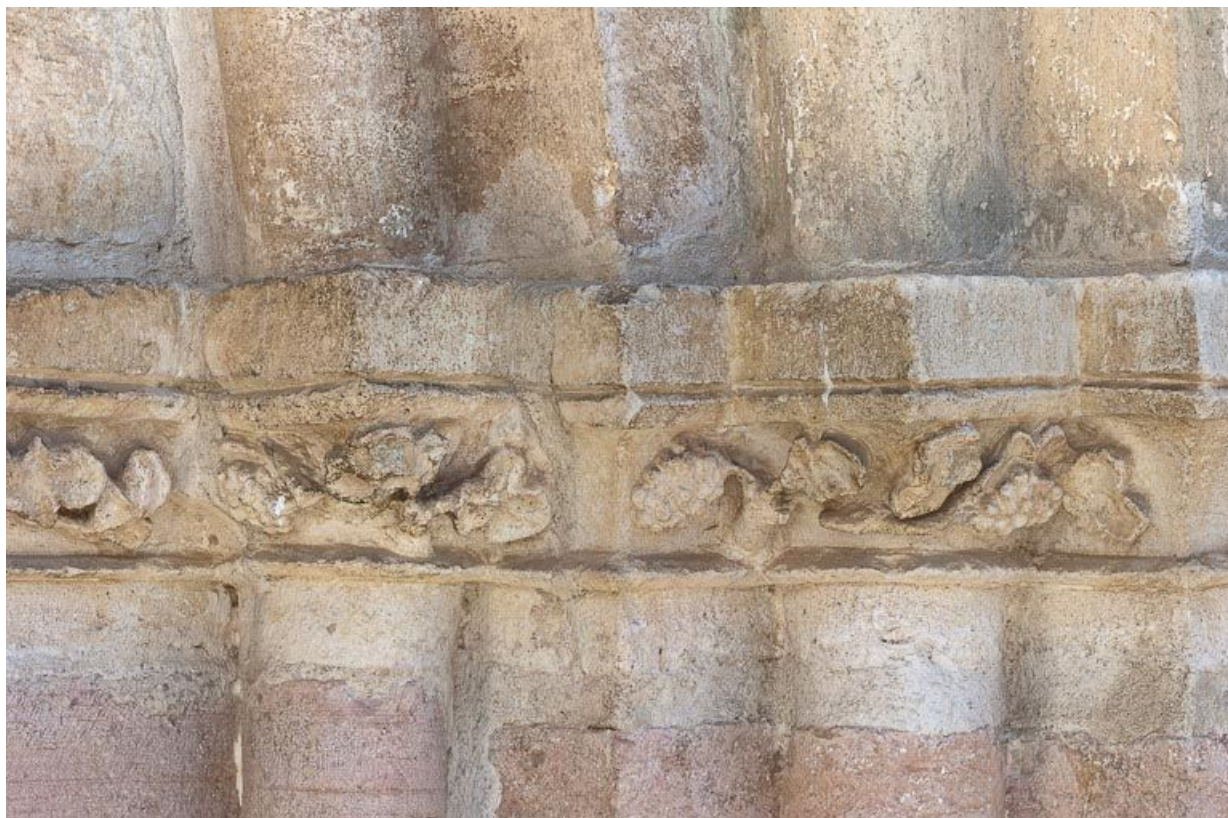
Portail : chapiteaux des colonnettes droites de l'ébrasement.