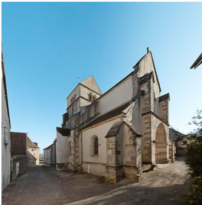
Vue d'ensemble de trois-quarts gauche.