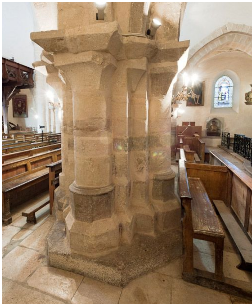
Deuxième pilier entre la nef et le bas-côté droit, vue postérieure. 21, Volnay Eglise

N° de l'illustration : 20112100121NUC4AQ