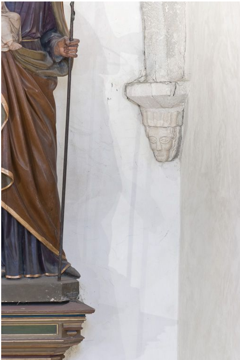
Culot postérieur droit de la troisième travée de la nef.