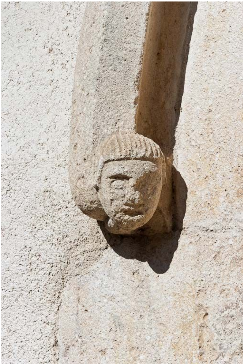
Porte latérale : culot gauche de l'archivolte.