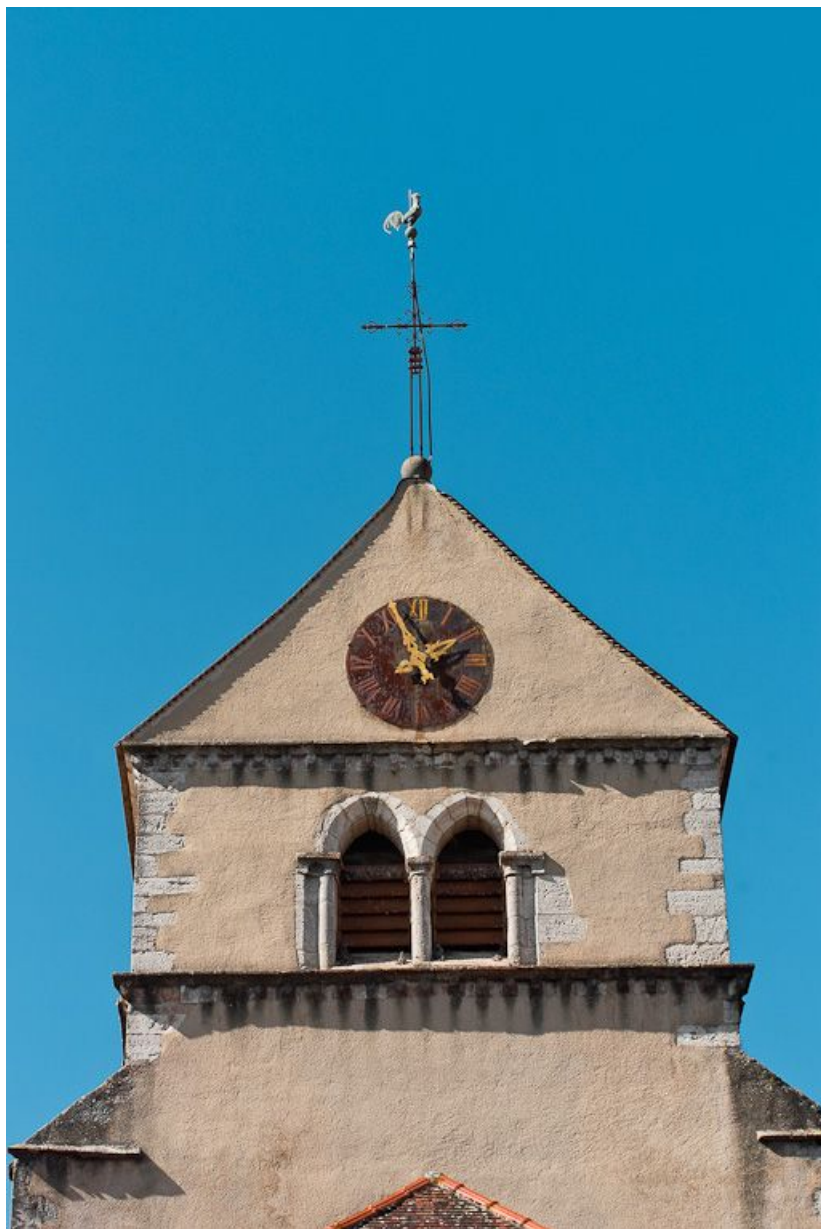
Clocher, élévation postérieure.