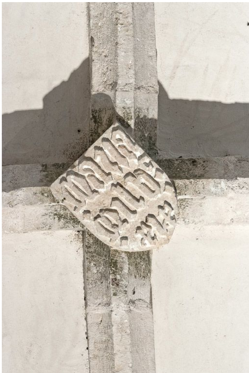
Clef de voûte de la deuxième travée de la nef. 21, Volnay Eglise