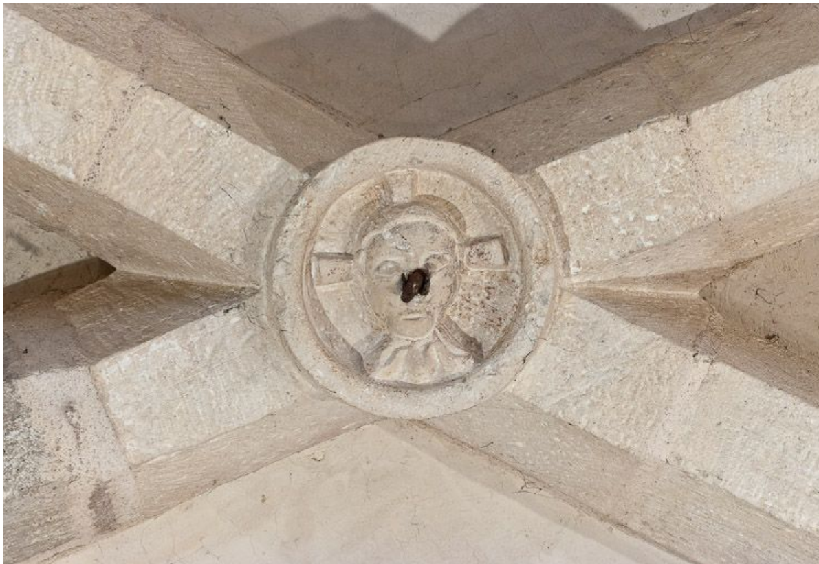
Clef de voûte de la troisième travée du bas-côté gauche. 21, Volnay Eglise