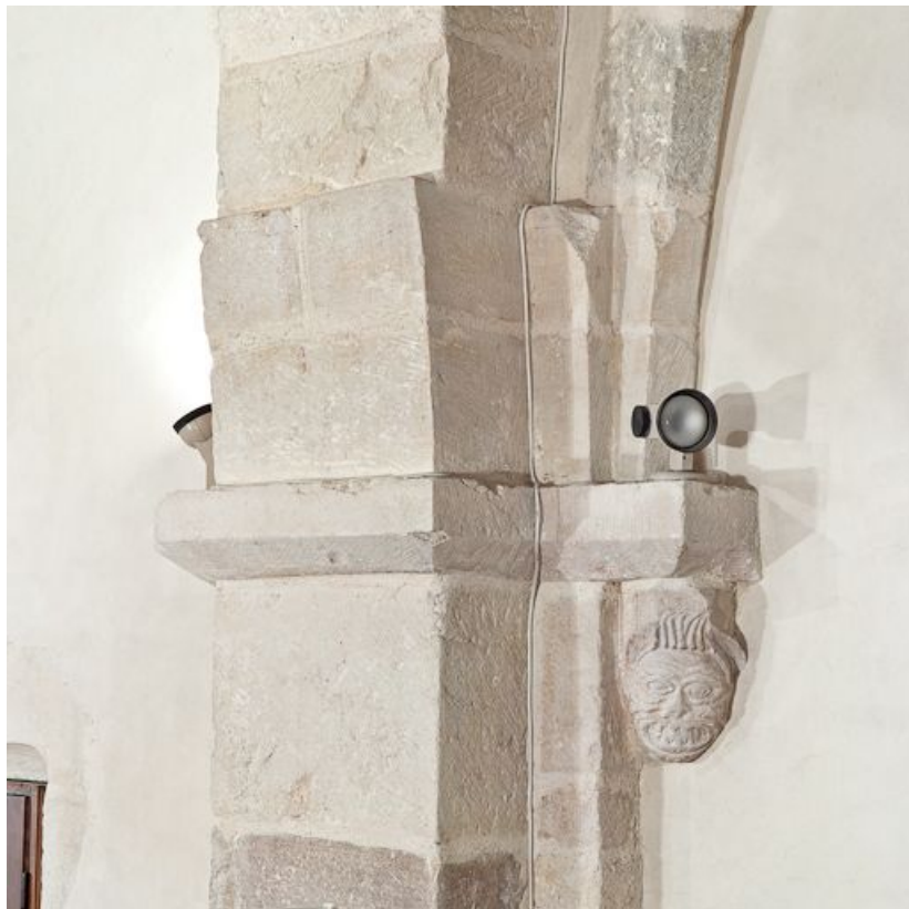
Support et culot antérieur gauche de la troisième travée du bas-côté gauche. 21, Volnay Eglise

N° de l'illustration : 20112100133NUC2AQ