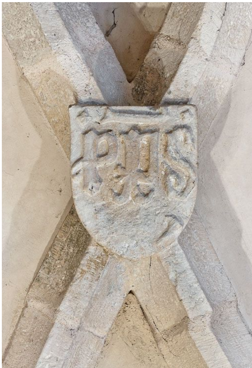
Clef de voûte de la première travée du bas-côté droit.