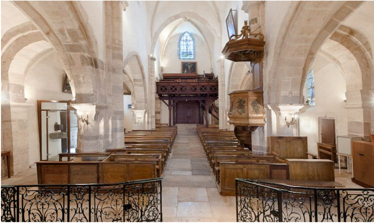
Nef et bas-côté depuis le chœur.