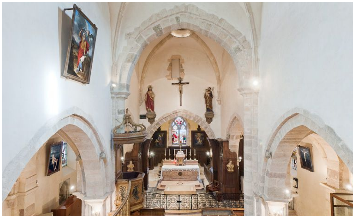
Choeur et bas-côté depuis la tribune.