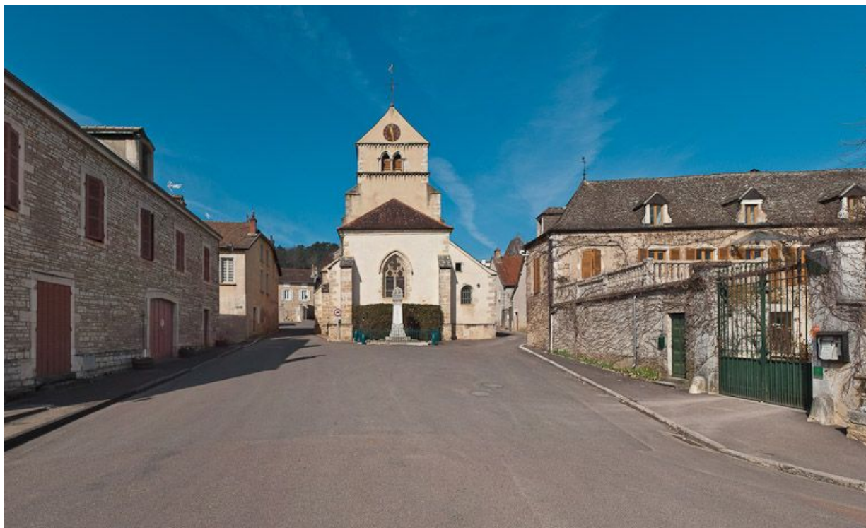
Portail : chapiteaux des colonnettes droites de l'ébrasement.