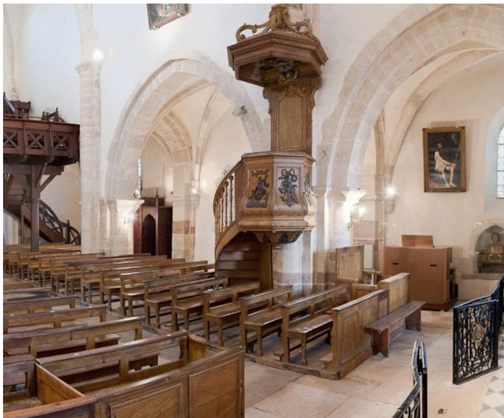
Nef et bas-côté gauche depuis le chœur.