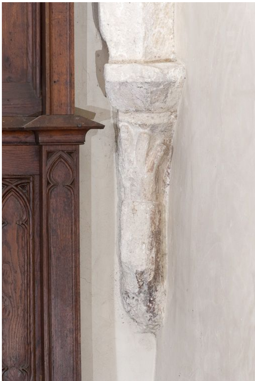
Culot postérieur droit de la troisième travée du bas-côté droit. 21, Volnay Eglise