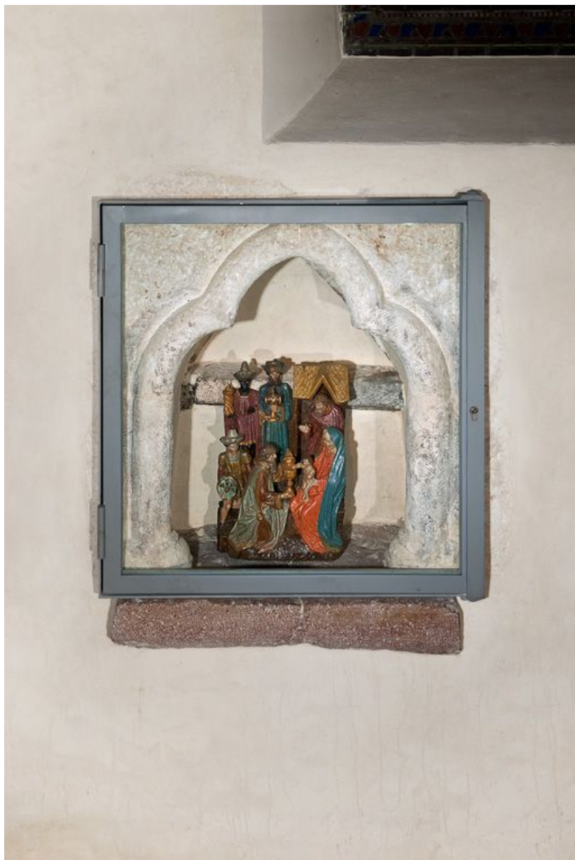
Lavabo de la chapelle du bas-côté droit.