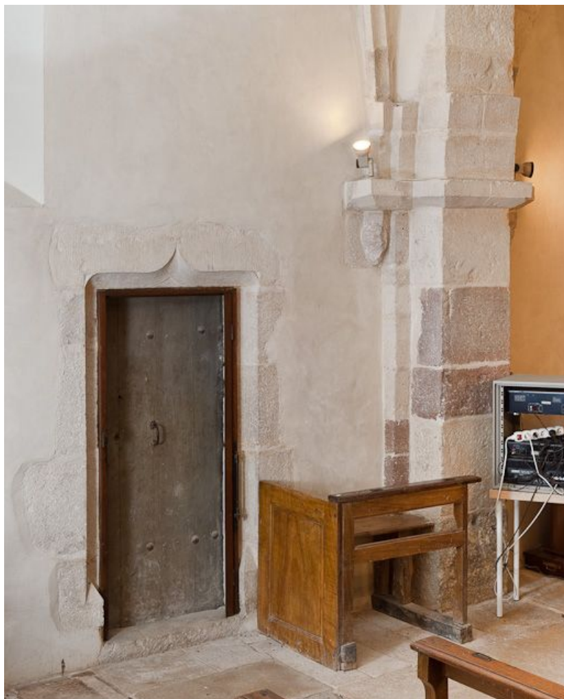
Porte de la tourelle d'escalier.