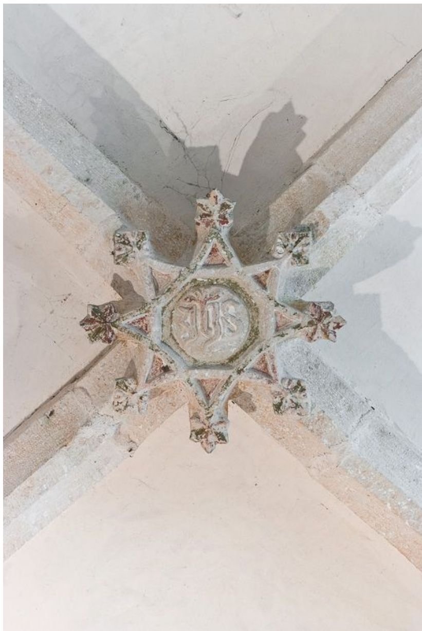
Clef de voûte de la première travée de la nef. 21, Volnay Eglise