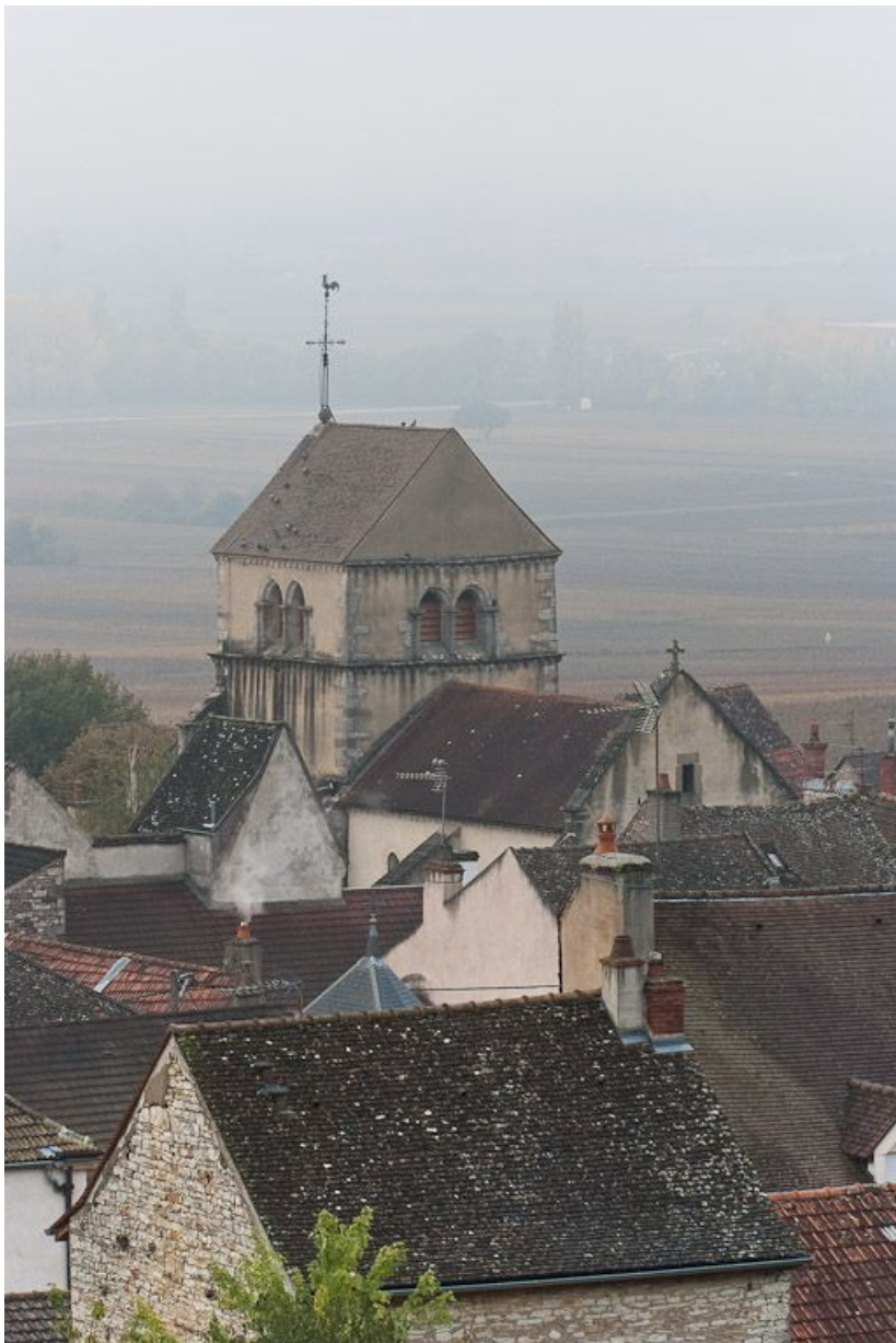
Nef et bas-côté droit.