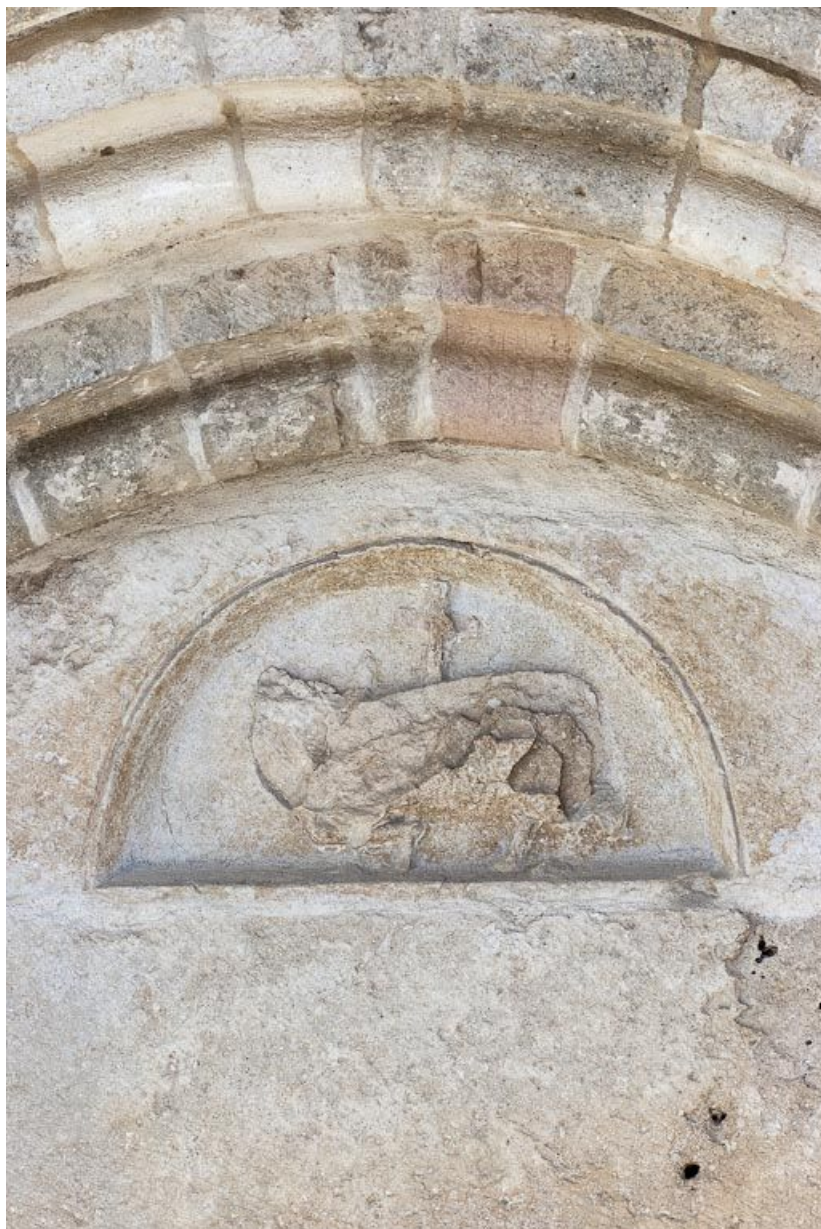
Tympan du portail : Agneau mystique.