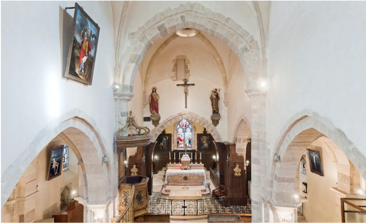
Choeur et bas-côté depuis la tribune.