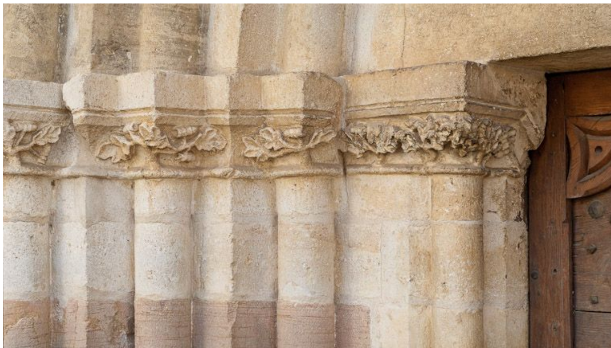
Portail : chapiteaux des colonnettes gauches de l'ébrasement.