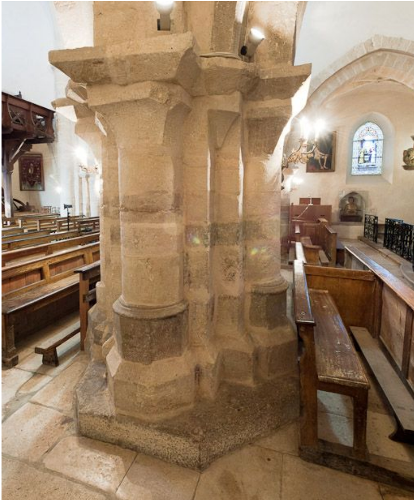
Deuxième pilier entre la nef et le bas-côté droit, vue postérieure. 21, Volnay Eglise

N° de l'illustration : 20112100121NUC4AQ