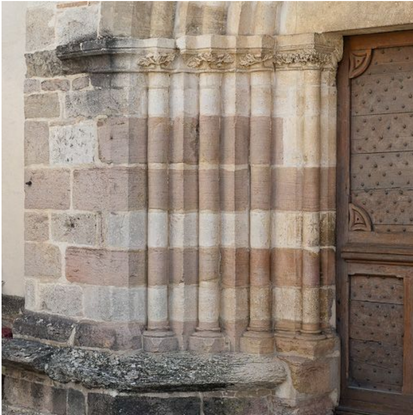
Portail : colonnettes gauches de l'ébrasement.