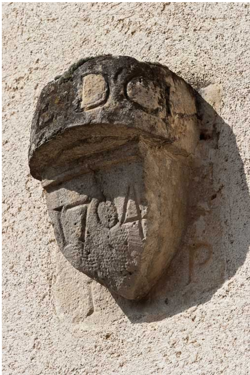
Console extérieure sur le mur de la sacristie. 21, Volnay Eglise