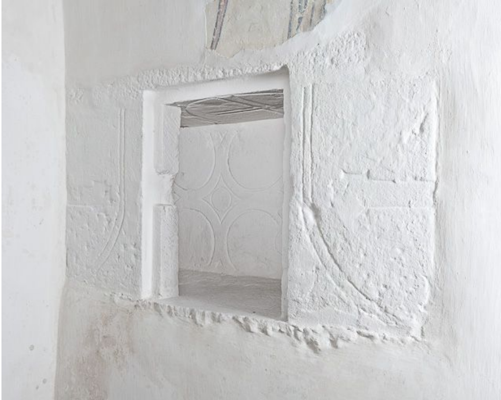
Niche de la dernière travée du bas-côté droit.