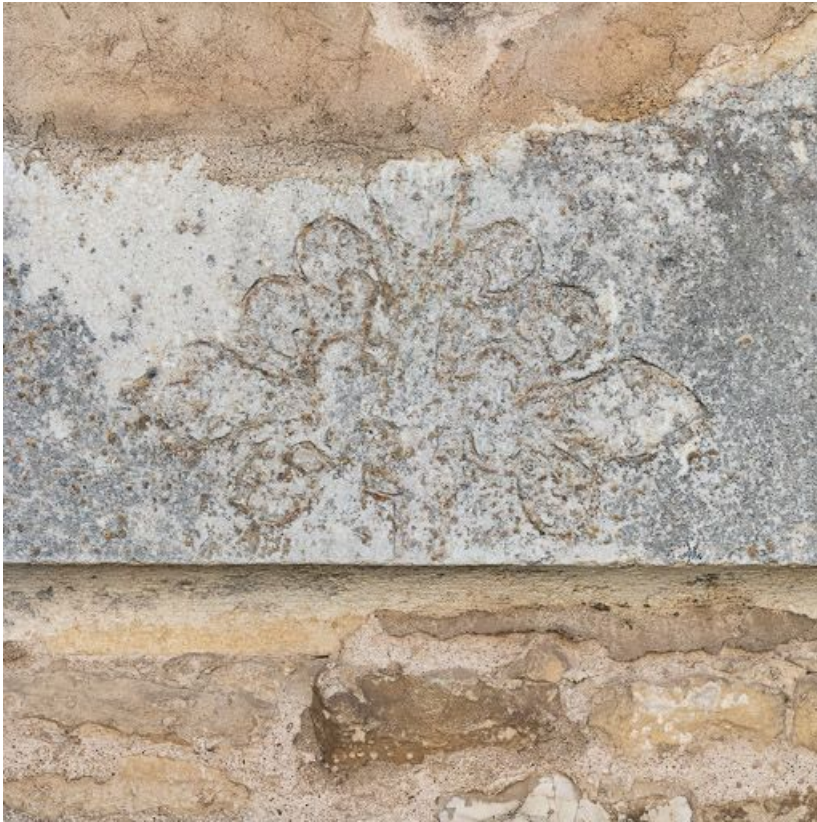
Linteau de la porte latérale gauche murée.