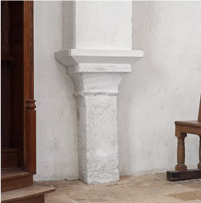
Bas-côté droit, pilier de l'arc antérieur de la dernière travée.