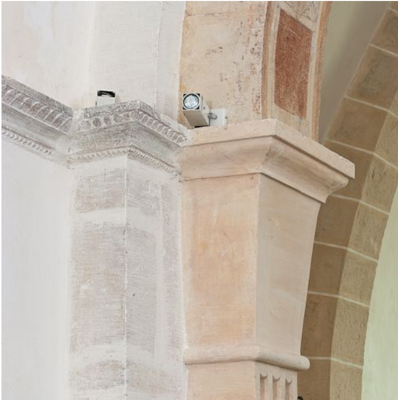
Détail de l'angle antérieur droit du choeur.