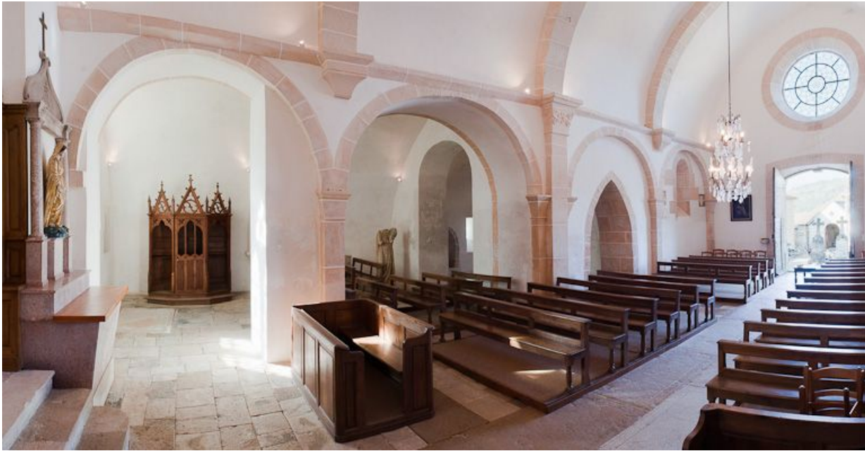
Nef et bas-côté droit.