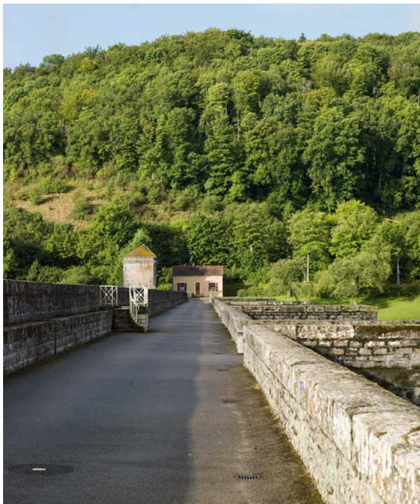
Vue générale de la maison dans l'alignement de la digue.

21, Grosbois-en-Montagne, lieudit : Grosbois