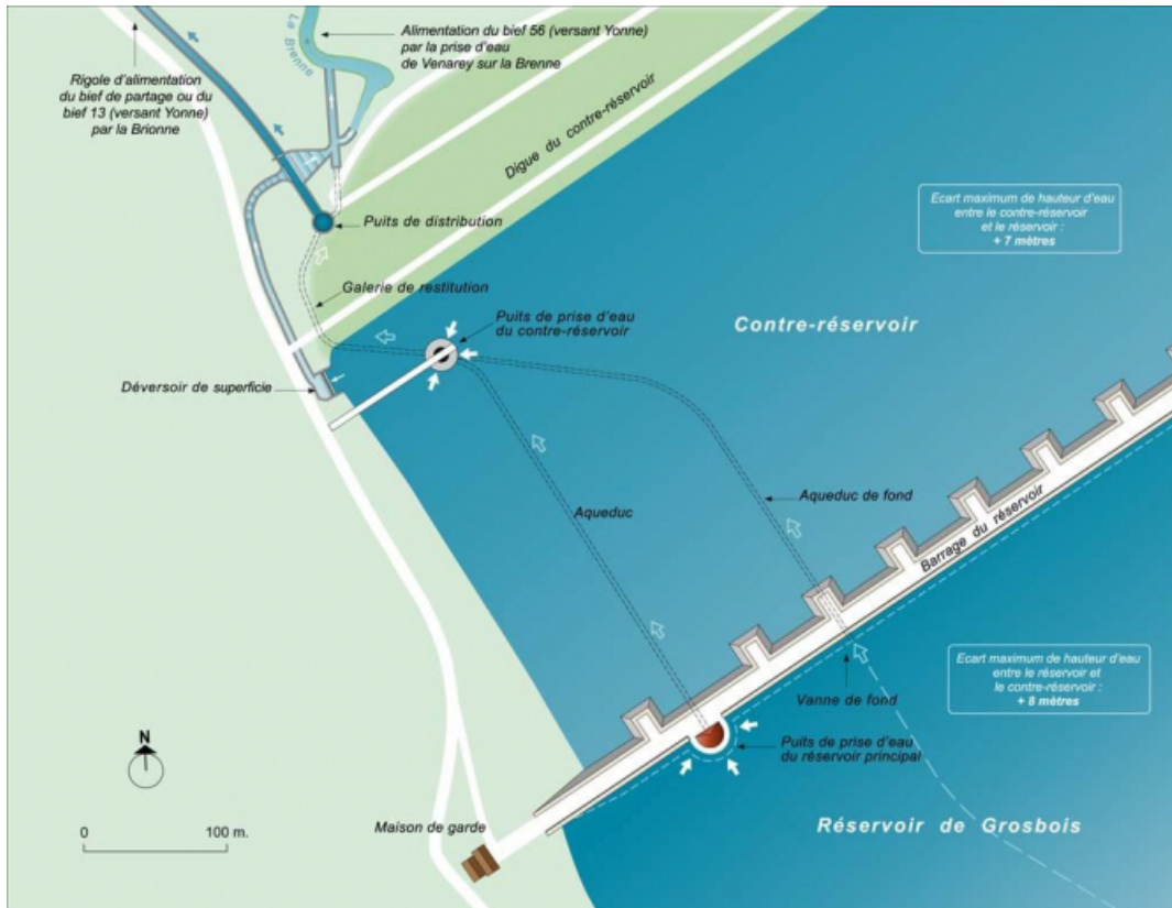
Plan schématique du réservoir de Grosbois, détail du barrage et du contre-réservoir.

21, Grosbois-en-Montagne, lieudit : Grosbois