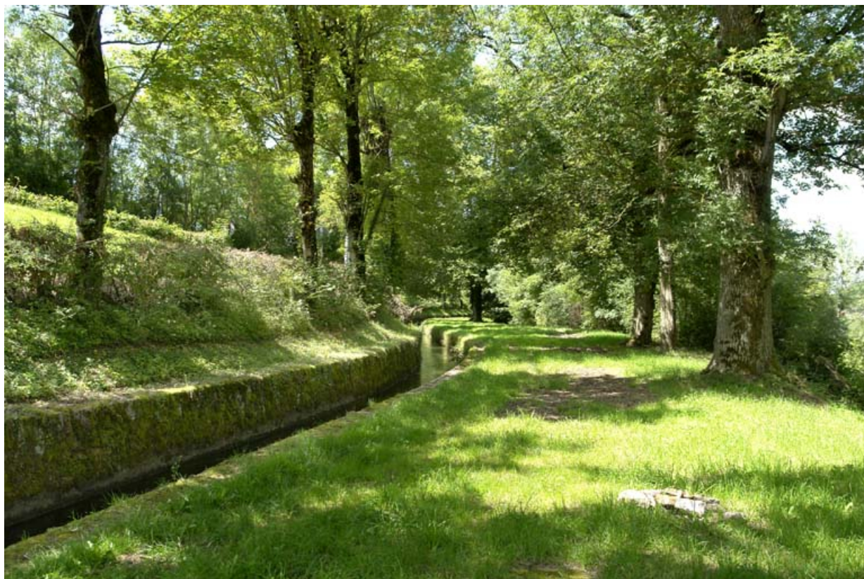
Rigole d'alimentation du canal en sortie du contre-réservoir.

21, Grosbois-en-Montagne, lieudit : Grosbois