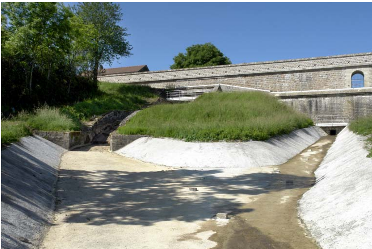
Rigole de décharge du déservoir de superficie qui rejoint celle de la tour de prise d'eau et de la vanne de fond. 21, Rouvres-sous-Meilly, lieudit : le Tillot