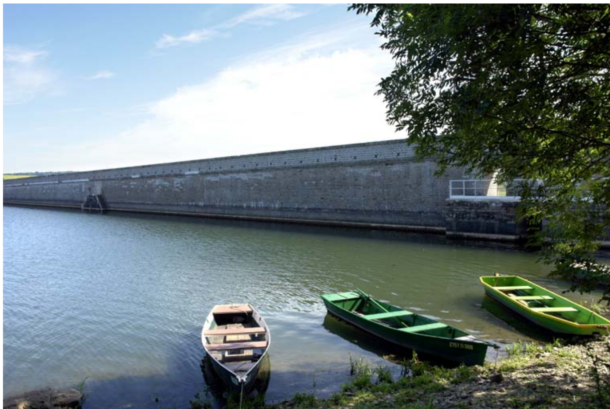
Vue d'ensemble du barrage, face réservoir.

21, Rouvres-sous-Meilly, lieudit : le Tillot