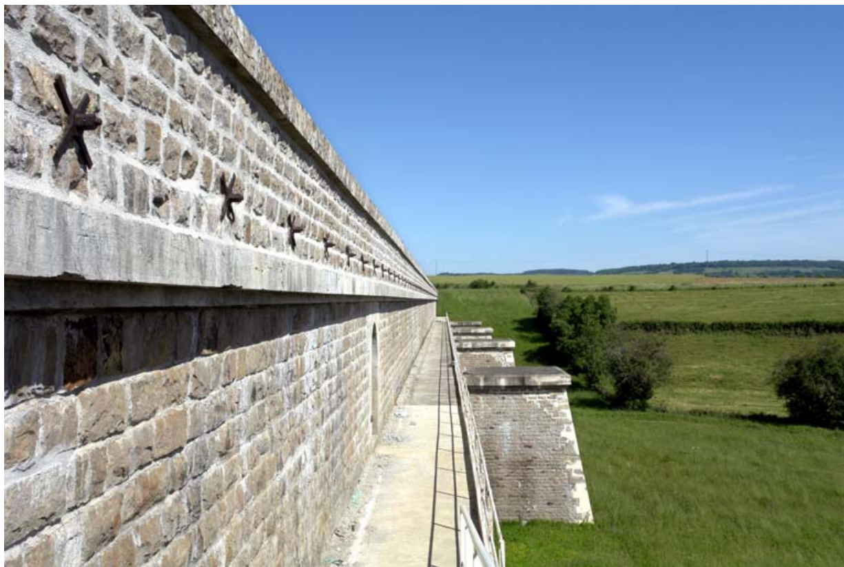
Le barrage et ses contreforts vu de l'extrémité est.

21, Rouvres-sous-Meilly, lieudit : le Tillot