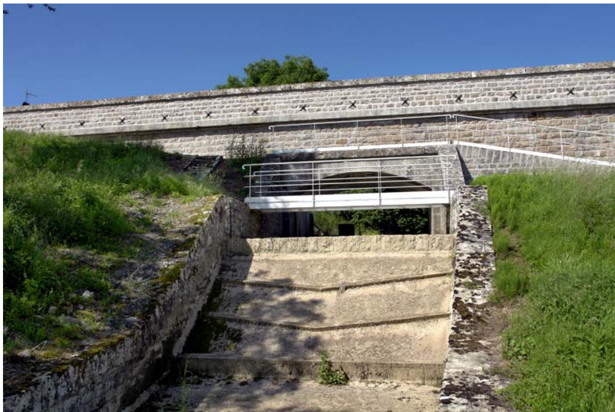
Déversoir de superficie du réservoir, prolongé par une chute d'eau en trois paliers et surmonté d'une passerelle. 21, Rouvres-sous-Meilly, lieudit : le Tillot