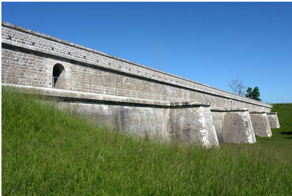
Face avant du barrage, vue d'ensemble.

21, Rouvres-sous-Meilly, lieudit : le Tillot