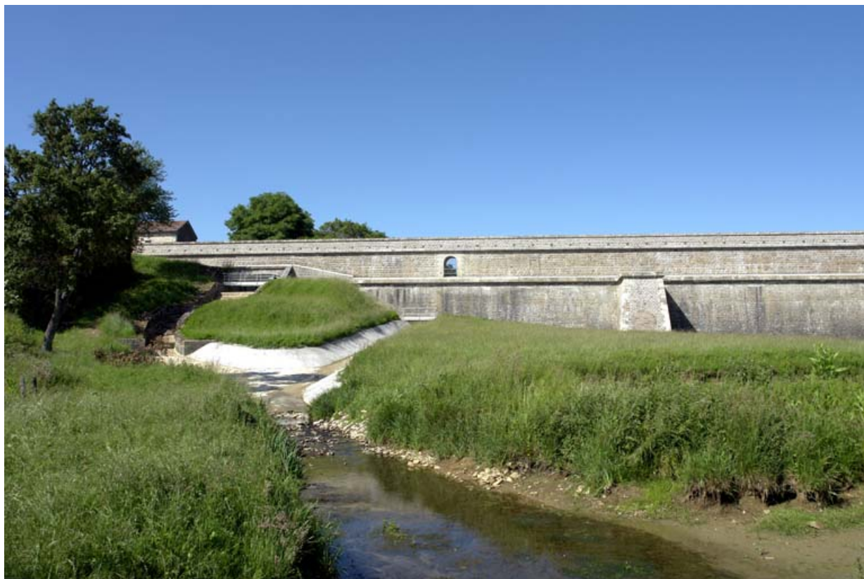
Face avant du barrage, vue d'ensemble avec au premier plan la rigole de décharge.

21, Rouvres-sous-Meilly, lieudit : le Tillot