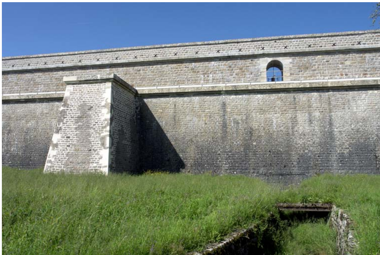
Face avant du barrage, au premier plan la rigole de la vanne de vidange.

21, Rouvres-sous-Meilly, lieudit : le Tillot