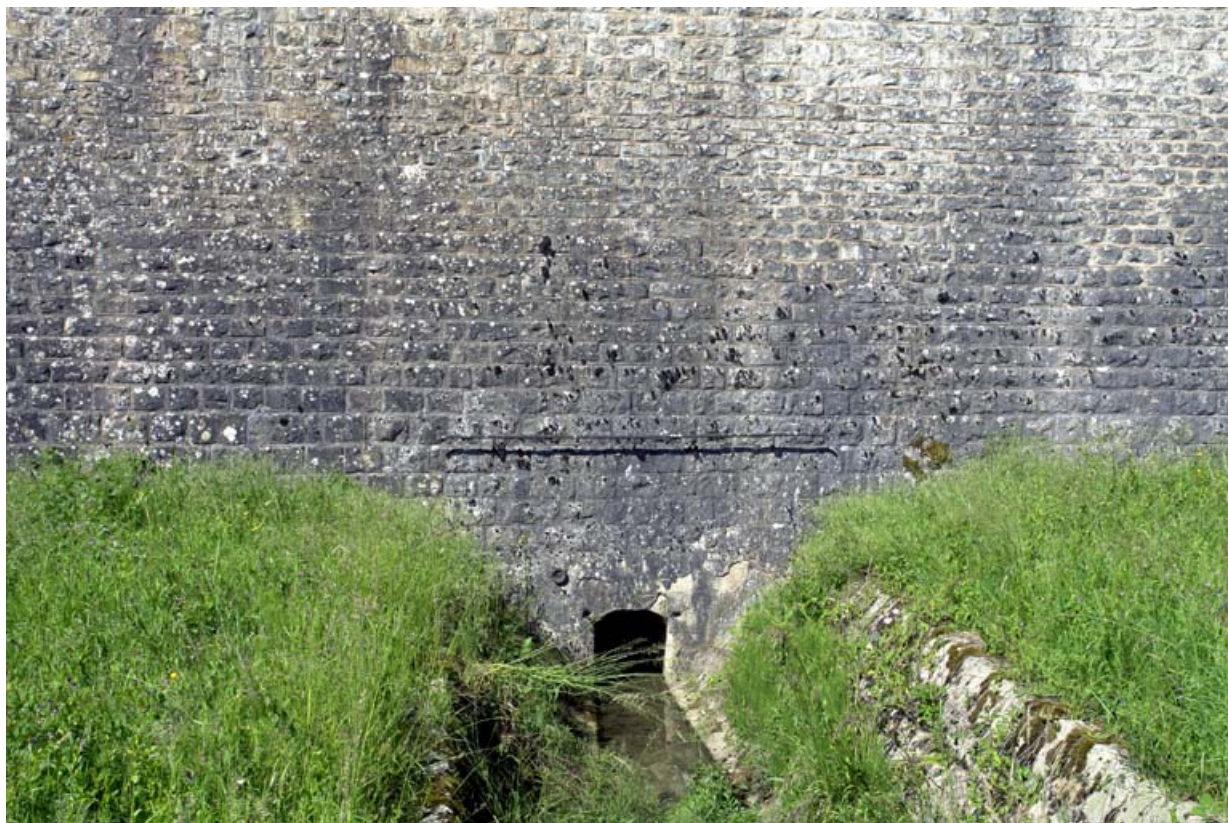
Face avant du barrage, sortie de la vanne de fond.

21, Rouvres-sous-Meilly, lieudit : le Tillot