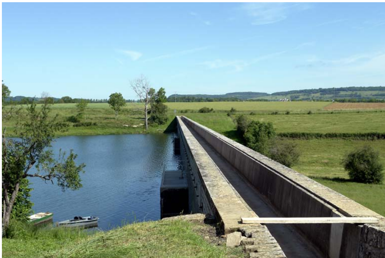
La rigole de Chazilly sur le barrage du réservoir du Tillot.

21, Rouvres-sous-Meilly, lieudit : le Tillot