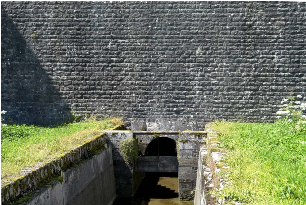
Sortie d'eau au pied du barrage pour la rigole d'alimentation du canal.