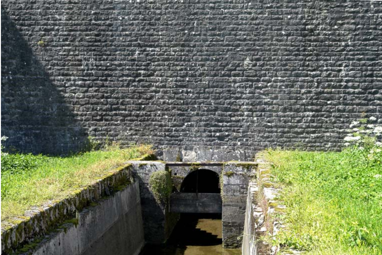
Sortie d'eau au pied du barrage pour la rigole d'alimentation du canal.