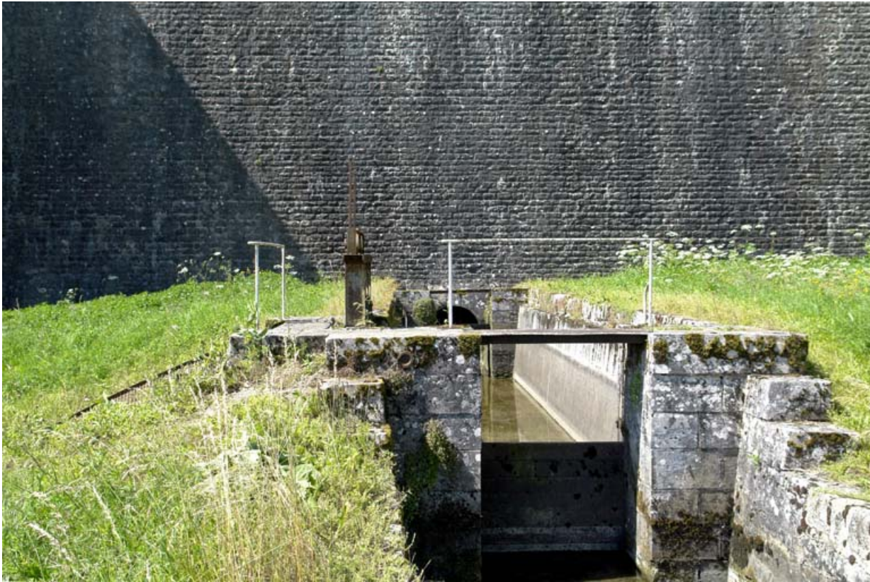
Sortie d'eau au pied du barrage et départ de la rigole d'alimentation du canal.