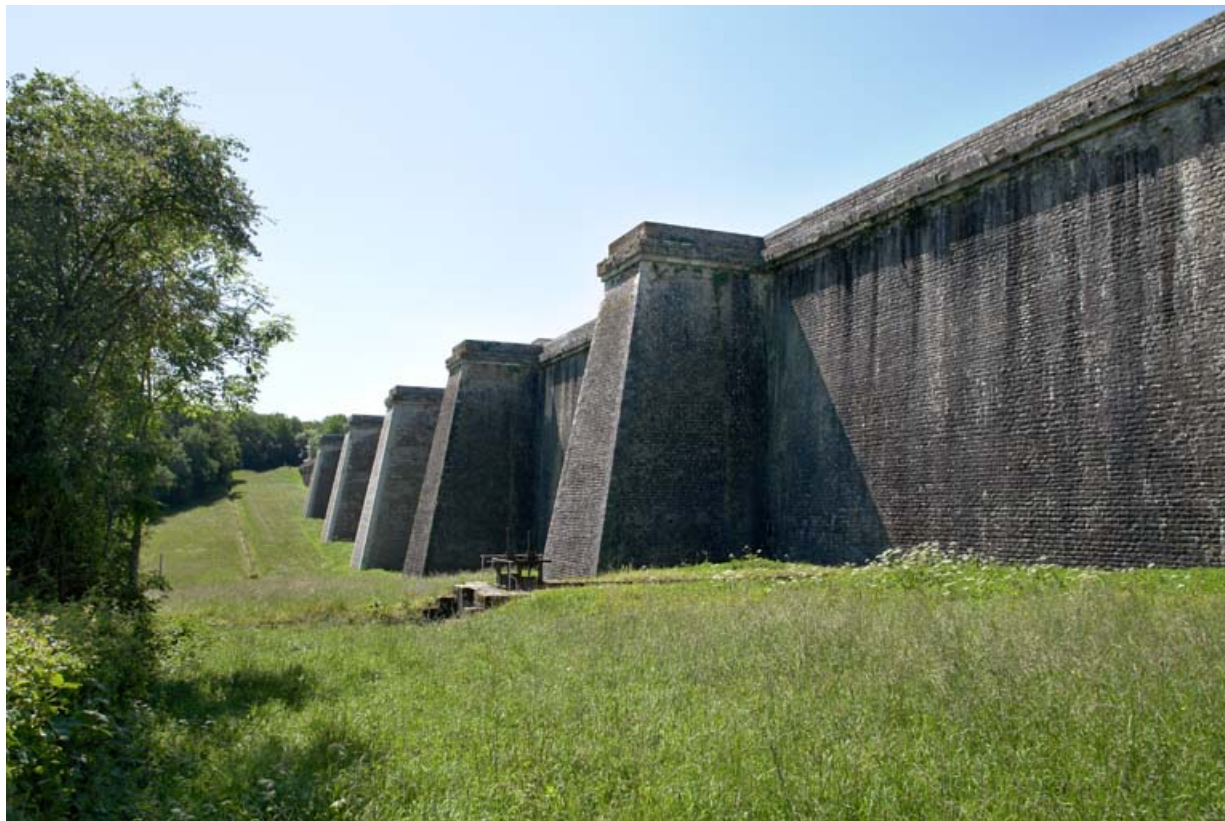
Face avant du barrage, vue de l'extrémité nord. La rigole d'alimentation au premier plan.