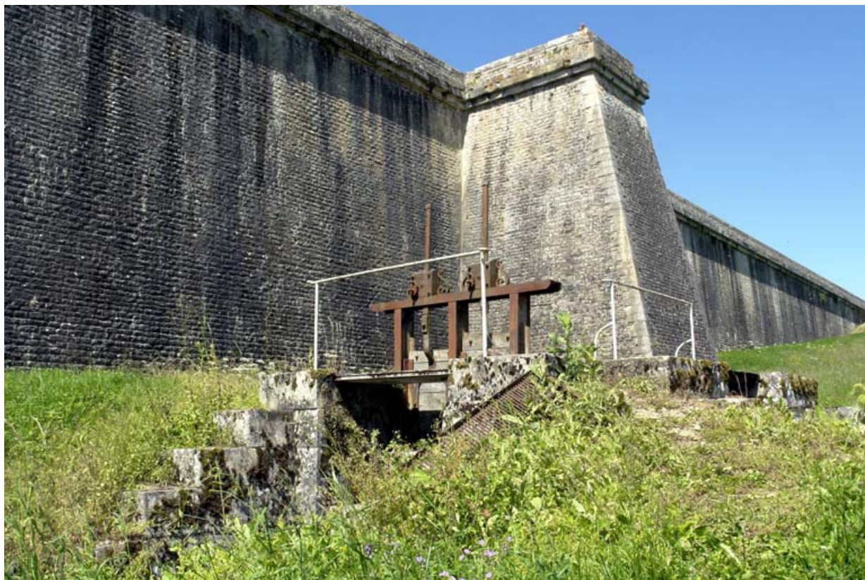
Ouvrage hydraulique au départ de la rigole d'alimentation du canal.