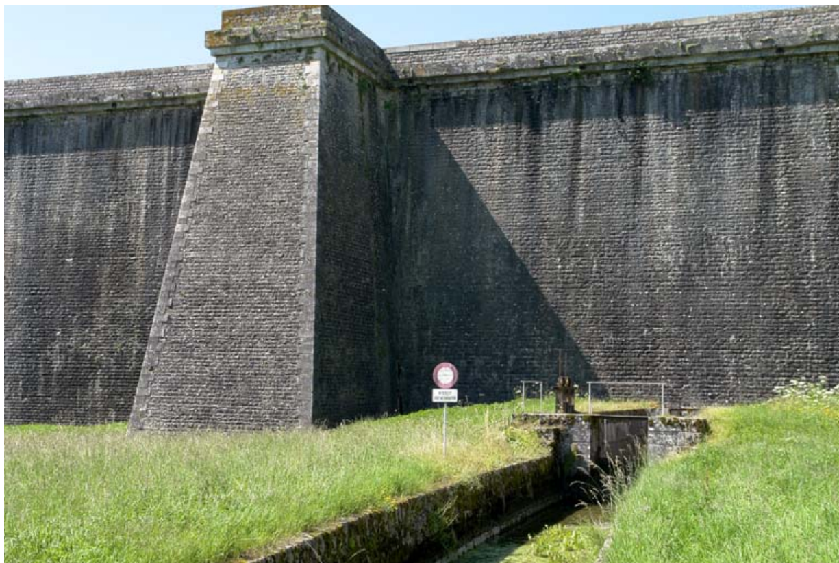
Face avant du barrage avec un contrefort et la rigole d'alimentation du canal. 21, Chazilly, lieudit : Chazilly