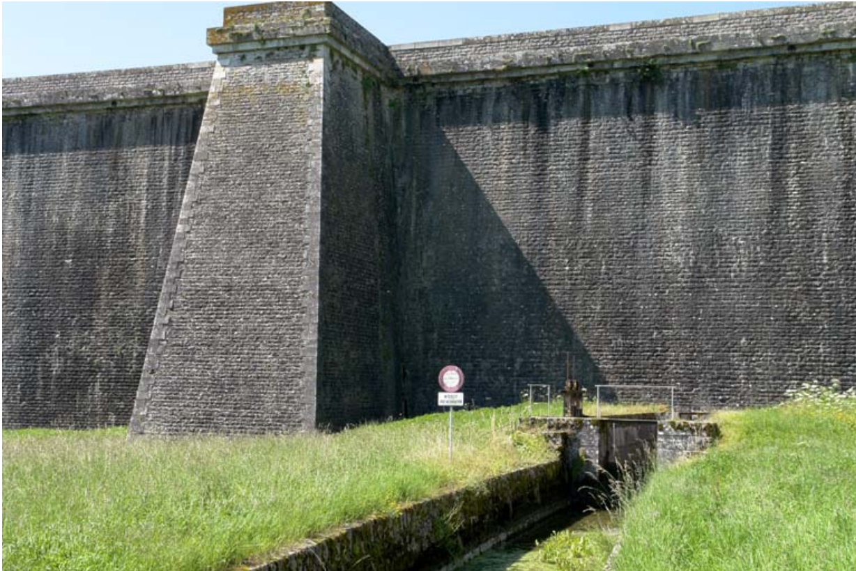
Face avant du barrage avec un contrefort et la rigole d'alimentation du canal.