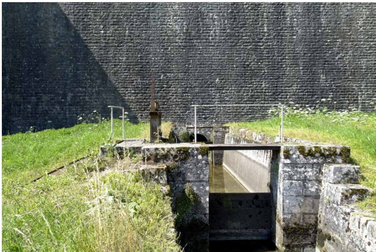
Sortie d'eau au pied du barrage et départ de la rigole d'alimentation du canal. 21, Chazilly, lieudit : Chazilly