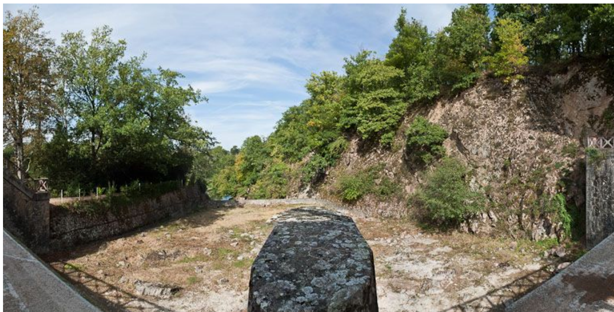
Vue de la rigole de décharge du déversoir.

21, Pont-et-Massène, lieudit : Pont-et-Massène