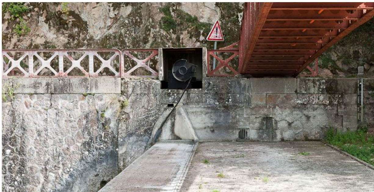
Vue du premier tablier mobile et de la passerelle située au-dessus du déversoir.

21, Pont-et-Massène, lieudit : Pont-et-Massène