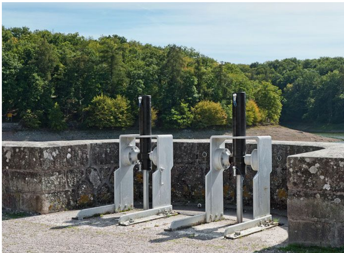
Vue des vannes de la tour de prise d'eau.

21, Pont-et-Massène, lieudit : Pont-et-Massène