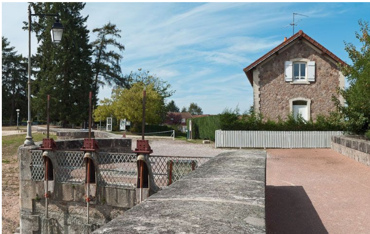
Vue des vannes de la tour de prise d'eau et de la maison de garde.

21, Pont-et-Massène, lieudit : Pont-et-Massène