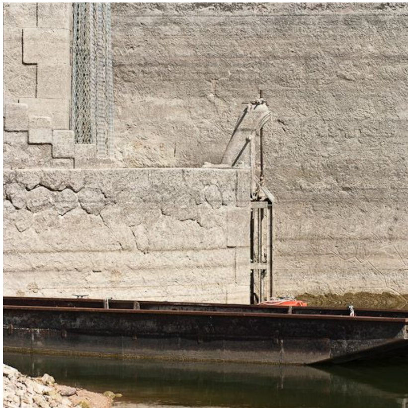
Détail de la vanne de la tour de prise d'eau. 21, Pont-et-Massène, lieudit : Pont-et-Massène

N° de l'illustration : 20112103618NUC2AQ