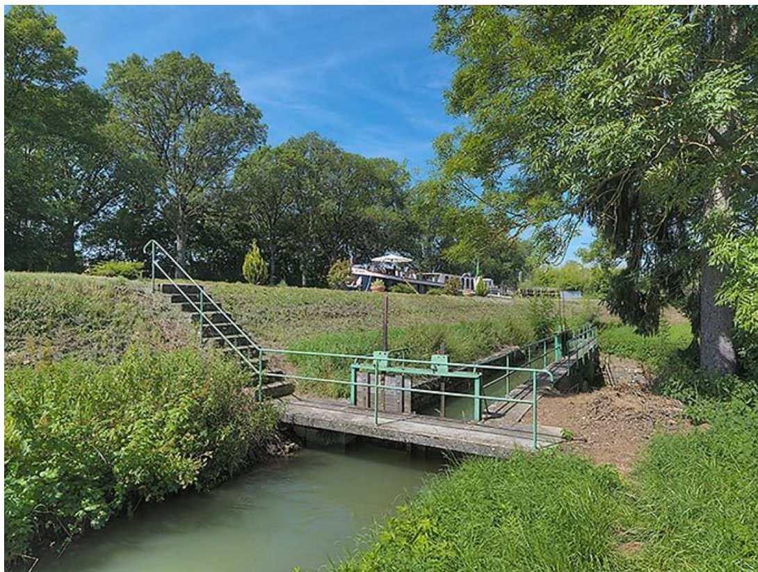
La rigole avec les vannes de régulation. A gauche, le talus du canal.

21, Vandenesse-en-Auxois, lieudit : Panthier