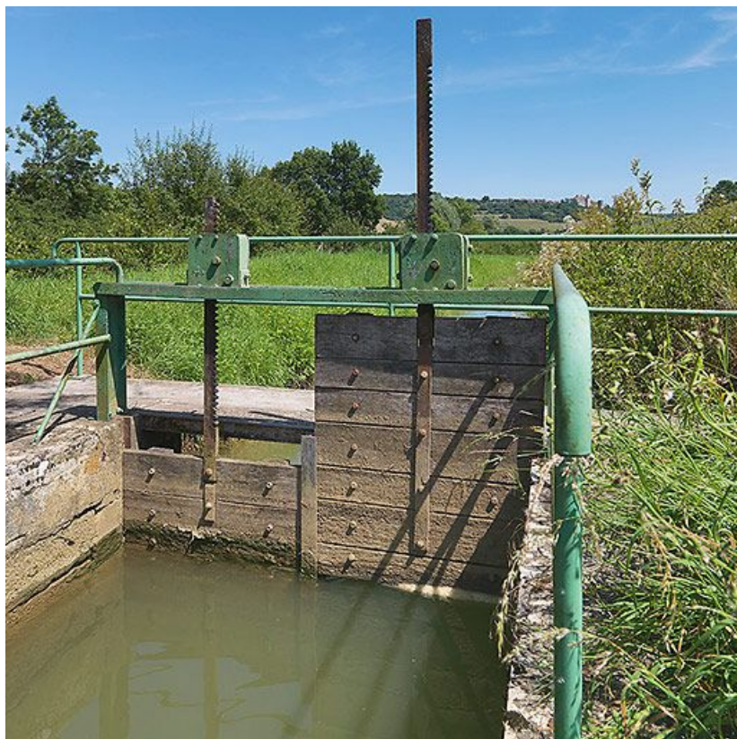
Vannes de régulation sur la rigole.

21, Vandenesse-en-Auxois, lieudit : Panthier