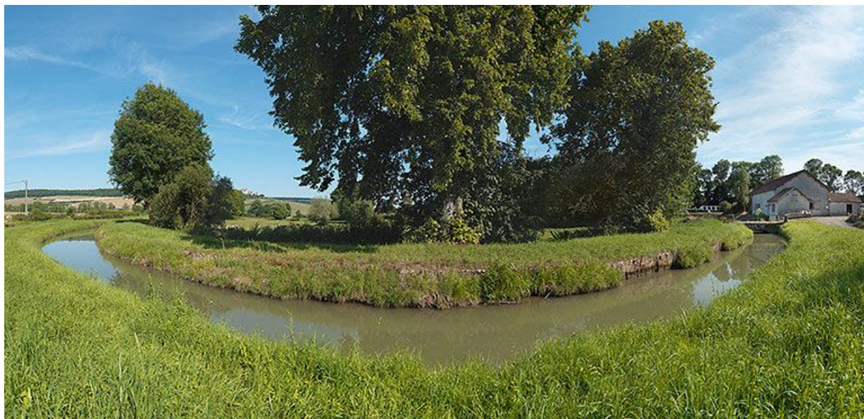
Vue de la rigole à son arrivée vers le canal.

21, Vandenesse-en-Auxois, lieudit : Panthier