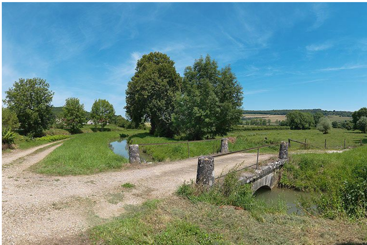
Pont sur la rigole en amont de son arrivée vers le canal.

21, Vandenesse-en-Auxois, lieudit : Panthier