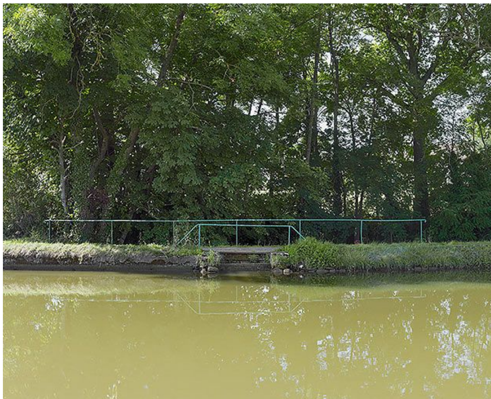
Vue du garde-corps de l'entrée de la Vandenesse sous le canal rive droite.

21, Vandenesse-en-Auxois, lieudit : bief 09 du versant Saône