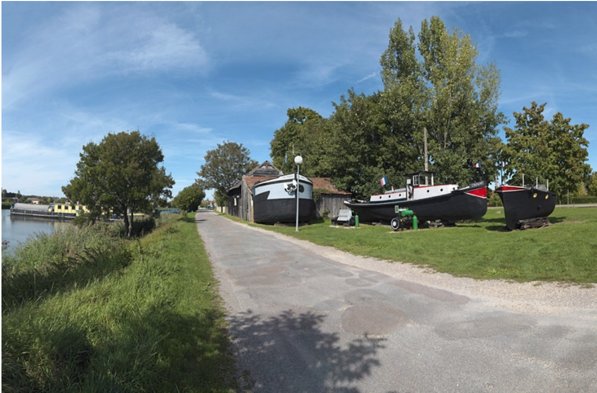
Vue d'ensemble du matériel flottant exposé devant la remise.

21, Saint-Jean-de-Losne, lieudit : bief 76 du versant Saône