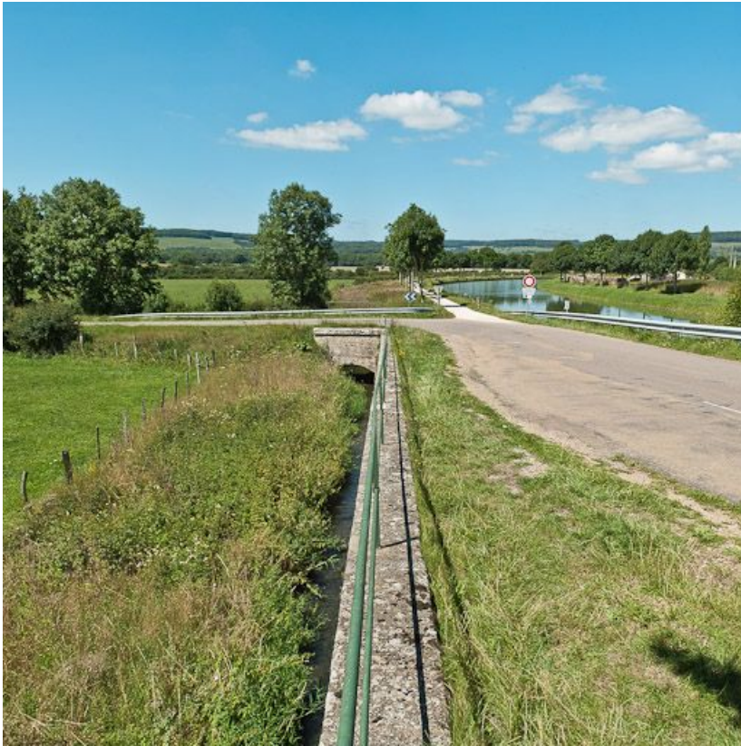
Vue du pont sur rigole.

21, Pouilly-en-Auxois, lieudit : bief 01 du versant Yonne