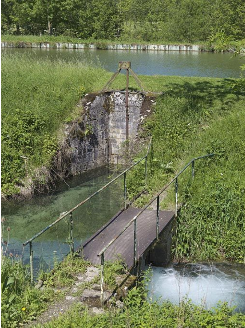
Aqueduc et déversoir régulant l'eau du bief 21.

21, Vevey-sur-Ouche, lieudit : bief 21 du versant Saône