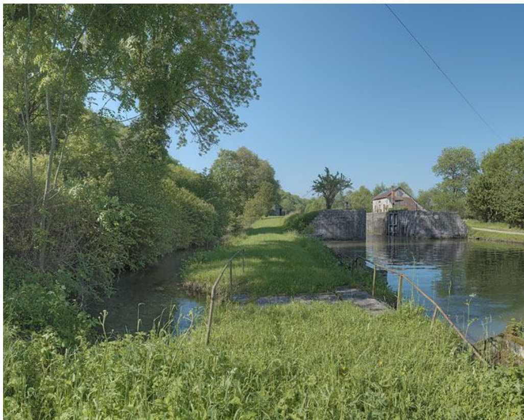
Rive droite : arrivée de la rigole d'alimentation plus en aval dans le bief.

21, Veuve-sur-Ouche, lieudit : bief 21 du versant Saône