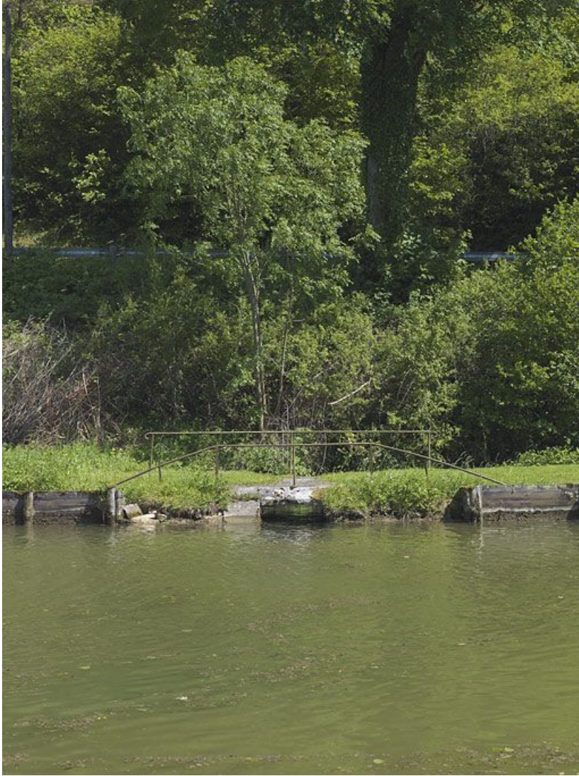
Rive droite : arrivée de la rigole d'alimentation plus en aval dans le bief.

21, Veuve-sur-Ouche, lieudit : bief 21 du versant Saône