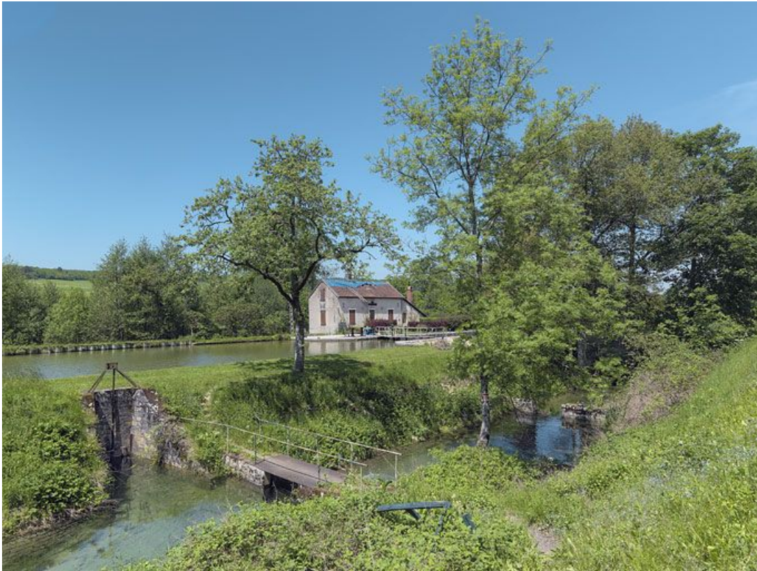
Rigole et déversoir régulant l'eau du bief 21 au premier plan, site d'écluse 21 à l'arrière-plan. 21, Veuvey-sur-Ouche, lieudit : bief 21 du versant Saône