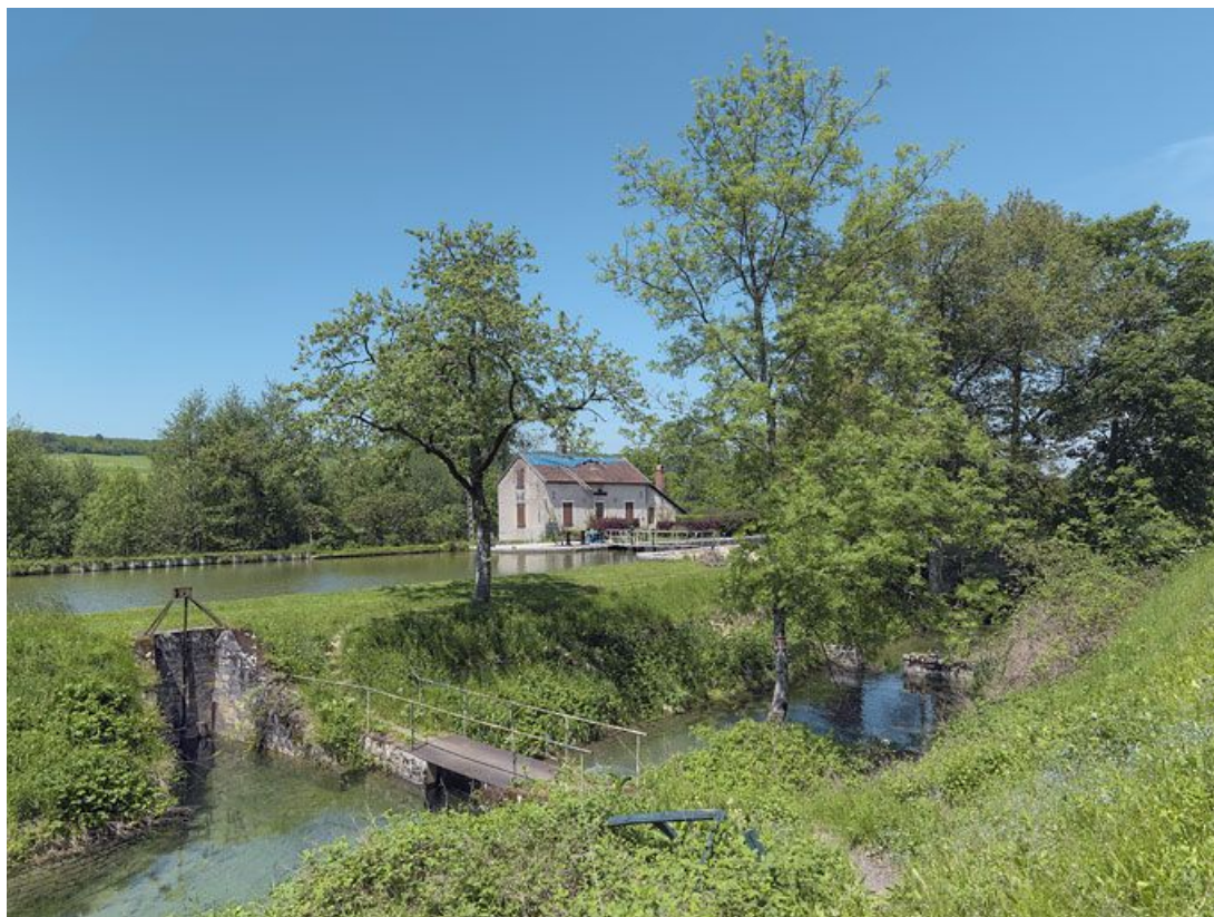
Rigole et déversoir régulant l'eau du bief 21 au premier plan, site d'écluse 21 à l'arrière-plan. 21, Veuve-sur-Ouche, lieu dit : bief 21 du versant Saône