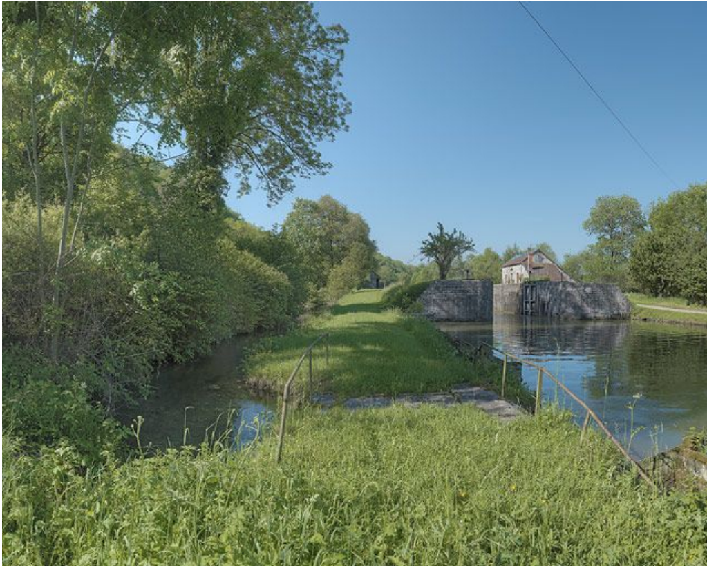
Rive droite : arrivée de la rigole d'alimentation plus en aval dans le bief.

21, Veuve-sur-Ouche, lieudit : bief 21 du versant Saône