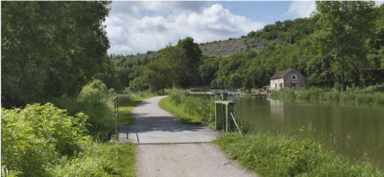
Déversoir rive gauche, à l'arrière-plan, le site d'écluse 19.

21, Crugey, lieudit : bief 19 du versant Saône