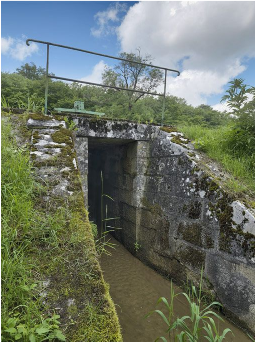
Déversoir rive gauche : sortie du déversoir.

21, Crugey, lieudit : bief 19 du versant Saône