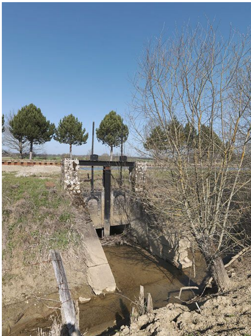
L'aqueduc-déversoir avec ses vannes passant sous le canal en amont du site d'écluse 16. 21, Charigny, lieudit : bief 16 du versant Yonne