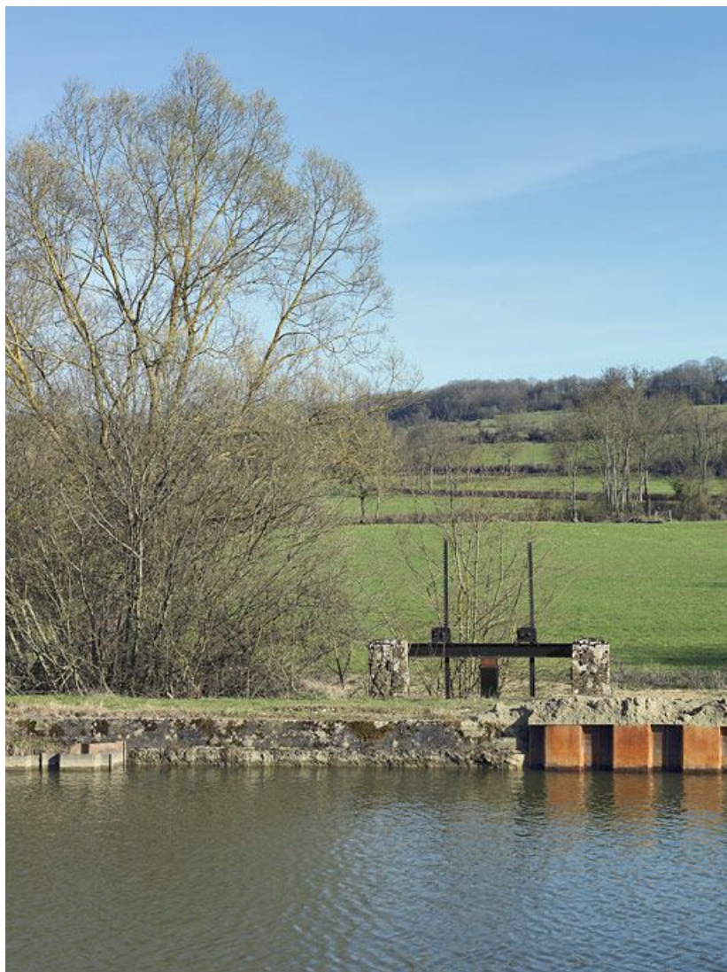
L'aqueduc-déversoir avec ses vannes passant sous le canal en amont du site d'écluse 16. 21, Charigny, lieudit : bief 16 du versant Yonne